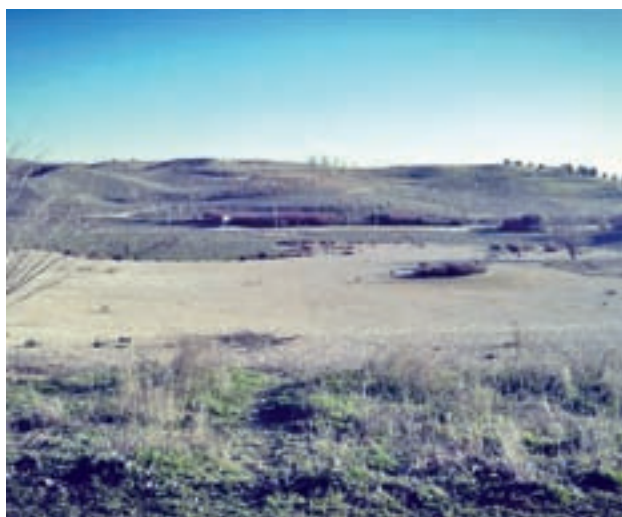
Estado actual del entorno natural del Ensanche

El Pleno de la Junta Municipal de enero aprobó por unanimidad una iniciativa de Ciudadanos para solicitar que los contenedores que se repongan sean de un material anti actos vandálicos.