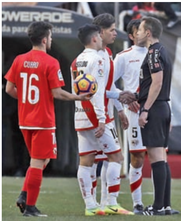
El Rayo empató con el Sevilla Atlético

Más allá de la trascendencia de los tres puntos en juego, las horas previas al choque han estado marcadas por varios