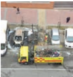
Un contenedor quemado

El Ayuntamiento hizo una demostración el 17 de enero de que la línea exprés E4 de la EMT (Pavones-Avenida Felipe II) es más rápida que el coche, el Metro o la bicicleta en realizar este trayecto.