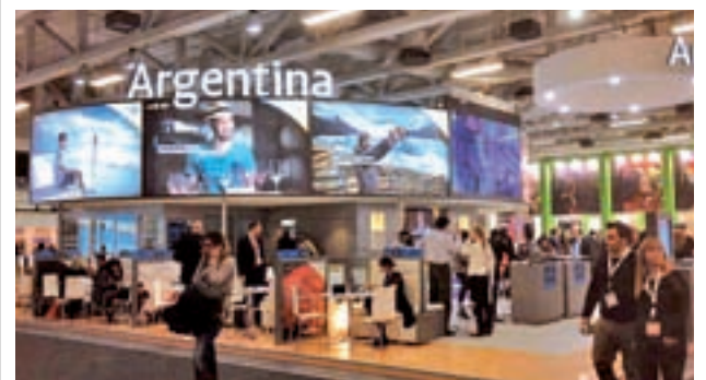
Stand de Argentina en la edición pasada de Fatur

España recibe más de 6,2 millones de turistas LGBT al año, que generan ingresos de más de 6.300 millones, casi un 40% más que el turismo de negocios.