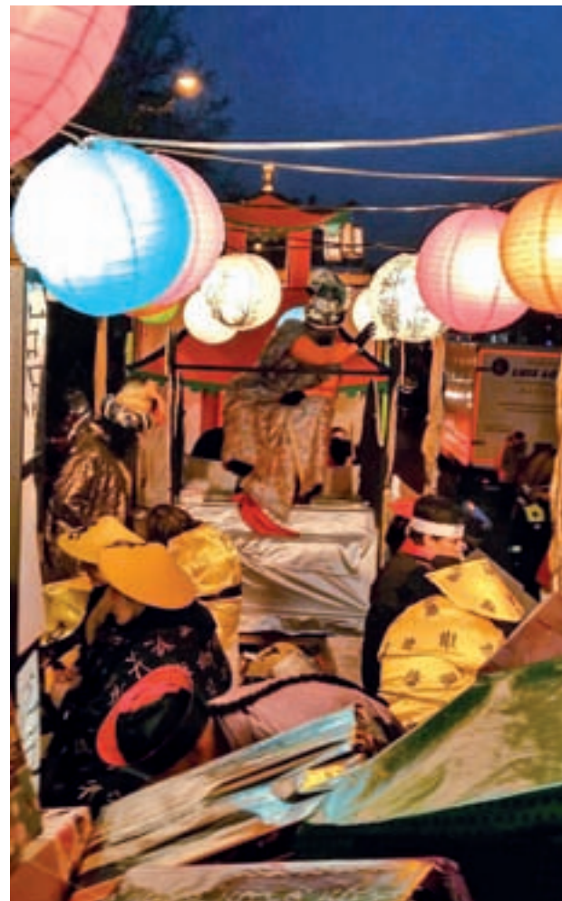
Administración y vecinos colaboran ya en las cabalgatas

Además, el texto aborda otras cuestiones como “un