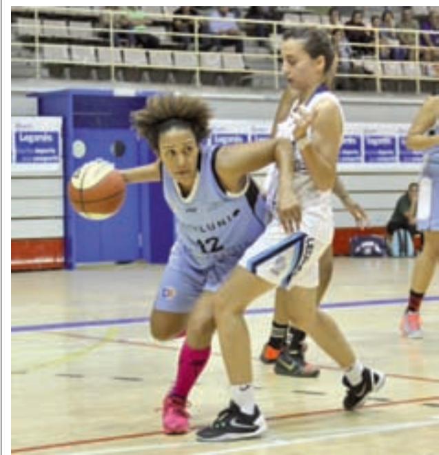
El Distrito Olímpico ya es tercero FBM.ES

Este domingo (11:15 horas), el cuadro morataleño intentará olvidar ese tropiezo con el aliento de sus aficionados, ya que jugará como local. En esta ocasión su rival será el Sporting Hortaleza, un conjunto muy necesitado.