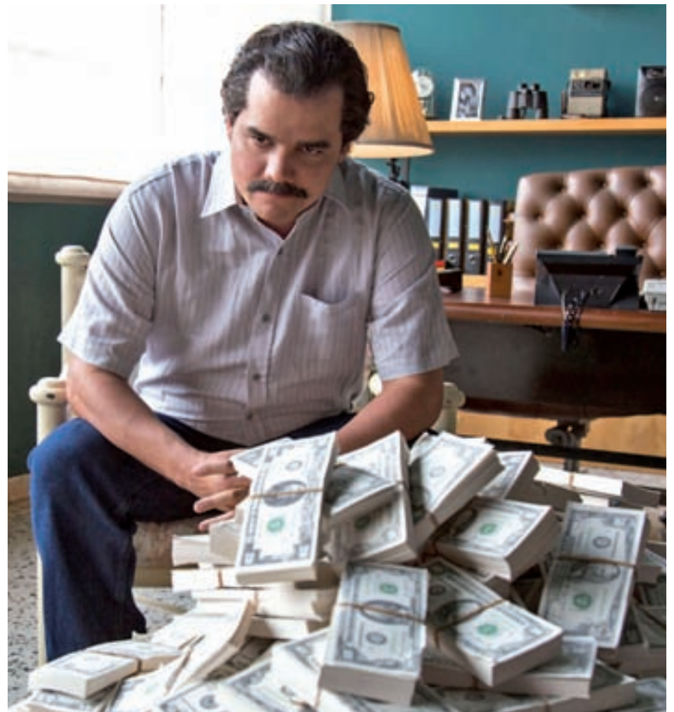
Narcos: Con dos temporadas ya en su haber, y renovada al menos para dos temporadas más, la serie continuará retratando el mundo de los carteles de la droga colombianos siguiendo ahora por el de Cali. Algunos de los nombres que se incorporan al reparto en la nueva temporada son los españoles Javier Cámara y Miguel Ángel Silvestre.

En cuanto a 'House of cards', otra de sus series estrella, la compañía ha anunciado que el estreno de la quinta temporada se retrasa al segundo trimestre. El objetivo es elevar su margen de operaciones durante los próximos cur-