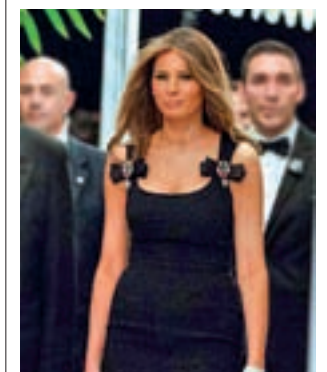
Fiesta de fin de año: Sencillo vestido negro con apliques decorativos en los tirantes de Dolce & Gabbana