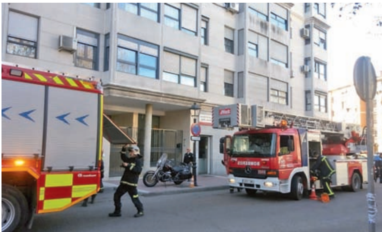
Una de las sedes de los juzgados, el día del incendio