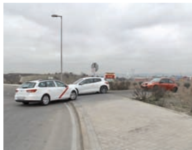
La zona a reformar

Por ello han considerado necesario realizar esta reforma y adecuar el trazado para que los vehículos puedan circular sin problemas. Según el Ayuntamiento el reacondicionamiento se va a llevar a cabo como respuesta a una petición de la ciudadanía, ya que han sido los argandenses los que han demandado que se produzca esta reforma. El departamento de Obras Públicas está estudiando la viabilidad del proyecto antes de empezar a ejecutarlo.