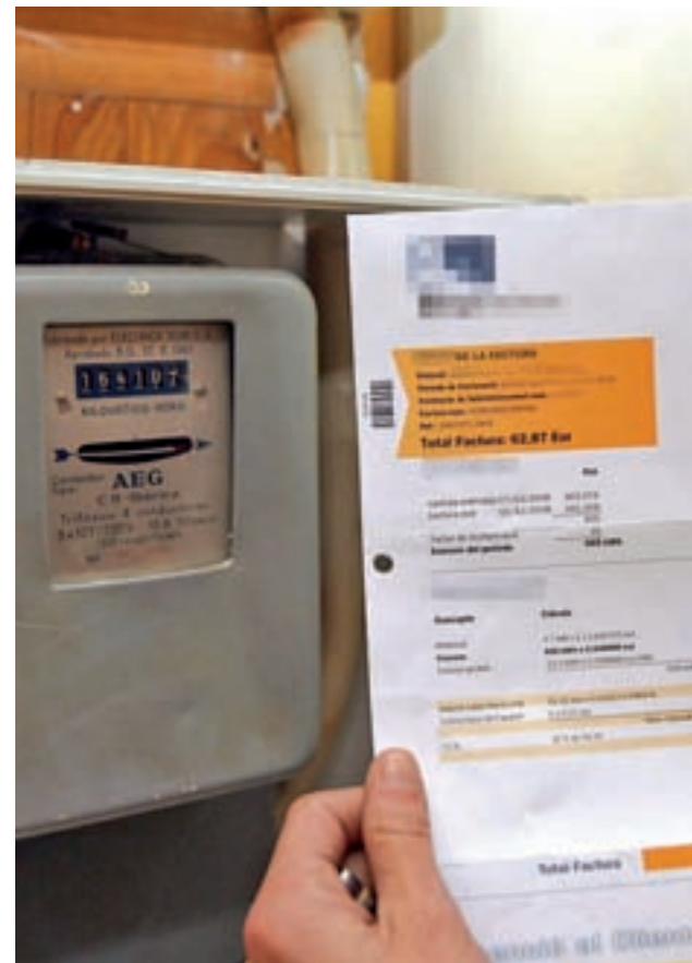
Una factura de la luz

Para revertir esta situación, los partidos de la oposición han solicitado la elaboración de una auditoría de los costes energéticos del sistema y una reforma del sistema tarifario actual. En esa línea, la Fiscalía de lo Civil del Tribunal Supremo ha abierto diligencias de investigación para averiguar las razones de los sucesivos aumentos de precio.