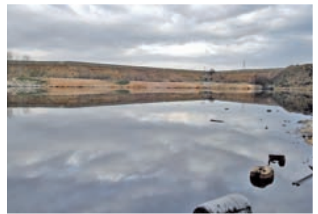
La limpieza de la 'Laguna Negra' continuará en 2017

El Plan de Inversiones destinará la mayoría de su presupuesto a impulsar la economía, por ejemplo, se quiere promover el Eje del Sureste, compuesto por 20 municipios y en el que viven alrededor de 180.000 personas.