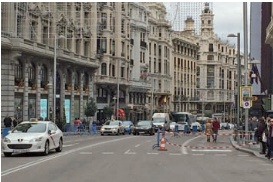
Cortes en Gran Vía la pasada Navidad