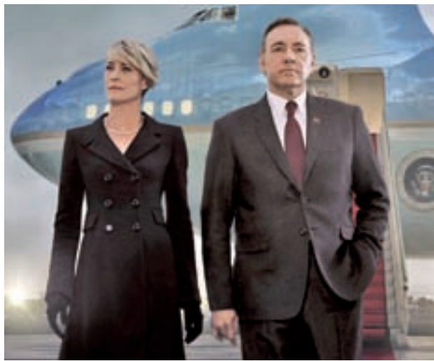
House of Cards: El estreno de la quinta temporada se retrasará hasta el segundo trimestre del año, concretamente verá la luz el 30 de mayo. A pesar del pequeño adelanto en redes, cómo será la nueva temporada es aún un misterio.