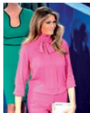
Debate presidencial: Blusa brillante 'Pussy bow' de crepe de seda y pantalón a conjunto de Gucci.