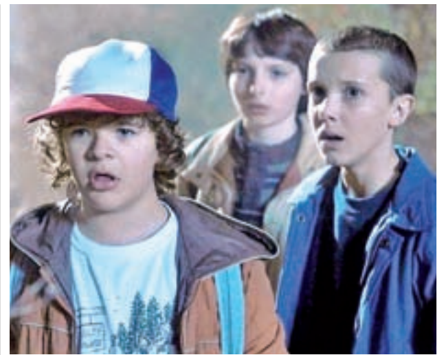
Stranger Things: Los guionistas y creadores de la serie, Matt y Ross Duffer, regresarán para una segunda temporada que estará compuesta por nueve episodios y cuyos acontecimientos se desarrollarán en 1984.