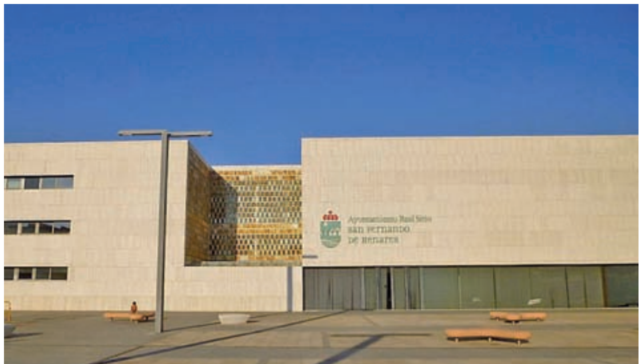
Ayuntamiento de San Fernando