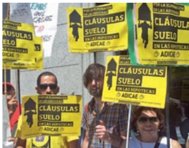
Protesta de los afectados

En concreto, la nueva norma establece una vía extrajudicial para solicitar las cantidades cobradas de más en