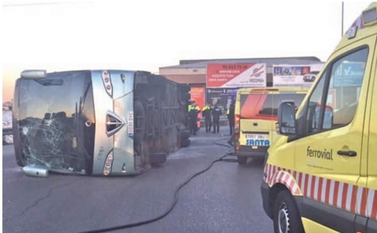
El autobús volcó al tomar una rotonda EMERGENCIAS COMUNIDAD DE MADRID

acusado de un delito de conducción bajo la influencia de drogas, aunque horas después la juez de Instrucción número 1 de Fuenlabrada acordó su puesta en libertad, con la retirada del carné de conducir y de su licencia de conductor profesional como