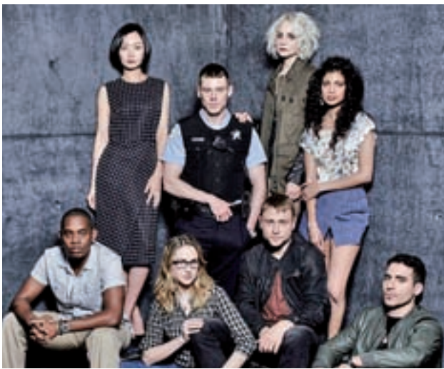
Sense8: Será el próximo 5 de mayo cuando la nueva entrega, que consta de 10 episodios, se estrene en Netflix. La historia continuará a raíz de los eventos del final de la primera temporada cuando los protagonistas escapan de Whispers.