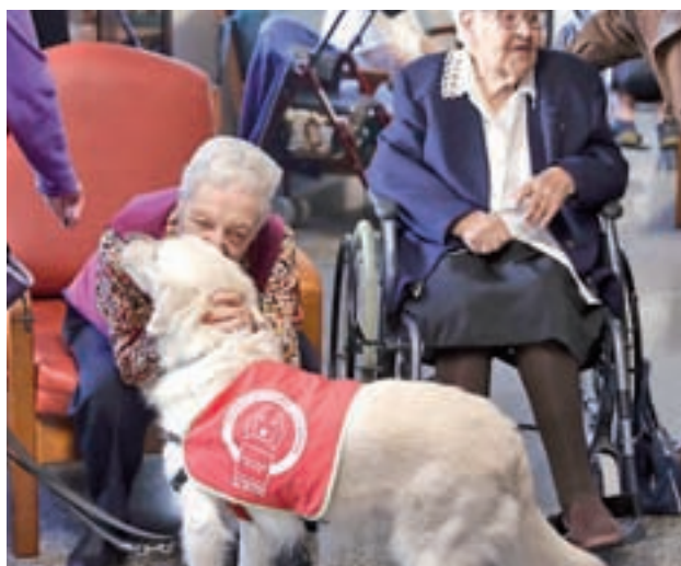
Uno de los perros que participan en la iniciativa