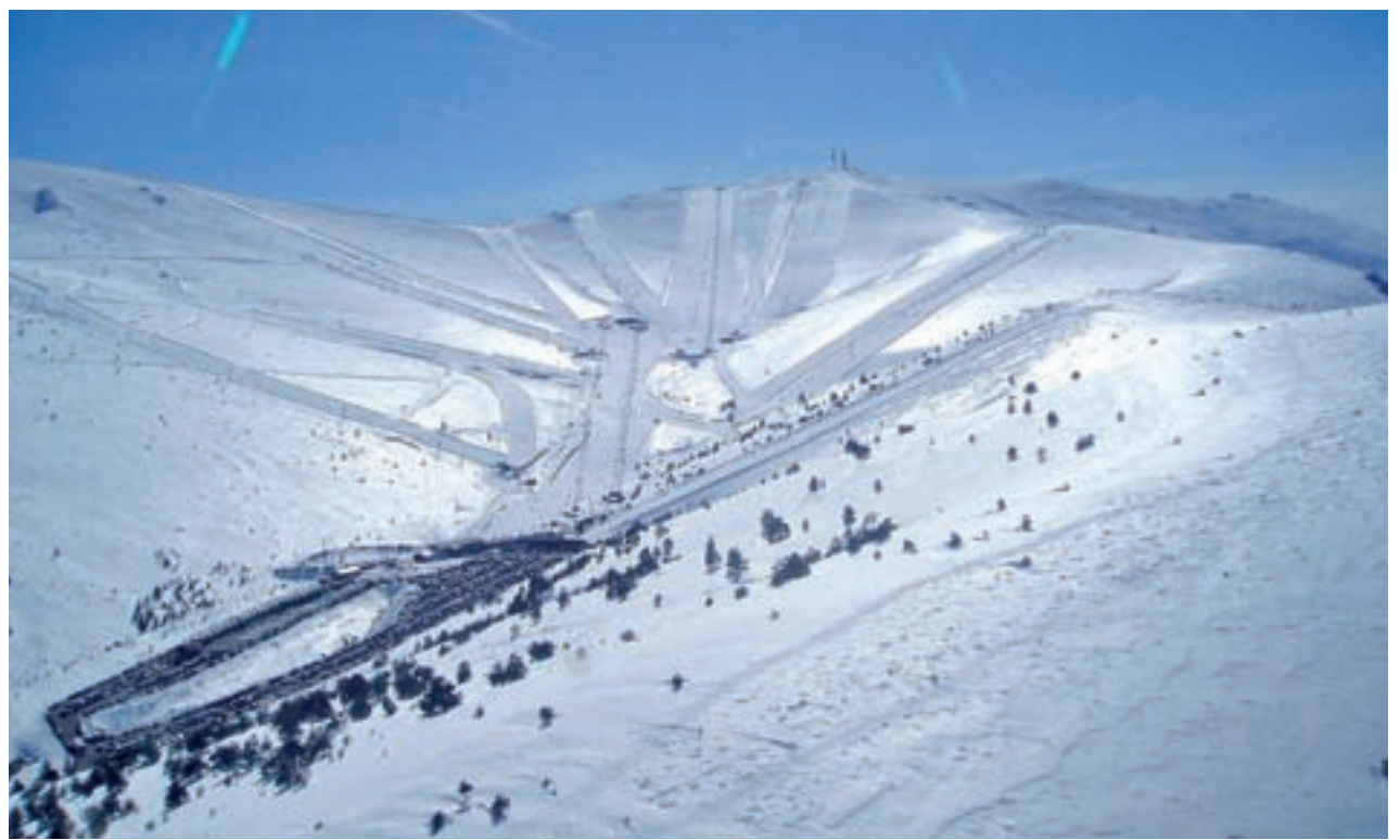
La Bola del Mundo al fondo, en la estación de Valdesquí

VALDESQUÍ TIENE ACTUALMENTE UN TOTAL DE 15 KILÓMETROS ESQUIABLES