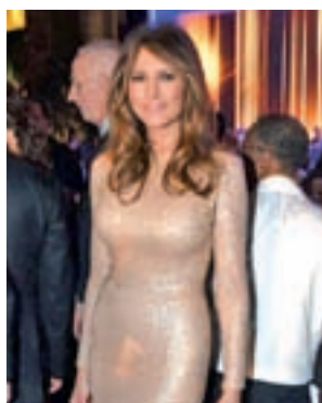
Cena de gala: Vestido de lentejuelas dorado, largo y entallado del diseñador libanés Reem Acra.