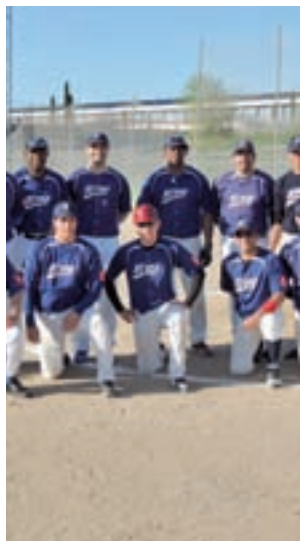
CBS Béisbol

El CSB Rivas no juega en la categoría que debería. Actualmente está compitiendo en Primera División, pero puesto que ha ganado esta competición en seis ocasiones consecutivas, tendrían que estar jugando en la División de Honor, la máxima dentro de este deporte. El motivo es que el campo no está adaptado, tal y como dicta el reglamento, para que puedan disputar la competición que se merecen, ya que en lugar del campo de tierra que