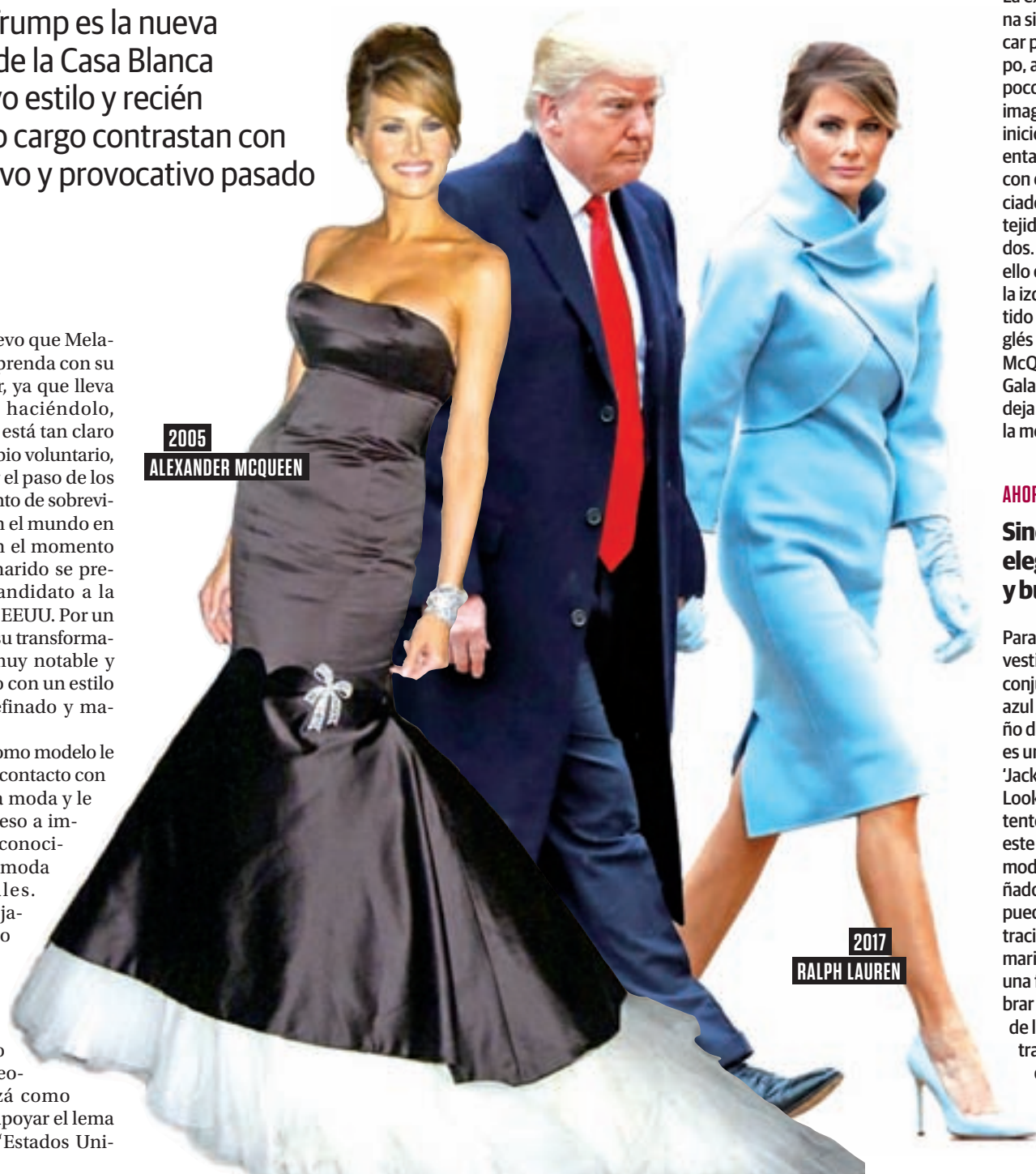
2005 ALEXANDER MCQUEEN

Su últimos estilismos han sido muy comentados, sobre todo la elección de su vestido para la investidura. Todo el mundo de la moda estaba expectante con el look que llevaría la primera dama, ya que muchos diseñadores habían dado el "no" rotundo a vestirla por la ideología de su marido. Mientras algunos como Dolce & Gabbana aceptaron trajectar a la posible primera dama por "ser su trabajo", otros como Sophie Theallet se negaron por los mensajes en los que Donald Trump basó su campaña electoral. Por unos motivos u otros sus trajes dan mucho de qué hablar.