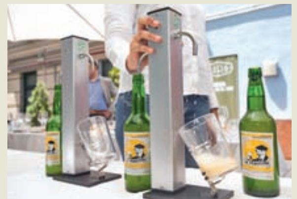
Escanciadores eléctricos de la sidra 'La Penúltima'