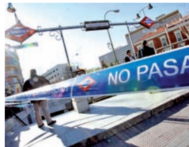
La estación de Carabanchel será una de las afectadas

La previsión del Gobierno regional es que la Línea 8 se vuelva a abrir al público el próximo 18 de abril. Hasta entonces, habrá un servicio alternativo de autobuses.