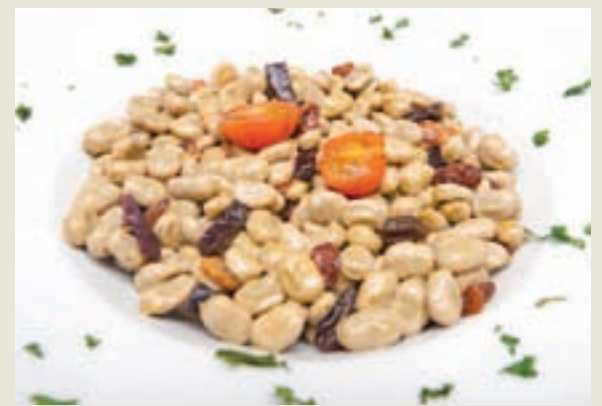
Habas con cecina