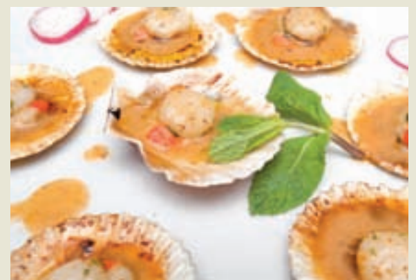
Volandeiras gallegas en salsa de oricos