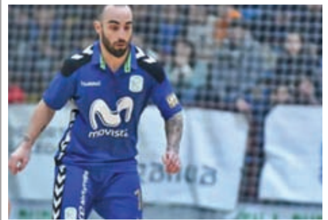
El futuro del Movistar Inter, en el aire

El conjunto de Torrejón salió perdedor de su encuentro ante el Denia Futsal. Así, los alicantinos siguen invictos en esta competición.