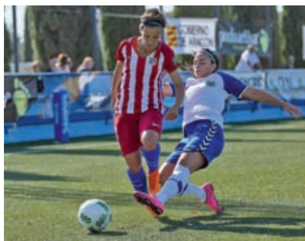
Imagen del partido de la primera vuelta

Primera División Femenina retoma su actividad este fin de semana con la celebración de la decimoséptima jornada. En ella, el líder, el Atlético de