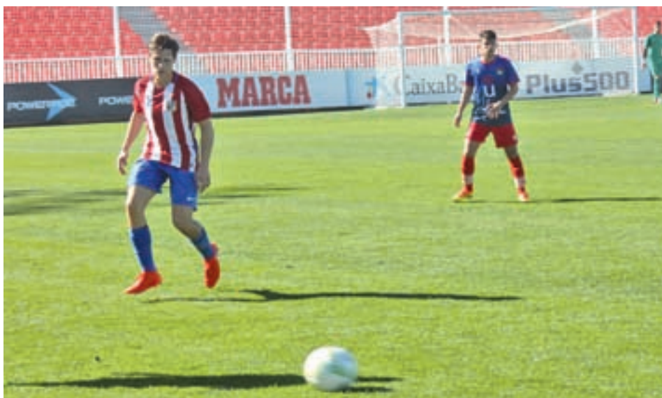
El filial rojiblanco, próximo rival del Unión Adarve