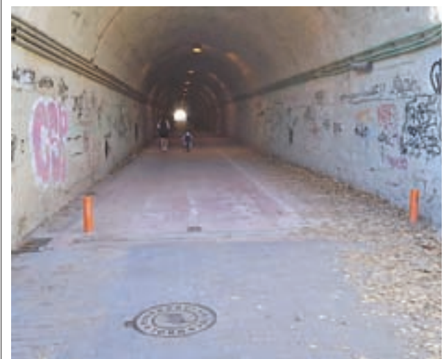
El paso por debajo de las vías del tren

“Si se sigue trabajando como hasta ahora la asociación tiene que facturar como una empresa, darse de alta en el IAE (Impuesto de Actividades Económicas) para, por ejemplo, conseguir que se les pague la pintura que ha utilizado para organizar un evento”, concluye.