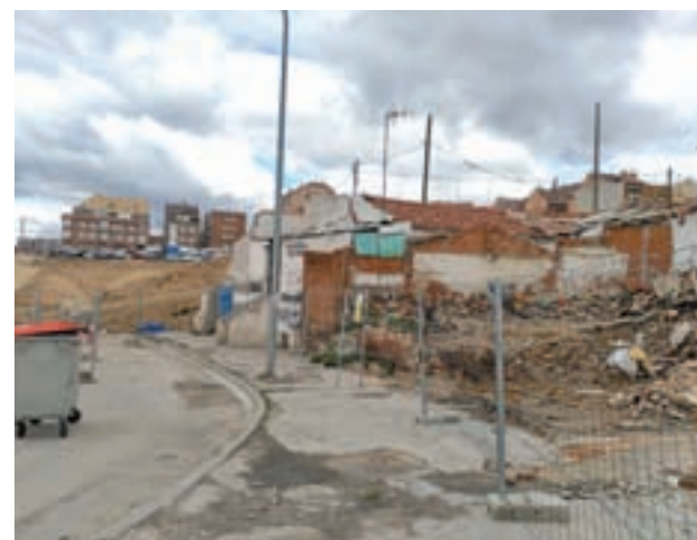
Uno de los espacios de la zona afectada

Podrán acceder a estos fondos los expropiados con derecho a realojo que ya se encuentran viviendo en el