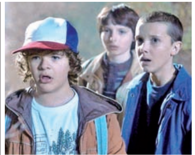
Stranger Things: Los guionistas y creadores de la serie, Matt y Ross Duffer, regresarán para una segunda temporada que estará compuesta por nueve episodios y cuyos acontecimientos se desarrollarán en 1984.