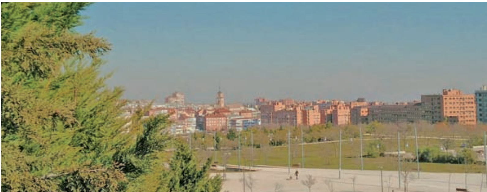
Una imagen del cielo del distrito de Vicálvaro