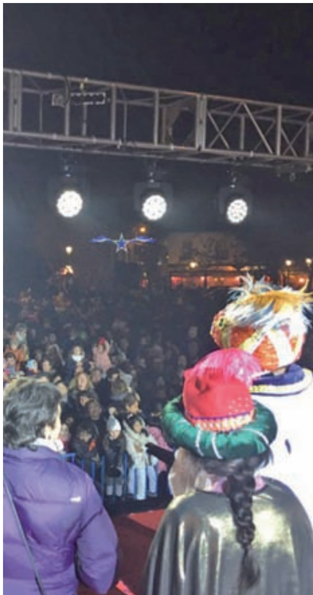
Muchas fiestas de barrio son organizadas por empresas

“Será muy importante porque se nos dejará de tratar a las asociaciones como si no fuéramos una empresa, algo que no somos”, explica. “Por un lado se promocionará la actividad de la propia ciudadanía