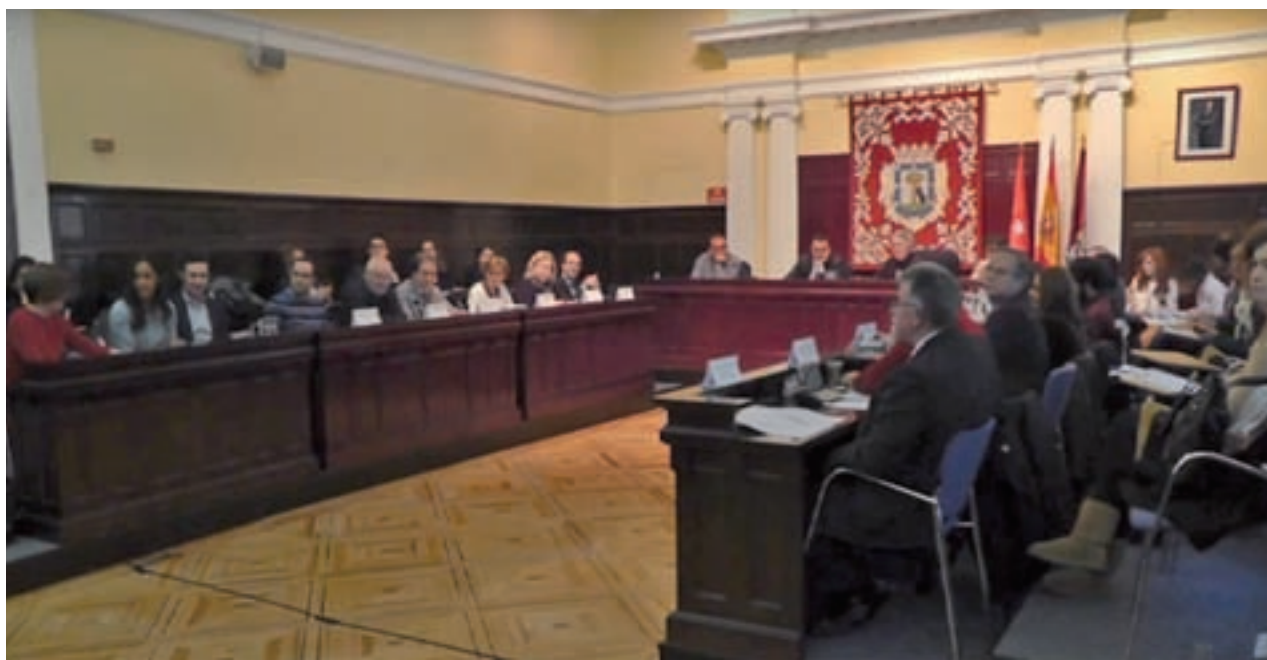
Un momento de la sesión extraordinaria celebrada el pasado lunes 23 de enero

La Asociación de Vecinos Valle-Inclán de Prosperidad organiza este sábado 28 de enero un paseo para detectar problemas para la movilidad y accesibilidad, y, de paso, valorar la calidad estancial de las calles y espacios públicos de su barrio. La salida, a las 11 horas en el Parque de Berlín.