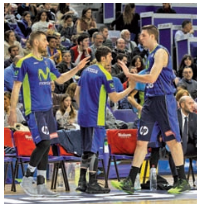
El Estudiantes se impuso al Bilbao Basket

Por su parte, el Real Madrid no tendrá compromiso liguero este fin de semana, por lo que los jugadores de Pablo Laso podrán recuperarse del notable esfuerzo de las últimas semanas. Eso sí, antes de ese descanso, el cuadro blanco deberá jugar un nuevo choque correspondiente a la fase de grupos de la Euroliga, una competición en la que podría encarrilar su pase a cuartos en el caso de ganar al Milán este viernes.