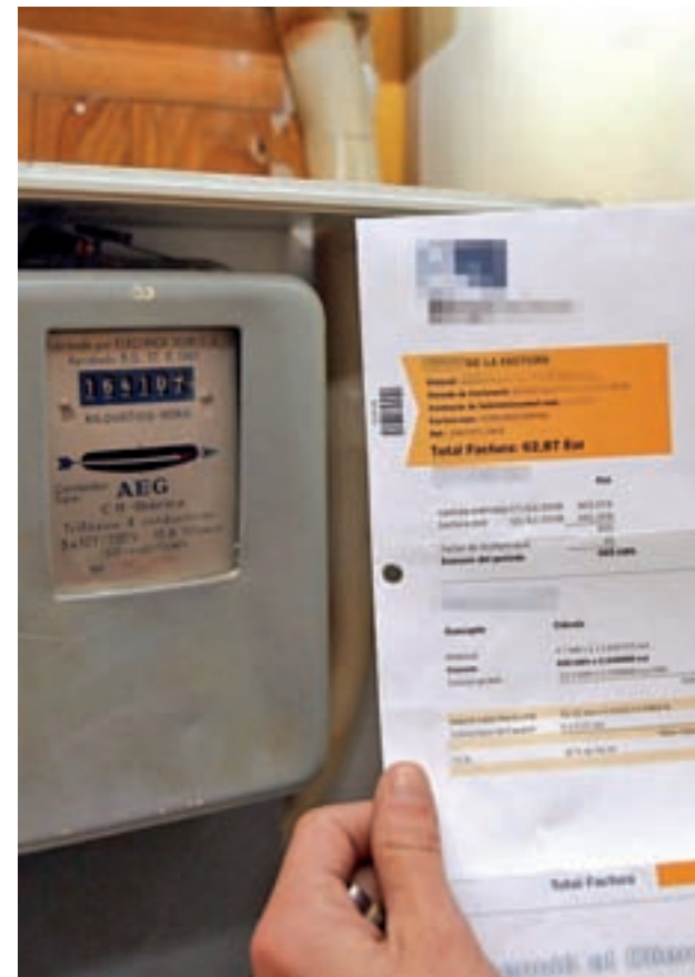
Una factura de la luz

Para revertir esta situación, los partidos de la oposición han solicitado la elaboración de una auditoría de los costes energéticos del sistema y una reforma del sistema tarifario actual. En esa línea, la Fiscalía de lo Civil del Tribunal Supremo ha abierto diligencias de investigación para averiguar las razones de los sucesivos aumentos de precio.