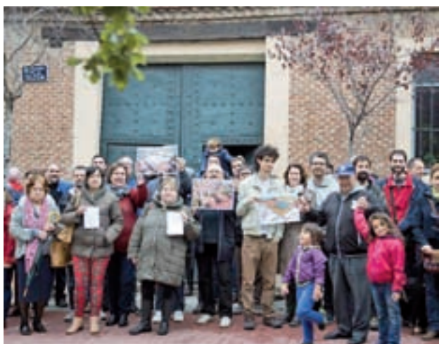
La protesta ciudadana del pasado mes de noviembre