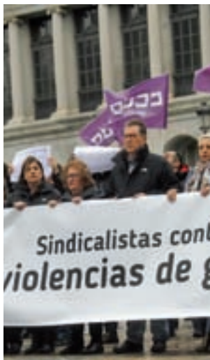
Protesta contra la violencia