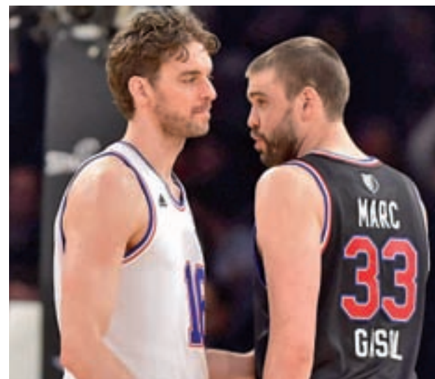
Pau y Marc Gasol

Pero antes de ver en acción a los Stephen Curry, LeBron James y compañía, el 'All-Star Weekend' ofrece una programación muy completa, empezando con un partido entre novatos y jugadores de segundo año que ya