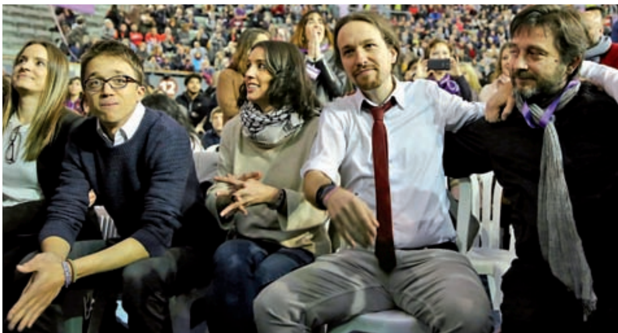
Íñigo Errejón y Pablo Iglesias, durante Vistalegre II