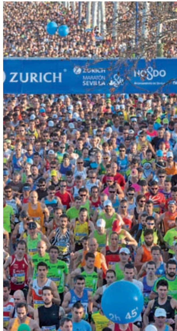
Imagen de la edición del año pasado

Para que la fiesta sea completa, se espera que los corredores estén arropados por numerosos aficionados en las distintas calles de la capital hispalense, ya que todo hace indicar que la climatología no arruinará esta gran jornada deportiva. Al cierre de estas líneas, las previsiones meteorológicas cifraban en un 10% las posibilidades de llu-