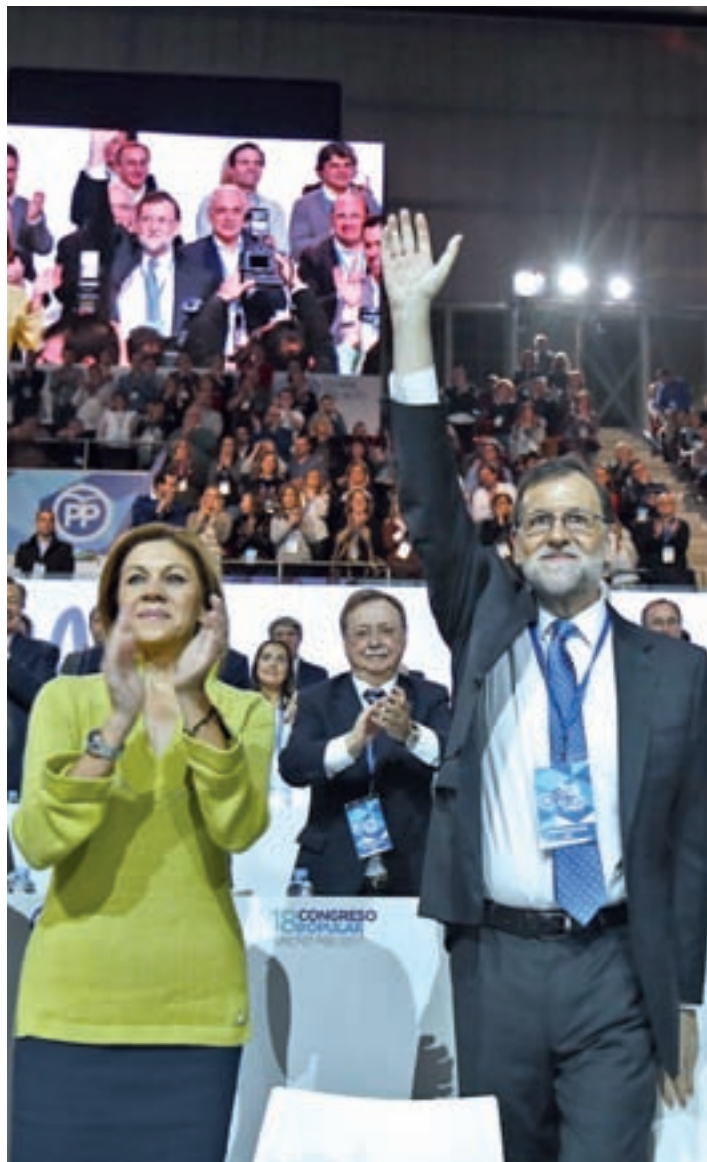
María Dolores de Cospedal junto a Mariano Rajoy

Sin embargo, la cita congresual no se libró de momentos de tensión, como la votación de la enmienda para evitar la acumulación de cargos y que no salió adelante por tan sólo