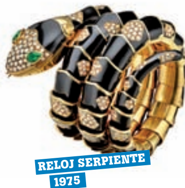
RELOJ SERPIENTE 1975