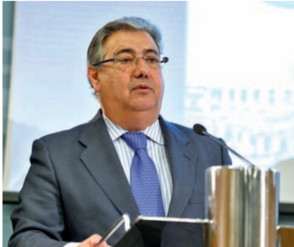
Juan Ignacio Zoido, ministro del Interior

No obstante, el ministro añadió que su equipo no se conforma y que va a "profundizar" en la mejora de la seguridad de los ciudadanos.