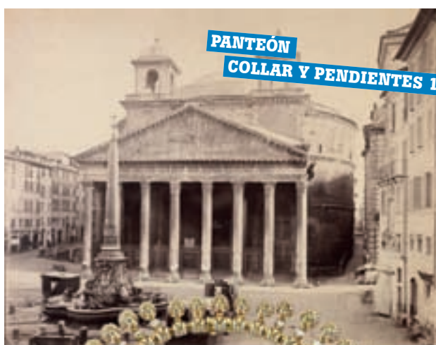
PANTEÓN COLLAR Y PENDIENTES 1992