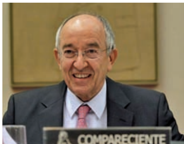
Fernández Ordóñez, exgobernador del Banco de España

del Banco de España (BdE) y la Comisión Nacional del Mercado de Valores (CNMV) que tenían bajo su competencia la supervisión de BFA-Bankia en el momento de su constitución y posterior salida a bolsa. Entre ellos destaca el exgobernador de la entidad, Miguel Ángel Fernández Ordóñez, y el expresidente del organismo regulador, Julio Segura.