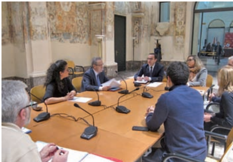
Reunión de la comisión sobre los deberes escolares

En cuanto a lo más cercano, se incorporan las posibilidades de Benidorm en tren de alta velocidad, Costa Cantábrica, Andorra-Lourdes y Pirineo Catalán y Gran Canaria, y se mantienen Marbella, Oropesa con balneario, Galicia, Huelva, Costa de Almería, Pueblos Blancos, Peñíscola, Sevilla-Granada, Extremadura-Portugal y las tres rutas que permiten descubrir Castilla y León.