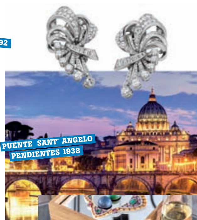
PUENTE SANT'ANGELO PENDIENTES 1938