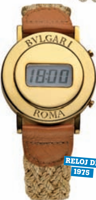
RELOJ DE ORO 1975