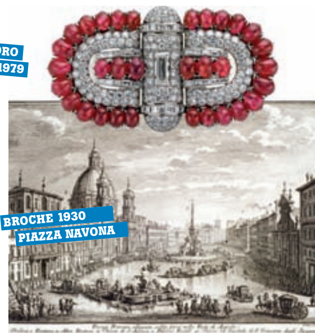
BROCHE 1930 PIAZZA NAVONA