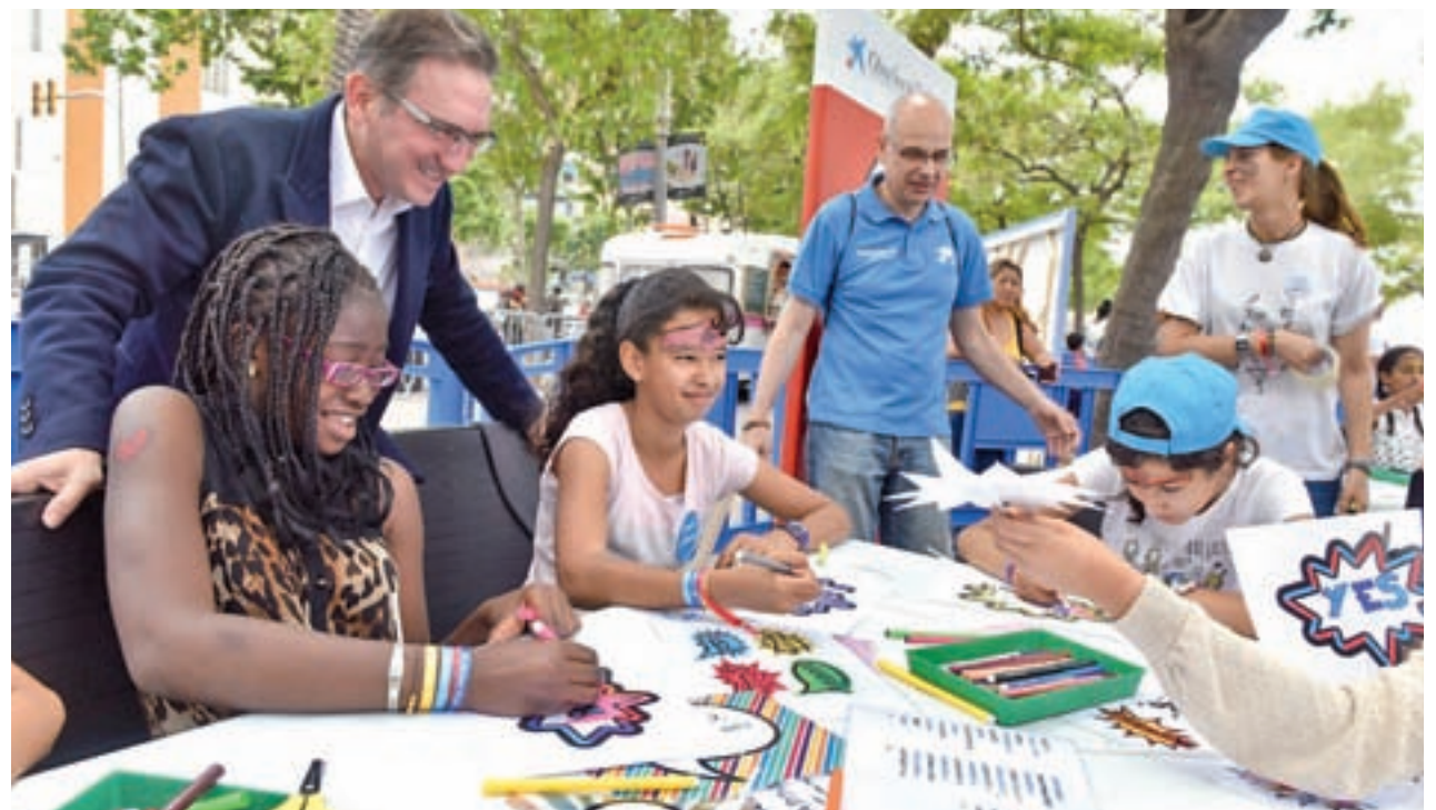
Jaume Giró, director general de la Fundación Bancaria 'la Caixa', en una de las actividades con voluntarios

Entre las acciones impulsadas se encuentran la promoción del deporte y la cultura entre la infancia en riesgo de exclusión social o con discapacidad; el apoyo a menores hospitalizados y sus familias; medidas solidarias a favor de las personas en situación de pobreza, como por ejemplo recogidas de alimentos; el voluntariado internacional; la reinserción social de colectivos que se encuentran en circunstancias difíciles; y las acciones de protección y mantenimiento del medio ambiente.