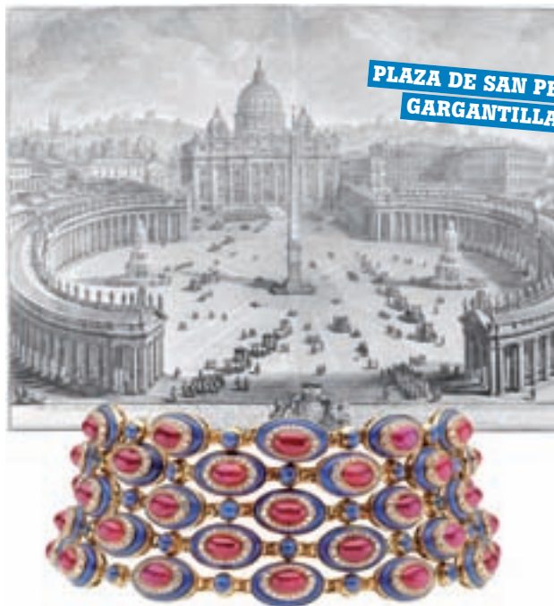
PLAZA DE SAN PEDRO GARGANTILLA 1979

En el Panteón, la escalinata de la Plaza de España, el Coliseo y los obeliscos también ha puesto la firma su mirada a lo largo de su historia, que comenzó en 1884. El éxito de esta exposición deja claro que sigue despertando mucho interés 133 años después.