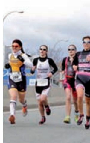
VI edición de la carrera

mo 5 de marzo para conmemorar esa efeméride, que se celebra el día 8, con el fin de promover el deporte y, al mismo tiempo, concienciar a la