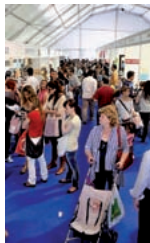
Del 2 al 4 de marzo

comercio Alcostock. El Consistorio ya ha abierto el plazo de inscripción para que los comercios interesados se inscriban para participar en la campaña. La iniciativa, denominada ‘Alcostock, en tu tienda habitual’, invita a las