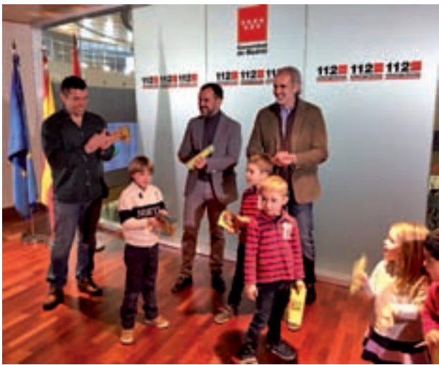
Acción divulgativa del 112