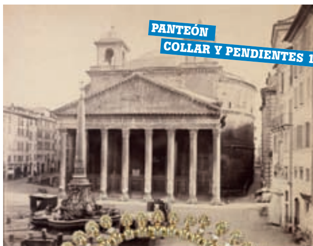
PANTEÓN COLLAR Y PENDIENTES 1992