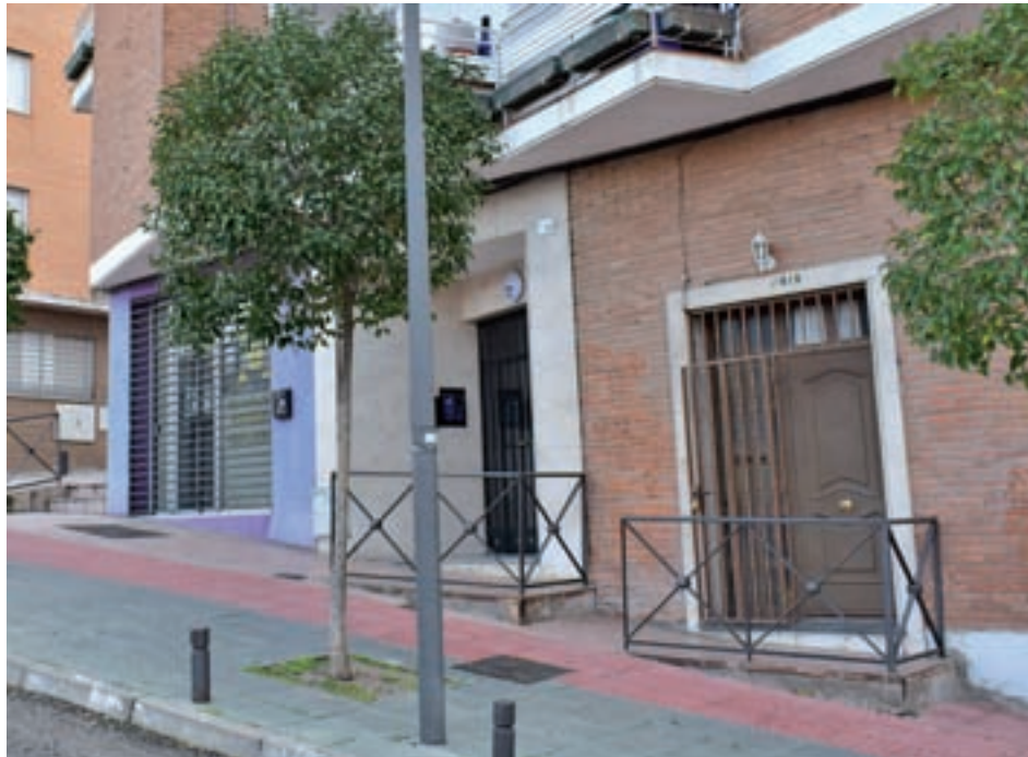
La calle Navarra, en las inmediaciones del parque de Cataluña, donde se produjo el asesinato

Por su parte, los robos con fuerza en domicilios se mantienen en 168 y los hurtos han