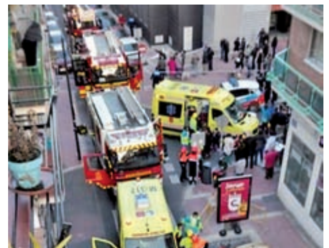
La explosión afectó a todo el bloque de viviendas

El PP ha manifestado que los afectados por la explosión están denunciando "la falta de atención del Ayuntamiento a la hora de asesorarles sobre cómo afrontar una situación que nunca jamás pensaron que iban a vivir".