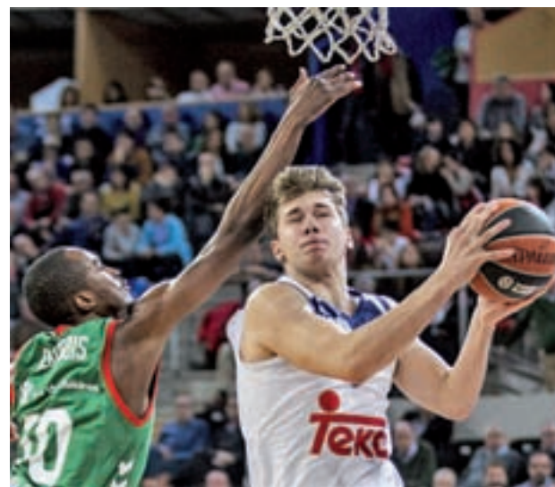
Luka Doncic, en el punto de mira

La Copa arrancó este jueves con los encuentros Baskonia-Iberostar Tenerife y Real Madrid-MoraBanc Andorra, pero la atención crecerá con el paso de los días. Este viernes se completan los cuartos de final con los choques Valencia Basket-Herbalife Gran Canaria (19 horas) y FCBarcelona Lassa-Unicaja, de los que saldrá una de las semifinales del sábado. La gran final se disputará este domingo 19 a partir de las 18:30 horas. Para los aficionados