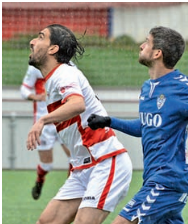
U.D. San Sebastián de los Reyes

En la jornada del 19 de febrero se enfrentarán a los colmenareños, que vienen de ganar al C.D. Avance y que también están en la disputa