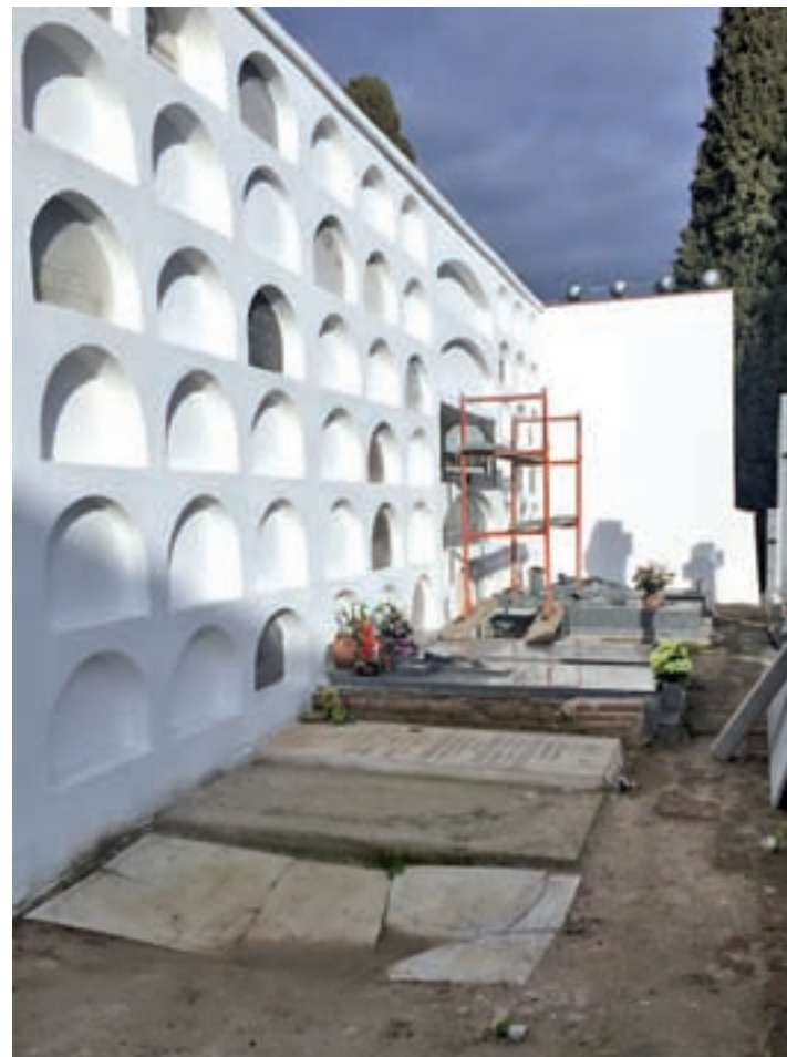
Estado actual de la parte vieja del cementerio