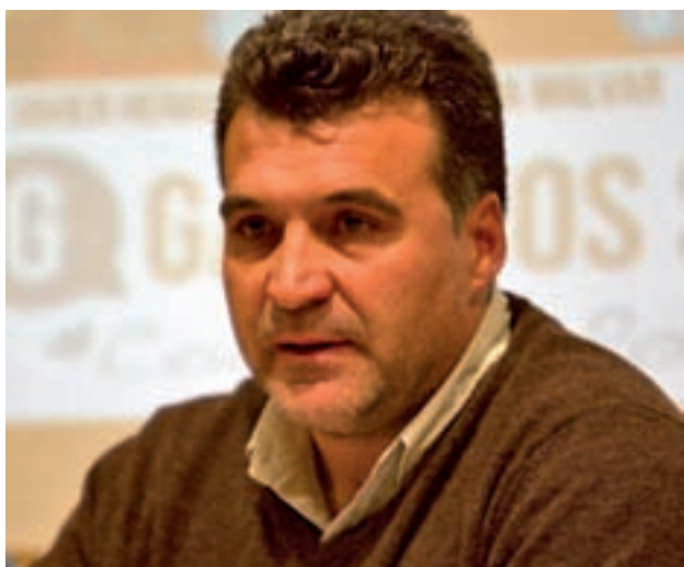
El portavoz de Ganemos Sanse