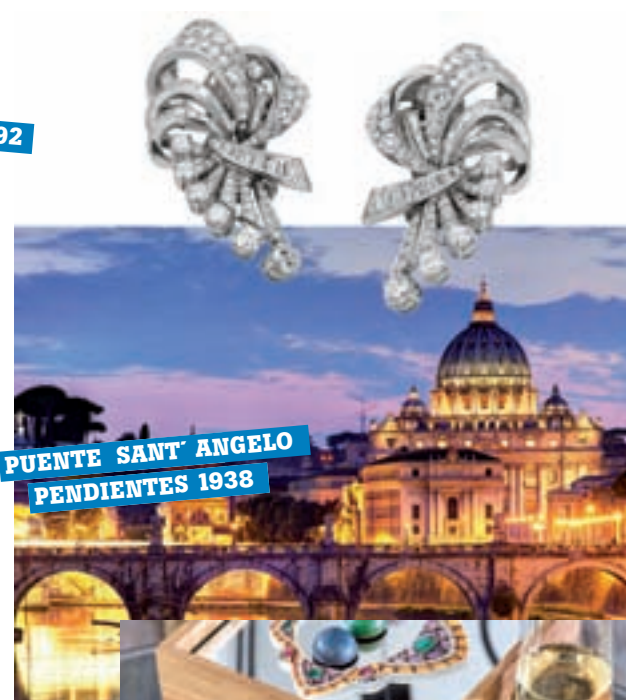
PUNTE SANT'ANGELO PENDIENTES 1938