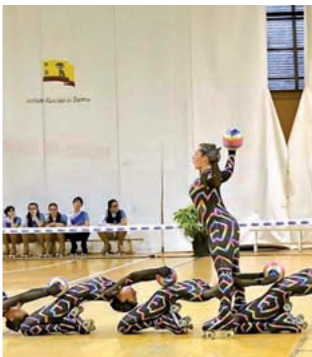
Imagen de una edición anterior

El Trofeo Internacional Latina de Patinaje se ha convertido con el paso del tiempo en el más importante de todo el país en la modalidad denominada Grupo Show, pasando a formar parte del prestigioso Calendario Internacional.