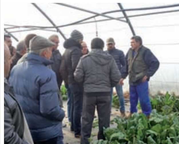
Agricultores fuenlabreños en La Rioja GENTE

Los talleres mejorarán la productividad de los cultivos de la ciudad ● La pasada semana se realizó un viaje a La Rioja para conocer otras plantaciones hortícolas