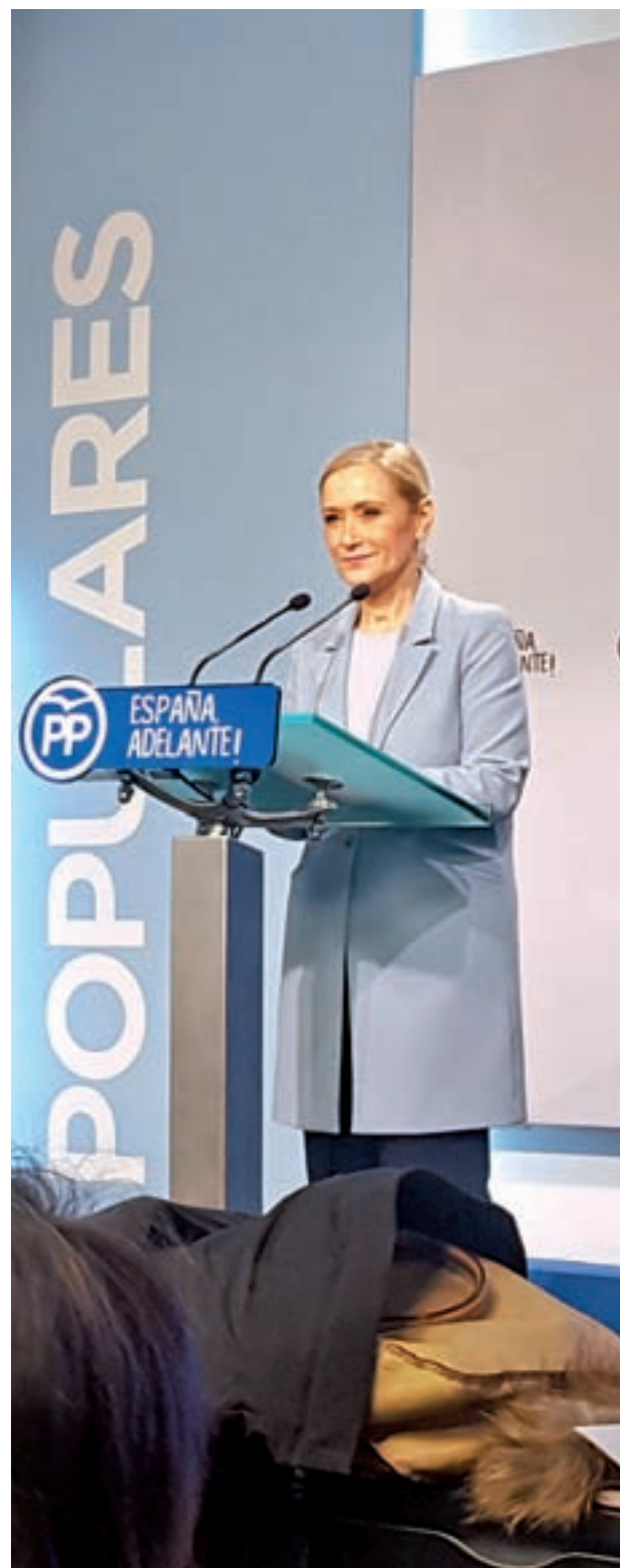
Cristina Cifuentes el martes en rueda de prensa

Cifuentes ya avanzó el martes que realizará una campaña en positivo, con el fin de ilusionar a sus afiliados. “Voy a hacer una campaña que se base en confrontar modelos para lo que queremos en el