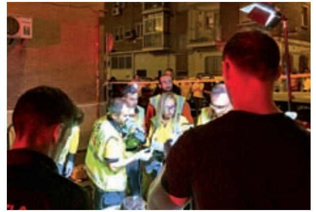
Uno de los homicidios cometidos en 2016

Las buenas noticias a nivel regional llegaron con los descensos del 1,3% y del 1,5% en los robos con violencia y en los producidos en viviendas, respectivamente.