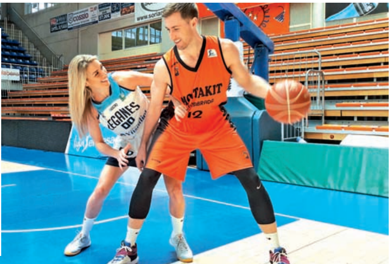
CHEMA MARTÍNEZ / GENTE

TEXTO DE FRANCISCO QUIRÓS SORIANO (@franciscoquiros)