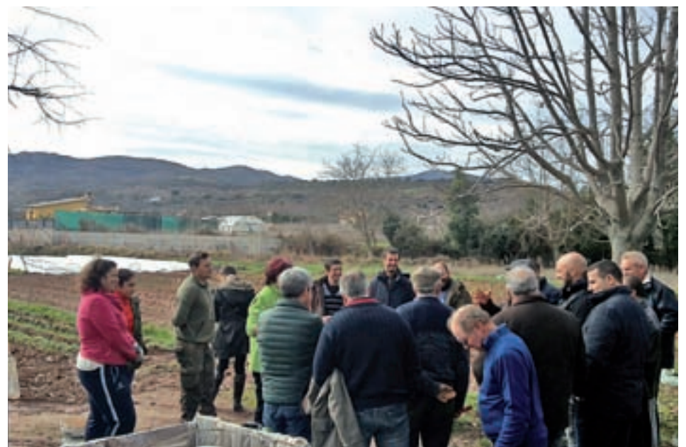
Visita de los agricultores a las explotaciones de La Rioja GENTE

Como parte de los talleres, los agricultores viajaron a La