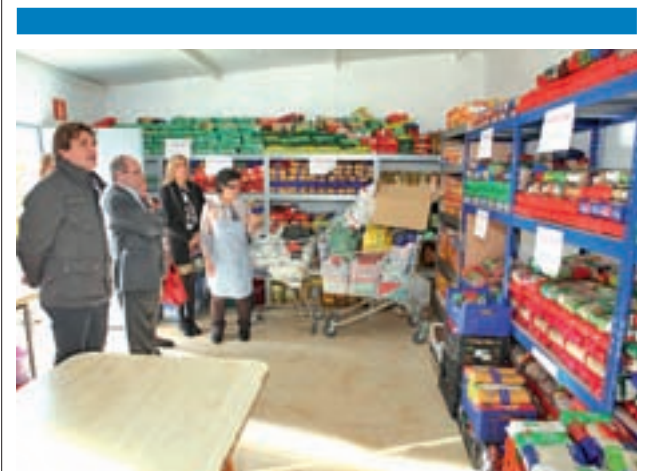
Visita del alcalde tras los trabajos GENTE

Las obras se iniciaron el pasado jueves y previsiblemente finalizarán este sábado. En ellas se utilizará maquinaria pesada y ligera y se desarrollarán en horario nocturno para compatibilizarlas con el servicio de Cercanías. Los trabajos consisten fundamentalmente en el tratamiento de los aparatos de vía, que son los dispositivos que permiten la ramificación y el cruce de diferentes vías de ferrocarril. Las actuaciones tendrán lugar desde el punto kilométrico 18,4 al 18,7.