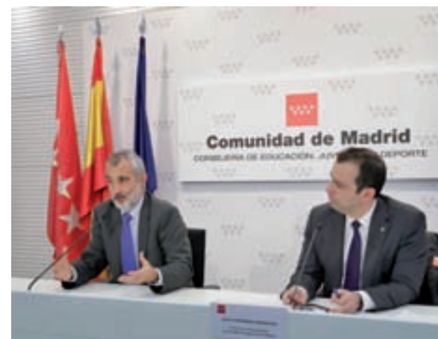
Presentación de la nueva selectividad

Los rectores de los seis centros universitarios madrileños estuvieron presentes en el acto, en que también se anunció que se respetará el distrito único en la Comunidad, por lo que todos los alumnos tendrán las mismas oportunidades de entrar en cualquiera de las universidades.