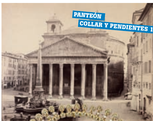
PANTEÓN COLLAR Y PENDIENTES 1992