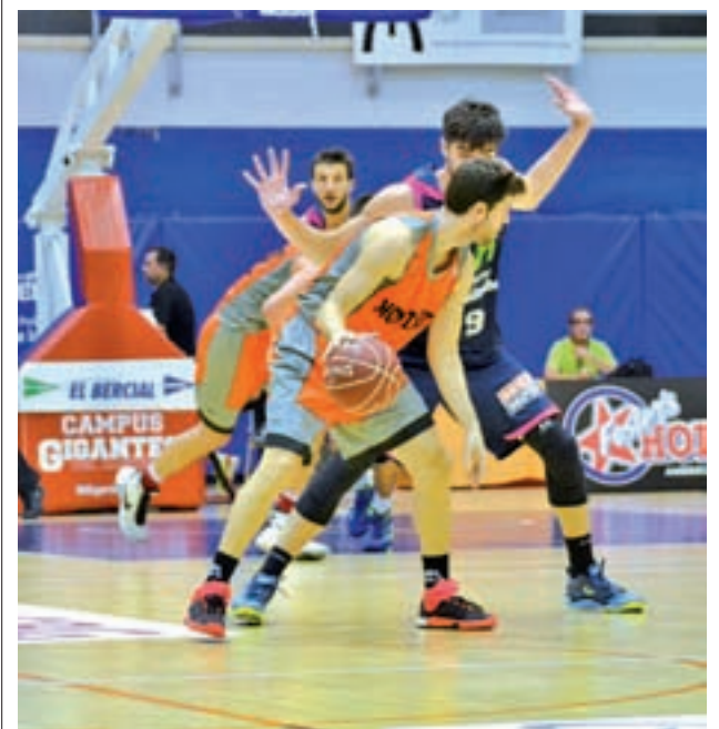
El Montakit, la pasada temporada

El próximo martes 21 de febrero se celebrará el Torneo de Bádminton municipal para las categorías benjamín, alemán, infantil, cadete y juvenil. Será en el Polideportivo La Cueva a partir de las 10 horas.