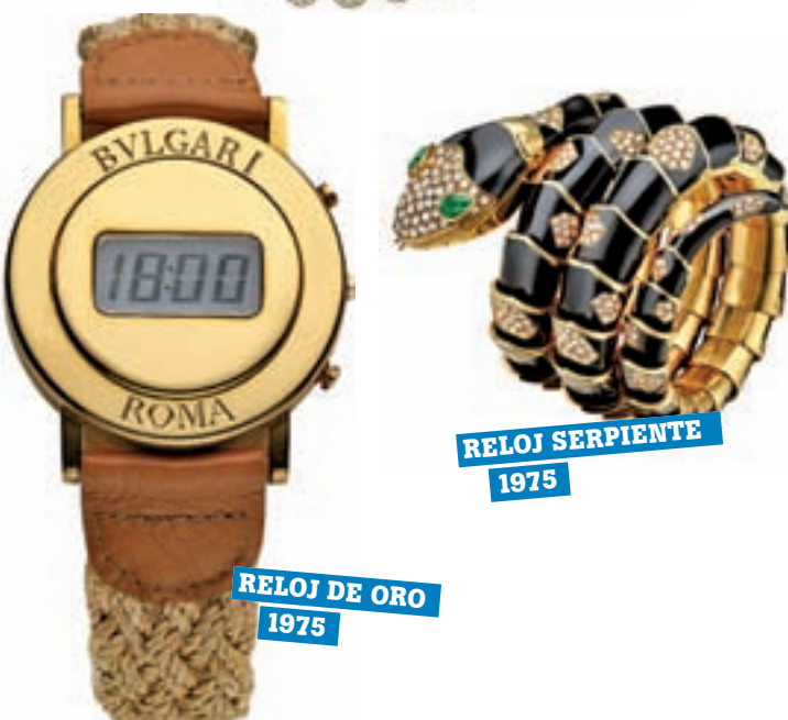
RELOJ DE ORO 1975