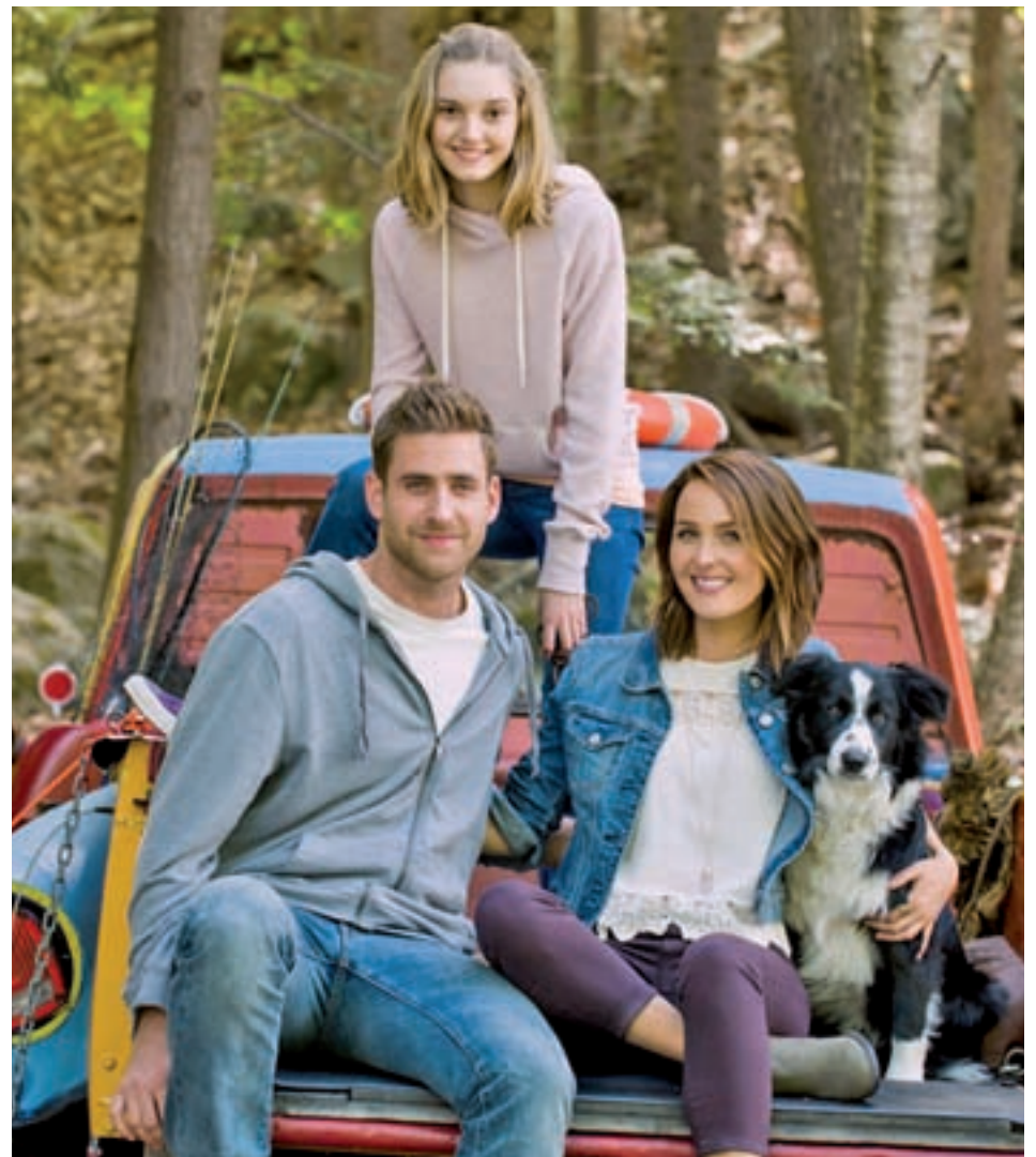
'Lo que de verdad importa' se estrena este viernes en las salas españolas