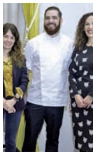
Responsables del proyecto

Abascal, 47) de Madrid junto con la Fundación Carmen Pardo-Valcarce. Esta asociación tiene como objetivo eliminar el muro, traspasar fronteras y fomentar la incorpora-