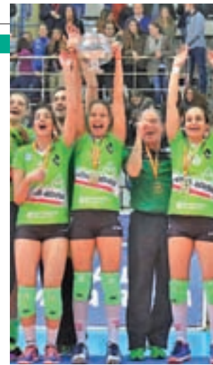
El Ciudad de Logroño

dos competiciones. El Pabellón Europa será testigo de algunos de los mejores partidos que se pueden ver en estos momentos en suelo español. Así, para abrir boca, desde este viernes 17 hasta el domingo 19 se disputará la Copa de la Reina, una competición para la que han conseguido billete seis equipos: Ciudad de Logroño, Haris Tenerife, Aguerre Tenerife, Haro Rioja y dos representantes madrileños, el Feel Volley Alcobendas y el Voley Playa Ma-