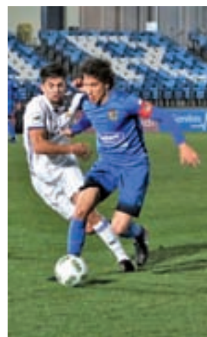
El 'Fuenla' CF FUENLABRADA

Por su parte, los donostiarras ocupan la duodécima plaza y llegan al partido tras caer la pasada jornada ante el Leioa. Con 32 puntos, sólo tres les distancian del des-