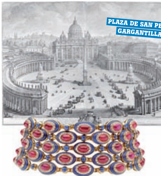
PLAZA DE SAN PEDRO GARGANTILLA 1979

En el Panteón, la escalinata de la Plaza de España, el Coliseo y los obeliscos también ha puesto la firma su mirada a lo largo de su historia, que comenzó en 1884. El éxito de esta exposición deja claro que sigue despertando mucho interés 133 años después.