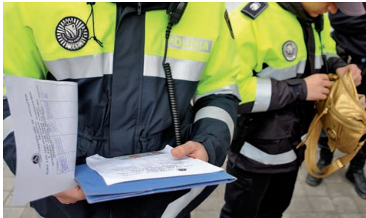
Policía Local de Fuenlabrada