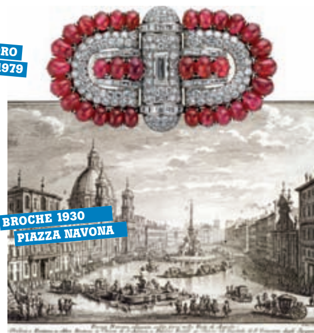
BROCHE 1930 PIAZZA NAVONA