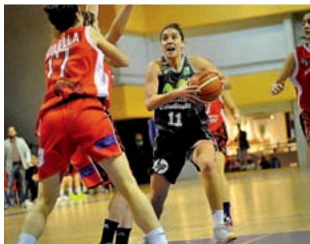
El Movistar Estudiantes se llevó la victoria del Circular

moción de ascenso a la Liga Femenina de baloncesto. El conjunto madrileño dio un paso atrás la semana pasada al caer en casa por 59-67 con