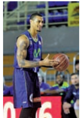
El 'Estu' ya es undécimo

En este último grupo está el Movistar Estudiantes. El conjunto colegial ha llegado a este paréntesis con buenas sensaciones después de haber ganado la semana pasada a un rival directo como el Real Betis Energía Plus (73-77), lo que le coloca en la undécima plaza de la clasificación. Gracias a esa victoria, los