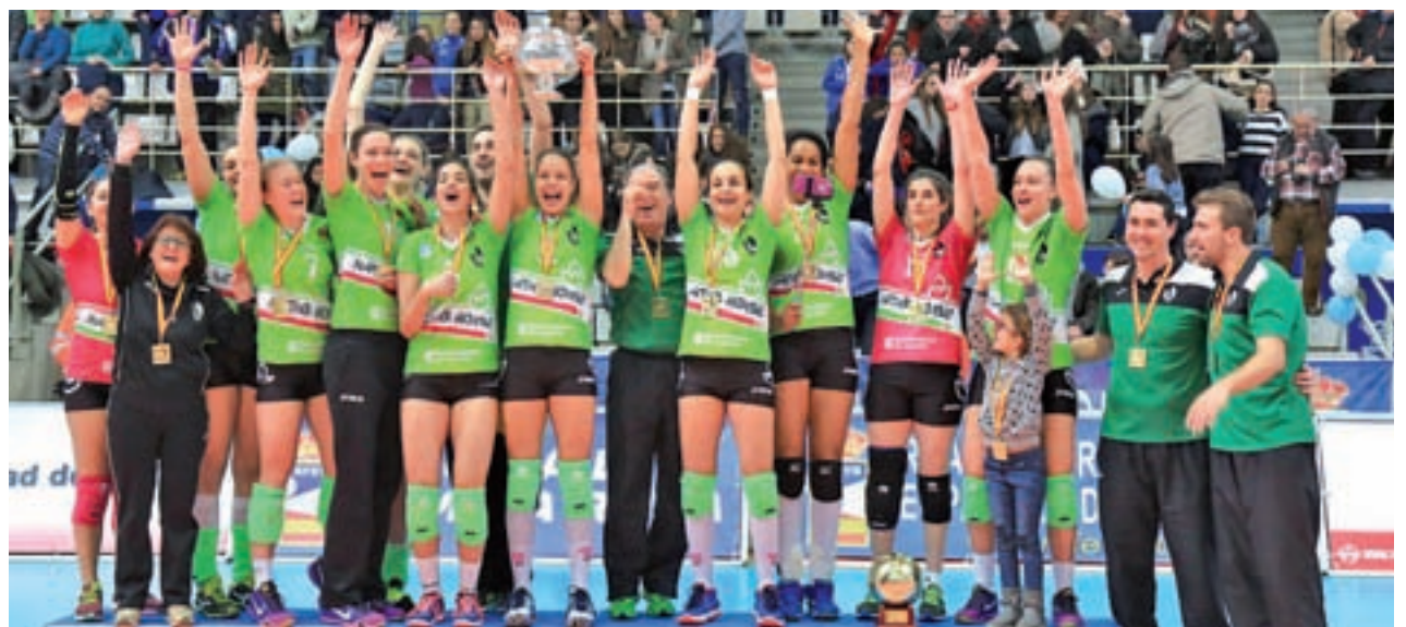
El Ciudad de Logroño aspira a reeditar el título del año pasado