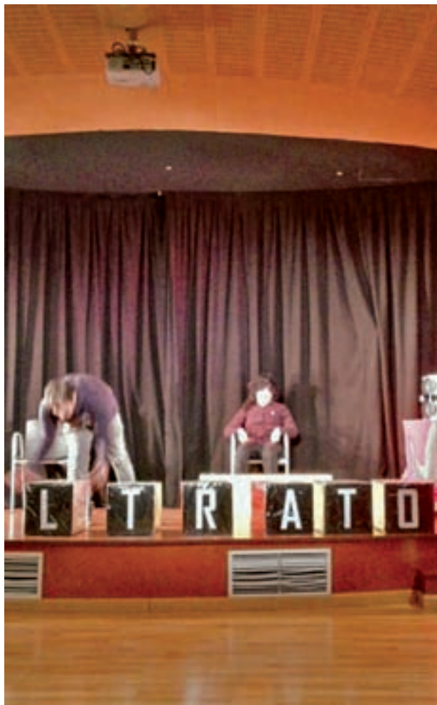
Una representación en el CC Francisco Fatou