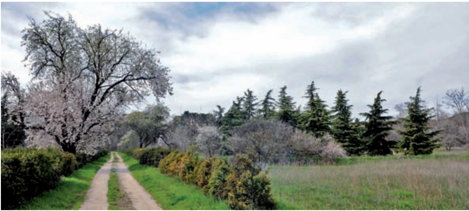
El entorno natural situado en la calle de Alcalá, en el distrito de San Blas-Canillejas