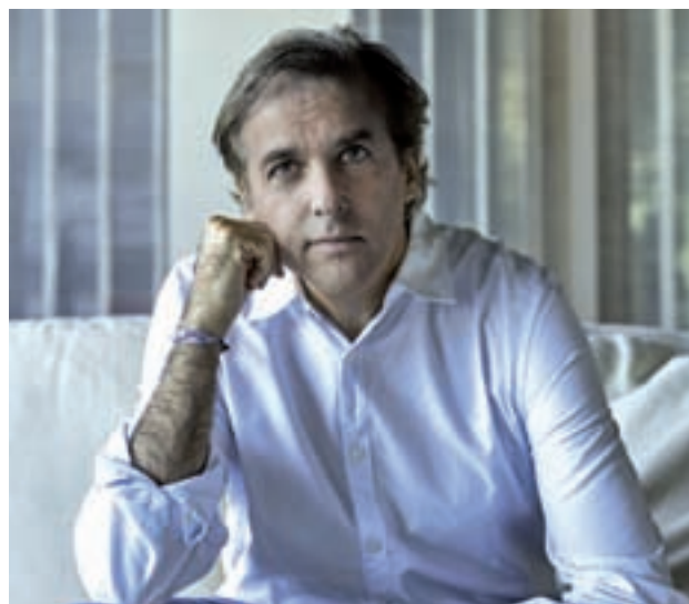
Paco Arango, director

primera de nuestro país. Y la razón, según cuenta, es que se percató de que "con el cine se puede hacer mucho bien". Arango es el presidente, fundador y alma de la Fundación Aladina. Productor y director de cine, su