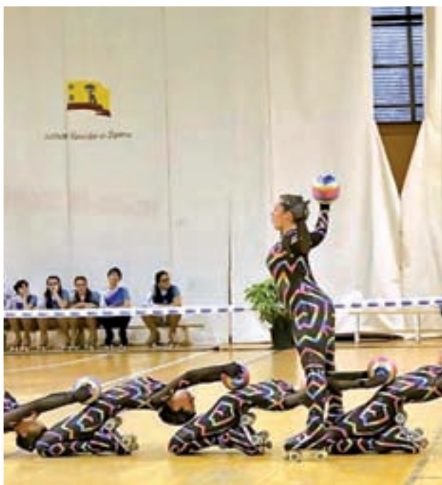
Imagen de una edición anterior

El Trofeo Internacional Latina de Patinaje se ha convertido con el paso del tiempo en el más importante de España en la modalidad de Grupo Show, pasando a formar parte del Calendario Internacional.