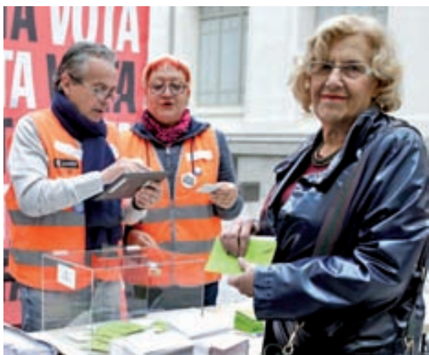
La alcaldesa votó el pasado lunes