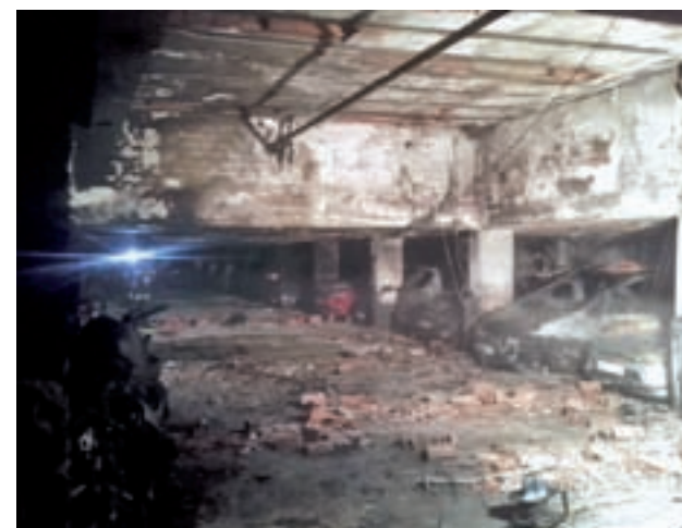
Estado en el que quedó el inmueble siniestrado

A pesar de las recomendaciones, uno de los vecinos salió de su domicilio y tuvo que ser atendido por inhalar algo de humo. El Samur le atendió y recibió el alta en el lugar. Al cierre de edición, se desconocía el origen de las llamas.