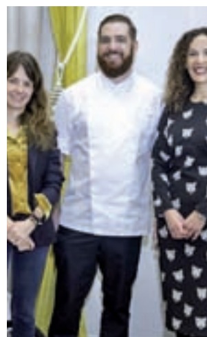
Responsables del proyecto