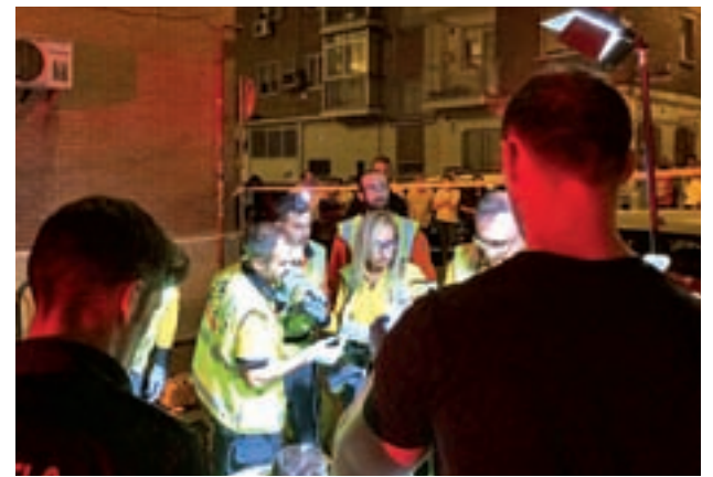
Uno de los homicidios cometidos en 2016

Las buenas noticias a nivel regional llegaron con los descensos del 1,3% y del 1,5% en los robos con violencia y en los producidos en viviendas, respectivamente.