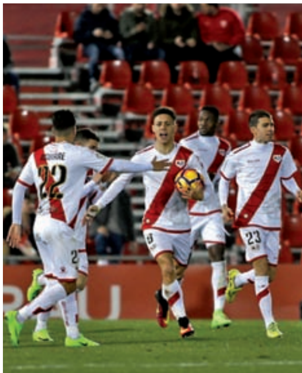
El Rayo sumó una nueva derrota en Mallorca LFP.ES

Eso sí, si los rayistas no quieren vivir un final de temporada de infarto deben sacar ade-