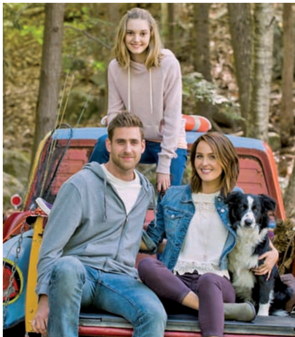
'Lo que de verdad importa' se estrena este viernes en las salas españolas