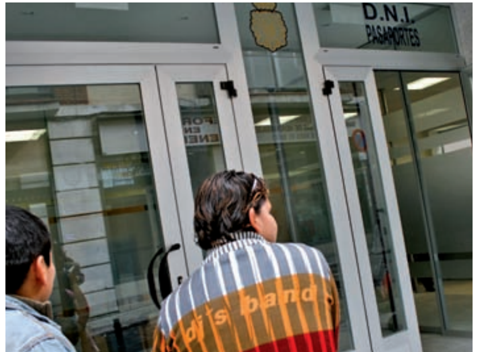
Página desde la que se pueden realizar las gestiones GENTE

Con el objetivo de agilizar el proceso de expedición y de ofrecer una tercera vía al ciudadano para abonar las ta-