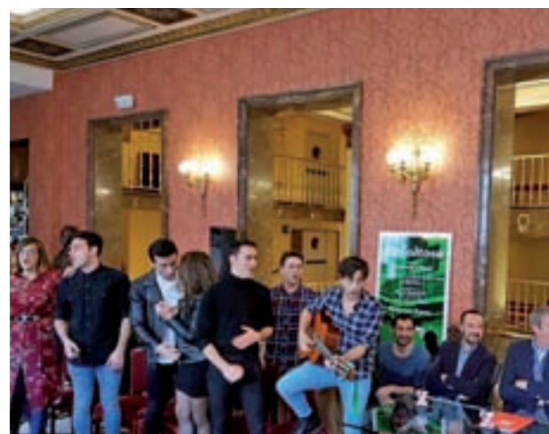
La obra está dirigida a un público de entre 12 y 18 años

En cuanto a la puesta en escena, la organización con-