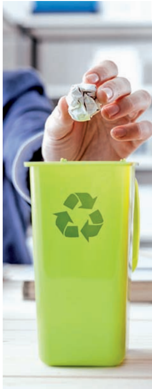
El reciclaje es esencial para una empresa sostenible

5. Programar la climatización. Es un medio de impedir que, cuando los trabajadores se han ido de la oficina, la calefacción o el aire acondicionado continúen funcionando y consumiendo energía.