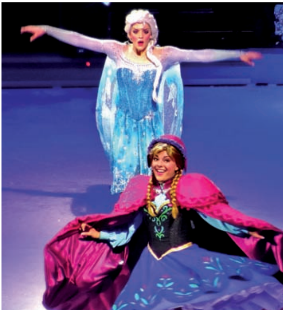
Elsa y Anna protagonizan el espectáculo

Hasta el domingo 5 de marzo, Elsa y Anna harán las delicias de los más pequeños que se acerquen hasta el Wizink Center • Tampoco faltarán las canciones insignias de la película de animación más taquillera de la historia