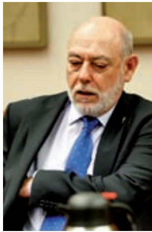
José Manuel Maza

El fiscal general no se refirió de forma concreta a la po-