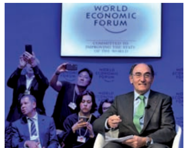
Ignacio Galán, presidente de Iberdrola

De este modo, desde que Iberdrola puso en marcha estos programas de eficiencia energética e integración de renovables en los hogares ha logrado que sus clientes ahorren más de 41 millones de euros en la factura.