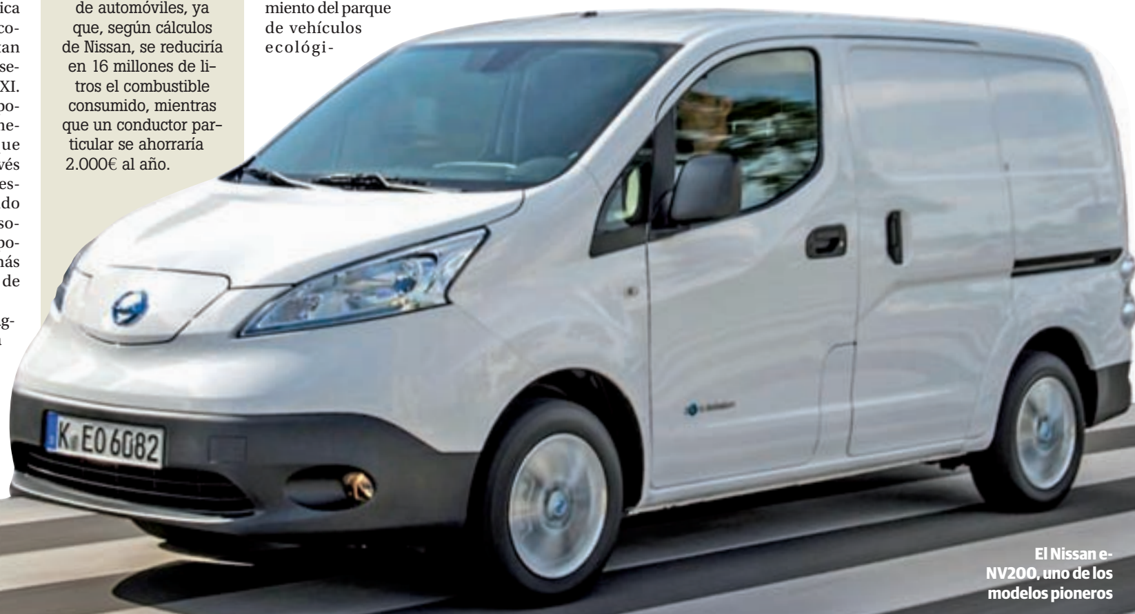
El Nissan e-NV200, uno de los modelos pioneros