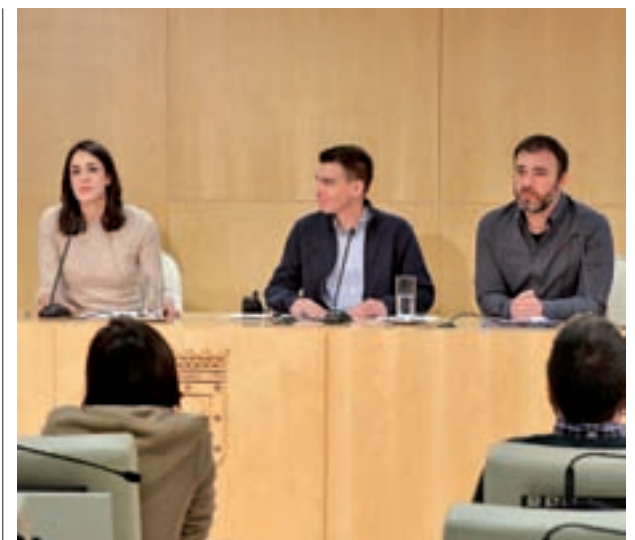
Presentación de los resultados de la votación

Por otra parte, en este proceso, el Consistorio ha invertido un total de 1,1 millones de euros en la preparación, divulgación y puesta en marcha. En concreto, en la campaña de publicidad se ha gastado 426.436 euros; en costes generales como sobres o dípticos, 135.423 euros; y en el voto por correo, 548.949 euros.