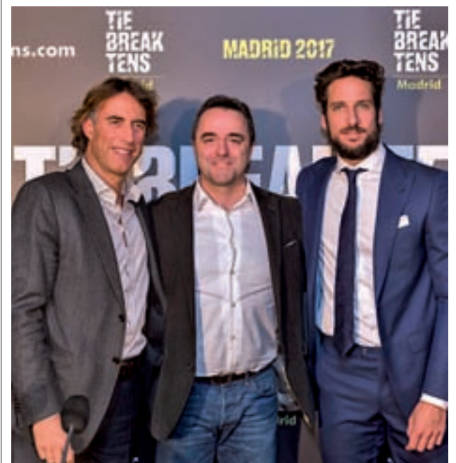
Imagen de la presentación

Ese mismo día, la localidad de Pinto acoge el III Medio Maratón Running.