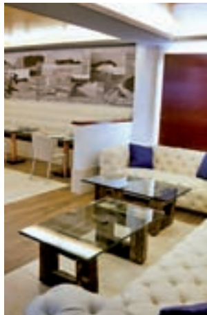
Calle de Ayala, 46

No te vayas sin probar sus especiales saquitos de gambas y puerros, sus sabrosas