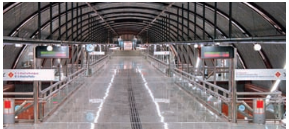
Sol es una de las estaciones que tendrá wifi gratuito GENTE

con el móvil, mediante la aplicación 'Renfe Ticket'. Para ello, tienen que seleccionar esta opción en la pantalla de la máquina autoventa y descargar un código QR o introducir un localizador mediante el teclado para iniciar el pago y recibir el billete.