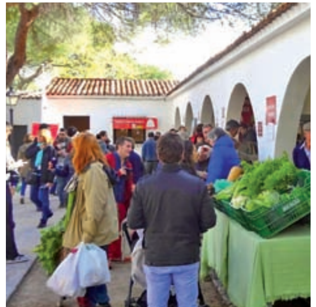
La iniciativa se celebra en la Casa de Campo

Los mejores horticultores No faltarán los mejores horticultores de la Comunidad de Madrid, que ofrecerán sus verduras y hortalizas de temporada recién cortadas en sus huertas de Villa del Prado, Fuenlabrada, San Martín de la Vega, Perales de Tajuña y Villamantilla. Toda la información sobre esta nueva edición en CamaraAgraria.org.