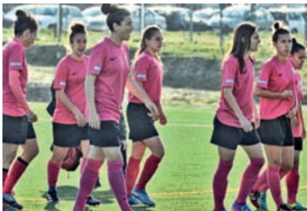
Nuevo triunfo del Madrid CFF

Por otro lado, en esta quinta fecha también se producirá otro partido de rivalidad regional, ya que el XV Sanse Scrum, quinto en la clasificación, recibirá al tercero, el CR Majadahonda.