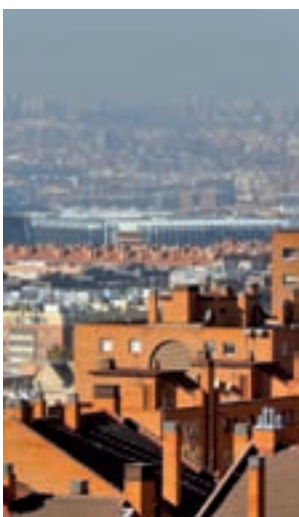
Centro de Madrid