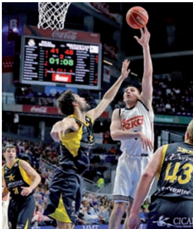
Difícil salida para los hombres de Pablo Laso

Eso sí, dada la atípica composición del campeonato en esta temporada, el Real Ma-