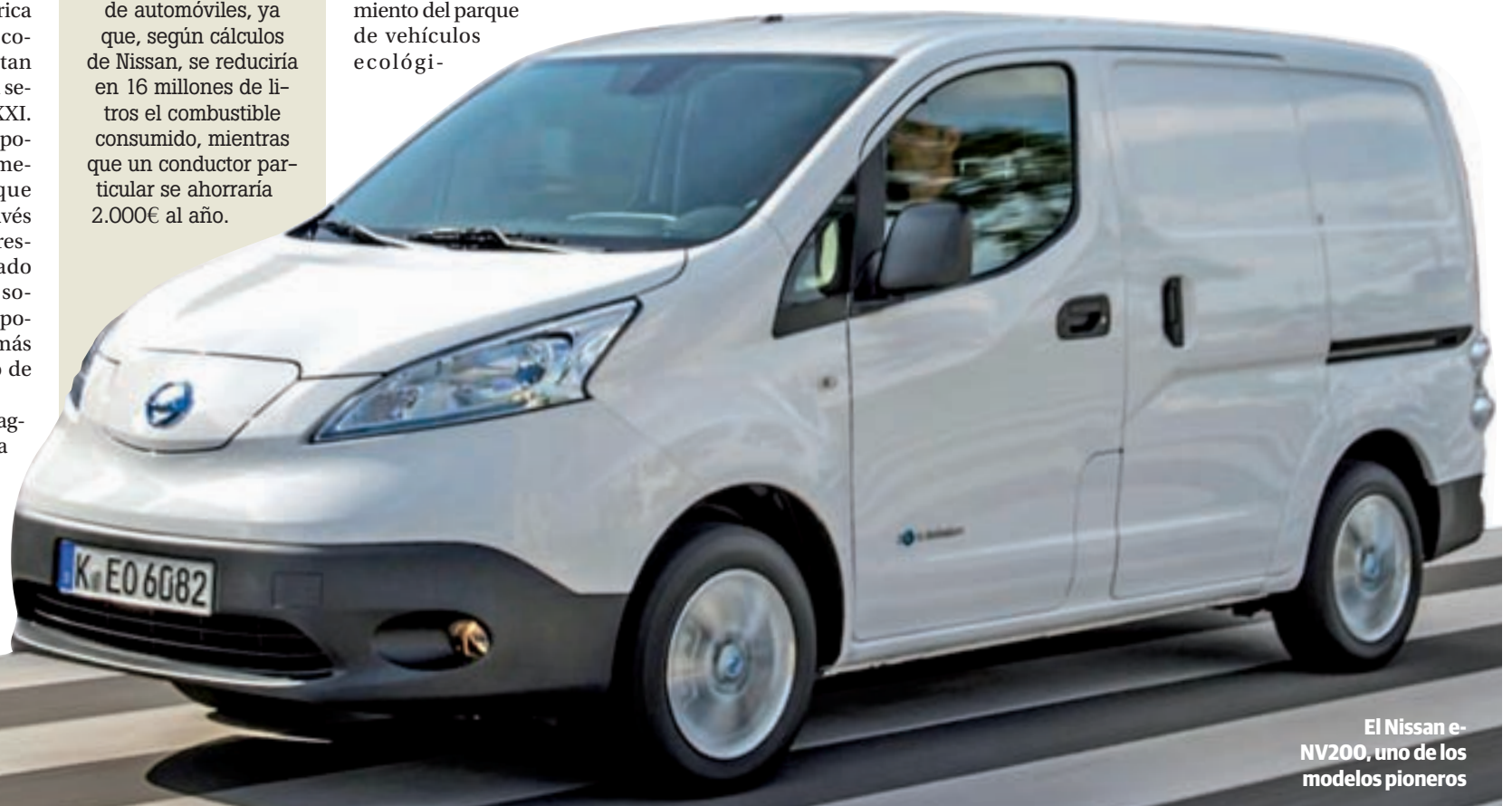
El Nissan e-NV200, uno de los modelos pioneros