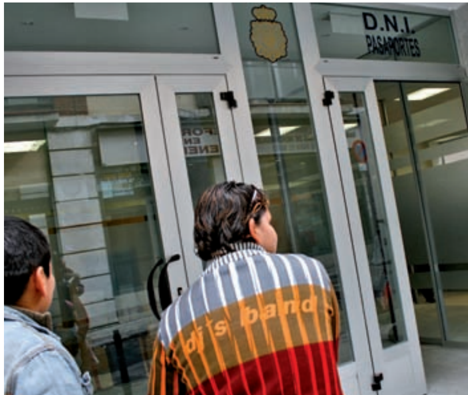
Oficina de expedición del DNI y del Pasaporte GENTE

Con el objetivo de agilizar el proceso de expedición y de ofrecer una tercera vía al