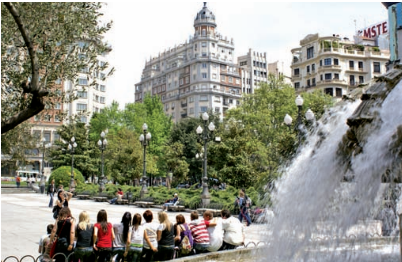
Estado actual de la Plaza de España