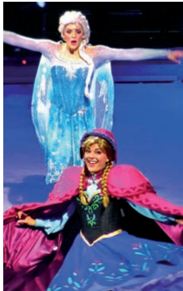
Elsa y Anna protagonizan el espectáculo

El espectáculo cuenta la historia de Anna y Elsa, dos hermanas inseparables que tienen una infancia muy feliz hasta que Elsa, la mayor, des-