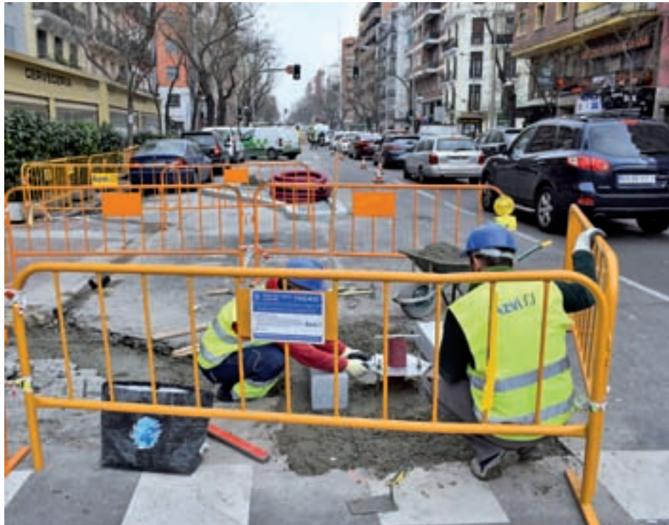
Estado actual de las obras en la calle del distrito de Chamberí

“No ha habido referencias sobre el proyecto. Haría falta algún panel gráfico que describa qué se va a hacer y como va a quedar la calle tras las obras”, comenta el responsable del kiosco situado junto a la ‘boca’ de Metro de Iglesia. En este contexto, se han generado diferentes corrientes de opinión acerca de las