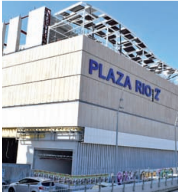
Estado actual del nuevo espacio comercial

La Sociedad General Inmobiliaria de España, promotora del nuevo espacio, anunció la semana pasada que la actividad se iniciará de forma oficial el próximo mes de octubre. Según sus responsables, el centro comercial pondrá a disposición de los consumidores una gran oferta de moda, alimentación,