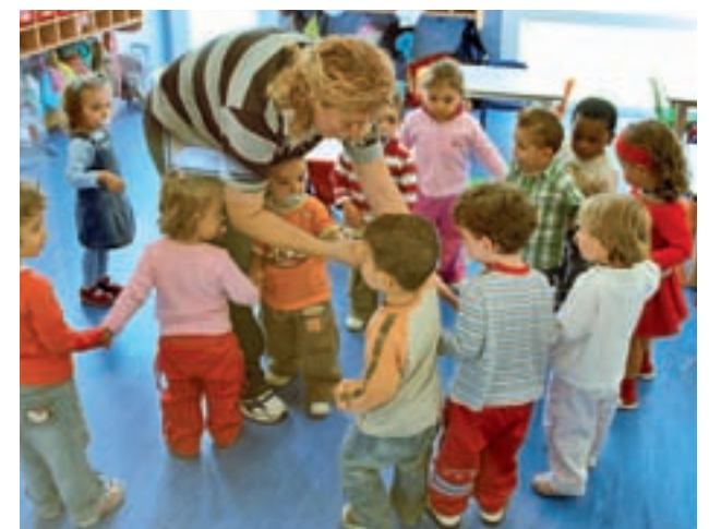
Escuela Infantil de la Comunidad de Madrid GENTE

Las cuantías de las becas serán de 100 o de 160 euros mensuales en función de la renta y beneficiarán fundamentalmente a las familias en las que trabajen ambos cónyuges, con el objetivo de fomentar la conciliación familiar y laboral. Habrá facilidades para las víctimas de la violencia de género.