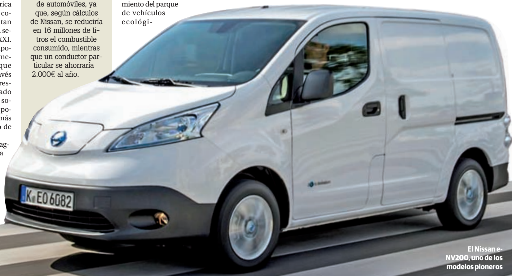
El Nissan e-NV200, uno de los modelos pioneros