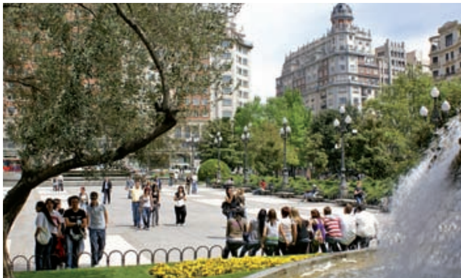
La Plaza de la Madre Naturaleza: El proyecto de los diseñadores de Madrid Río, 'Welcome Mother Nature', gana la consulta sobre Plaza de España. El plan contempla una reducción del 50% del tráfico, la plantación de mil árboles y la prolongación del túnel de Bailén hasta la calle Ferraz.