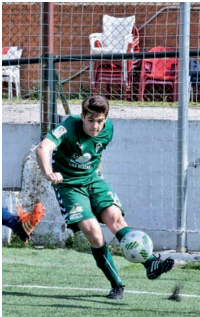
Dura derrota ante el Móstoles JOAQUÍN MORCUENDE / V. BOETTICHER

Mirando a la trayectoria que está firmando el Villanueva, los pupilos de Sendarrubias podrían tener la incertidumbre de saber qué versión tendrán enfrente. En la