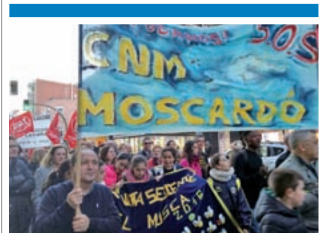
Un momento de la manifestación del lunes 27 de febrero

La Consejería de Educación tiene previsto realizar obras en el equipamiento este verano por un importe de 250.000 euros.