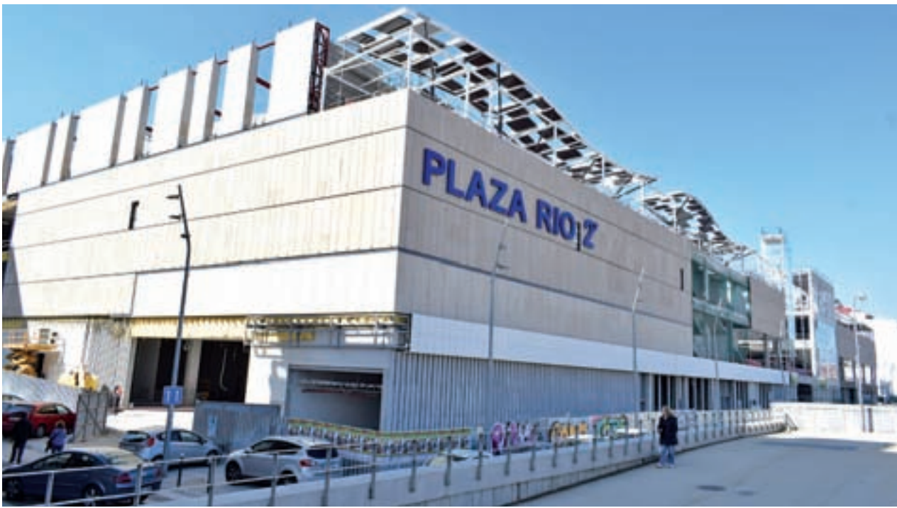
Estado actual del nuevo espacio comercial