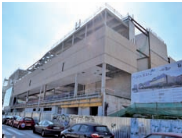
Las obras de Plaza Río 2

La Sociedad General Inmobiliaria de España, promotora del nuevo espacio, anunció la semana pasada