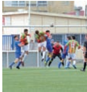
El Lugo, la pasada jornada

Este viernes 31 de marzo finaliza la competición escolar de tenis de mesa que comenzó el pasado 28 de marzo. Los últimos choques serán en el polideportivo El Trigar a partir de las 10 horas.