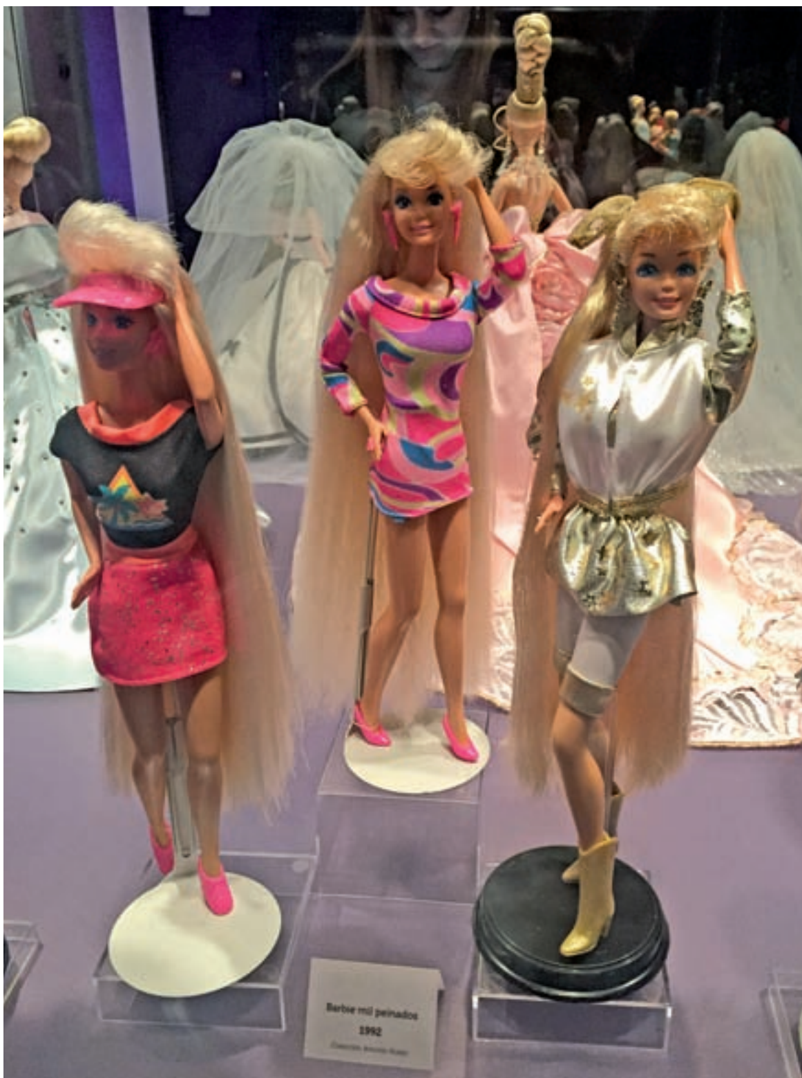
Las barbies de los años 90