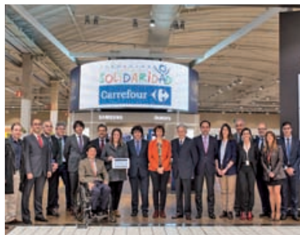
Presentación del nuevo dispositivo

SVisual permite la comunicación entre personas sordas y oyentes en tiempo real y de manera fluida gracias a una plataforma pionera.