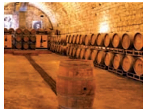
Bodega Carmel: Un lugar para dejarse llevar en Zikhron Ya'aqov, gracias a sus vinos de estilo antiguo, con cuerpo suave y complejos sabores.

VIVE LA SEMANA SANTA EN CASTILLA Y LEÓN.