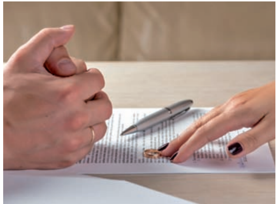
Los divorcios se han triplicado

Desde el organismo han apuntado que esta "reducción drástica" en las separaciones y el "notable incremento" de los divorcios se remonta a 2005, cuando cambió la legislación, pasando a permitirse la disolución directa