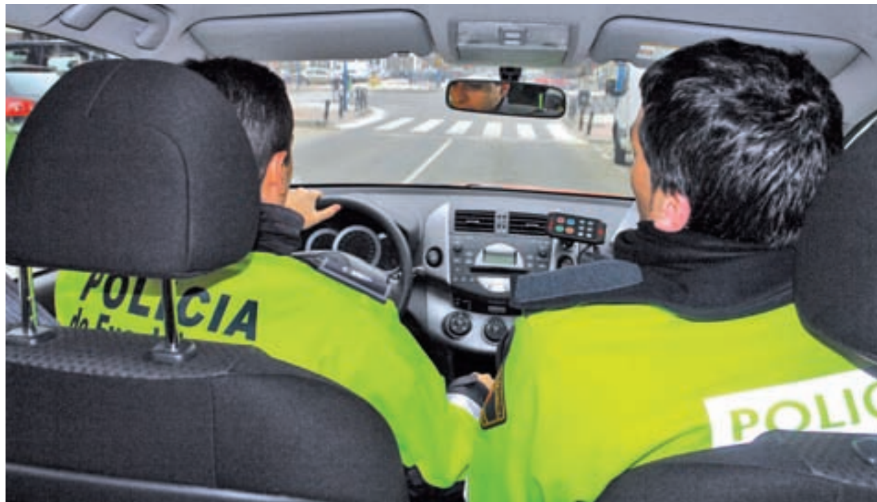
Patrulla policial de Fuenlabrada