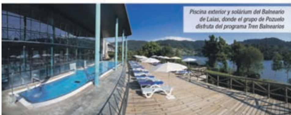
Piscina exterior y solarium del Balneario de Laíás, donde el grupo de Pozuelo disfruta del programa Tren Bañerios

El precio desde Madrid con todo incluido está comprendido entre 343 y 379 euros, según el balneario elegido.