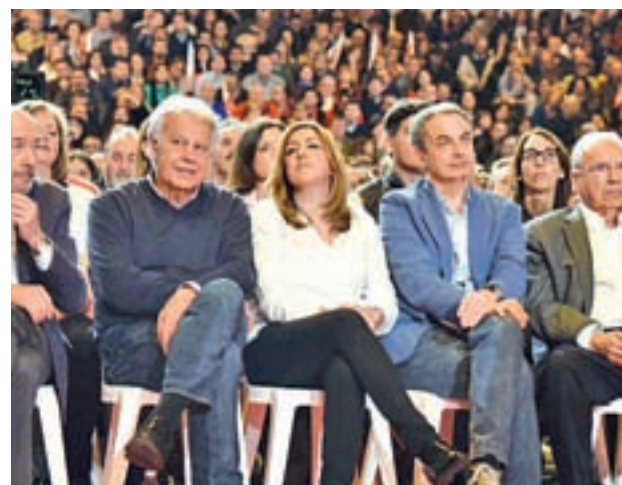
Díaz, con Rubalcaba, González, Zapatero y Guerra

Díaz, que competirá por el puesto con el exlehendakari vasco Patxi López y con el exsecretario general del PSOE Pedro Sánchez, estuvo arropada en el evento por los expresidentes del Gobierno Felipe González y José Luis Rodríguez Zapatero; o los exvicepresidentes Alfonso Guerra y Alfredo Pérez Rubalcaba, y el expresidente del Congreso de los Diputados y exministro de Defensa, José Bono.