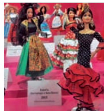
Internacional: Barbie ha homenajeado a las mujeres de 50 nacionalidades, entre ellas, a España.