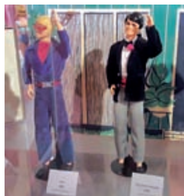
El príncipe azul: El novio de Barbie, Ken, aparece por primera vez en 1961 y tiene más de 40 versiones.