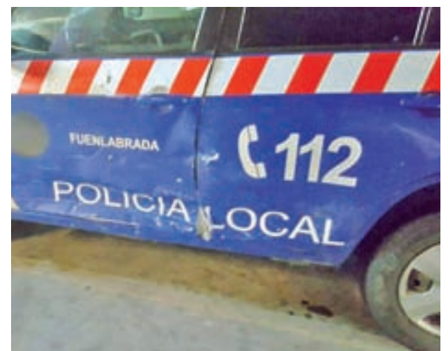
Estado del vehículo tras el accidente

Los hechos ocurrieron sobre las 21 horas del pasado sábado 25, cuando un vehículo policial acudía al aviso de atropello registrado en la avenida de España, muy próxima al Centro Cultural To-