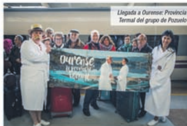
Llegada a Ourense: Provincia Termal del grupo de Pozuelo

Querquis pasando por la iglesia más antigua de Galicia, Santa Comba de Bande, la Capilla Mozárabe de San Miguel en Celanova o una de las Juderías más importantes de Europa, en Ribadavia. Como todo paseo por la historia no podemos olvidarnos de los paisajes infinitos de la Ribeira Sacra o las centenarias viñas del Ribeiro, en donde se realizará una jornada de enología.