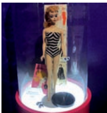
La primera Barbie: Nace el 9 de marzo de 1959 y debuta en la Feria del Juguete de Nueva York.