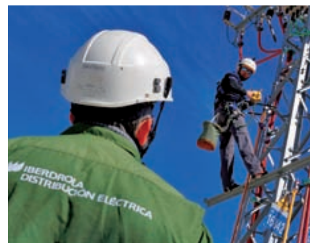
Curso de formación en el campus de San Agustín de Guadalix

La presencia de la compañía en Madrid también se traduce en el acuerdo con el Gobierno regional para proteger a los clientes vulnerables o en la reforma integral de su campus de San Agustín de Guadalix, donde se atienden las necesidades formativas de los empleados.