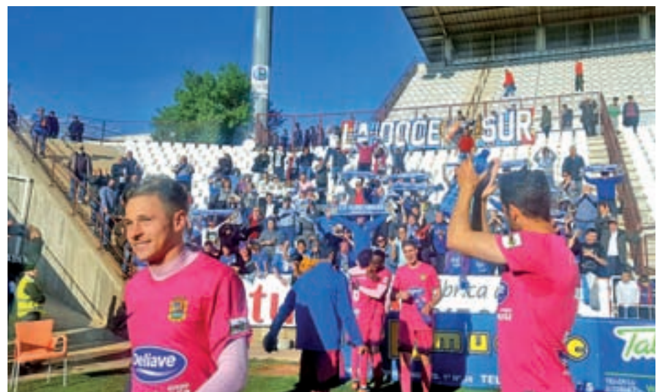
El CF Fuenlabrada tras la victoria en Albacete

Duelo importante para las chicas del Eureka Fuenlabrada FSF. Este fin de semana se miden al FSF Móstoles B. El Polideportivo Loranca acogerá el choque este domingo 2 de abril a las 15 horas.