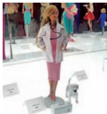
Médico: Es solo una de las profesiones a las que se 'dedicó' la muñeca. En total, tuvo más de 150.