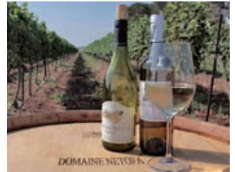
Bodega Netofa: Desde Galilea hasta Negev, unas viñas de carácter fuerte en la zona más fresca de Israel, donde probar un vino único.