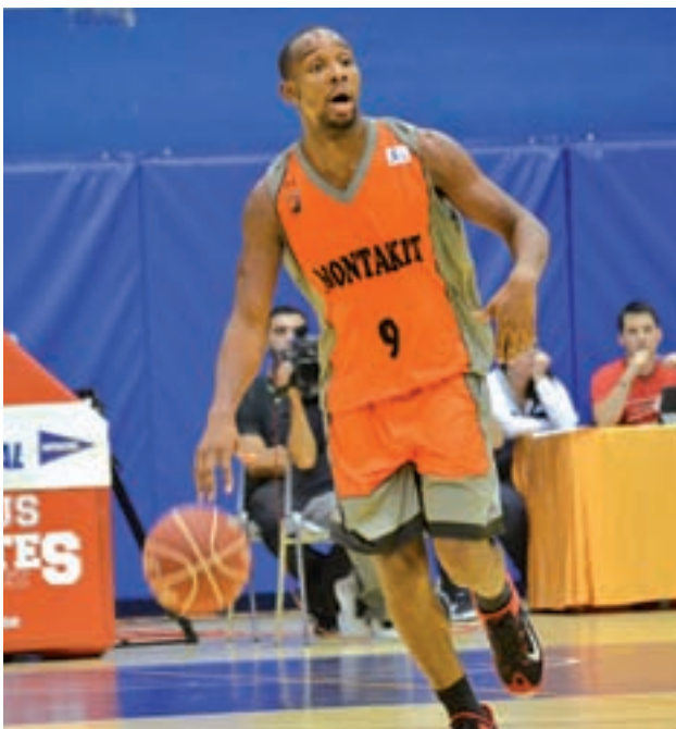
El Montakit, en un encuentro la pasada temporada GENTE

En cuanto al Montakit, la pasada jornada firmó una importante victoria ante el ICL Manresa. Tras un partido ajustado, Popovic se desató en el último cuarto anotando tres de los ocho triples que tuvo en su haber ante los catalanes. Sus 19 puntos rompieron la igualdad y dieron la victoria a los madrileños.