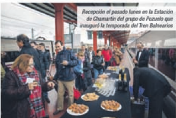
Recepción el pasado lunes en la Estación de Chamartín del grupo de Pozuelo que inauguró la temporada del Tren Bañerios