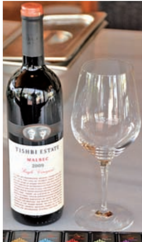
Bodega Tishbu Estate: “El pasado es la mejor profecía del futuro”. Con más de un siglo de experiencia y 24 hectáreas de terreno por el norte de Binyamina, nos ofrece la opción de disfrutar de vinos con estilos y caracteres variados.