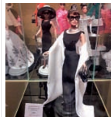
Apoyo a la cultura: Audrey Hepburn es solo una de las actrices en las que se convirtió la muñeca.