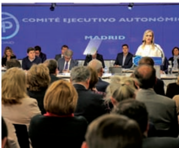
Primera reunión de la Ejecutiva regional