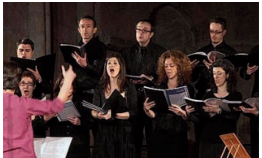
Coro Francis Poulenc: La mujer en el epicentro de la experiencia religiosa. Música como reflejo de distintas sociedades y de gentes muy diferentes (1 de abril, Iglesia Nuestra Señora de las Maravillas, 20h). A la izquierda, La Grande Chapelle: Intensidad y espiritualidad son las palabras que les definen (8 de abril, Nuestra Señora de las Victorias, 20h).