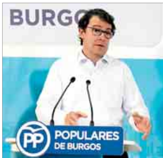
El precandidato celebró una reunión con el PP de Burgos.