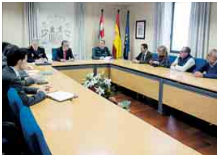
La reunión tuvo lugar el lunes 13 en la Subdelegación del Gobierno.

Las investigaciones se iniciaron en agosto de 2016, tal como explicó el subdelegado del Gobierno, cuando se detectaron diferentes denuncias por robos con fuerza en varias naves de los polígonos industriales de Burgos, si bien este "grupo criminal" tenía su base en las cercanías de Madrid y utilizaba las carreteras españolas para desplazarse a las localidades donde cometían los delitos, ya que se tiene constancia de que