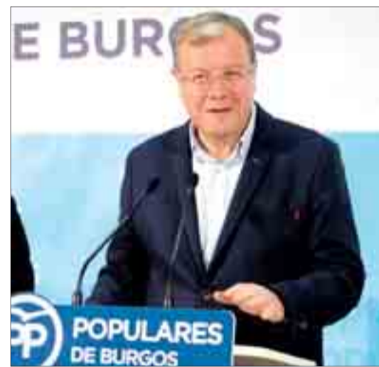
La sede del PP fue el escenario donde presentó su proyecto.

Durante la presentación de su proyecto en Burgos, el precandidato a la Presidencia del PP de Castilla y León hizo hincapié en "adaptar" el partido a la realidad del siglo XXI y en contar con el afiliado los 365 días del año. Puso también en valor la capilaridad del partido, que le permite ser muy potente en cantidad y en ideas, y su defensa del municipalismo.