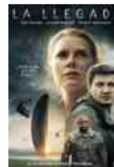
LA LLEGADA Dir. Denis Villeneuve. Int. Amy Adams, Jeremy Renner. Ciencia-Ficción.