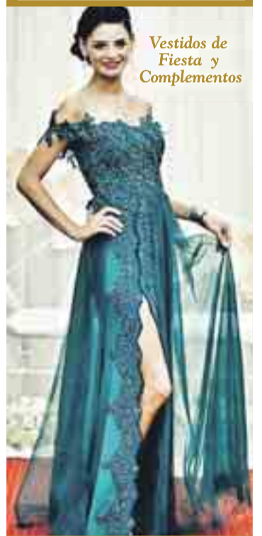
Vestidos de Fiesta y Complementos