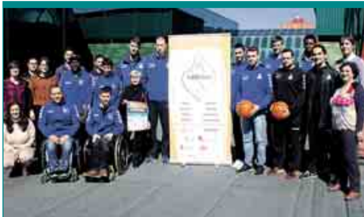
■ 'DEPORTE DE ALTURA EN SILLA DE RUEDAS' , Visita del San Pablo Inmobiliaria a la sede de la Federación de Asociaciones de Personas con Discapacidad Física y Orgánica de Burgos (feDISfibur) con motivo del II Encuentro entre Miraflores y Servigest, del próximo 26 de marzo.

Por su parte, el Sáenz Horeca Araberri llega al encuentro con la moral reforzada tras conseguir una victoria la pasada jornada en Logroño ante el Clavijo (68-82).