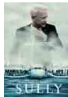
SULLY Dir. Clint Eastwood. Int. Tom Hanks, Aaron Eckhart. Drama.

YO, DANIEL BLAKE. Dir. Ken Loach. Int. Dave Johns, Hayley Squires. Drama.