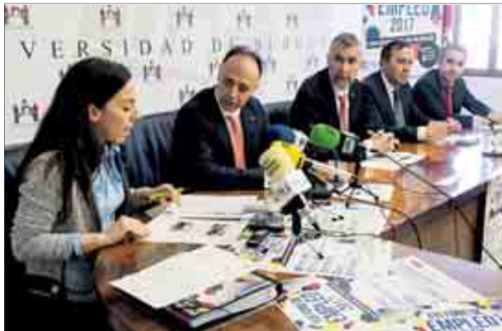
La presentación de las actividades se llevó a cabo el jueves 16.

Hasta el 20 de abril la institución educativa ha organizado "múltiples actividades", entre las que destaca la celebración de la 'Feria de Empleo', que tendrá lugar el 21 de marzo en la 3ª planta del Fóm Evolución. En ella se esperan alcanzar unas cifras "similares" a las del año pasado, cuando se recibieron 7.000 CV, y van a participar sesenta empresas. Tal como señaló Barcenilla, veinte empresas se han quedado sin participar en la feria