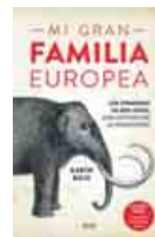
MI GRAN FAMILIA EUROPEA Karin Bojs. Ciencia.