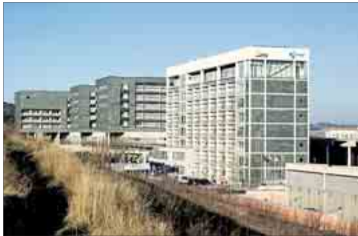
El HUBU entró en pleno funcionamiento en el año 2012.

En este sentido, Ayllón citó ejemplos de hospitales en los que el movimiento ciudadano ha conseguido o está consiguiendo la reversión a lo público, como es el caso del centro sanitario de Alcañiz (Teruel), de Valdecilla (Cantabria) o de Alcira (Valencia).