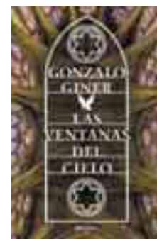
LAS VENTANAS DEL CIELO Gonzalo Giner. Novela.

Luz y Vida Arco del Pinar, 8 (Lain Calvo)