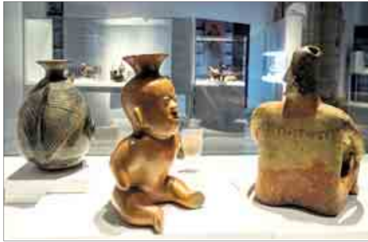
La muestra está compuesta por piezas arqueológicas de las principales culturas prehispánicas.