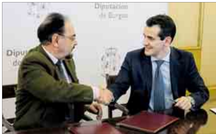
La firma del convenio de colaboración se produjo el martes 14.