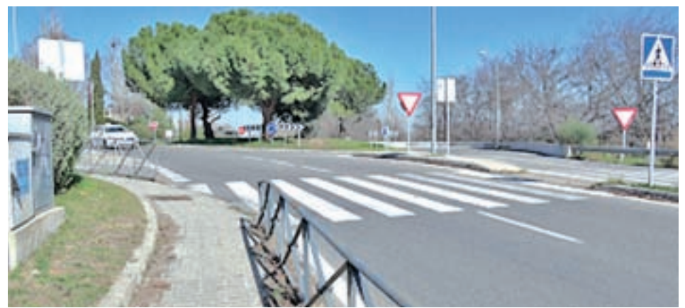
Tramo afectado de la M-206

como consecuencia del punto anterior, la Comunidad de Madrid se ha comprometido a poner una solución como podría ser la instalación de un semáforo o la mejora de la visibilidad en el tramo señalado mediante la adición de señales luminosas.