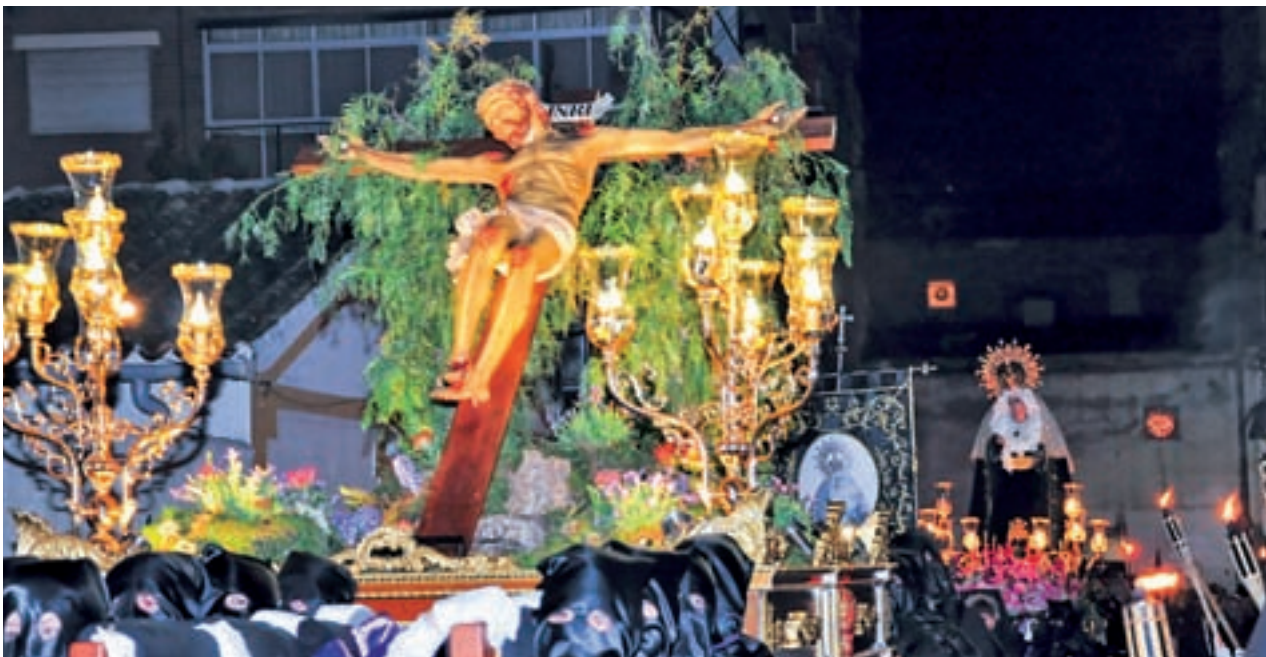
Las procesiones se apoderan de las calles en estas fechas