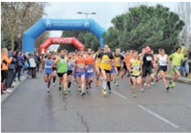
Anterior edición de la prueba