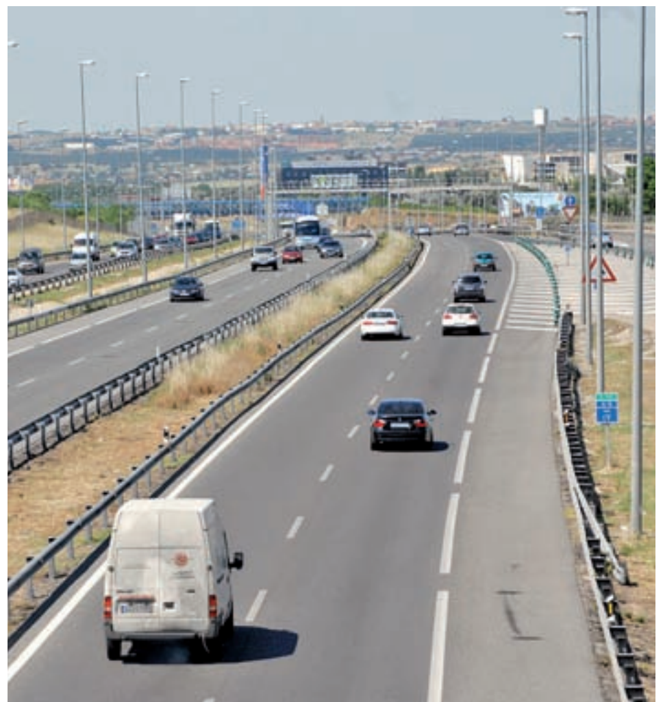
La autovía A-5 a la altura de Móstoles, con dos carriles en la actualidad

El servicio de Cercanías Madrid recibirá 52,2 millones de euros de inversión, destinados a la redacción de proyectos para su desarrollo. Destacan los estudios informativos para la extensión de la red hasta San Agustín y Algete, hasta la localidad de Mejorada del Campo, para el desarrollo de la variante de Cercanías por el centro urbano de Majadahonda y Las Rozas, y para levantar la tercera y cuarta vía entre Pinto y Aranjuez en la línea C-3. Conseguir que el Cercanías lleve a Algete y San Agustín es una de las peticiones de la plataforma creada por alcaldes de la zona Norte, que buscan soluciones a los atascos