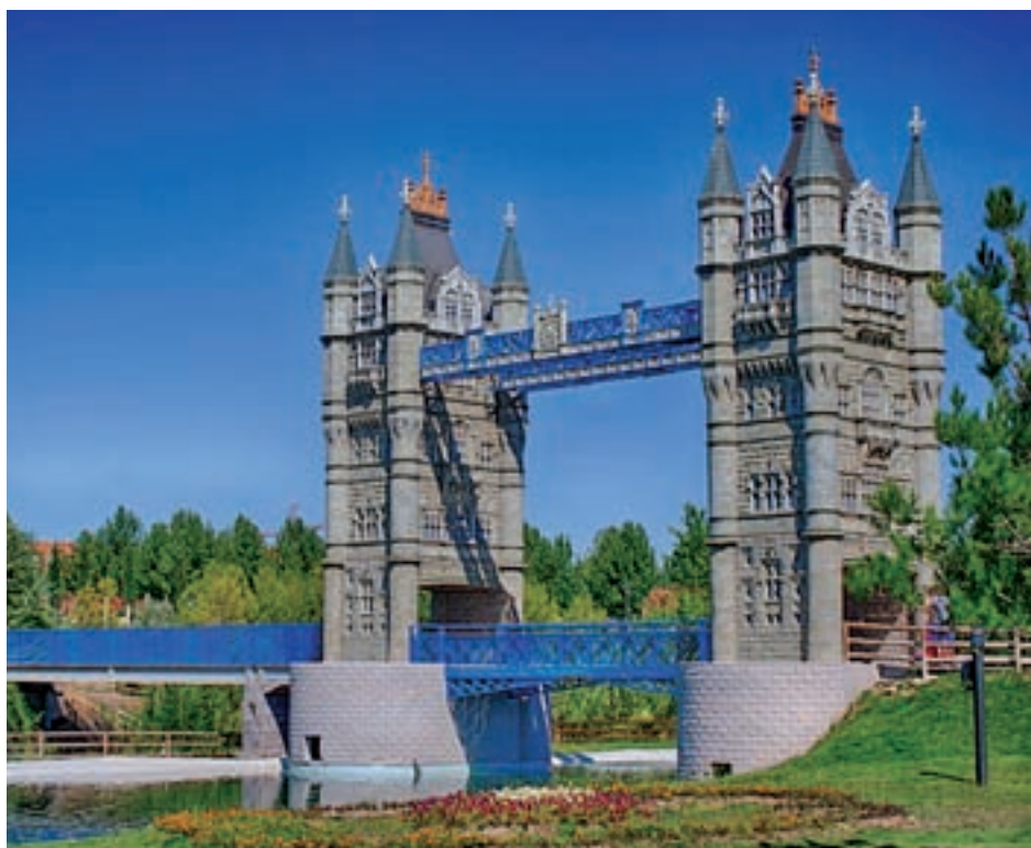
Réplica del Puente de Londres instalada en el Parque Europa M.P.

Desde el pasado 1 de abril el horario de apertura se adelantó una hora como respues-