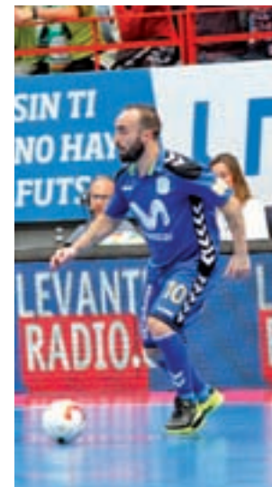
Nueva derrota para el Inter

Sigue la lucha por el primer puesto en la máxima categoría de fútbol sala. En la última batalla, el FC Barcelona ha salido vencedor, tras ganar su partido de la última jornada y hacerse con los tres puntos, mientras que el Movistar Inter perdió ante el Jaén Paraíso Interior acumulando así su segunda derrota consecutiva en Liga. De esta manera, el liderato queda en manos del conjunto azulgrana, aunque el equipo interista sólo está un punto por detrás en la