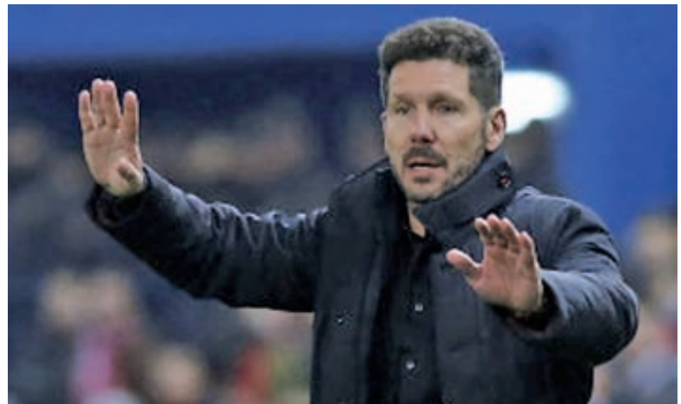
Las pizarras de Zidane y Simeone, frente a frente