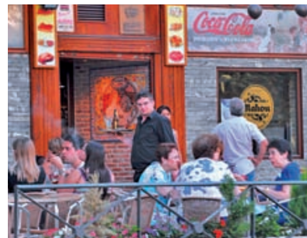
La hostelería liderará la creación de empleo

Extremadura será la autonomía que menos empleos genere en esta campaña con un total de 430, junto a Baleares, con 820. En este último caso se da la circunstancia de que la temporada empieza antes de la Semana Santa.