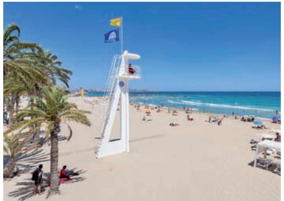
La costa de Alicante es uno de los destinos más solicitados

En este panorama tan esperanzador, solo una nube se atisba en el horizonte: el 'Brexit'. "No nos afectará este año ni en 2018, pero España tiene que hacer valer su peso en las negociaciones para que se tenga en cuenta la importancia del turismo", concluyó el presidente de Cehat.