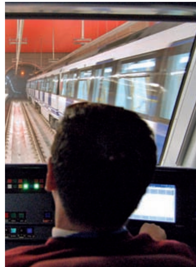
Huelga en el Metro de Madrid GENTE

Nada más conocer la convocatoria de las nuevas protestas, la Comunidad de Madrid las achacó al despido de uno de los maquinistas, acusado