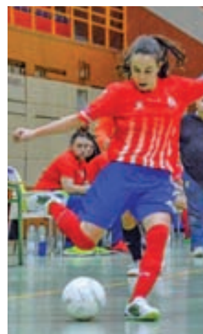
El Atlético, favorito

Los rivales de las rojiblancas serán el F.S. Vermoim de Braga, campeón nacional de Portugal; ASDC Montelsilvano, campeón de la Serie A del Calcio 5 italiano; el FC Aurora de San Petersburgo ruso, el Inter de Kiev y el VV Pernis holandés.