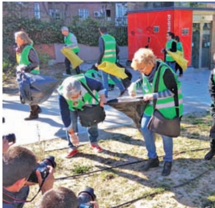
Un momento de la recogida de desperdicios

La campaña 'Nosotros ensuciamos, nosotros limpiamos' incidió en la recogida de colillas, latas, envases y excrementos de perros. Cada uno de los participantes lució una pegatina para distinguir las diferentes actividades. Los que llevaron un distintivo amarillo se encargaron de recoger latas y envases; los del azul, del papel y cartón; los de pegatinas rojas se ocuparon de colillas y chicles; y por último, los del distintivo ma-