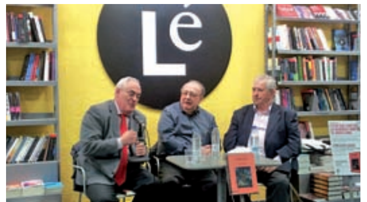
Momento de la presentación de la obra

Tras el frustrado atentado de París, unos analistas de riesgos reciben el encargo de la CIA para mejorar las condiciones de seguridad de la Sagrada Familia.