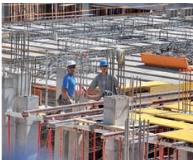
La construcción fue el sector más beneficiado