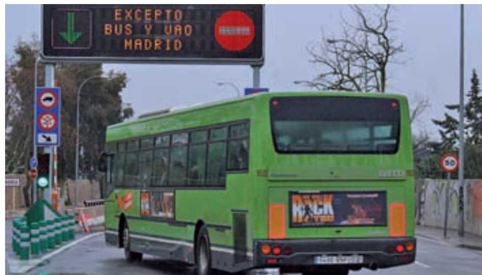
Carril Bus-VAO de la A-6 GENTE

Los Presupuestos Generales contemplan la redac-