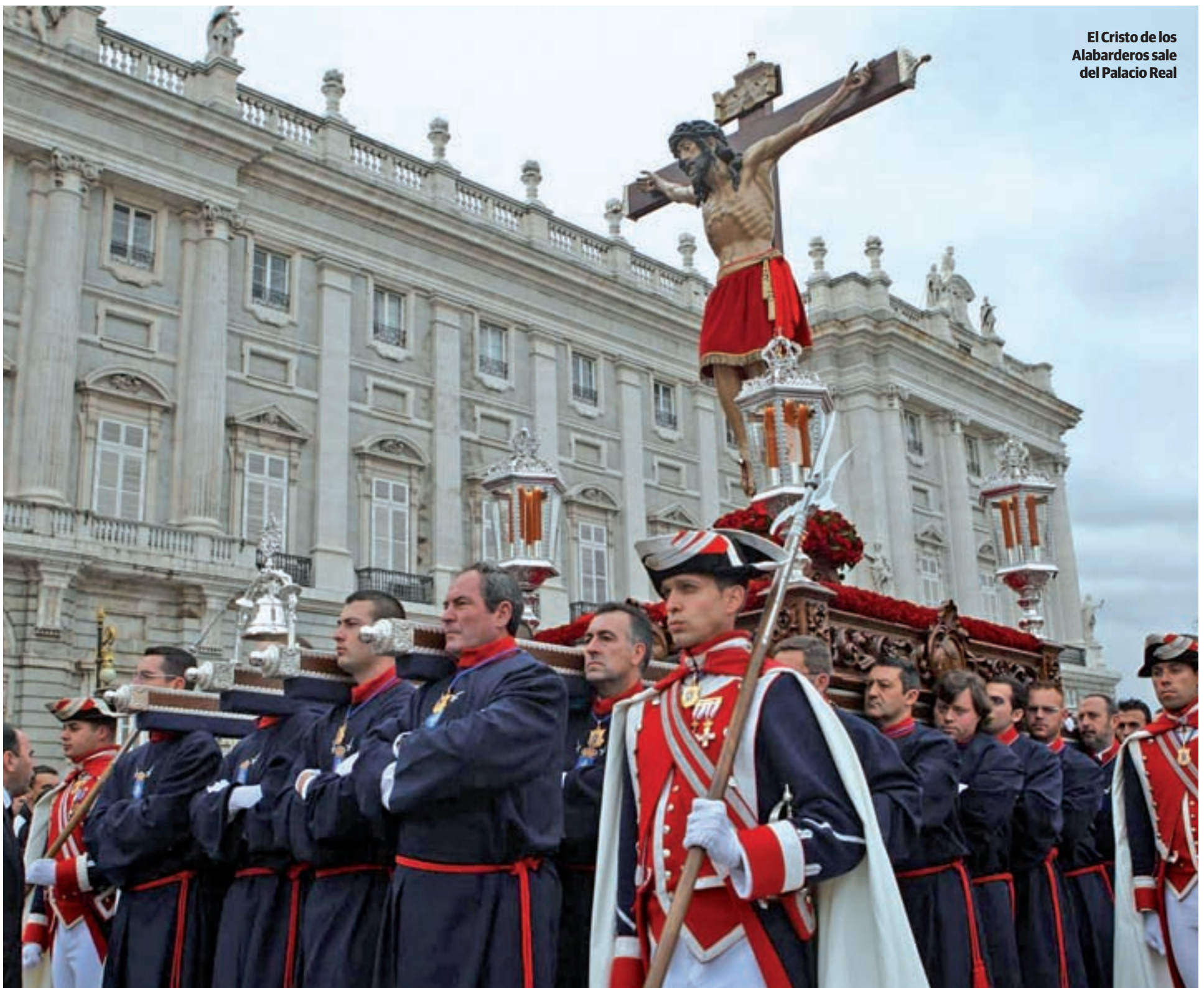
El Cristo de los Alabarderos sale del Palacio Real