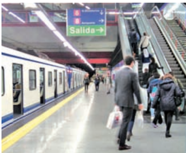
Línea 8 de Metro F. Q. / GENTE