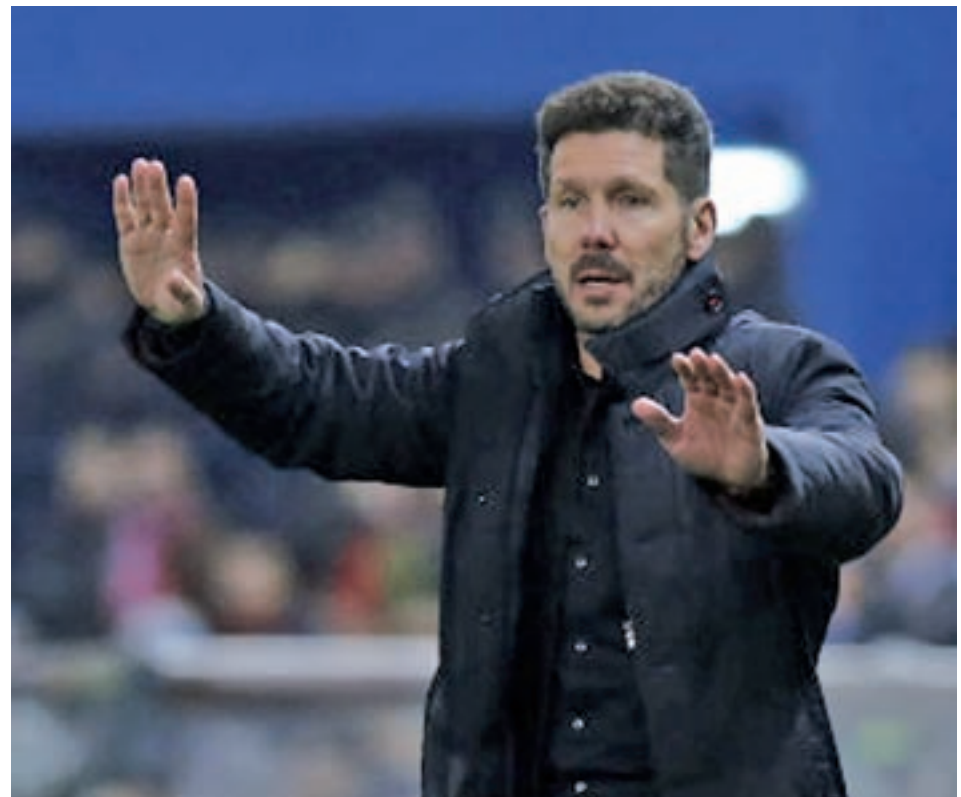
Las pizarras de Zidane y Simeone, frente a frente