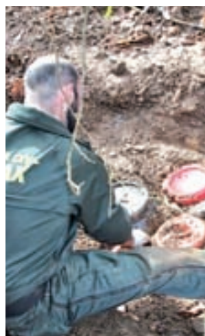
Uno de sus arsenales

En la presente operación intervendrán "varios centenares de personas de la socie-