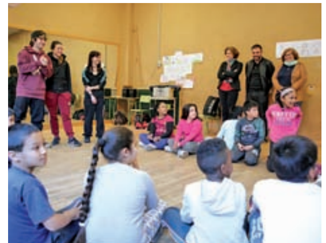
Uno de los proyectos ya en marcha

El eje social aborda, entre otras, iniciativas de refuerzo del programa de absentismo, atención a drogodependientes y portadores de VIH, dinamización del pequeño comercio o mejora de la habitabilidad en la Cañada Real.