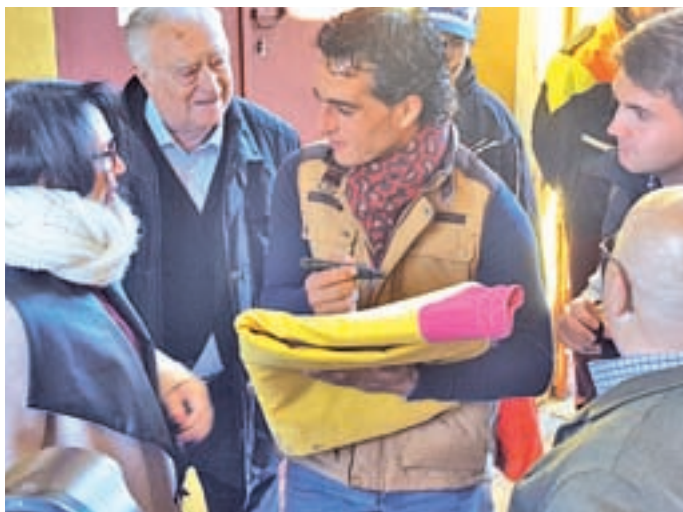
Socio de honor: El pasado domingo, Iván Fandiño fue nombrado en Guadalajara socio de honor de la Asociación de Esclerosis Múltiple de la ciudad. En la imagen, firmando el capote que les regaló a los miembros de la entidad.

“conforme” con lo que hace en la plaza. “Ha habido temporadas en las que solo pensaba en mantener el sitio que había conseguido y las presiones y exigencias no me dejaban expresarme como soy”, explica el diestro. “Ahora dejo que todo suceda y que fluya lo que llevo en mi interior”, afirma.