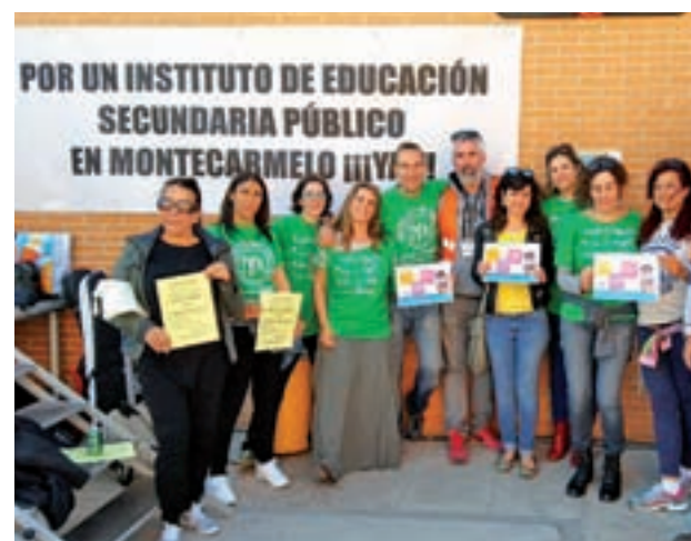
Varios de los participantes en la jornada reivindicativa

En el encuentro no faltó un programa con campeonatos de fútbol y baloncesto para niños y padres, un con-