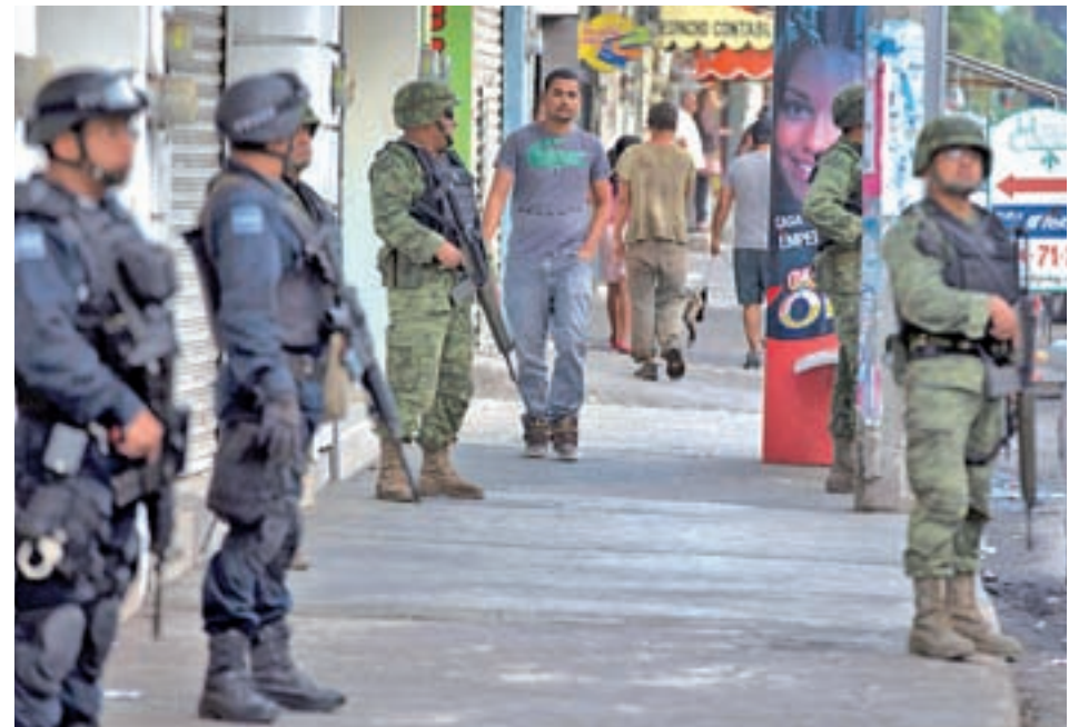
América Latina es un destino que se percibe como inseguro

Tres de cada cuatro españoles tiene en cuenta este aspecto al contratar sus vacaciones • América Latina y los países árabes son los lugares que se perciben como más peligrosos