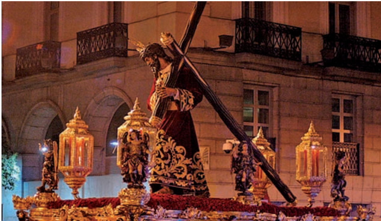
HERMANDAD DEL GRAN PODER, MADRID