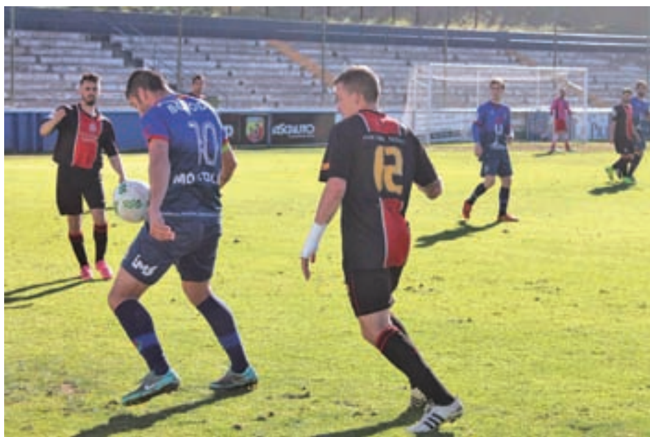
El Adarve se marchó de vacío del campo del Móstoles URJC

Son sólo 5 kilómetros de recorrido, pero la dureza del Farinato Race, la prueba que se celebrará este domingo 9 de abril en la localidad de Quijorna, la coloca como la mejor carrera de obstáculos de España.