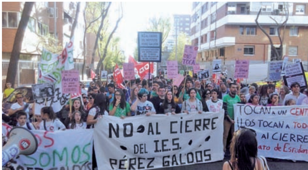
La marcha reivindicativa llegó a cortar la M-30

LA COMUNIDAD CONVERTIRÁ EL CENTRO EN ESCUELA OFICIAL DE IDIOMAS