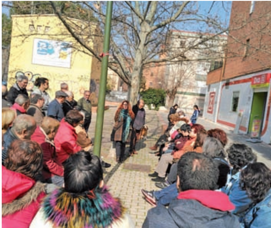
Una de las últimas reuniones de los vecinos de Opañel

“Somos conscientes de que el trámite es complejo. Además, para el cambio de uso se necesita el informe medioambiental favorable de la Comunidad de Madrid. Son tiempos largos, pero si hay voluntad política el trámite se podría hacer lo antes posible para que la construcción de la biblioteca multifuncional, el proyecto que elegimos, pudiera tener pre-