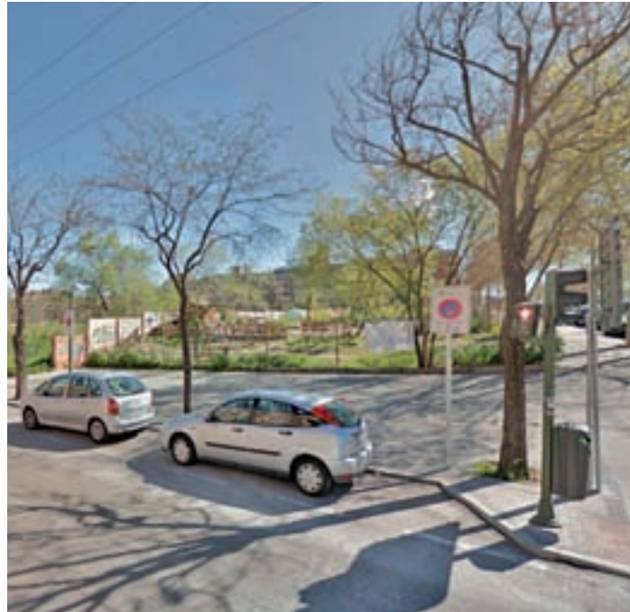
Estado actual de la zona de la actuación

El Colegio de Arquitectos elaborará dos proyectos que serán votadas por los vecinos y