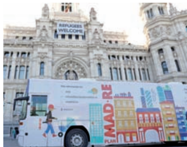
El autobús de información del Plan MAD-RE

Además, tras estudiar las propuestas presentadas por la ciudadanía solicitando incorporar otras edificaciones no incluidas en las APIRUs existentes, se dio luz verde a la ampliación de 21 de estos ámbitos para la incorporación de edificios que cum-