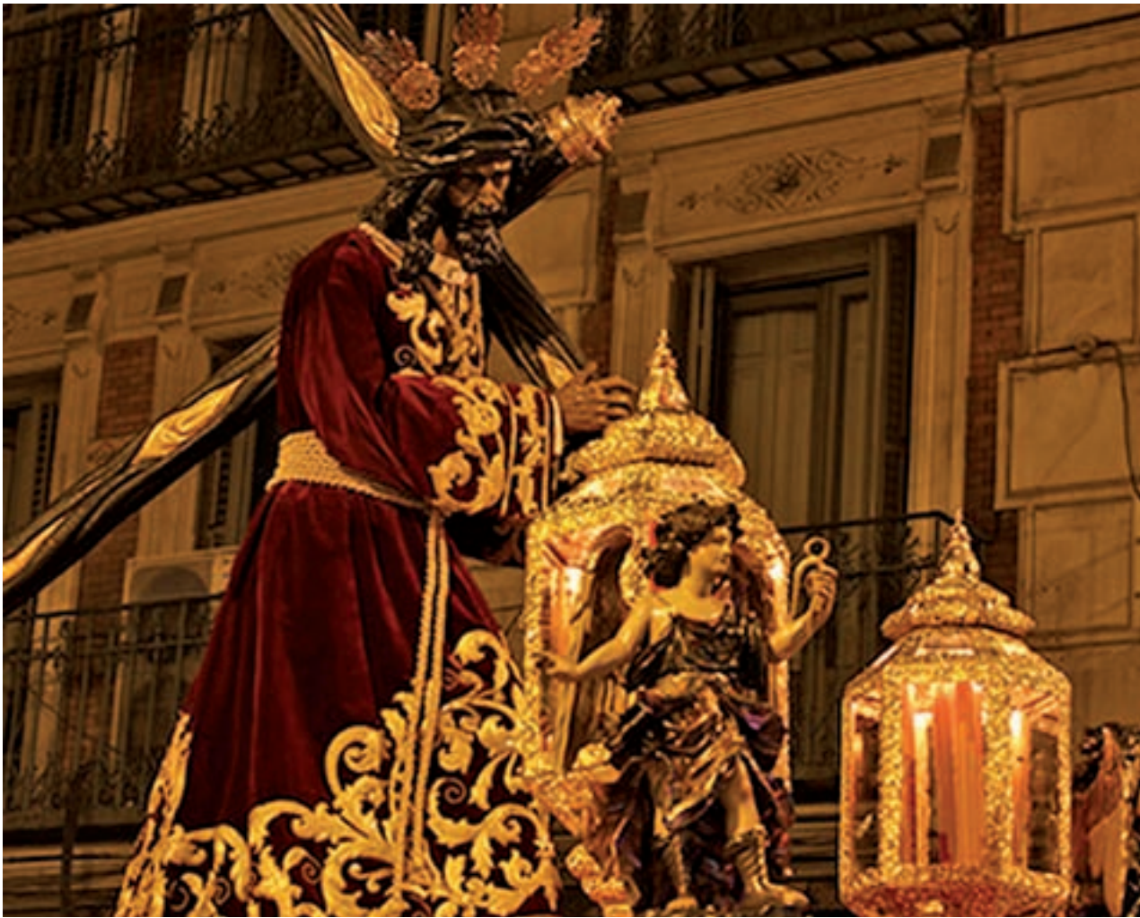
HERMANDAD DEL GRAN PODER, MADRID