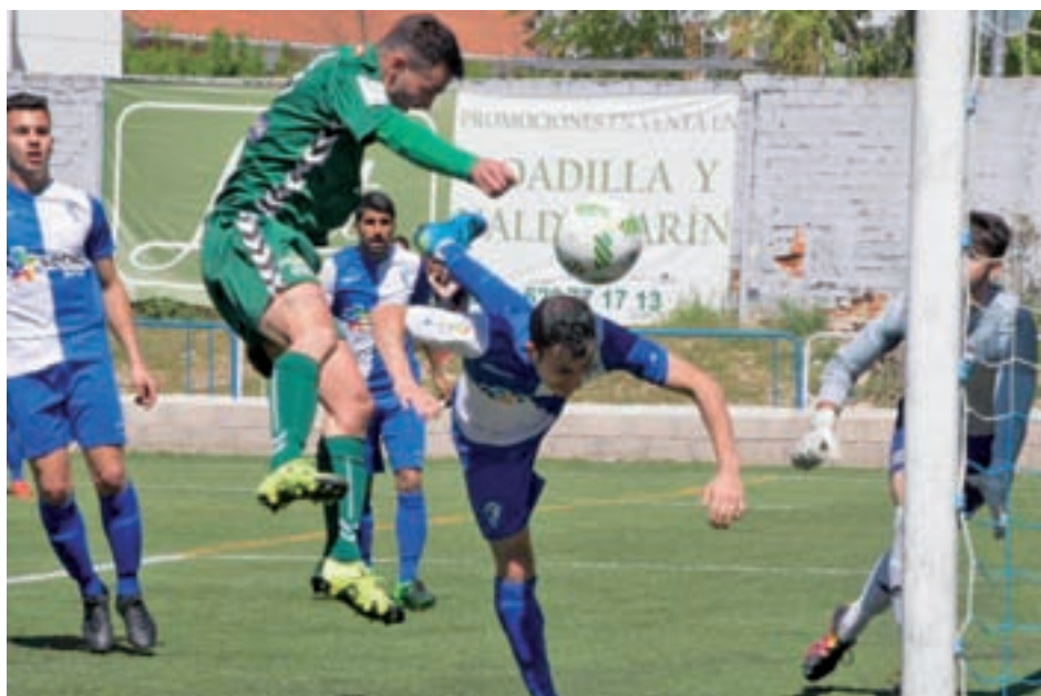
El equipo verde no pudo puntuar en su visita al campo del Aravaca JOAQUÍN MORCUENDE

Son sólo 5 kilómetros de recorrido, pero la dureza del Farinato Race, la prueba que se celebrará este domingo 9 de abril en la localidad de Quijorna, la coloca como la mejor carrera de obstáculos de España.