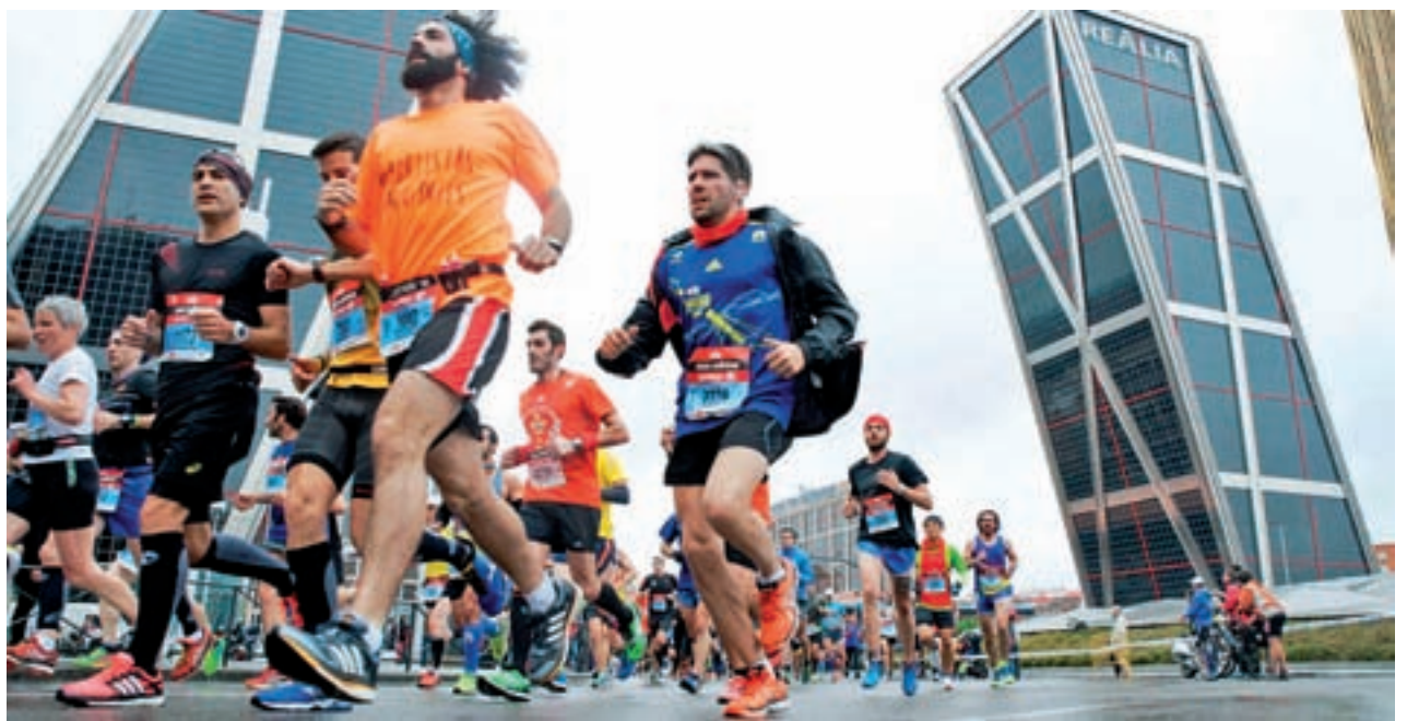
Foto de una edición anterior a su paso por Plaza de Castilla