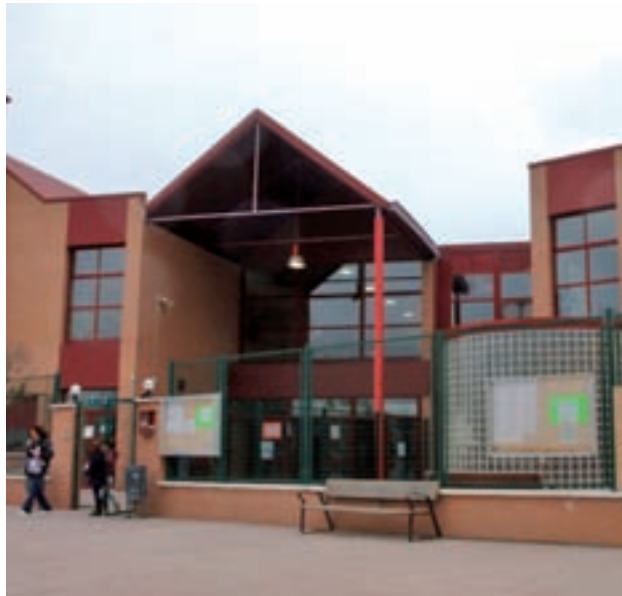
Centro escolar madrileño