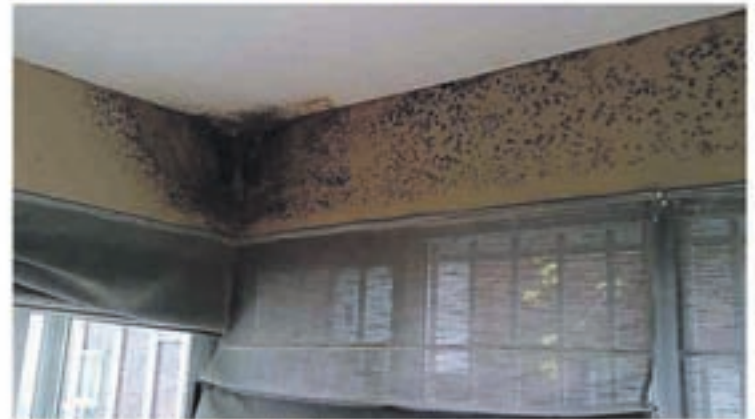
Problemas de humedad por condensación

jefe de micología en el instituto de la Salud Pública Louis Pasteur, explica este aumento por nuestro modo de vida: "Vivimos más en el interior, en casa o en el despacho. Desde los años 60, tendemos a un exceso de aislamiento para no dejar escapar el calor y además no se airea suficientemente".