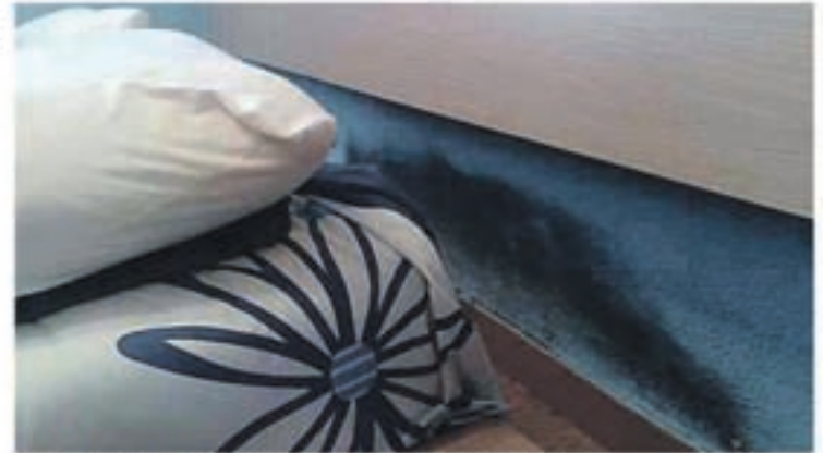
Problemas de humedad por capilaridad

Se han realizado estudios científicos sobre adolescentes que sufren afecciones respiratorias, dando como resultado un 83% de asma, bronquitis asmáticas y bronquitis crónicas y un 87% de rinitis crónicas, que alcanzan a jóvenes que viven en habitaciones demasiado húmedas. De un 20 a un 30% de nosotros sufrimos alergias respiratorias, ¡dos veces más que hace 20 años!. Edouard Drouhet,