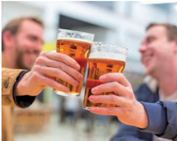
El número de cerveceras artesanas ha pasado de 21 a 361 en pocos años

Esta iniciativa supera el concepto tradicional de cerveza artesana e incorpora fabricantes de producción 100% ecológica y vegana. Las materias primas de sus variedades se obtienen sin químicos ni fertilizantes, a lo que