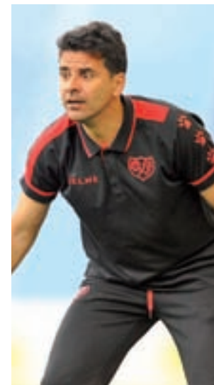
Michel, técnico rayista

A la tercera fue la vencida. Tras las fallidas experiencias con José Ramón Sandoval y Rubén Baraja, el Rayo va enderezando el rumbo en Segunda División tras la llegada al banquillo de Michel. Gracias a su triunfo por 0-1 ante el UCAM Murcia, el cuadro