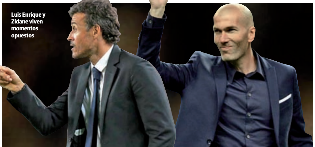
Luis Enrique y Zidane viven momentos opuestos

Pero el fútbol vuelve a ser tozudo y desafía a la realidad en un mes de abril no apto para cardíacos. La montaña rusa emocional no para y tras la vibrante noche del pasado martes con el Bayern Múnich, el estadio de Chamartín vuelve a ser el centro de atención