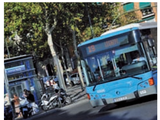
La línea 19, que conecta la Plaza de Cataluña con Legazpi

y la 19, los festivos. Por otro lado, desde el mismo día, las líneas 57 (Atocha Renfe-Alto del Arenal) y 144 (Pavones-Entrevías) modifican sus horarios de finalización. La última salida del 57 desde la cabecera de Alto del Arenal será a las 23:05 horas, cinco minutos más tarde que ahora. Por su parte, el primer servicio del 144 saldrá a las 5:55 horas, es decir, cinco minutos antes del horario actual. La primera salida desde la cabecera de Entrevías no sufre cambios y sigue siendo a las 5:35 horas.