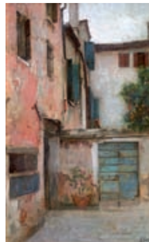
Una de las obras de Casas