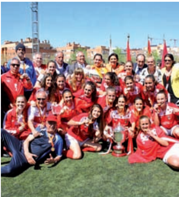
Las chicas celebraron el título por todo lo alto

Después de este importante éxito, el organismo regional ya está pendiente de lo que hagan los integrantes de la otra selección sub-18, la masculina, que este fin de semana afronta la fase final autonómica en el estadio Pedro Sancho de Zaragoza. Madrid defiende el título del año pasado, siendo Cataluña su rival en semifinales. La final se jugará este domingo 23.