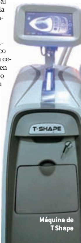
Máquina de T Shape

5: Elige un buen tratamiento estético para combatir la celulitis, el exceso de volumen y la flacidez. El mercado está lleno de opciones a priori muy apetecibles y más cuando acompañan el anuncio de una imagen de unas piernas firmes y contorneadas, pero debes ser cauta. Elige un sitio en el que te asesoren adecuadamente. En 'Todo en Belleza' disponemos de varias opciones: T-Shape o Velashape III junto a Indiba médico más el T Shock. En una sesión se pueden conseguir grandes resultados.