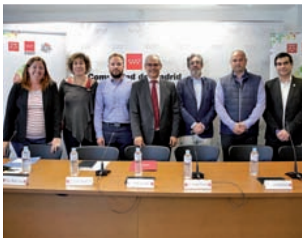
Presentación del torneo

a desarrollar los próximos 28, 29 y 30 de abril el torneo bianual de Rugby Gay Inclusivo, Union Cup. Se trata de la VII edición de este evento depor-