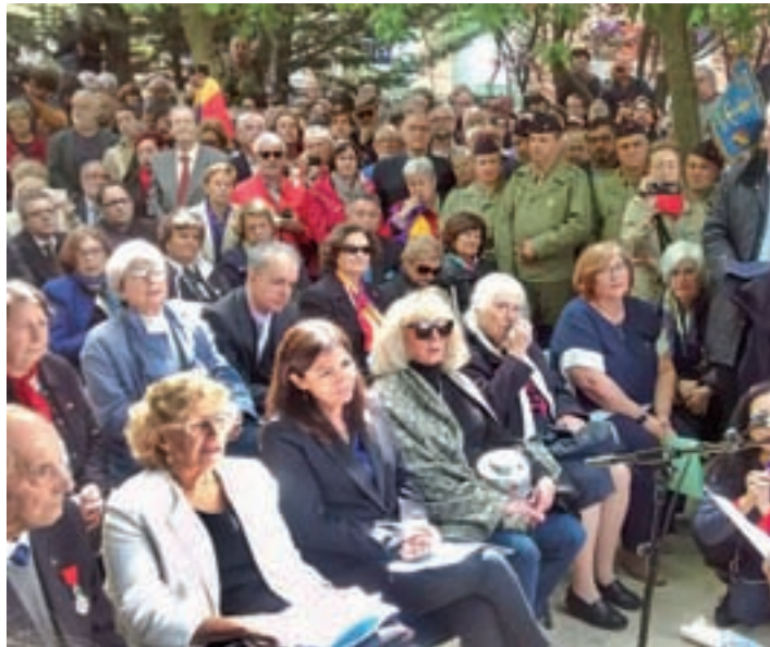
Un momento del estreno oficial de la zona verde

El Centro Cultural Príncipe de Asturias ha acogido du-