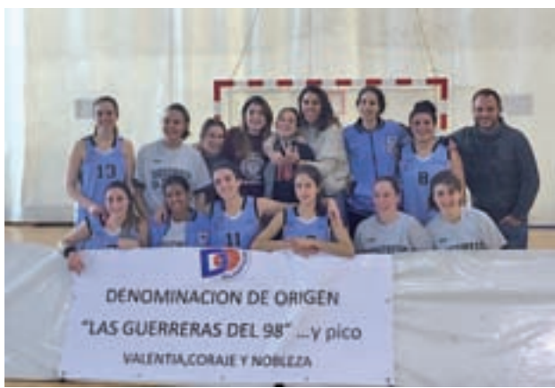
Las chicas de Segunda Autonómica deberán madrugar