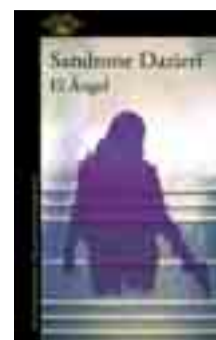
EL ÁNGEL Sandrone Dazieri. Novela.