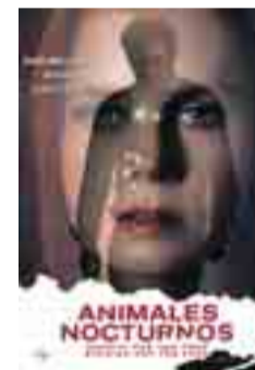
ANIMALES NOCTURNOS Dir. Tom Ford. Int. Amy Adams, Jake Gyllenhaal. Thriller.

AMOR Y AMISTAD. Dir. Whit Stillman. Int. Kate Beckinsale, Xavier Samuel. Comedia.