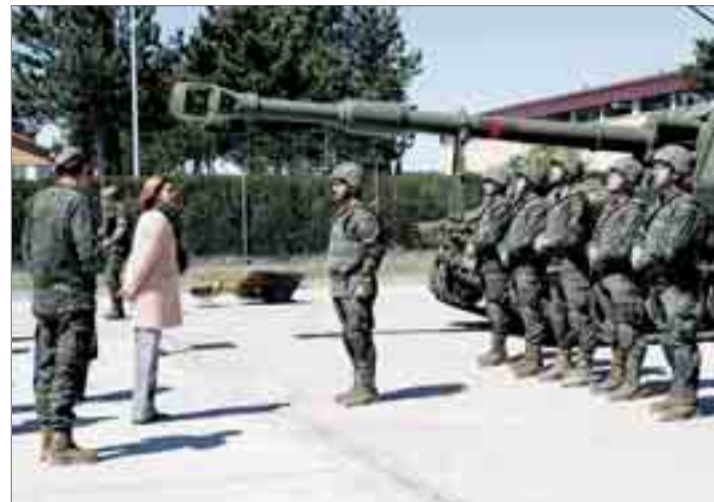
María Dolores de Cospedal visitó Burgos el miércoles 19.

Esta División es la responsable de la preparación de sus unidades y de la generación de los mandos y fuerzas que se requieran, para lo que se apoya en su Cuartel General, y dispone de capacidad tanto para participar en el planeamiento, como en la conducción y ejecución de las actividades derivadas de las misiones específicas que con carácter permanente se le asignen.