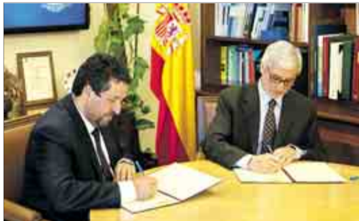
Firma del convenio entre el Instituto Geográfico Nacional y el Consorcio Camino del Cid.

Para ello, el Consorcio facilitará al Instituto Geográfico Nacional toda la información geográfica del