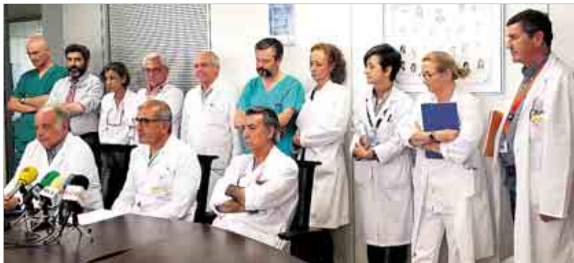
Los miembros de la Subcomisión de Programación Quirúrgica del HUBU comparecieron el jueves 20 en rueda de prensa.

La polémica en torno a la gestión de la lista de espera quirúrgica del HUBU surge después de que el procurador de IU-Equo, José Sarrión, denunciara el día 18 en el Pleno de las Cortes de Castilla y León la existencia de un documento oficial -difundido por la Plataforma Sanidad Pública Sí en redes sociales- en el que se indica "tener en cuenta" una serie de actuaciones de cara al cierre del mes de marzo de los resultados de la LEQ. Entre ellas, "contener, en la medida de lo posible, las entradas en LEQ en lo que