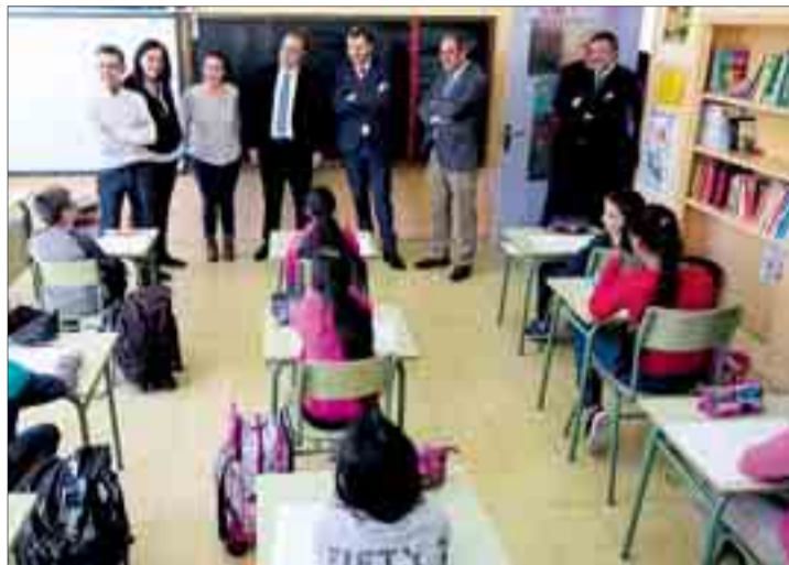
El consejero de Educación durante la visita a una de las aulas del centro, el jueves 20.

En este sentido cabe destacar que las nuevas instalaciones permitirán duplicar la capacidad del