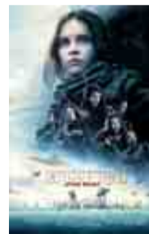
ROGUE ONE: UNA HISTORIA DE STAR WARS Dir. Gareth Edwards. Int. Felicity Jones, Diego Luna. Ciencia-Ficción.