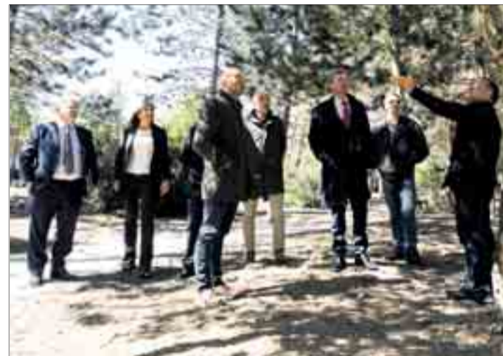
El alcalde y la responsable de Medio Ambiente visitaron la zona el jueves 20.

El resto de actuaciones comprende, entre otras, la renovación de las zonas en mal estado del pavimento de los caminos principa-