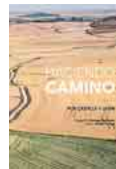
HACIENDO CAMINO POR CASTILLA Y LEÓN Santiago Escribano / Ovidio Campo. Viajes / Fotografía.

Luz y Vida Arco del Pitar, 8 (Lain Calvo)