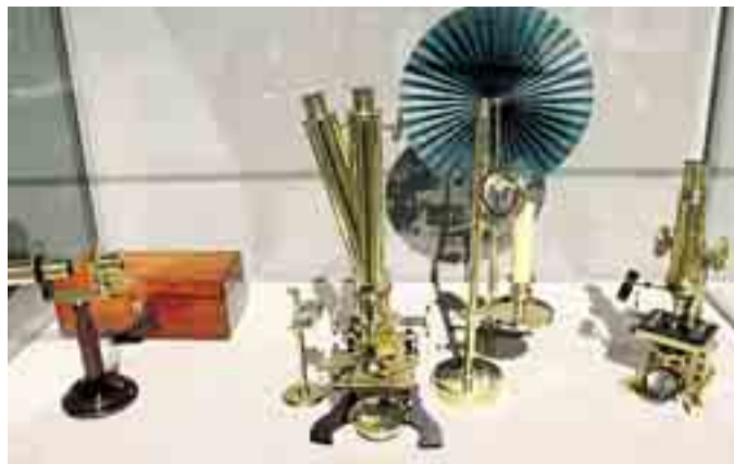
La exposición presenta una selección de instrumentos que recorren la historia de la microscopía óptica.