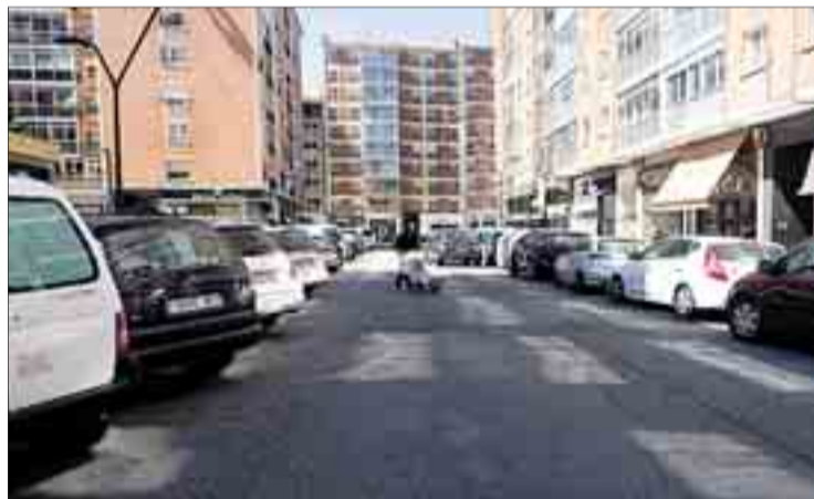
La falta de aparcamientos es uno de los principales problemas del barrio de Gamonal.

Con el mismo fin, resolver el problema de plazas, el PSOE también plantea que el denominado "aparcamiento disuasorio", cuya utilización "es muy escasa", se convierta en un aparcamiento vigilado durante las 24 horas del día, se definan accesos rápidos desde la calle Vitoria y que lo gestione la Sociedad de Promoción, entre otras medidas.