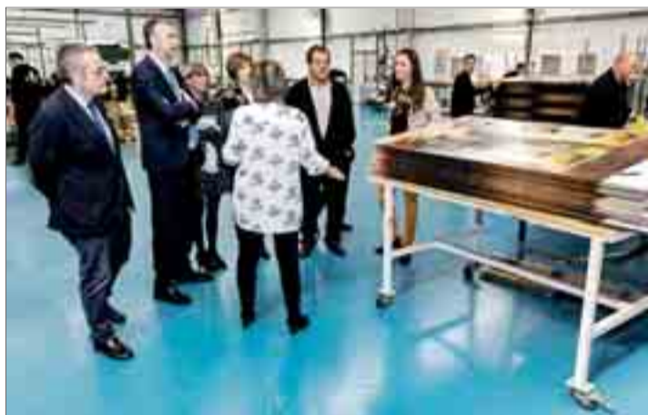
El rector de la Universidad acompañado de responsables del centro de APACID.

Cabe recordar que el último proyecto en el que colaboró la