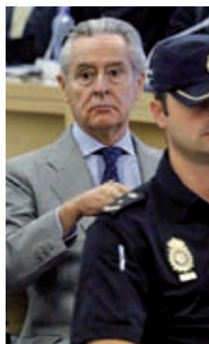
Juicio de las 'black'

Así se desprende del barómetro del Centro de Investigaciones Sociológicas (CIS),