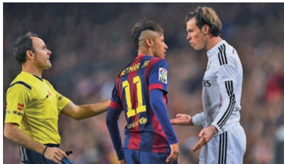
Neymar y Bale, en el 'Clásico' de la temporada 2014-2015

do con tres partidos de suspensión por menosprecio al árbitro, una decisión que impedirá al '11' azulgrana estar en el Santiago Bernabéu. Sin él, la 'MSN' pierde a uno de sus efectivos, un jugador que ha tenido un