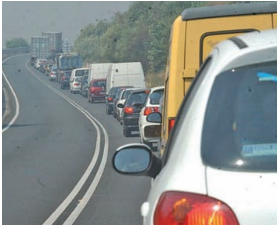
Grandes atascos en la entrada a Madrid

No obstante, los mayores atascos de esta Semana Santa se produjeron el Domingo de Resurrección, mayoritariamente en los accesos a la Comunidad de Madrid, siendo la A-5 uno de los focos más