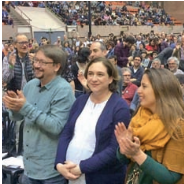
La alcaldesa de Barcelona, Ada Colau, con parte de su equipo

Con el fin de que no se trate de un plan de consulta unilateral en el que solo tomen la palabra los independentistas, la consejera de Presidencia y portavoz del Gobierno catalán, Neus Munté, ha lla-