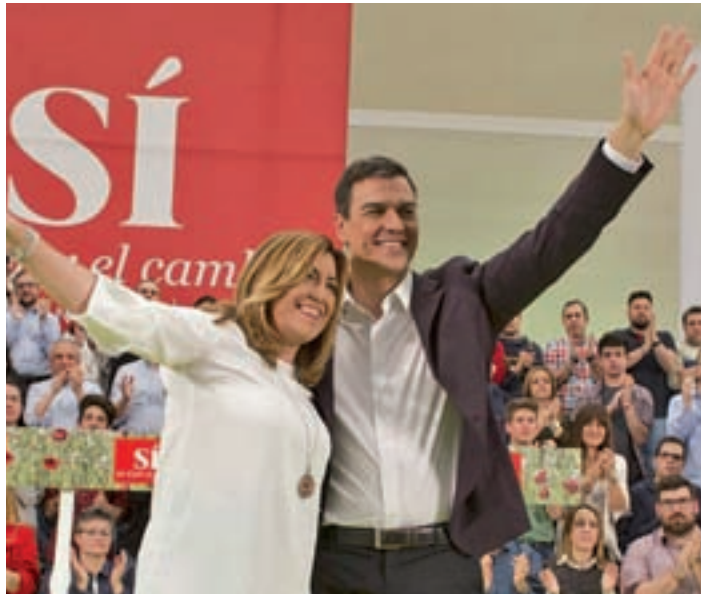
Susana Díaz y Pedro Sánchez

Susana Díaz aspira a presentar varios miles de respaldos, empujada sobre todo por las cifras de militancia en el PSOE andaluz, que con 45.000 miembros es la federación socialista más numero-