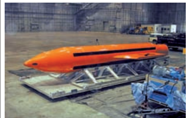
La bomba lanzada por los estadounidenses

En la campaña de este año la DGT ha prestado atención especial a las carreteras secundarias, donde se ha intensificado la vigilancia por tierra y por aire, al ser donde se producen el 78% de las víctimas mortales y las más peligrosas, según los datos del organismo.