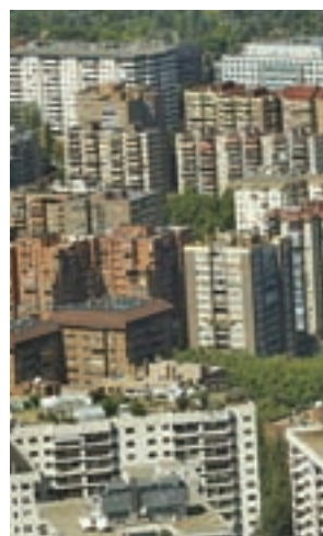
Viviendas en Madrid

Respecto al resto de comunidades autónomas, las de mayor número de hipotecas constituidas sobre viviendas en febrero son Andalucía (4.417), seguida de Madrid y Cataluña (3.891). Las únicas comunidades con tasas de variación mensuales positivas en el número de hipotecas sobre viviendas han sido Cantabria (12,1%), Galicia (3,3%) y la Región de Murcia (2,6%).