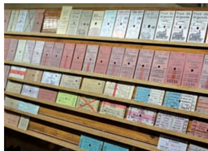
Piezas de valor en el museo: Antes de comenzar el viaje en tren, el pasajero podrá disfrutar del museo, donde encontrará objetos de diferentes etapas de la historia de los ferrocarriles, con especial presencia de aquellos relacionados con el 'Tren de Arganda'.

Quienes se acerquen hasta Arganda del Rey, en una visita recomendable para fami-