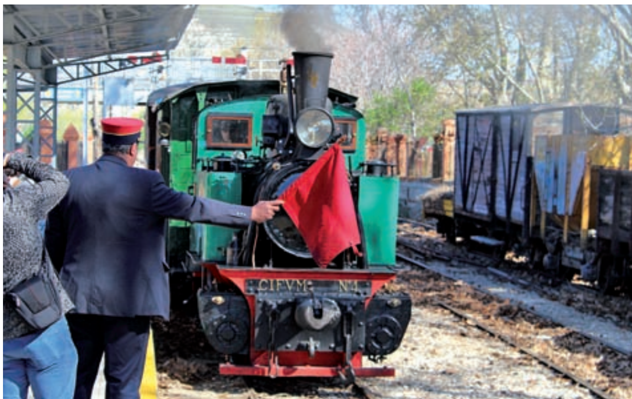
Los pasajeros suben a los vagones en el apeadero de La Poveda A.E./GENTE