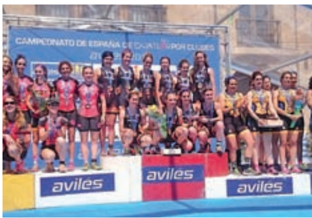
Las chicas del Diablillos de Rivas