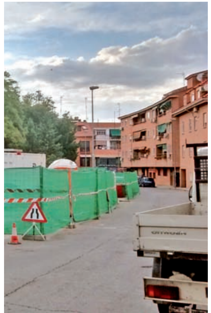
Viviendas afectadas por las obras del Metro

afectados por las obras de la Línea 7B del suburbano, explica a GENTE que el presupuesto invertido por la Comunidad se va a destinar a reformar los edificios que “ellos reconocen, que son 81 viviendas y un local comercial situados en las calles Pablo Olavide y Rafael Alberti”, pero que todavía hay edificaciones sin incluir. Además, Rodríguez añade que ya es la tercera vez que modifican el presupuesto, ya que “siempre se quedan cortos”, así que espera que con esta ampliación de la inversión sean capaces de acometer las obras que tenían planificadas. El portavoz asegura que siguen luchando para que se incluya al resto de casas que están dañadas y que el Gobierno regional no admite que han sido dañadas por las obras del Metro, ya que en sus palabras “es una vergüenza que se escuden en una sentencia judicial, ya que las viviendas que reclamamos que se incluyan están situadas a lo largo de la trayec-