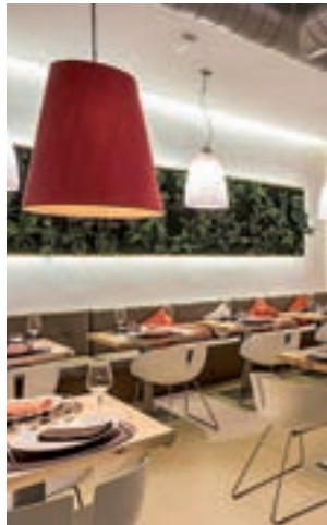
Salón grande del restaurante

Asturias se va a instalar en Madrid por unos días, gracias al restaurante La Barra de Pelotari, que organiza entre el 4 y el 6 de mayo sus Jornadas Gastronómicas Asturianas. Un menú degustación que convence y que comienza con una ensalada de verdinas con vinagreta de pulpo y judías verdes; que sigue con un semiguiso de setas y hongos de temporada (la estrella del menú para este periódico); y que continúa con fritos de pichín con pisto ligero y con un cachopín de ternera, que dejará en Madrid una de las mejores versiones de este plato asturiano tan de moda. Como broche final, arroz con leche y 'Tiramiasur'.