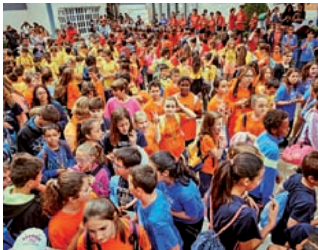
Edición anterior de las Olimpiadas Escolares

lleva celebrando desde hace 16 años. A él asisten alumnos de 3º a 6º de primaria y cada día, participan los niños de uno de los cursos. Los participantes provienen de 17 centros educativos del municipio. El Consistorio ripense ha querido resaltar la labor de los profesores de educación física, que son los que hacen posible la celebración de estas jornadas.