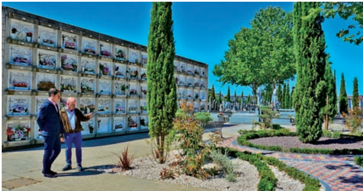
Una de las zonas en las que se han llevado a cabo las mejoras

Actualmente hay varios proyectos en marcha en Torrejón y otros que ya han finalizado para mejorar las calles y vías de la ciudad. Destaca la construcción de un acceso a la estación de Cercanías en la parte sur de la ciudad, que terminará previsiblemente en verano, o la mejora de la señalización horizontal en la calzada en algunas calles de la localidad, iniciativa que finalizó en el mes de marzo.