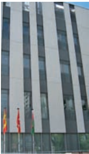
Comisaría del municipio