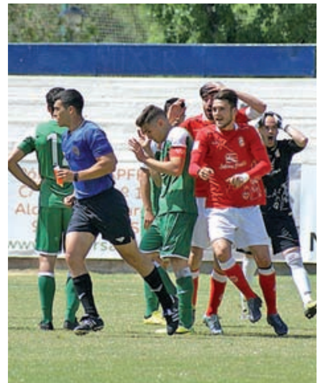
Derrota importante marcada por la actuación del árbitro

Los alcalaínos acabaron el partido ante el Leganés B con la derrota como resultado. Los dos equipos salieron al terreno de juego con una gran intensidad, conscientes de lo