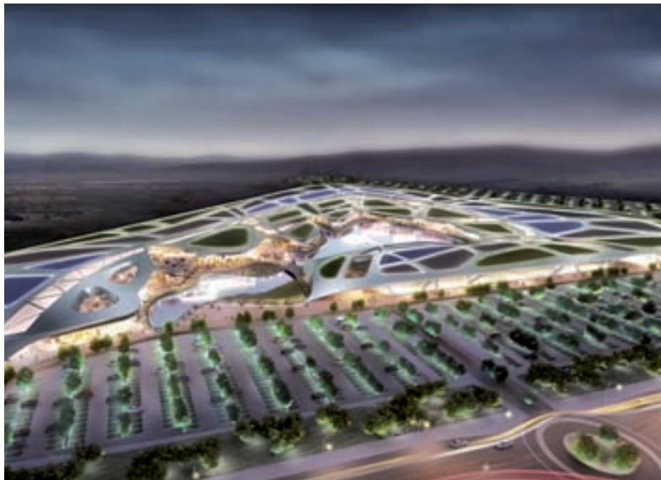
Boceto del proyecto que se va a desarrollar

El nuevo macro centro comercial estará situado en el Polígono Casablanca del municipio, en una parcela adquirida por la empresa con un tamaño de 65.000 metros cuadrados. La ubicación se encuentra a pocos minutos del Aeropuerto Adolfo Suárez Madrid-Barajas, y se puede acceder fácilmente desde la autovía A-2. Las instalacio-