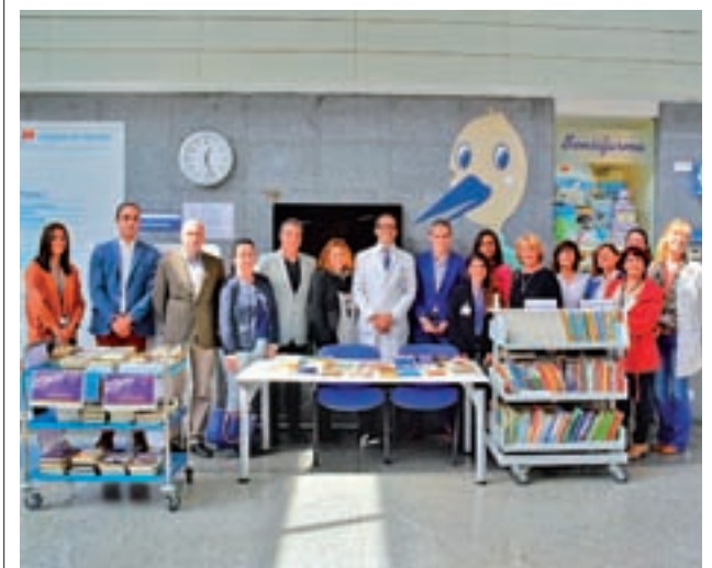
Algunos ejemplares de la biblioteca del Hospital

Paralelamente al desarrollo de este centro comercial, también se pretende desarrollar un 'outlet' tipo villa, en el que se comercialicen productos de marca a un precio menor.