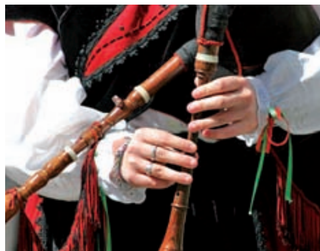
El mejor marisco se da cita en Alcobendas

¿Eres de los que se entusiasman con las palomitas? Estás de enhorabuena porque ha abierto sus puertas en el barrio de Malasaña (C/Espíritu Santo, 20), 'All Pop', donde los nuevos sabores como violeta, cola, coco, sandía o queso cheddar dan un toque especial a este producto. GENTE se queda con las de fresa.