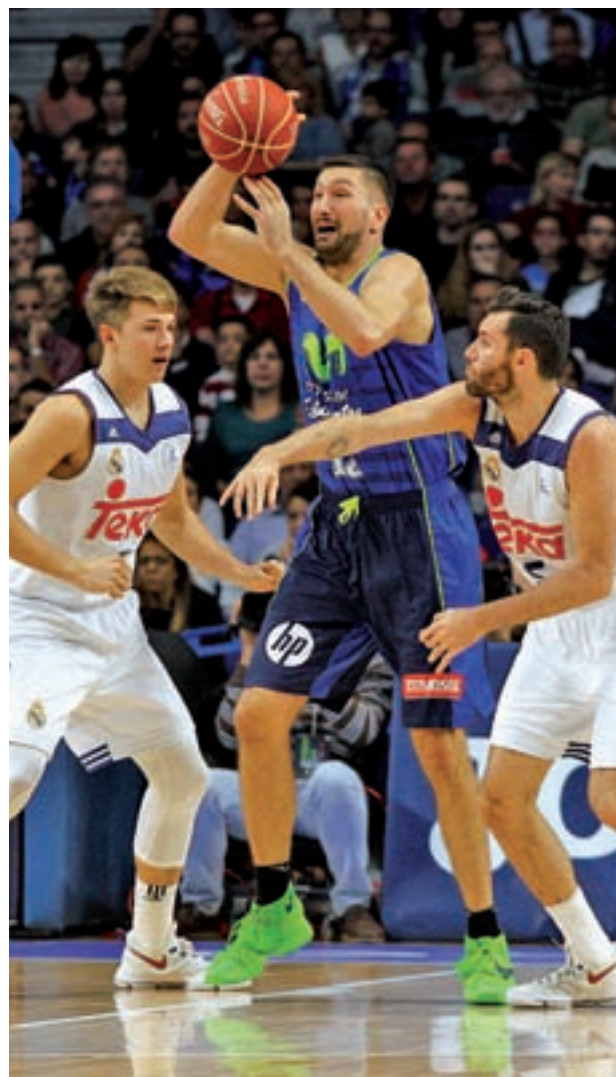
El partido de la primera vuelta acabó 88-96

Este domingo 30 de abril (18:30 horas) los dos conjuntos de la capital volverán a verse las caras sobre el parqué del Wizink Center, un escenario que ya fue testigo de excepción de un gran espectáculo en el choque de la primera vuelta. En aquella ocasión la moneda acabó cayendo del lado de los blancos, quienes tuvieron que sudar de lo lindo para doblegar a sus vecinos. El resultado final, 88-96, refleja la intensidad con la que se vivió un derbi en el que los colegiales se marcharon al descanso con una ventaja de cinco puntos.