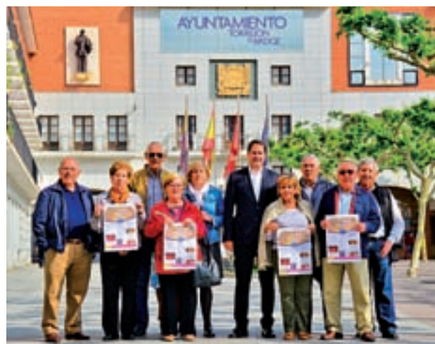
Presentación de la programación

Además de las artes escénicas, también habrá lugar para otro tipo de actos en esta semana. El día 16 girará en torno a la salud, con una sesión de gimnasia al aire libre, y la charla coloquio 'Dolor crónico y bienestar, ¿es posible?'. El miércoles 17 se presentará el libro 'Tienes una abeja en el bastón'. En esta misma jornada también se celebrará el Encuentro Musical Intergeneracional en el Salón de Actos de Fronteras