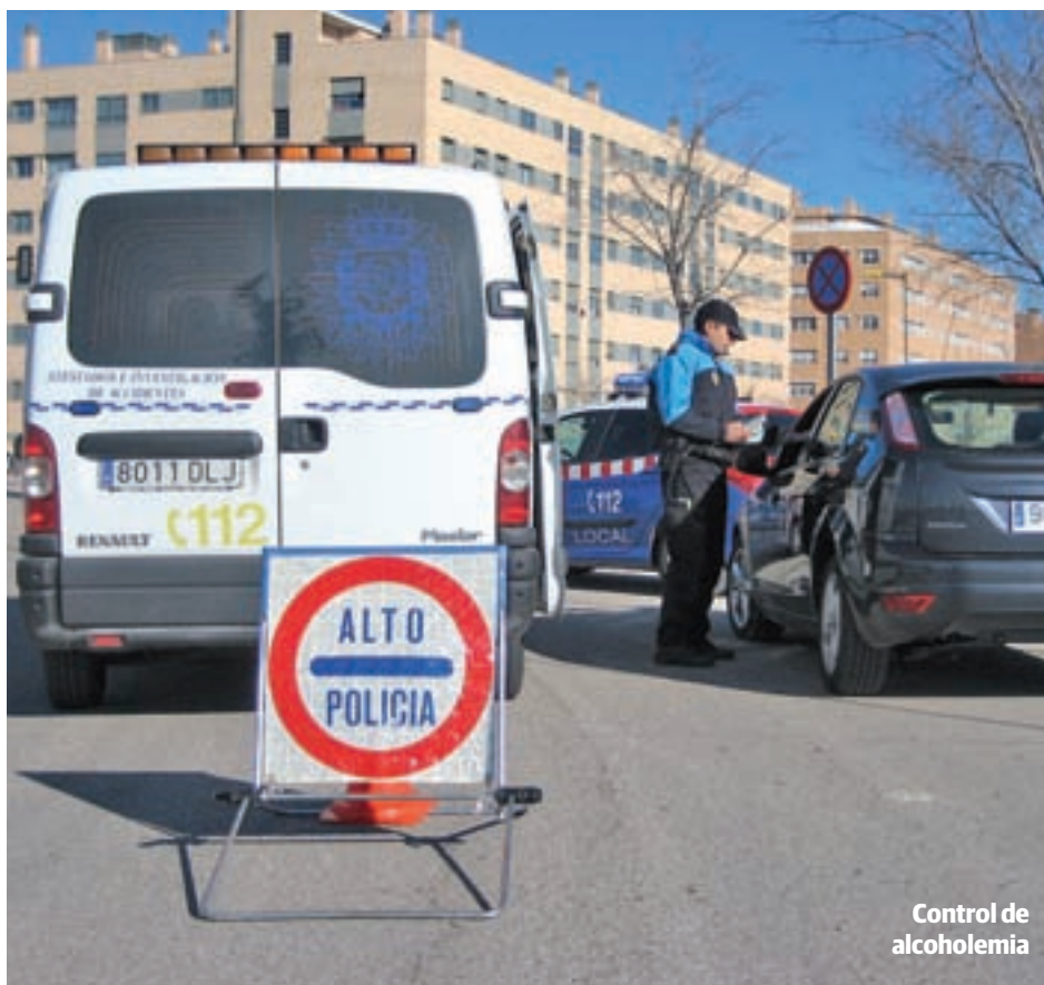
Control de alcoholemia

La distribución de estas infracciones no es homogénea a lo largo y ancho del país. Baleares, Murcia y Galicia lideran esta particular clasificación, superando con creces la media nacional, que fija que el 1,36% de los conductores ha sido condenado por infringir el código de circulación. También están por en-