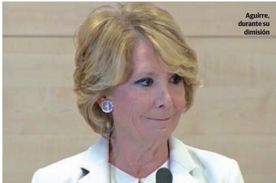
Aguirre, durante su dimisión

“No vigilé a Ignacio González todo lo que debía”. Con estas palabras acababa este lunes la carrera política de Esperanza Aguirre, uno de los personajes más importantes del panorama nacional y regional en los últimos años. Después de 34 años y tras haber sido concejal del Ayuntamiento de Madrid (en dos etapas), ministra de Educación, presidenta del Senado, presidenta de la Comunidad de Madrid y portavoz municipal, la Operación Lezo contra la corrupción ha supuesto el final de su trayectoria.