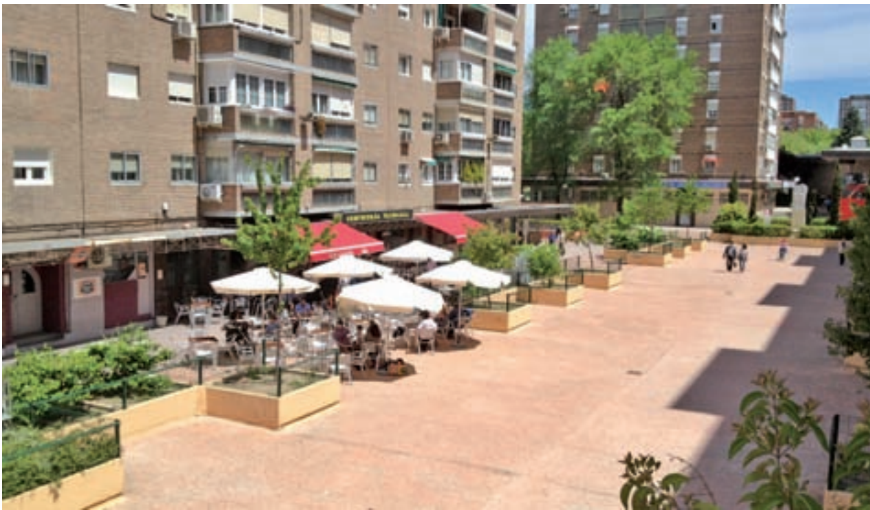
La zona de ocio más emblemática del distrito, situada en el entorno de la calle de Marroquina