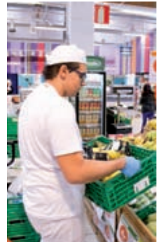
Participante en Incorpora

Incorpora ofrece a estas compañías un servicio gratuito de asesoramiento y acompañamiento para inte-