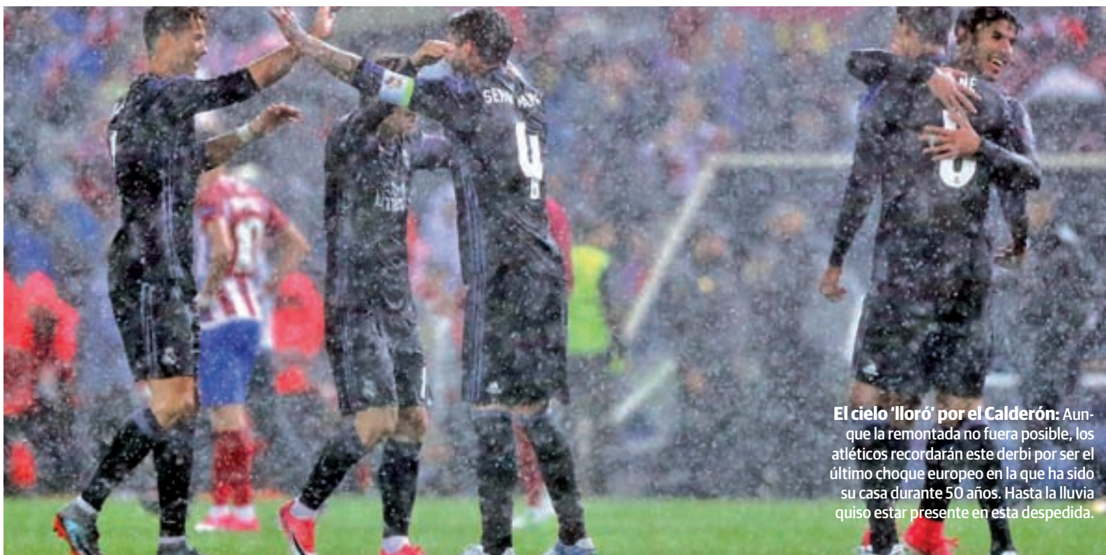
El cielo 'lloró' por el Calderón: Aunque la remontada no fuera posible, los atléticos recordarán este derbi por ser el último choque europeo en la que ha sido su casa durante 50 años. Hasta la lluvia quiso estar presente en esta despedida.