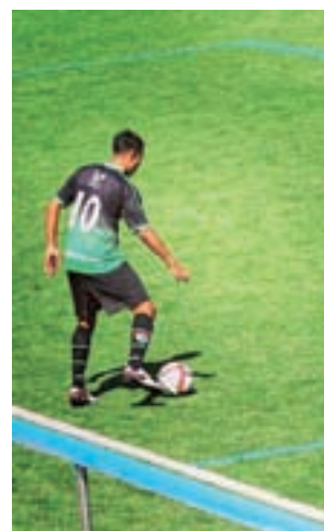
Nuevo triunfo de la ED