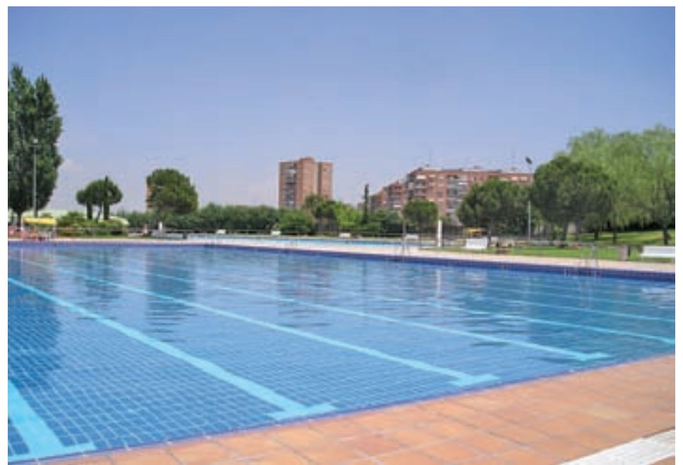
Las instalaciones del polideportivo de Hortaleza

Además, el Ayuntamiento de Madrid mantiene en 2017 el mismo precio de las entradas a las piscinas del 2016. Las tarifas para adultos es de 4,50€, un joven hasta los 26 años 3,60€, infantil 2,70€ y las personas mayores 1,35€, teniendo en cuenta que estos precios se rebajan notablemente utilizando el Bono