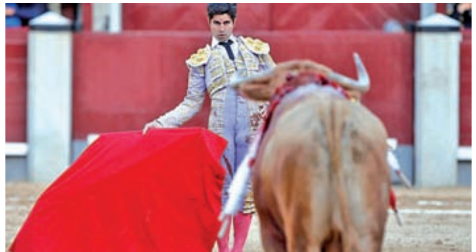
La tarde del 1 de mayo LAS VENTAS