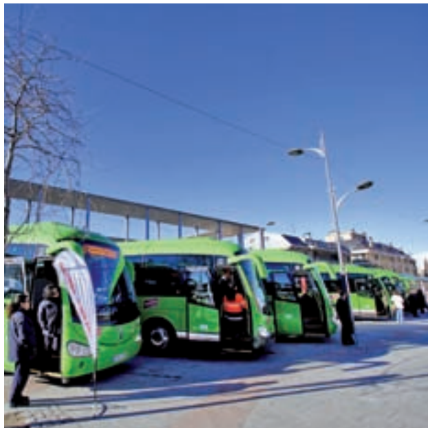
Autobuses interurbanos de la Comunidad

Otro de los cambios es el relativo a las sillas de ruedas eléctricas de tipo 'scooter', que hasta ahora tenían el