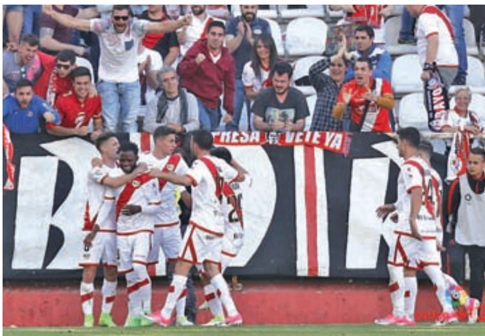
El Rayo se impuso por 2-1 al Levante