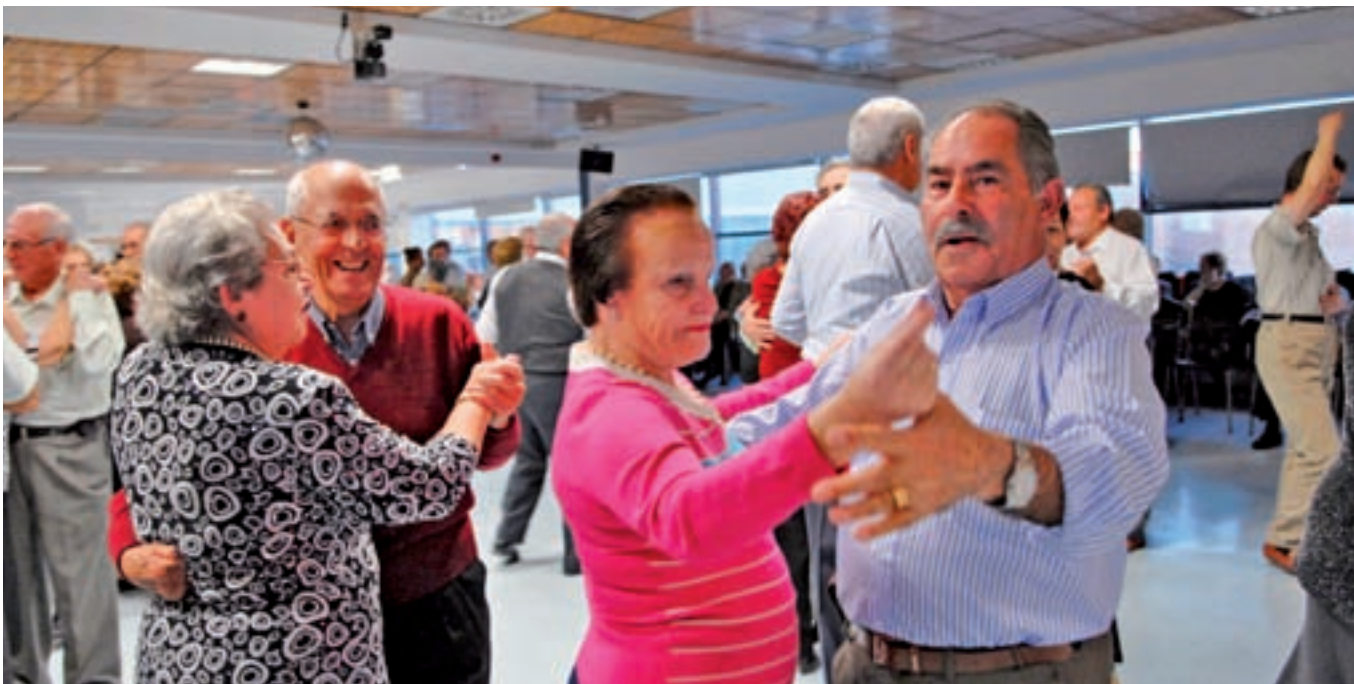
Los mayores madrileños viven más que sus vecinos europeos GENTE