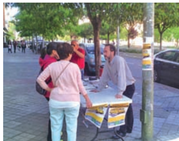
Una de las mesas de recogida de apoyos AFUVEVA

Los residentes explican que sus autobuses "tienen esperas muy altas con trayectos eternos". "Llegar en 15 minutos al Hospital Gregorio Marañón o a zonas del centro es una verdadera necesidad social", dicen desde Afuveva.