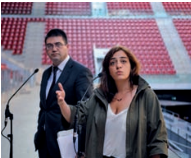
Los concejales de Ahora Madrid, en la Caja Mágica