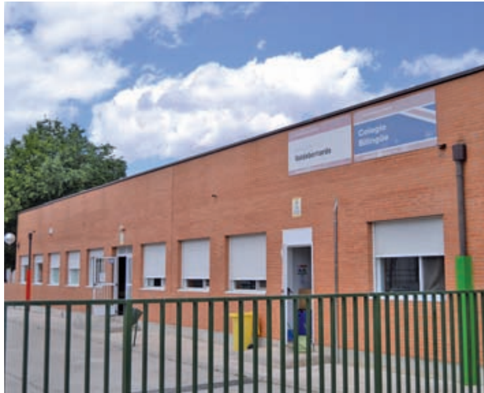
El centro educativo situado en el Bulevar de Indalecio Prieto

A raíz de los hechos, el propio instituto situado en el distrito de Vicálvaro ha abierto un