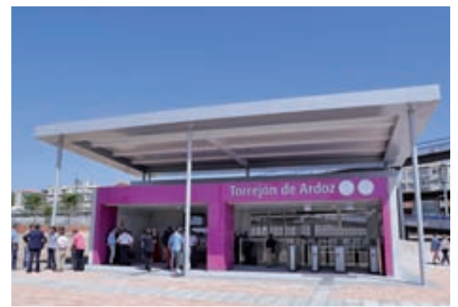
La nueva entrada a la estación

tación de Cercanías en la localidad, la de Soto del Henares, la creación de una nueva oficina de transporte público o el incremento de los trenes Civis, que realizan el trayecto entre el municipio y la capital madrileña reduciendo así el tiempo de llegada.