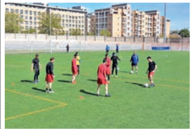
Plantilla del CD Coslada

Los madrileños jugarán su décimoquinta final liguera y tratarán de hacerse con su duodécima victoria, mientras que los azulgrana disputarán la quinta final de este campeonato e intentarán llevarse el cuarto trofeo a sus vitrinas.