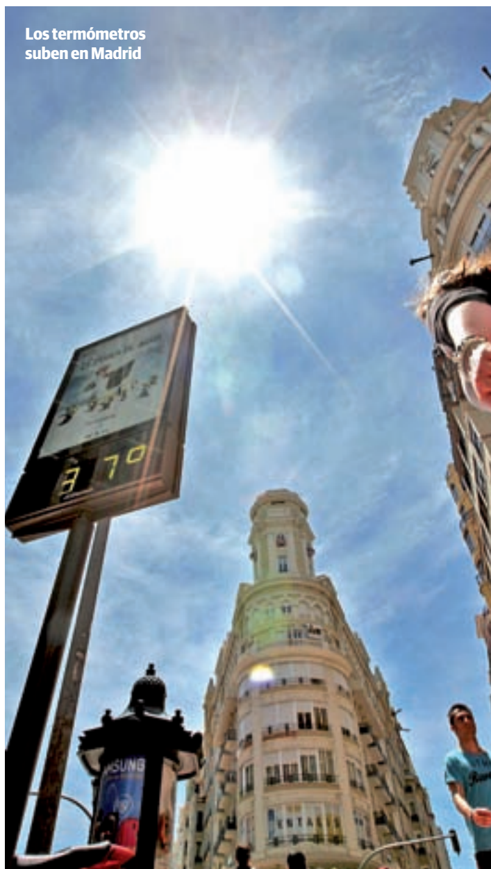
Los termómetros suben en Madrid

LAS ALERTAS SE PODRÁN RECIBIR EN EL MÓVIL O CONSULTAR EN TWITTER