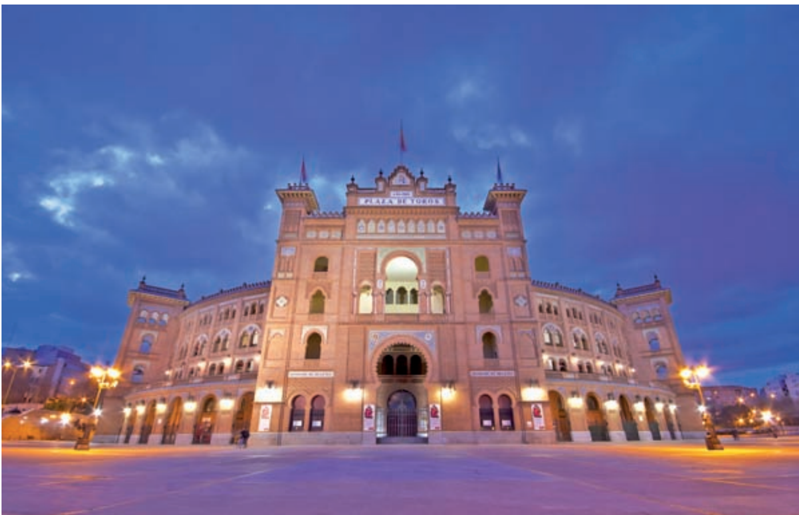
Exteriores de la plaza de toros de Las Ventas