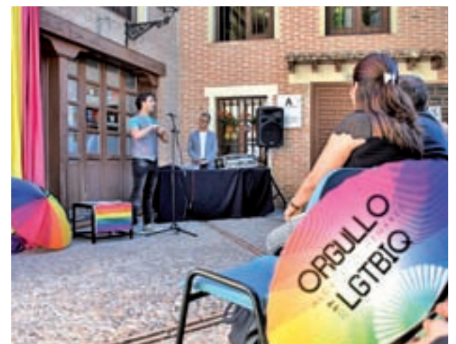
Presentación de los actos en Alcalá

Desde el Consistorio explican que el objetivo es apoyar la diversidad afectivo-sexual y que para ello “se han involucrado muchos colectivos, no sólo los centrados en los derechos LGTBIQ, para visibilizar su apoyo”.