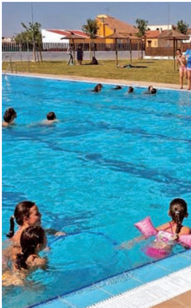
Niños en una piscina

El socorrista se encontraba practicándole a la víctima las maniobras de reanimación cardiopulmonar con la ayuda de un desfibrilador cuando llegaron las asistencias. Los sanitarios desplazados hasta el lugar de los hechos continuaron con las tareas y consiguieron recuperar momentáneamente el pulso del pequeño, pero éste volvió a entrar en parada car-