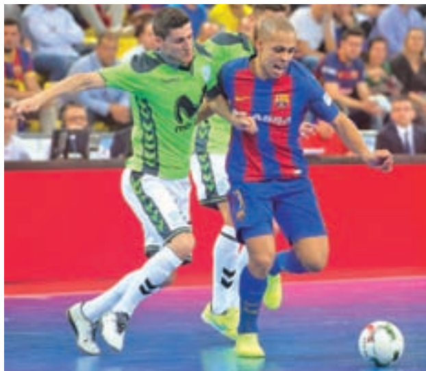
Choque histórico en la final

El Movistar Inter sentenció las semifinales con rotundidad, ganando sus dos primeros partidos ante el Magna Gurpea y sin necesidad de llegar al tercero. Tercer partido que sí que tuvo que dispu-