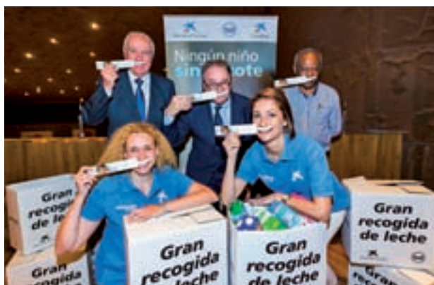
Presentación de la campaña

Las 5.097 oficinas de CaixaBank desplegadas por todo el territorio español recibirán donaciones físicas de cartones de leche entre el 12