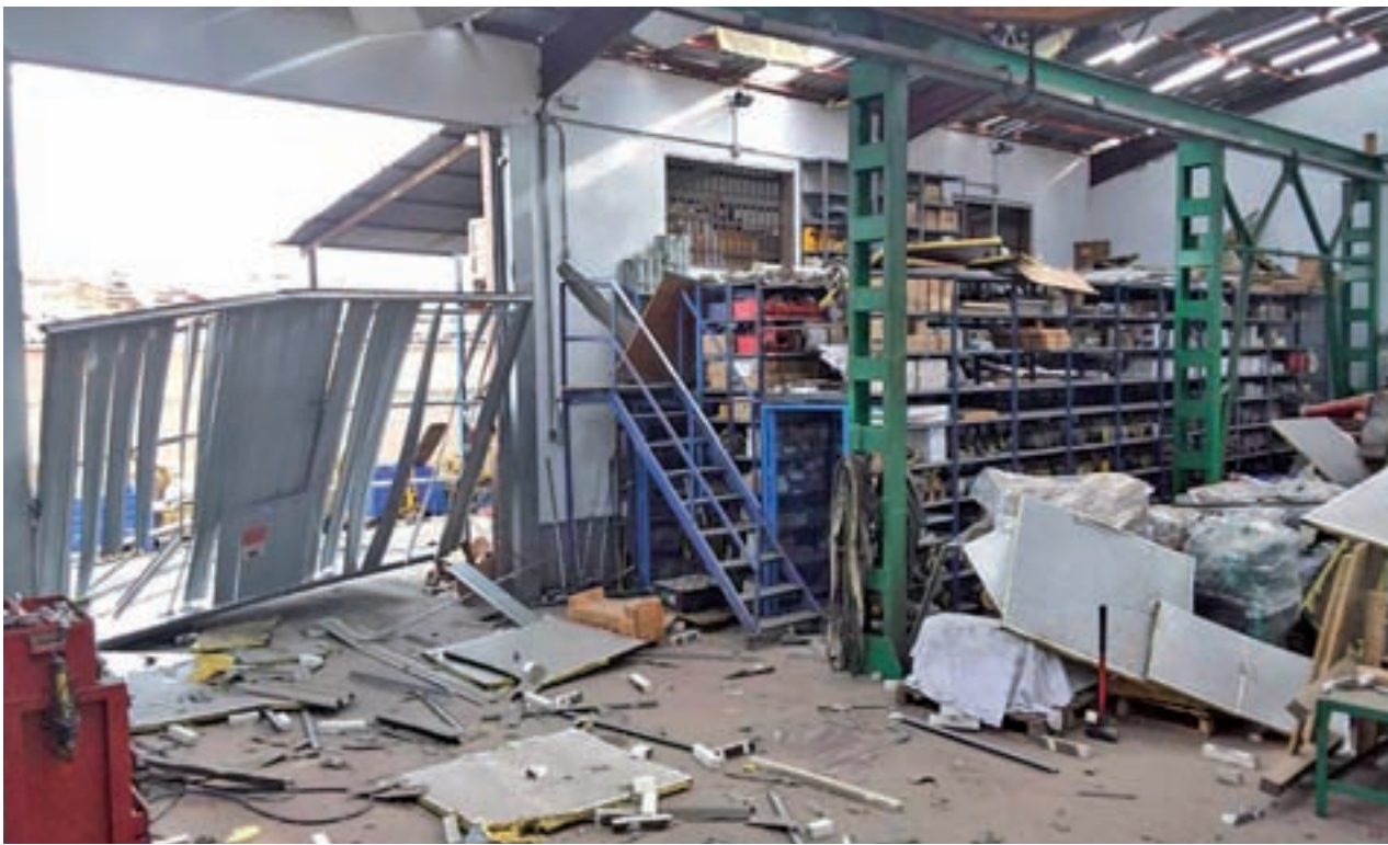
Una de las naves afectadas