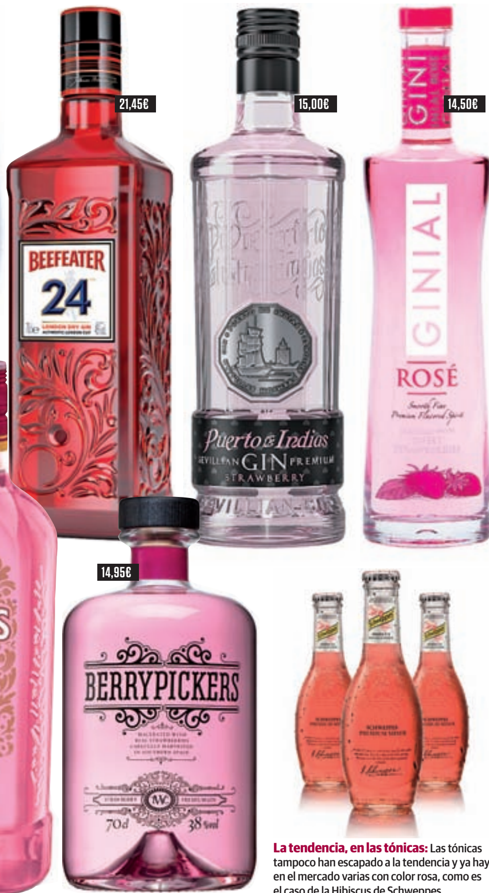
La tendencia, en las tónicas: Las tónicas tampoco han escapado a la tendencia y ya hay en el mercado varias con color rosa, como es el caso de la Hibiscus de Schweppes.

España es el tercer país del mundo en el que más 'gin tonics' se toman, según el ranking internacional Wine & Spirit Research. Seguro que en este dato tiene mucho que ver la incorporación de la mujer al mundo de la ginebra gracias a su apuesta por el rosa.