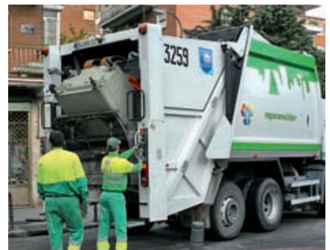
Varios trabajadores recogen basura en las calles de Madrid

La recogida de basuras en Madrid se divide en la actualidad en tres lotes, cuya gestión está adjudicada a las empresas FCC, a una UTE formada por Valoriza, Acciona, OHL y Ascan y a una tercera UTE formada por Urbaser y Ferrovial.