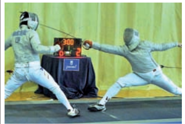
Cita en las instalaciones de Villa de Madrid