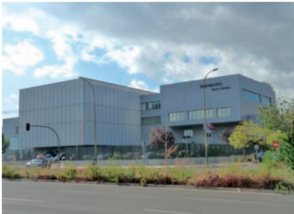
El Centro Cultural Sanchinarro, situado entre Princesa de Éboli y Alcalde Conde de Mayalde

Al respecto, aseguran que resulta incompatible con la percepción, por parte de Talía, de cualquier tipo de retribución o ingreso.