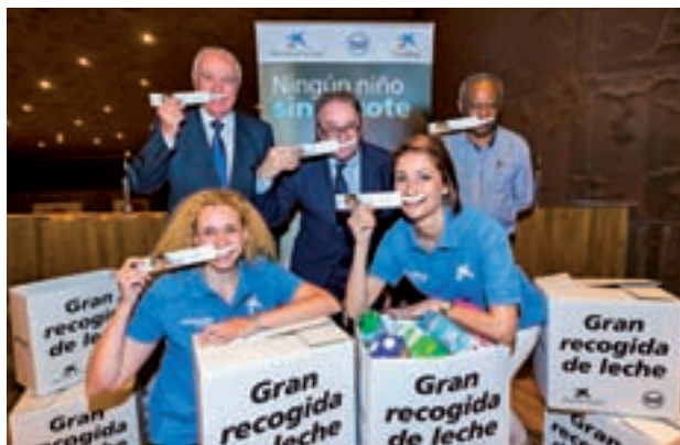
Presentación de la campaña

Las 5.097 oficinas de CaixaBank desplegadas por todo el territorio español recibirán donaciones físicas de cartones de leche entre el 12