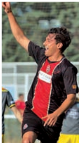
El Adarve ganó en casa

A pesar de llegar al barrio del Pilar con la vitola de haber acabado como segundo clasificado del Grupo XVII, el Tarazona no demostró ser superior al Unión Adarve. El equipo rojinegro dio un nuevo paso en su camino hacia la Segunda División B, al imponerse al conjunto aragonés por 2-0, en un CDM Vicente del Bosque lleno hasta la bandera. Álvaro Sánchez, el 'pichichi' madrileño, no faltó a su cita con el gol, al transformar una pena máxima al filo