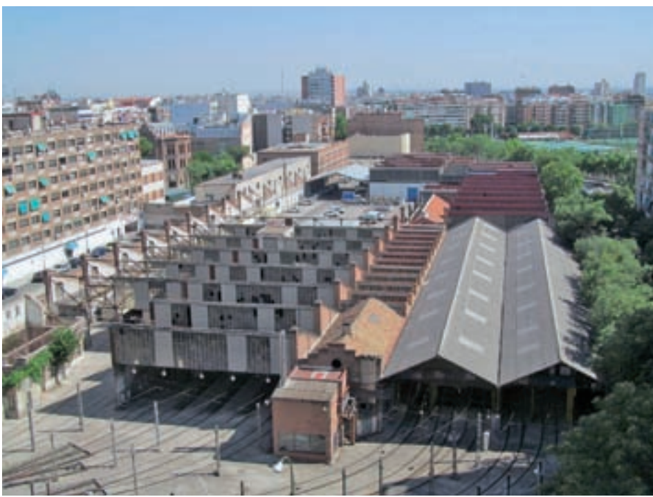
Las antiguas cocheras del suburbano