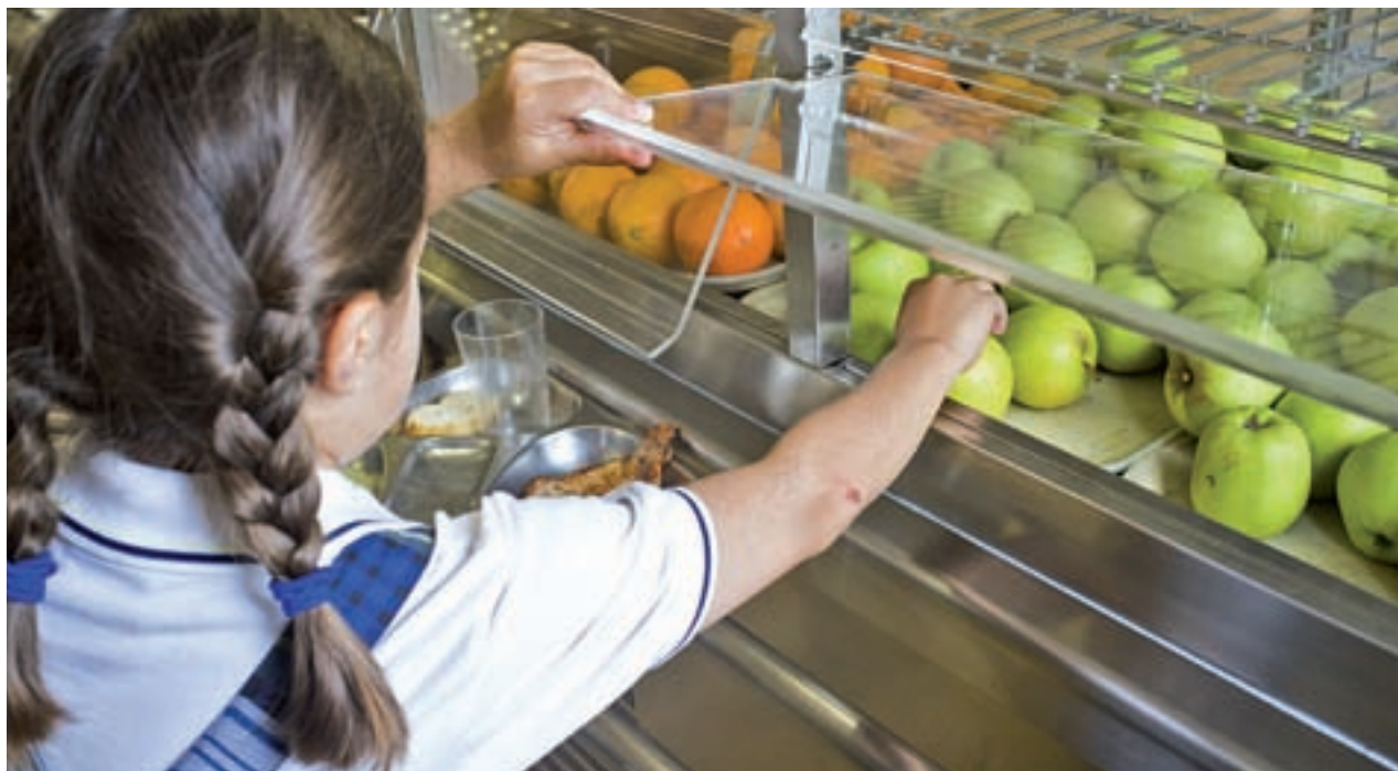
El informe dice que muchos de los escolares que comen en el colegio sufren sobrepeso

Diferentes colectivos, entre ellos el propio Ayuntamiento, la FAO, la Fravm, AMPA y ONG, trabajan desde abril para elaborar estrategias de alimentación sostenible. En los dos talleres realizados los participantes incidieron en la importancia de la comida para evitar el sobrepeso y la obesidad. El próximo encuentro tendrá lugar el 28 de junio.