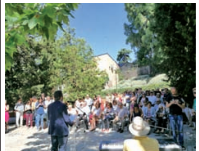
Un momento del acto de inauguración

Además, el Summa 112 tiene un dispositivo de urgencias en la puerta del centro compuesto por un Vehículo de Intervención Rápida (VIR) con el mismo equipamiento que una UVI móvil.