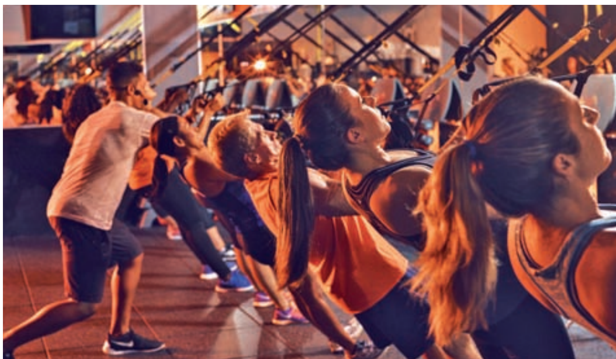
En la sesión se realizan diversos ejercicios que varían cada día