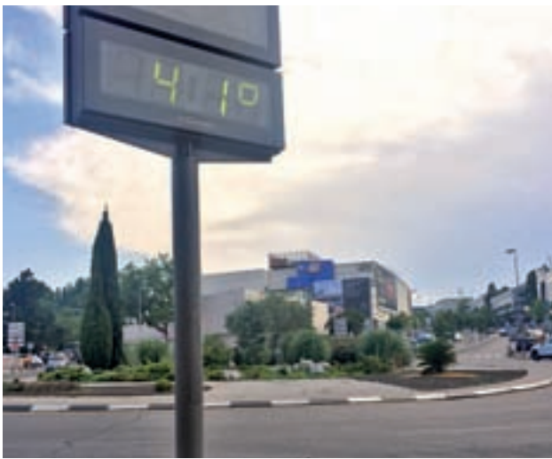
Los termómetros se disparan este verano GENTE