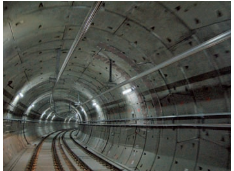
El cambio de la catenaria es una de las razones del cierre GENTE

Para paliar las inevitables molestias que los trabajos provocarán a los miles de viajeros que utilizan este trazado (180.000 al día durante el pasado mes de julio), el Consorcio Regional de Transportes ha establecido un dispositivo de transporte alternativo que contará con cuatro servicios especiales de autobuses de la EMT dotados con 21 vehículos. El primero de ellos cubrirá cada cinco minutos el trayecto que une las paradas de Alameda de Osuna y Canillejas. De esta estación partirá el segundo, que llevará a los viajeros hasta Manuel Becerra cada tres minutos. El tercero saldrá de Emba-