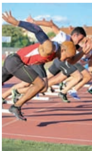
Campeonato de Atletismo

Al igual que ha ocurrido en los últimos encuentros de la Liga y en las anteriores fases del 'play-off', desde el club han sacado una nueva promoción para llenar el estadio. Cada abonado podrá retirar una invitación para un acompañante y así disfrutar del último partido de la temporada.