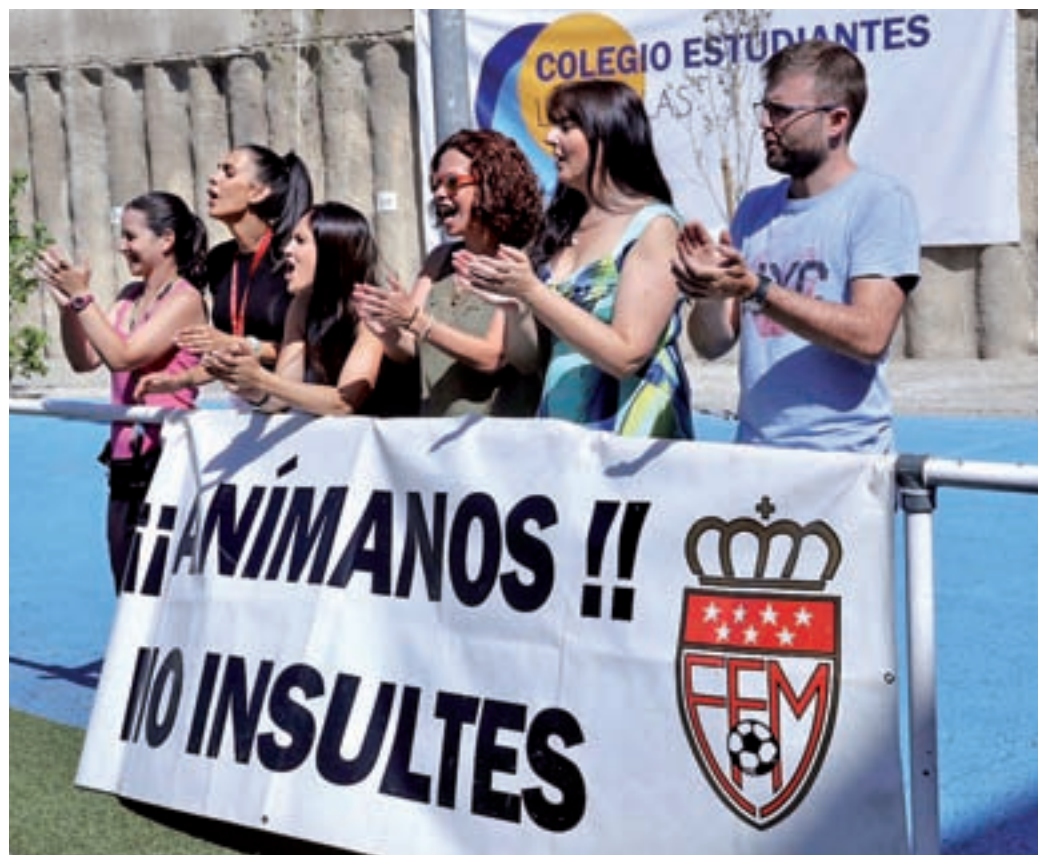
El papel de los padres como aficionados, a debate

Pero, ¿dónde está el origen de estos comportamientos? Para Díez, "no podemos decir que todas las personas que hay en el fútbol son violentos, pero es un reflejo de la sociedad actual. Hemos sido muy permisivos y estamos recogiendo el fruto de ello. El problema de los padres es que se vive en una sociedad de muchos tensiones y problemas.