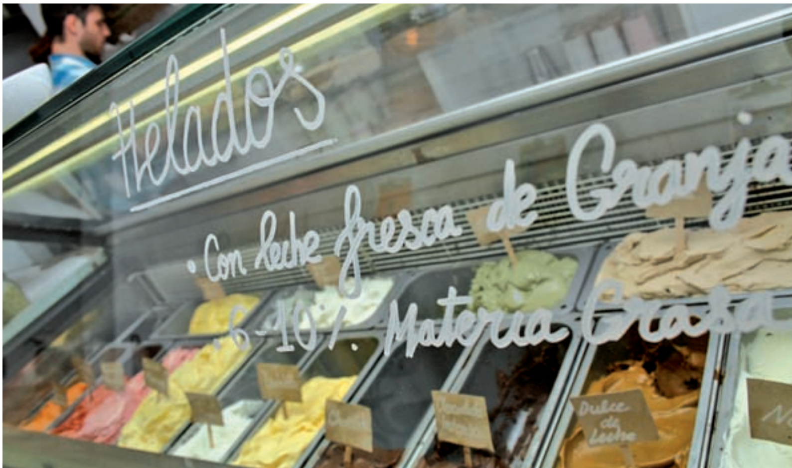
Cada vez son más las heladerías artesanales que proliferan en nuestras calles