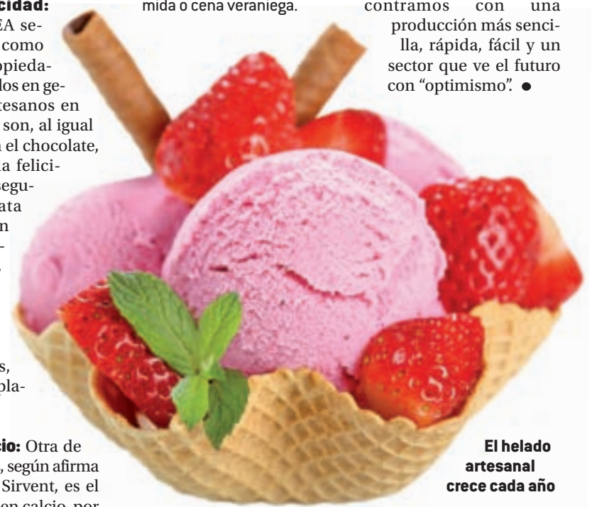
El helado artesanal crece cada año

En cuanto a la frecuencia con la que se recomienda comer este tipo de alimentos, principalmente en esta época estival del año, la ANHCEA afirma que tomar "uno o dos al día no es malo" siempre que se haga en cantidades moderadas, sin abusar y compaginándolo con otros alimentos. El postre perfecto para cualquier comida o cena veraniega.