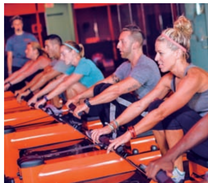
Los remos y las cintas, parte esencial del entrenamiento

Otros niveles: Gris (cuando estás en reposo), azul (ca-