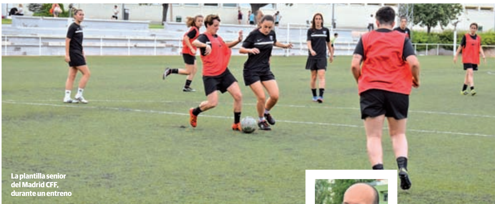
La plantilla senior del Madrid CFF, durante un entreno