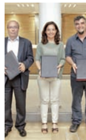
Foto de los firmantes

de Municipios del Sur de Madrid para la cooperación. El objetivo es promover proyectos que favorezcan el progreso social de los seres humanos de los países en vías de desarrollo, mediante acciones humanitarias, educativas y