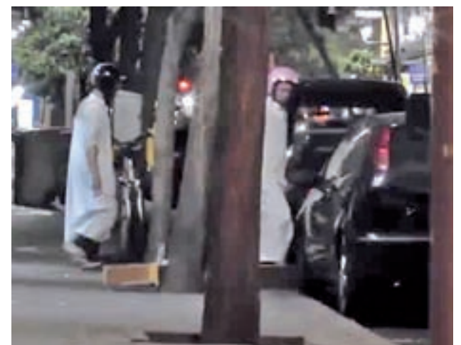
Dos de los presuntos yihadistas detenidos

En el último año han sido detenidos 172 terroristas yihadistas en operaciones realizadas en España.