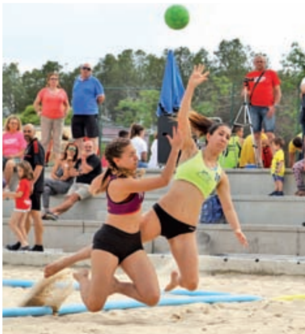
El Getasur, la pasada semana

En las semifinales, sin embargo, el conjunto madrileño se enfrentó al equipo local del CBMP Ciudad de Málaga. El choque comenzó con una manga en la que las andaluzas se impusieron ampliamente (26-12). Tras el descanso las madrileñas dieron un golpe sobre la mesa, llevándose por 19-23. Así, el paso a la final se decidiría en el 'shoot-out', que se lo llevaron las malagueñas por 9-8.