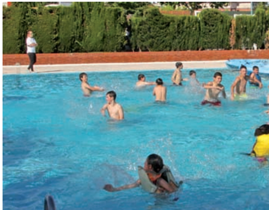
Una piscina de Getafe

Algunos de ellos también usaron las redes sociales para mostrar su malestar, al igual que el Partido Popular, que incidió en que las esperas no sólo “eran interminables”, sino que además se prolongaron por espacio de dos horas y media, y que los principales afectados “por estas injustifi-