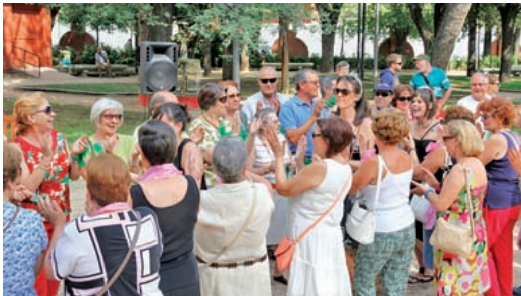
Un grupo de abuelos disfrutando de las actividades

Asimismo, son un puente entre los progenitores y sus hijos, la figura mediadora o los llamados padres subrogados. Teniendo presente este