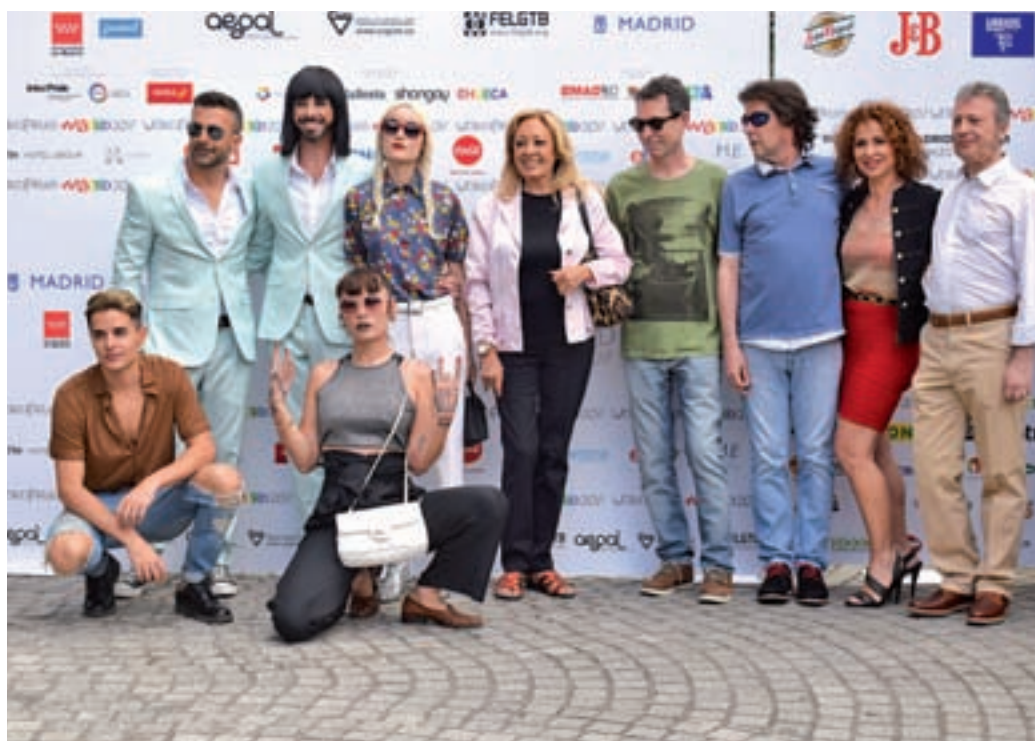
La presentación tuvo lugar en la Casa América

Pero no todo será música los próximos días en Madrid. El deporte ocupará un espa-