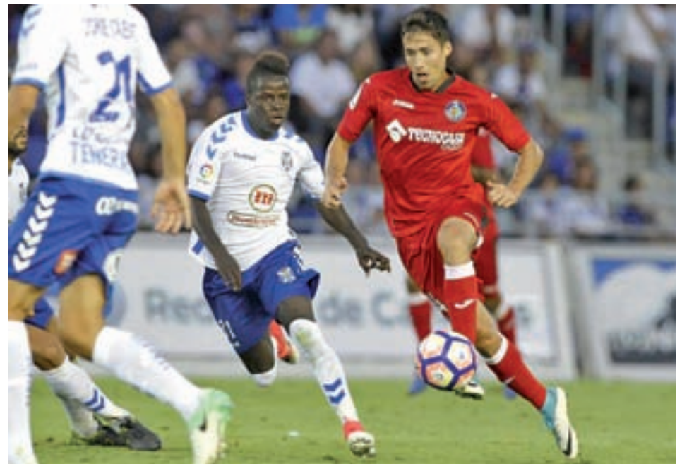
El Getafe, durante el duelo en Tenerife

Por su parte, el Tenerife demostró en la ida que es un conjunto duro de roer. Sobre el terreno de juego del Heliodoro echó el resto y consiguió anular a un Getafe que apenas creó ocasiones de peligro. Un hecho que el propio Bordalás reconoció al finalizar el encuentro. "No ha sido nuestro mejor partido, sobre todo en la primera parte. Han estado mejor y nos