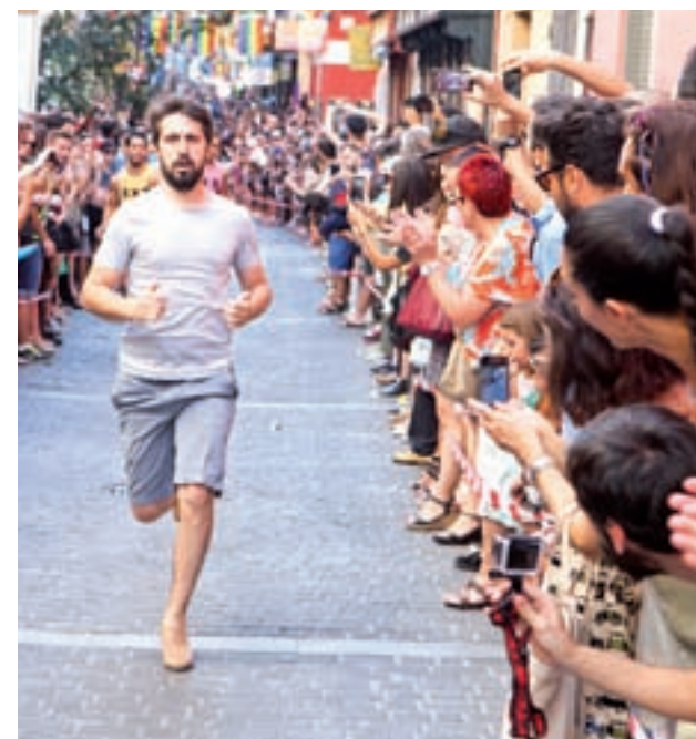
La bandera arcoíris volverá a colgar del Palacio de Cibeles y la Casa de Correos: Un año más, con motivo de la celebración del Orgullo Gay, este año de carácter mundial, la bandera LGBTI volverá a lucir en las instituciones