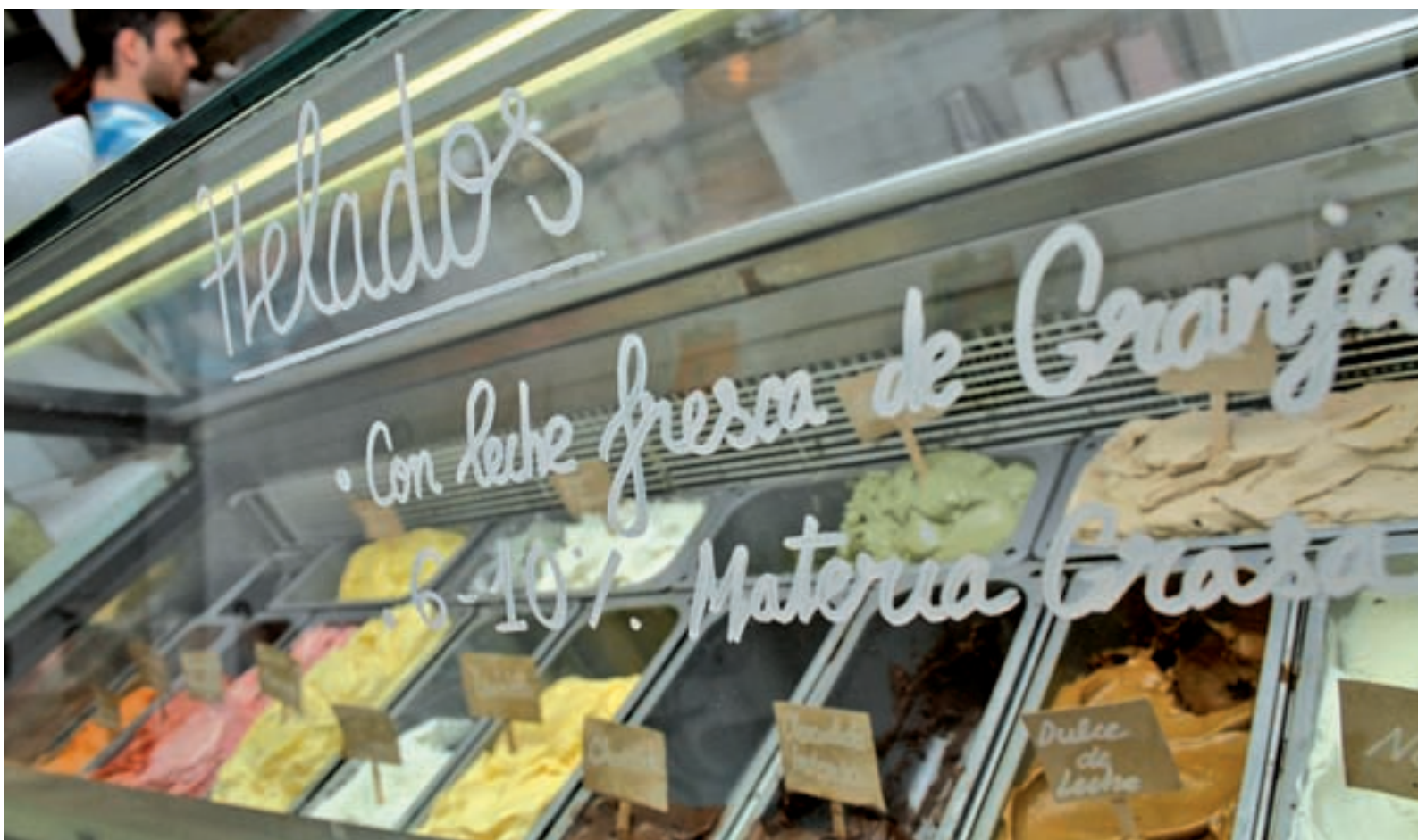
Cada vez son más las heladerías artesanales que proliferan en nuestras calles