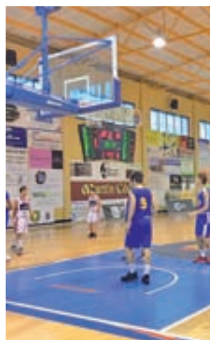
Pasada edición del Campus

que el baloncesto es el protagonista y que se llevará a cabo en el pabellón El Arroyo entre el 26 y el 30 de junio; y del 3 al 7 de julio.