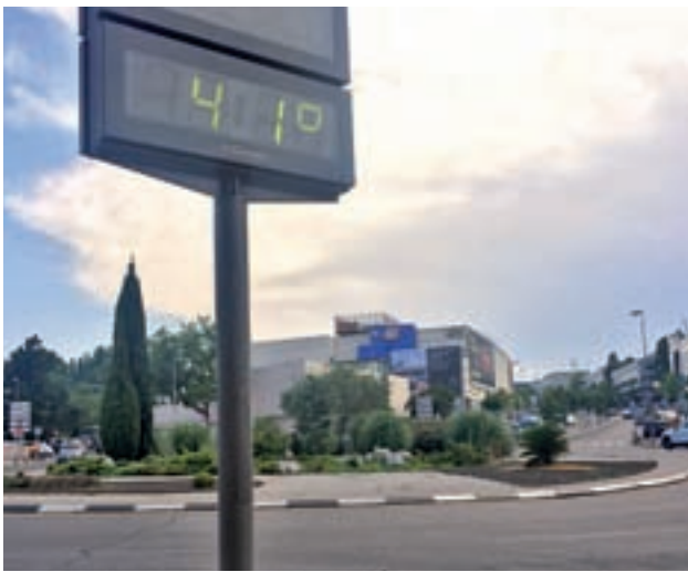
Los termómetros se disparan este verano GENTE