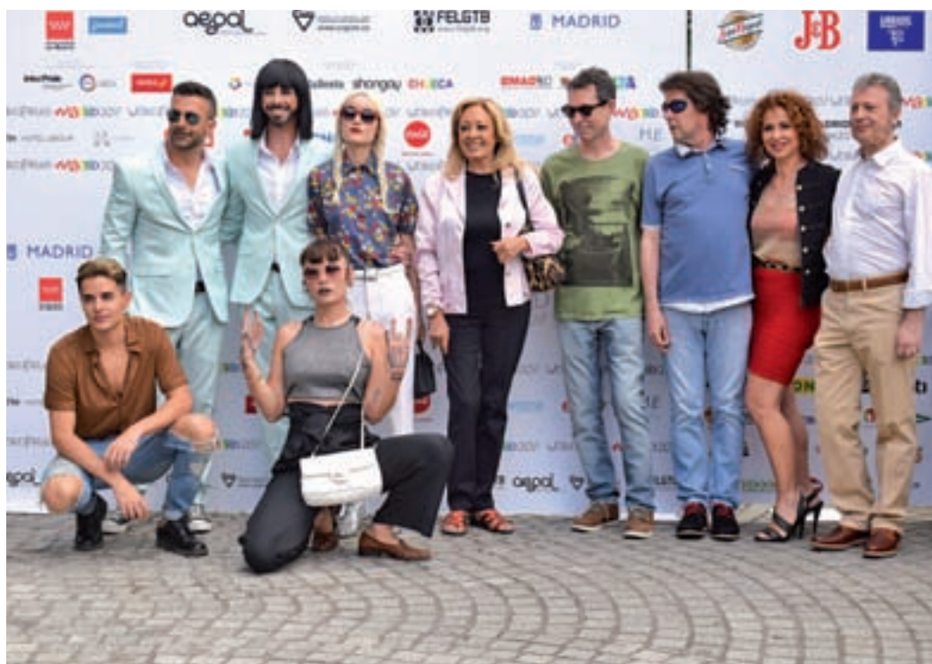
La presentación tuvo lugar en la Casa América

Pero no todo será música los próximos días en Madrid. El deporte ocupará un espa-