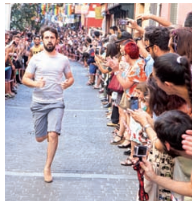
La bandera arcoíris volverá a colgar del Palacio de Cibeles y la Casa de Correos: Un año más, con motivo de la celebración del Orgullo Gay, este año de carácter mundial, la bandera LGBTI volverá a lucir en las instituciones