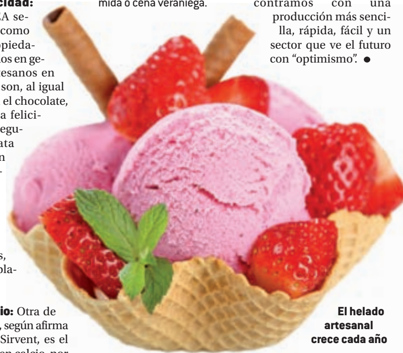
El helado artesanal crece cada año

En cuanto a la frecuencia con la que se recomienda comer este tipo de alimentos, principalmente en esta época estival del año, la ANHCEA afirma que tomar "uno o dos al día no es malo" siempre que se haga en cantidades moderadas, sin abusar y compaginándolo con otros alimentos. El postre perfecto para cualquier comida o cena veraniega.