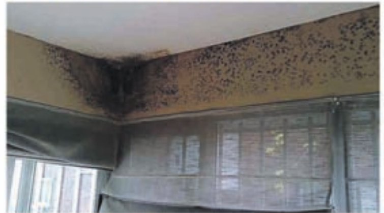
Problemas de humedad por condensación

jefe de micología en el instituto de la Salud Pública Louis Pasteur, explica este aumento por nuestro modo de vida: "Vivimos más en el interior, en casa o en el despacho. Desde los años 60, tendemos a un exceso de aislamiento para no dejar escapar el calor y además no se airea suficientemente".