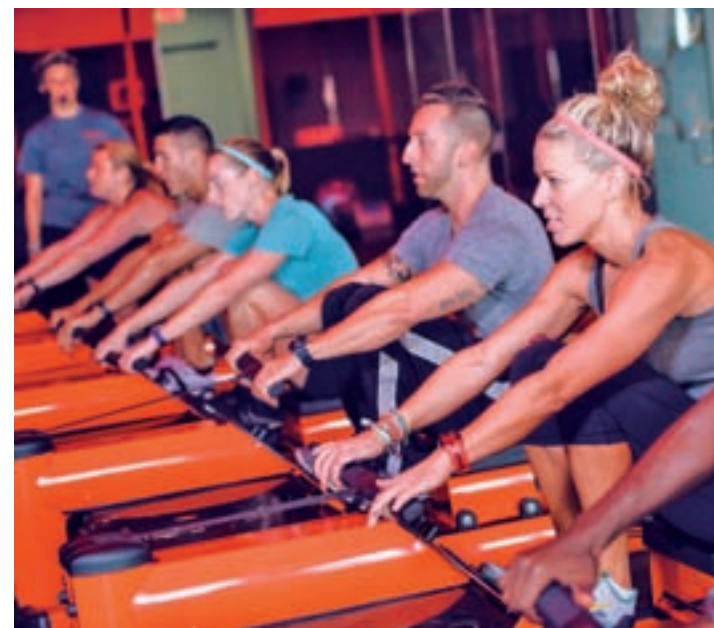
Los remos y las cintas, parte esencial del entrenamiento

Otros niveles: Gris (cuando estás en reposo), azul (ca-