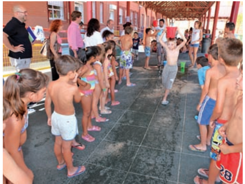
Fuenlicolonia en el CEIP Juan de la Cierva GENTE

Noventa y dos jóvenes con edades comprendidas entre los 3 y 20 años con diversidad funcional disfrutarán de las colonias urbanas (Fuenlicolo-