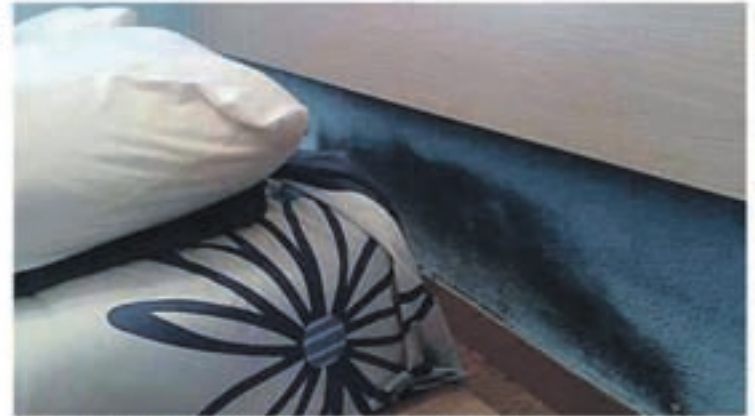
Problemas de humedad por capilaridad

Se han realizado estudios científicos sobre adolescentes que sufren afecciones respiratorias, dando como resultado un 83% de asma, bronquitis asmáticas y bronquitis crónicas y un 87% de rinitis crónicas, que alcanzan a jóvenes que viven en habitaciones demasiado húmedas. De un 20 a un 30% de nosotros sufrimos alergias respiratorias, ¡dos veces más que hace 20 años!. Edouard Drouhet,