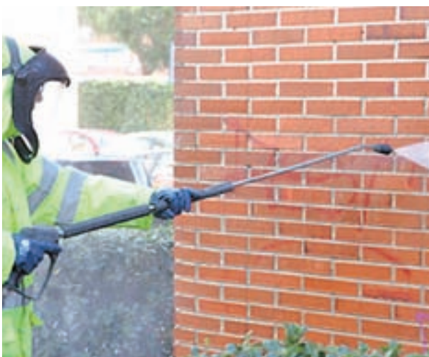
Borrado de graffitis discriminatorios GENTE