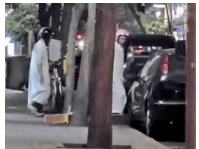
Dos de los presuntos yihadistas detenidos

En el último año han sido detenidos 172 terroristas yihadistas en operaciones realizadas en España.