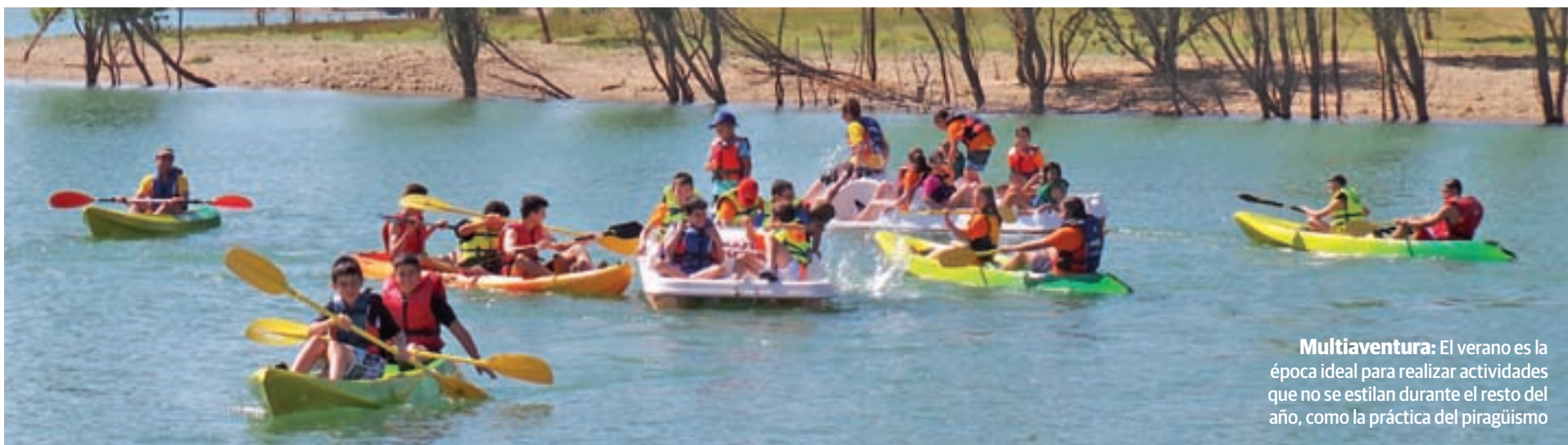
Multiaventura: El verano es la época ideal para realizar actividades que no se estilan durante el resto del año, como la práctica del piragüismo