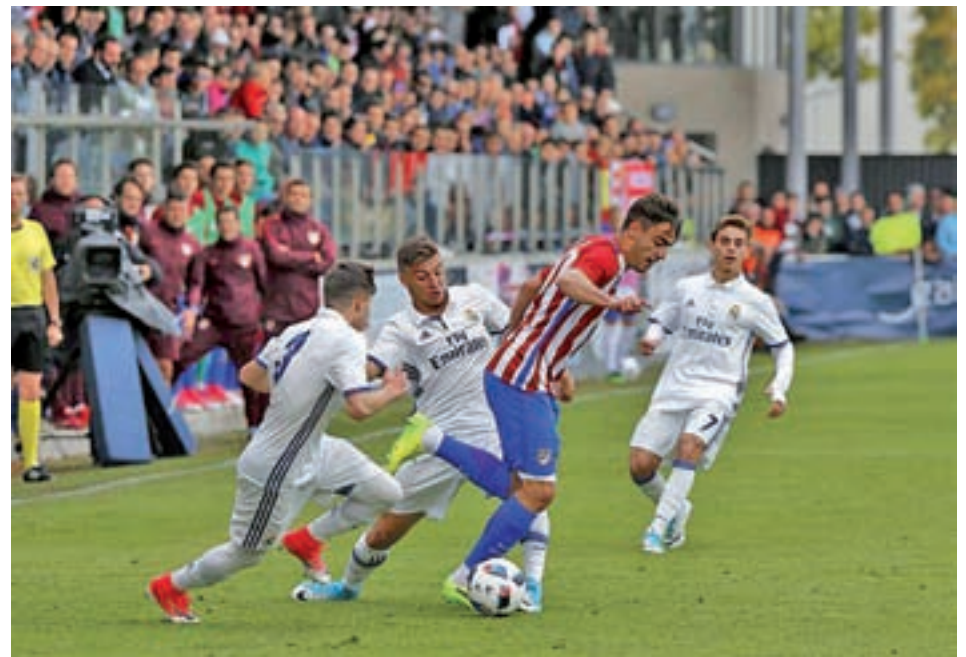
Imagen de un derbi de esta temporada

Con estos datos en la mano, la balanza del favoritismo parece decantarse mínimamente hacia el lado merengue, pero hay algunos argumentos que también alimentan la esperanza de los colchoneros. De hecho, en los otros dos enfrentamientos que han protagonizado este año los dos conjuntos en la División de Honor, el Atlético fue capaz de endosar una de las dos derrotas que únicamente encajaron sus vecinos merengues. El resultado de 3-1 servía para