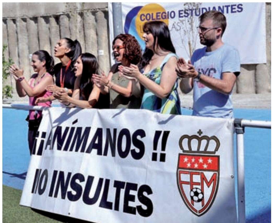
El papel de los padres como aficionados, a debate

Pero, ¿dónde está el origen de estos comportamientos? Para Díez, "no podemos decir que todas las personas que hay en el fútbol son violentos, pero es un reflejo de la sociedad actual. Hemos sido muy permisivos y estamos recogiendo el fruto de ello. El problema de los padres es que se vive en una sociedad de muchos tensiones y problemas.