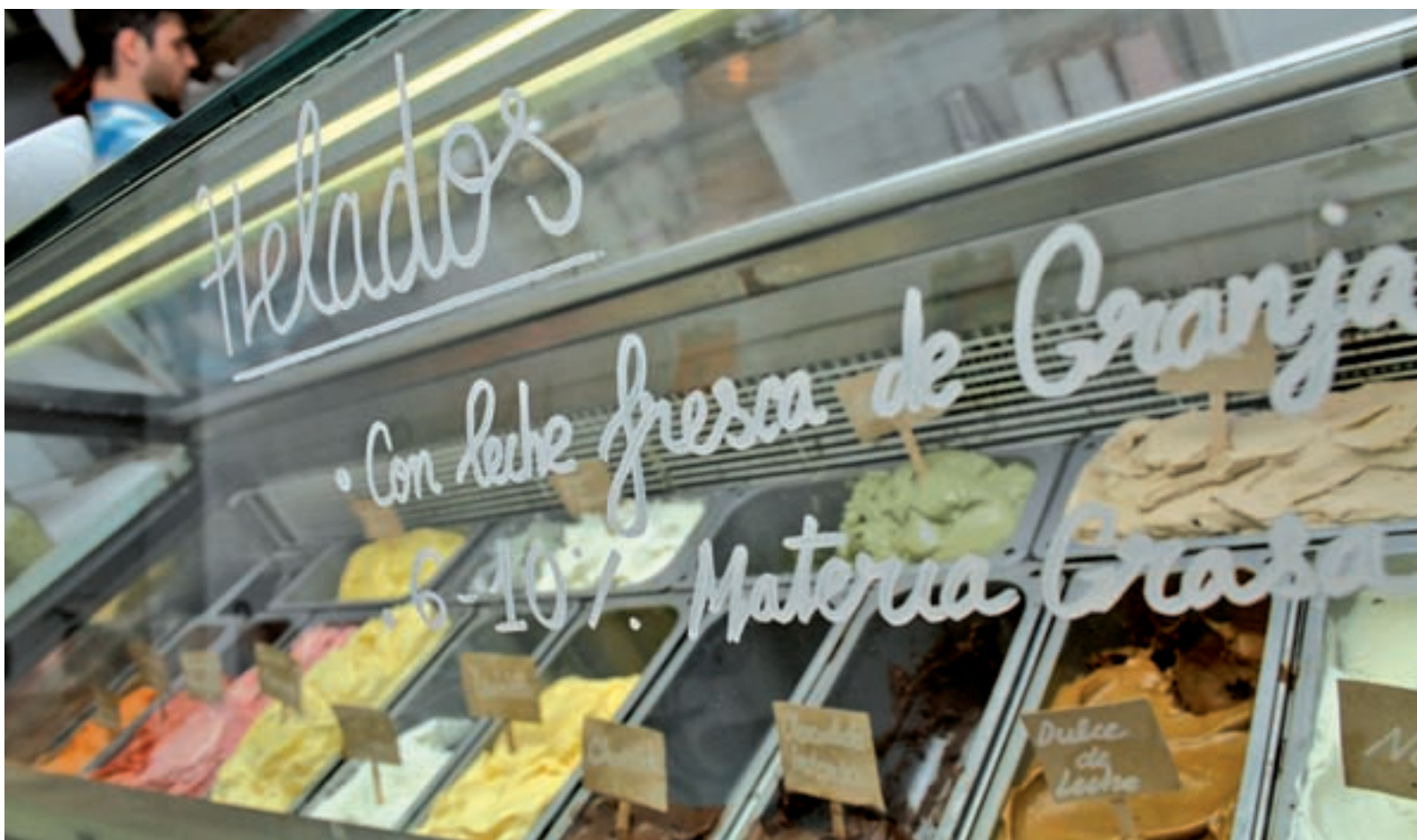
Cada vez son más las heladerías artesanales que proliferan en nuestras calles