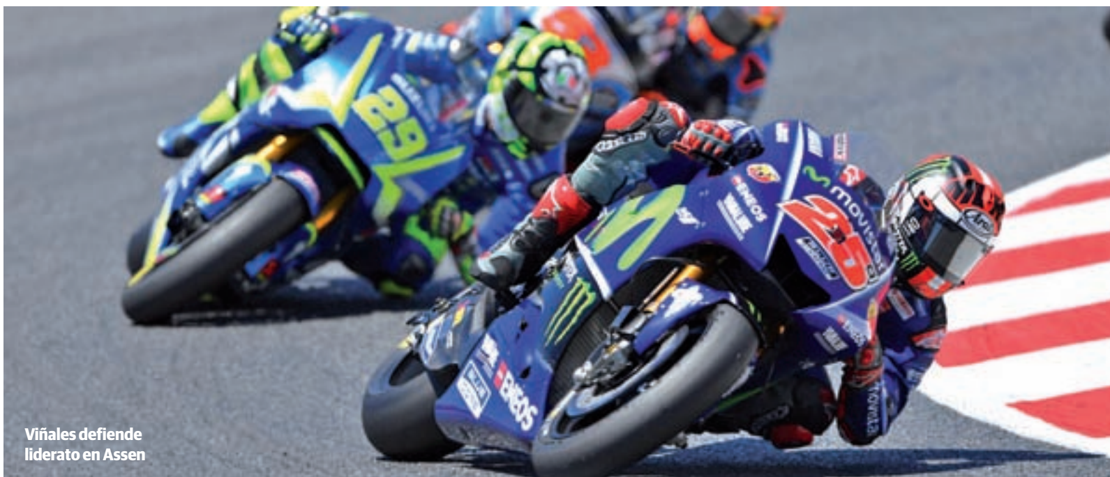
Viñales defiende liderato en Assen

MOTOR | GP DE AZERBAIYÁN Y GP DE PAÍSES BAJOS