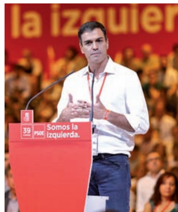
Pedro Sánchez durante el 39 Congreso Federal

Durante el Congreso, el secretario general abordó "el problema catalán", manifestando que los socialistas apuestan por un camino que se abre entre el independentismo y el 'neocentralismo' del PP. "Se resume en estar a favor de España y a favor del catalanismo", manifestó. Ade-