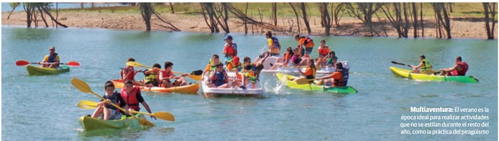
Multiaventura: El verano es la época ideal para realizar actividades que no se estilan durante el resto del año, como la práctica del piragüismo