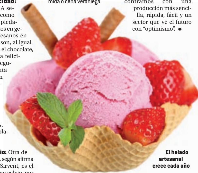
El helado artesanal crece cada año

En cuanto a la frecuencia con la que se recomienda comer este tipo de alimentos, principalmente en esta época estival del año, la ANHCEA afirma que tomar "uno o dos al día no es malo" siempre que se haga en cantidades moderadas, sin abusar y compaginándolo con otros alimentos. El postre perfecto para cualquier comida o cena veraniega.