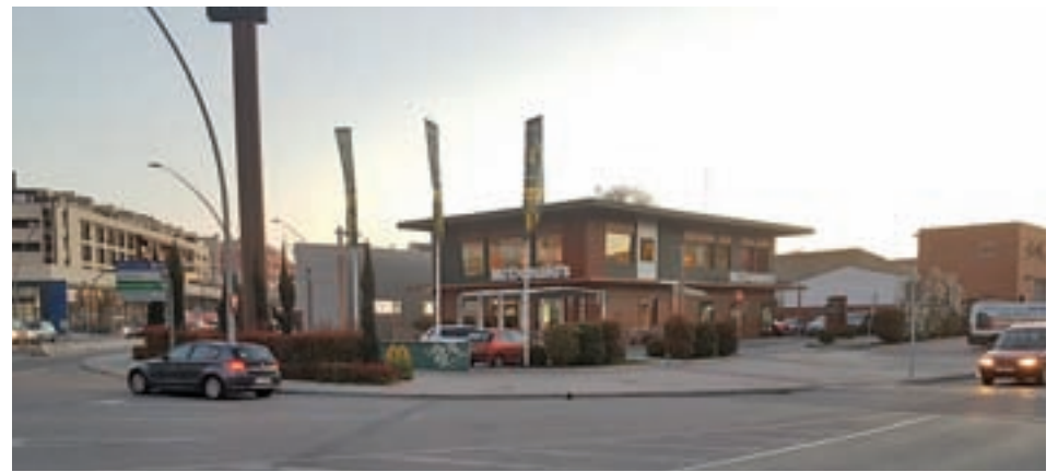
McDonald's de la calle Luis Sauquillo

La investigación ha sido llevada a cabo por agentes de la Brigada Provincial de Policía Judicial y ha contado con la colaboración de agentes de la Jefatura Superior de Barcelona y el E.D.O.A. de la 13ª zona de Cantabria del Cuerpo de la Guardia Civil.