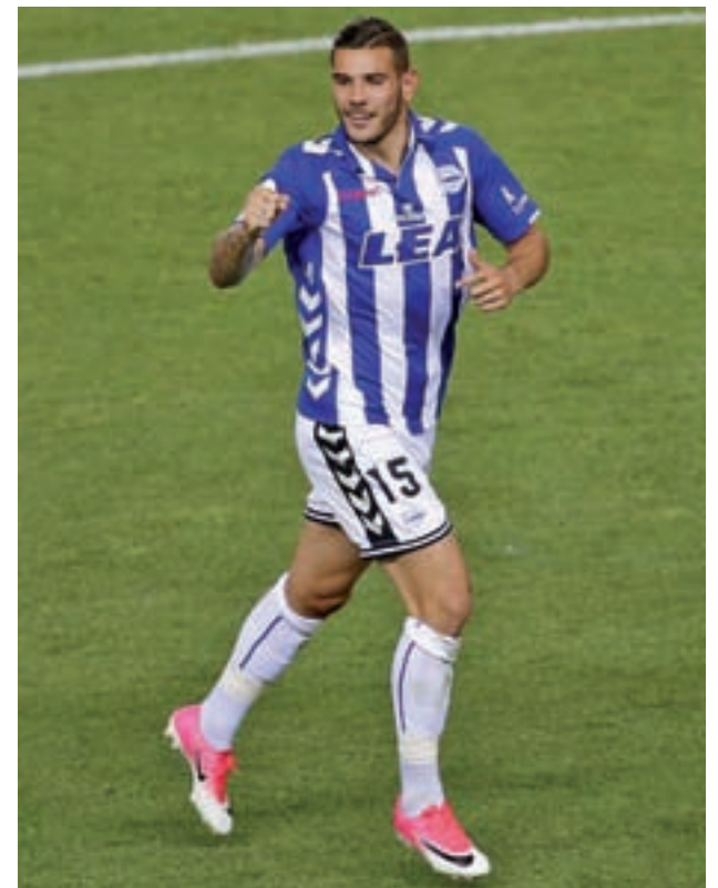
Theo, durante la última final de la Copa del Rey

Hasta este punto todo entra dentro de la normalidad. Fue