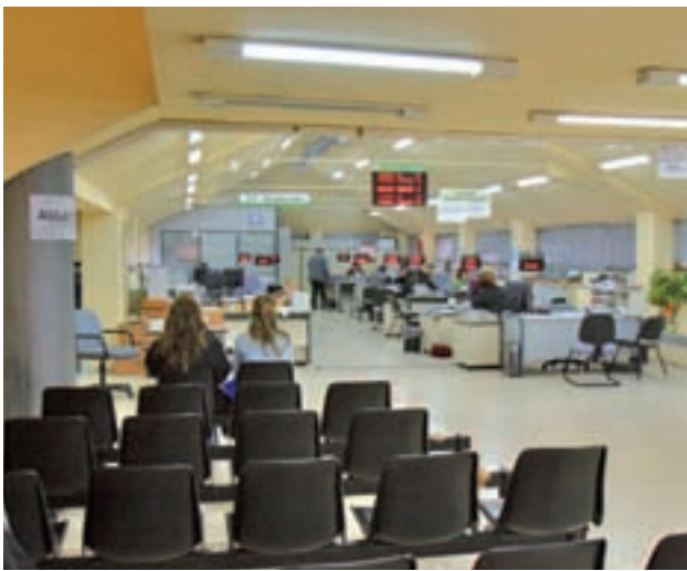
Oficina de Empleo