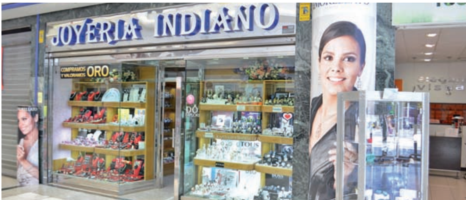
Indiano, en el CC Las Provincias