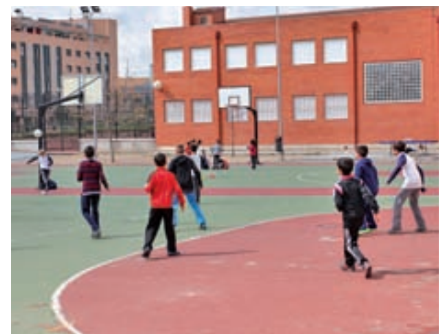
Patio escolar en el Juan de la Cierva