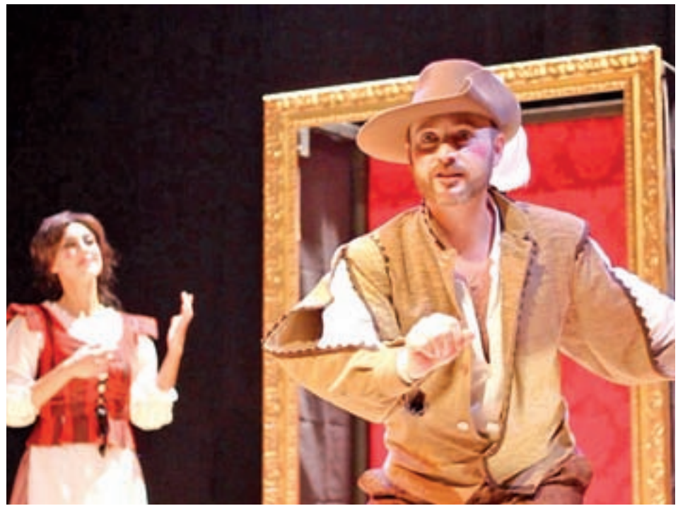
El Teatro Romano de Mérida (izquierda) y una de las obras que se representará en Almagro (derecha)