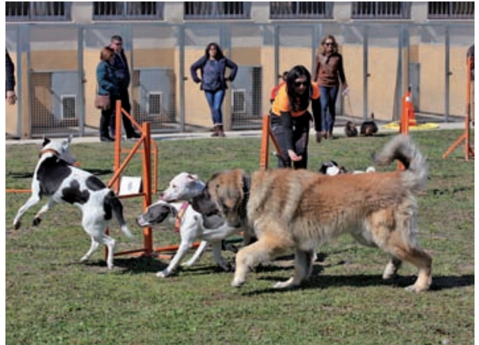
Exhibición canina en el CPA de Fuenlabrada

El CPA de Fuenlabrada, ubicado en el kilómetro 3 del Camino de la Mula, acoge a las mascotas que han sido abandonadas en el municipio. Una labor en la que participa activamente la Policía Local de