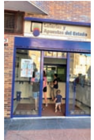
Admón. del Barrio del Puerto

En Coslada la combinación ganadora se vendió en la Administración de Loterías de Coslada, situada en la plaza Mar Caribe del municipio. A cada serie premiada le corresponden dos millones de euros, es decir, por cada décimo se obtienen 200.000 euros. En total se han vendido más de cuarenta décimos, por lo