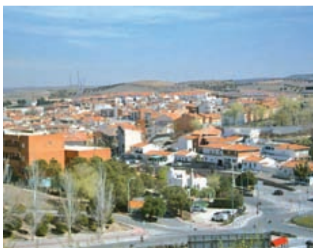
El municipio quiere impulsar el comercio local

La iniciativa ha sido puesta en marcha de manera conjunta por el Ayuntamiento de