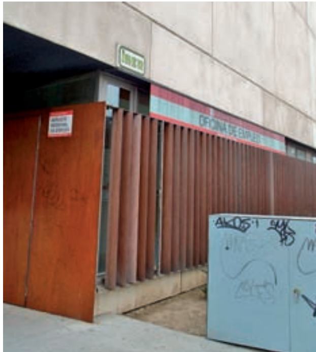
El desempleo se reduce en esta zona de la región

La localidad que ha cosechado una mayor bajada es Coslada, donde la tasa de desempleo se ha reducido en un 3,01%. De esta manera, el número de cosladeños que no tienen trabajo es de 4.955. Alcalá de Henares es el segundo que registra un descenso menor, en concreto del 2,92%, lo que significa que hay 13.443 parados en la ciu-