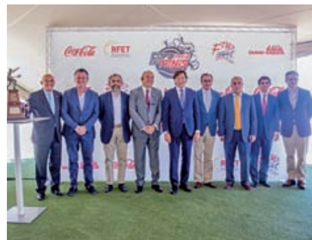
Momento de la presentación