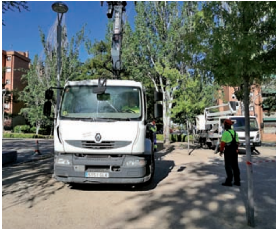
Una de las zonas en la que se han replantado los árboles dañados

Desde el Consistorio han realizado un estudio cuantitativo en el que ha colaborado la compañía Urbaser. Según los datos del mismo, hasta junio de este año se han caído siete árboles en la ciudad, la menor cifra registrada desde 2013, aunque hay que tener en cuenta que los datos de este año sólo han sido recogidos hasta el mes de junio. Respecto a los reproches de que no se realiza la poda de los ejemplares, atendiendo a uno de los gráficos, en el ejercicio 2016-2017 se desprende que el total de kilogramos retirados se ha incrementado notablemente, en casi 50.000. Algunas de las zonas en las