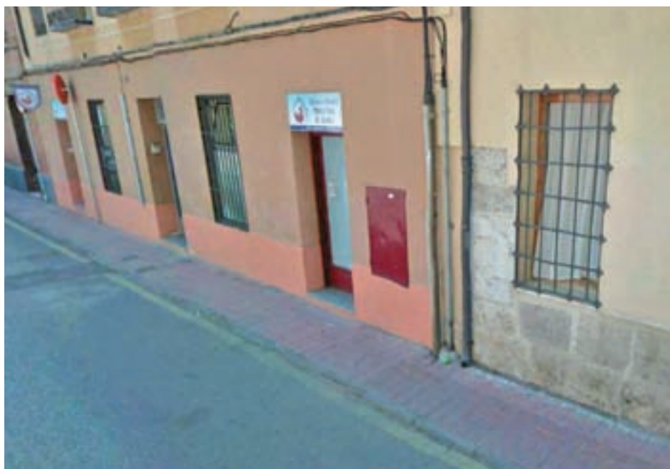
Inmediaciones de la escuela infantil

En este exponen que creen que no se han ofrecido todos los detalles que atañen al caso, y eximen de toda responsabilidad a los cuidadores de los niños. Elogian, en concreto, la capacidad de reacción de la persona que estaba a cargo de la niña que sufrió el accidente, ya que fue la primera que le realizó la reanimación cardiopulmonar al advertir que se había atragantado. Posteriormente, como ya se había informado, acudieron los agentes de la Policía, quienes tomaron la decisión de trasladarla a un centro sanitario, al observar