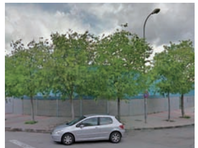
Polideportivo de Valleaguado

Ella ha explicado que decidió tomar cartas en el asunto al no poder acceder al polideportivo para ver entrenar a su hijo, ya que aunque en una ocasión le permitieron acceder a la pista le explicaron que no podría hacerlo más, puesto que su presencia con la silla suponía un peligro tanto para ella como para los demás.