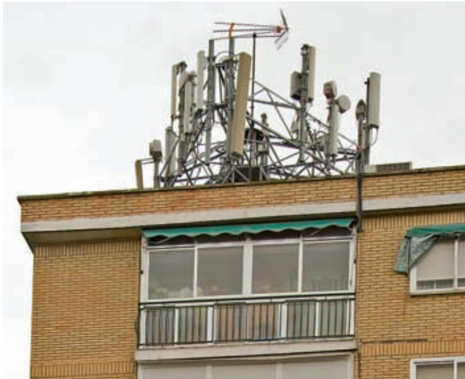
Las antenas de telefonía móvil, en el punto de mira