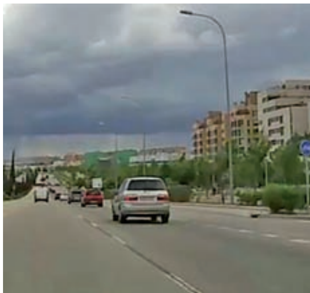
Avenida del Mayorazgo El concejal de Villa de Vallecas asegura que se va a intervenir en este verano para templar el tráfico en la avenida del Mayorazgo. Además, confirma que continúa adelante el proyecto innovador industrial en el polígono La Atalayuela.

Pérez también hace alusión a dos acciones en la vía pública que se harán reali-