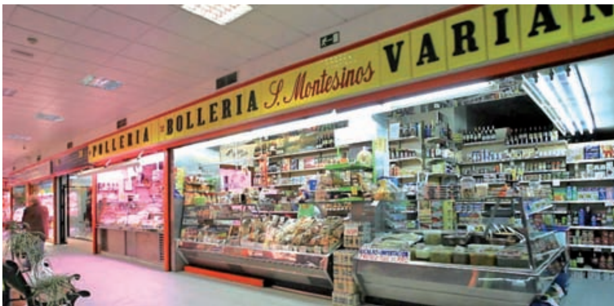
Uno de los puestos del centro comercial donde se realizará la intervención