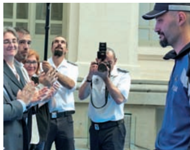
La entrega de distinciones municipales

Por otro lado, los otros dos agentes del distrito recibieron sendas Cruces al Mérito por una trayectoria en la que han destacado sus virtudes profesionales y humanas en el periodo de servicio.