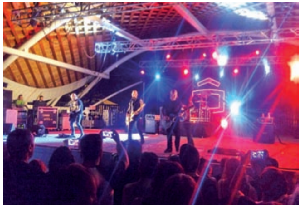
Un concierto de ediciones anteriores en el auditorio municipal

La espuma y el agua cobrarán especial protagonismo en la mañana de sábado.