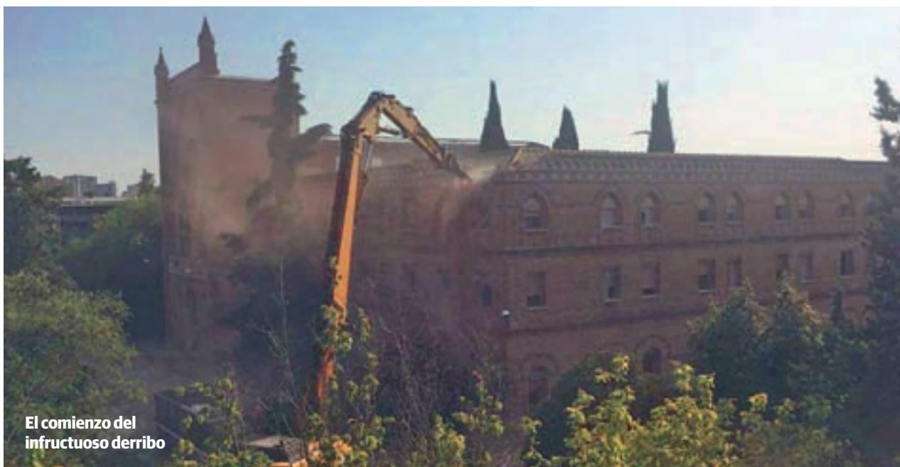
El comienzo del infructuoso derribo