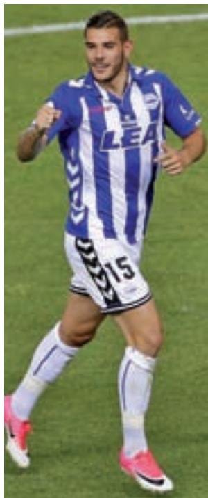
Theo, en la final de Copa

Parecía un secreto a voces desde hace tiempo, pero ya se hizo oficial el pasado miércoles 5 de julio. El Real Madrid tendrá una nueva opción para la demarcación de lateral izquierdo, después de confirmarse el fichaje de Theo Hernández por el club que preside Florentino Pérez para las próximas seis temporadas. Para hacerse con sus servicios, el Madrid ha tenido que desembolsar una cifra