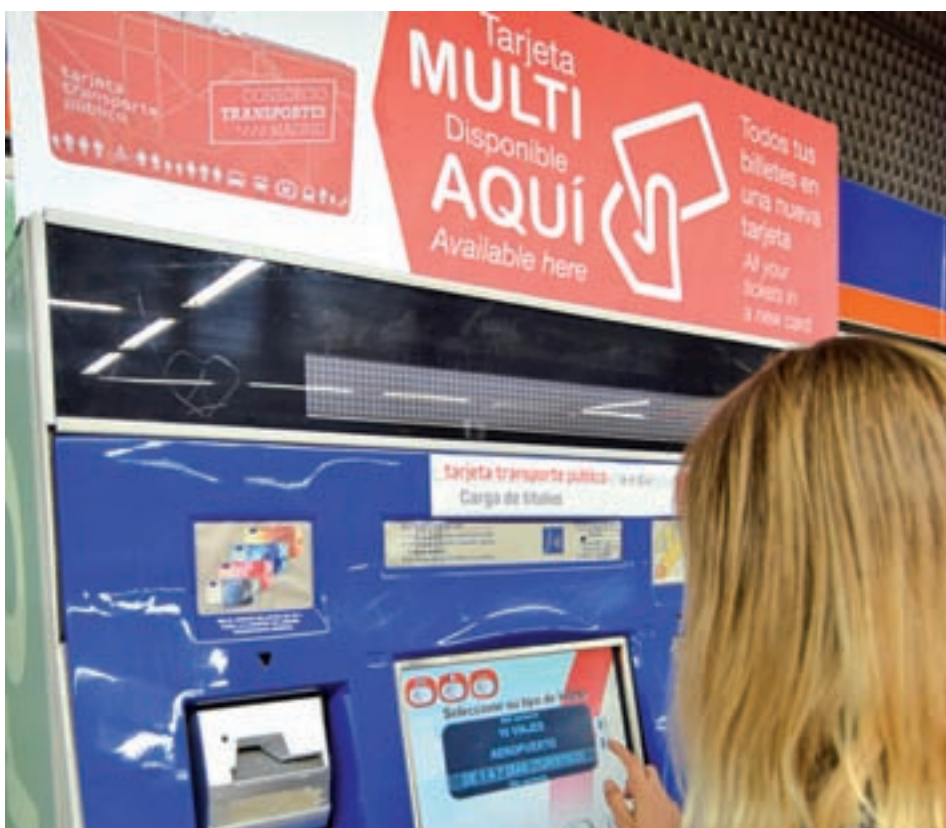
Las máquinas de Metro expenden y recargan la nueva tarjeta