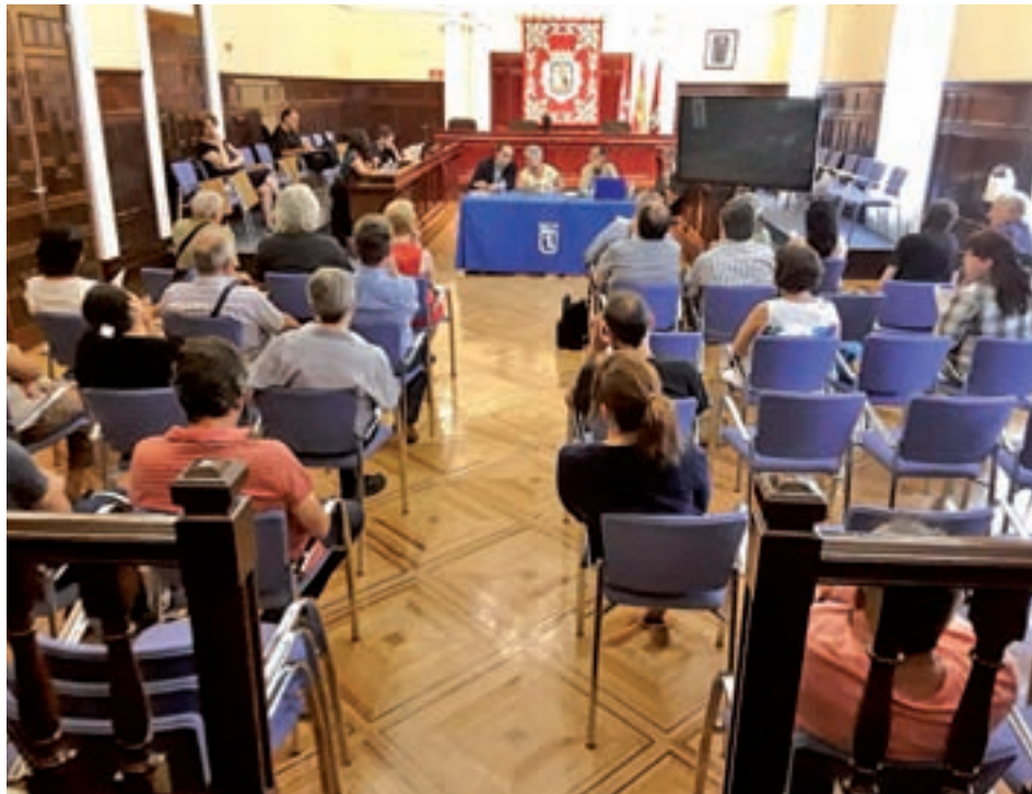
Un momento de la reunión celebrada en el salón de Plenos de Tetuán

La creación de equipamientos debe ser una de las piedras angulares del futuro plan de actuación municipal a juicio de la ciudadanía. Entre otras dotaciones, la Asocia-