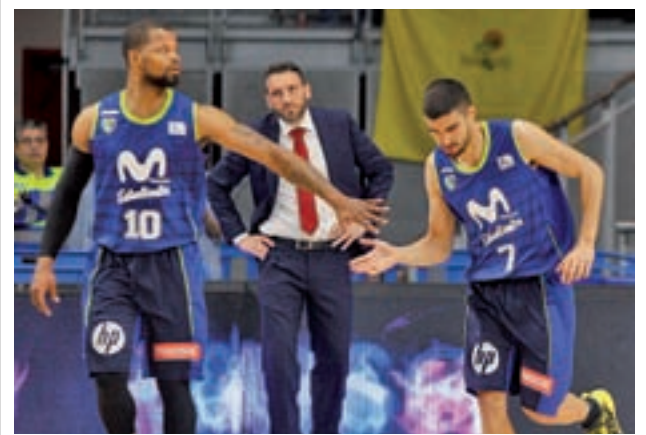
Omar Cook y Jaime Fernández seguirán jugando juntos

Hay que recordar que entre las 23 seleccionadas hay varias representantes del vigente campeón de la Liga Iberdrola, el Atlético de Madrid: Lola Gallardo, Andrea Pereira, Mapi León, Alexandra López, Silvia Meseguer, Amanda Sampedro, Marta Corredera y Esther González.