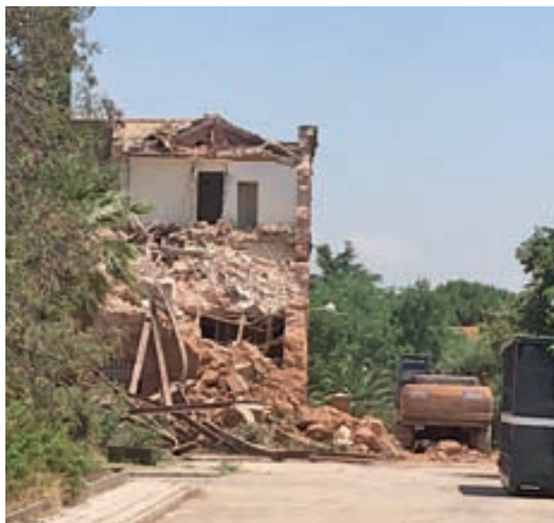
La demolición, al 30% El edificio es del arquitecto Crispulo Moro Cabeza, de 1929, y está amparado por la disposición transitoria primera de la ley de Patrimonio de la Comunidad de 2013 que le confiere la consideración de Bien de Interés Patrimonial.

“El criterio va a ser la paralización definitiva, trabajar con lo que ha quedado, el 70