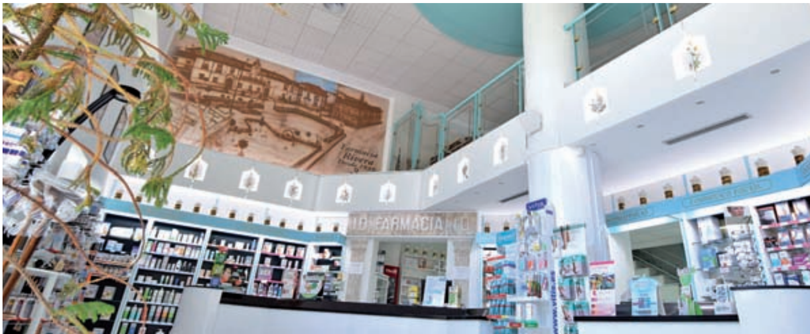
Una zona de la farmacia