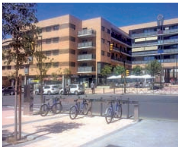
Un barrio de Getafe

Uno de los objetivos del ITA, además de esta evaluación del nivel de transparencia, es fomentar la cultura informativa de los propios Ayuntamientos, ya que se les ofrece la posibilidad, durante un plazo determinado, de que incorporen en sus respectivas webs la información solicitada por por Transparencia Internacional España.