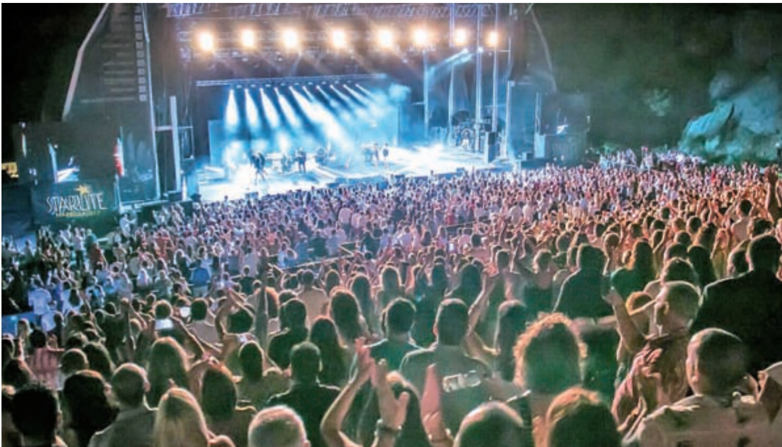
La cantera llena durante uno de los conciertos