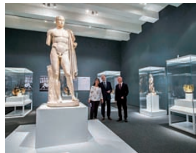
Inauguración de la exposición

en los juegos de la infancia, mediante los que se aprendían las normas establecidas. El tercero se consagra a una de las grandes pasiones de los antiguos griegos, las competiciones deportivas, entre las que destacan los Juegos Olímpicos y los Panhelénicos. Las representaciones teatrales y musicales, la guerra, los héroes y mitos y la rivalidad social completan un recorrido diferente por el mundo clásico.