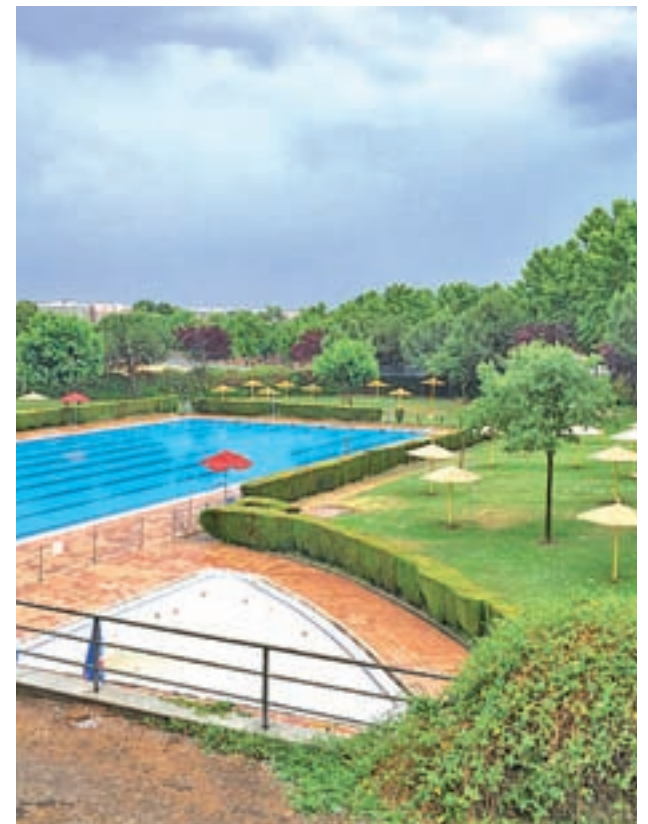
Una de las piscinas de Getafe

Según el Consistorio, "a pesar de ser necesarias algunas reparaciones, éstas no impiden el normal funcionamiento de la instalación y se ha procedido de nuevo a la depuración del agua, que ya se encuentra en perfectas condiciones para su uso". Durante estos días, los usuarios