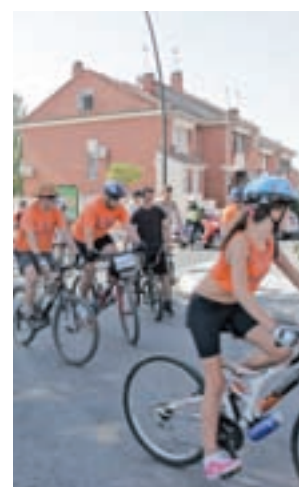
Fiesta de la bici

Para el domingo, gran fiesta de la bicicleta, tirolina, escalada, Scalextric y paella popular.