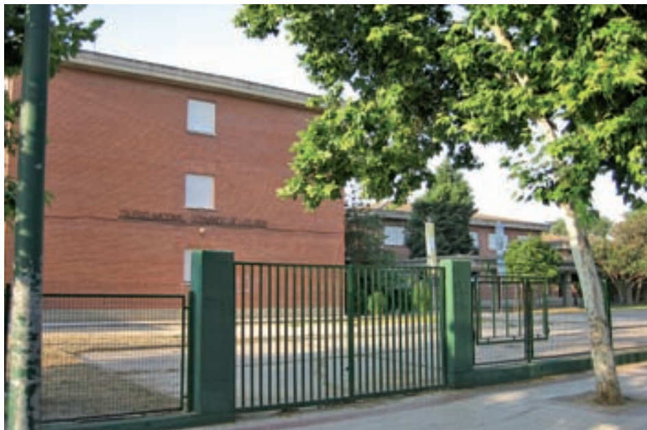
Colegio situado en la Avenida de las Fuerzas Armadas

en el barrio de La Alhóndiga (3,1 millones de euros), tras ello la adecuación y regularización de seis aparcamientos de concesión administrativa para residentes en el centro cívico El Bercial, calle Fuenlabrada, Pintor Rosales-Pazos Prías, Rufino Castro, calle Pasión y Leganés- Alcalde Juan Vergara (1,8 millones). De igual modo, se remodelarán aceras en diferentes calles para mejorar el firme y la accesibilidad (1,5 millones) y se desarrollarán obras de urbanización, acondicionamiento de pistas deportivas y mejora en la insta-