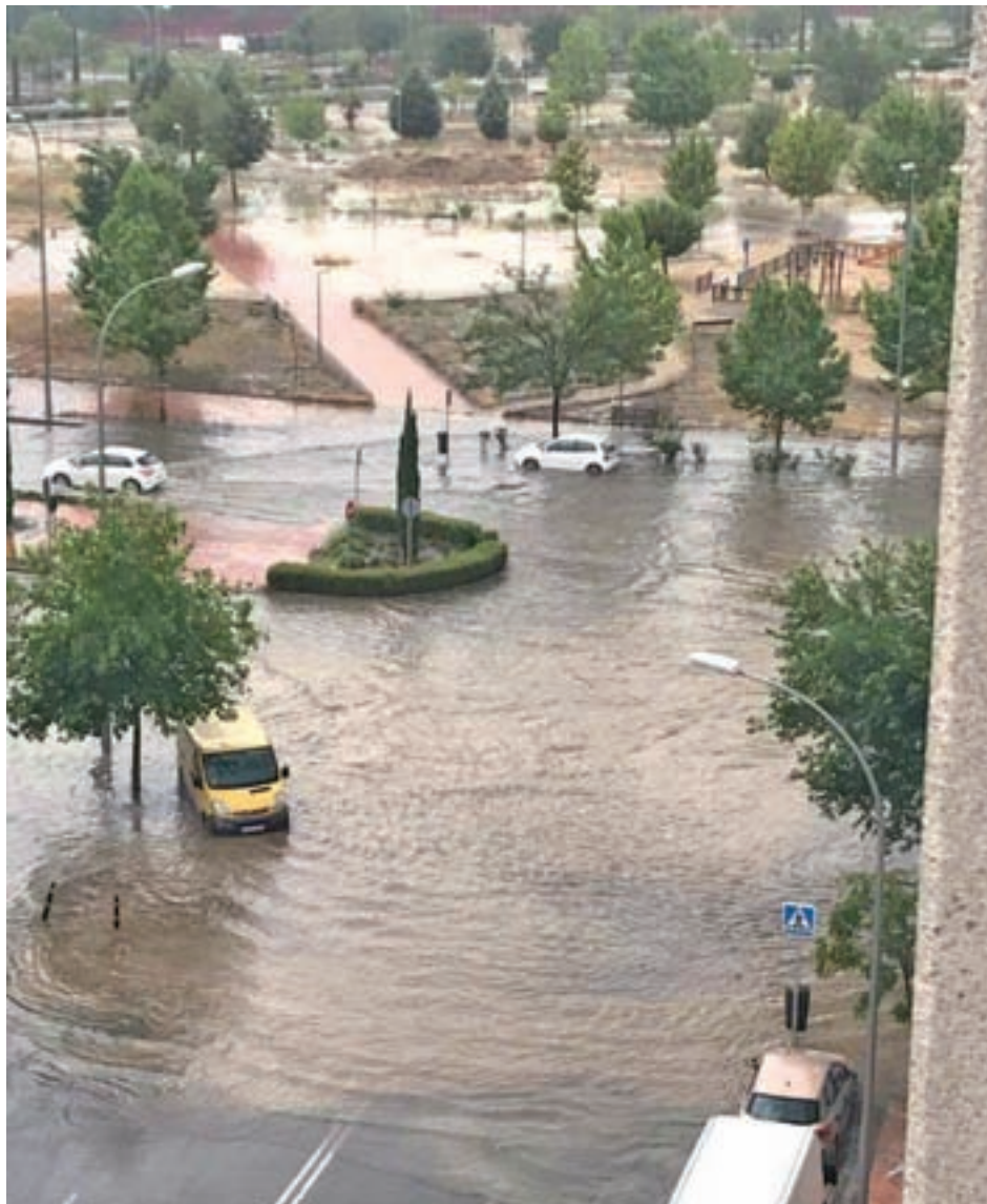
Una de las vías afectadas en el Ensanche de Vallecas

Entre las incidencias más destacadas y que generaron también problemas de tráfico,