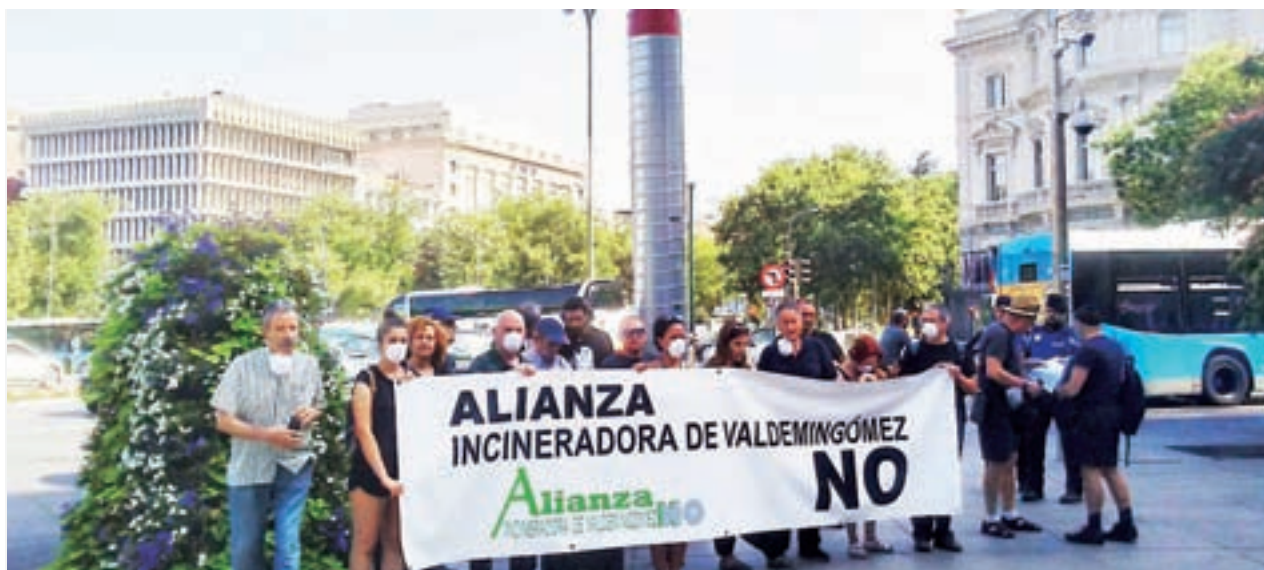
El acto reivindicativo que realizaron a las puertas del Ayuntamiento de Madrid el pasado mes de junio