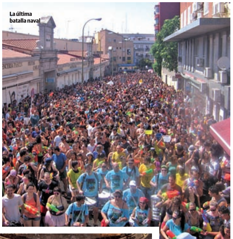
La última batalla naval

En el menú lúdico municipal destaca el mercado pirata artesanal con juegos acuáticos (12 horas), talleres (19:30 h.) y atracciones ecológicas infantiles gratuitas todos los días en la calle del Payaso Fofó. Además, el viernes habrá una exhibición de bomberos (19 horas) y Tititirantes representará su obra de circo teatral 'Ulterior'. El sábado 15 de julio la Compañía Scura Splats presentará su espectáculo 'Satsuma 3.0' (20 h.) y el domingo tendrán lugar, de 9 a 15 horas, la II edición de la Fiesta de la Bicicleta; y de 11 a 12, un pasacalles. Ya a medianoche de la jornada dominical se producirá el lanzamiento