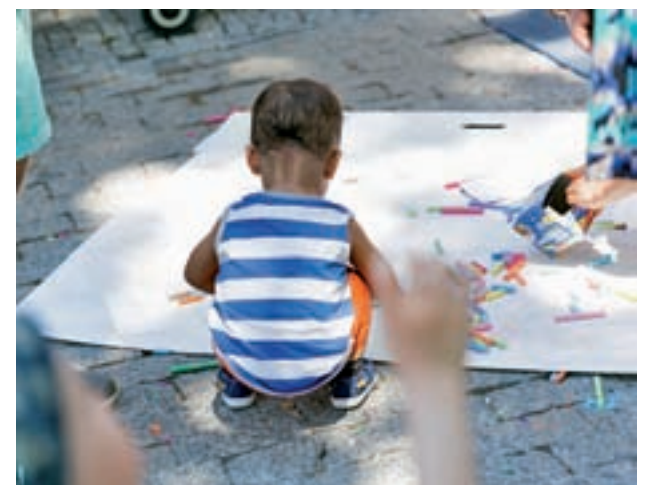
Un taller de tizas, una de las propuestas para niños y niñas

Bands de Nueva Orleans. Los más pequeños de la casa también tendrán sus propuestas en forma de talleres que serán por la mañana. A las 11:30 todo girará en torno a la tiza. Los participantes, tras un paseo por el barrio en busca del lugar sobre el cual trabajar, hablarán sobre la ciudad y los colores. Una hora después, el turno será para las semillas. Se podrán plantar el mismo día del taller y los participantes podrán llevarse a casa sus propias bombas de semillas para seguir poblando de verde la ciudad.