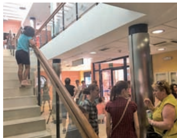
El nuevo espacio de uso ciudadano

En este espacio se desarrollarán, entre otras, actividades de asesoramiento a víctimas de violencia machista, acompañamiento a familias