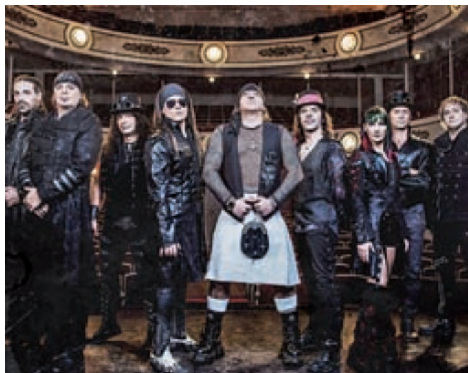
Conciertos La música cobrará especial protagonismo con las actuaciones de Riot Propaganda (viernes 22:30 horas), la Orquesta Mondragón (sábado 22:30 h.) y Mägo de Oz (domingo 16 de julio, a las 22 horas).

de fuegos artificiales desde el Mirador del Parque del Cerro del Tío Pío.