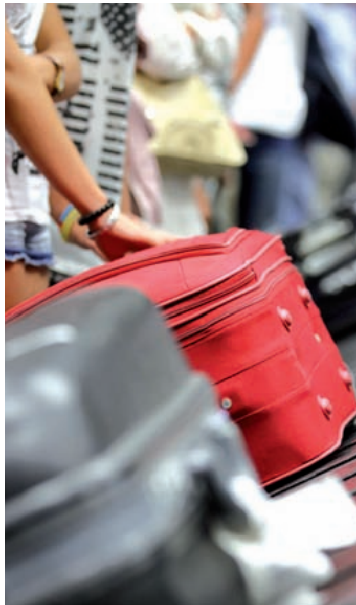
El año pasado los españoles salieron 14,11 días de vacaciones

En cuanto a las medidas de seguridad que instalarán en sus casas en la época estival, destacan las alarmas con conexión a central receptora (11,32%), cámaras (10,12%) o puertas blindadas (9,18%).