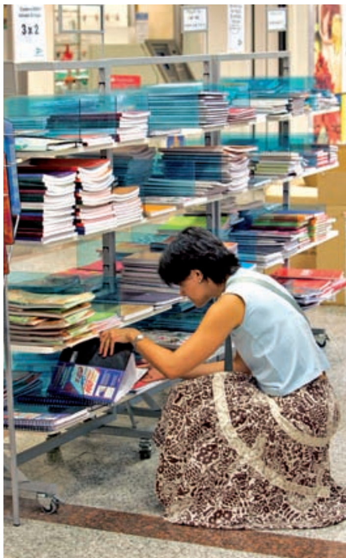
Las tiendas físicas pierden terreno

Pero el precio no es el único factor que provoca este cambio. La comodidad y el tiempo también influyen. En la prueba realizada por Textolibros.com, la búsqueda online