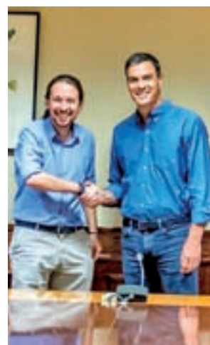
Iglesias y Sánchez

Tras el encuentro, al que asistieron las confluencias de la formación morada (En Comú Podem y En Marea), el líder socialista, Pedro Sánchez, y el de Podemos, Pablo Iglesias, siguieron discrepando sobre las consecuencias que tendrá a corto y medio plazo la colaboración iniciada.