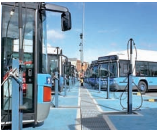
Refuerzos en los autobuses de la EMT