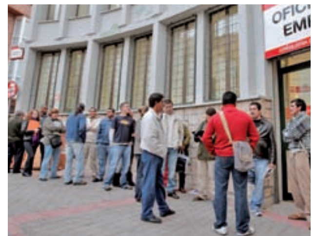
Oficina de empleo en Madrid

Comisiones Obreras, por su parte, realizó su propia valoración de los datos e insistió en que es "fundamental que desde la Comunidad de Madrid se apueste por políticas en materia económica para promover el desarrollo de nuevos sectores, de alto valor añadido y capacidad de generación de empleo". El sindicato señaló que hay un "parón" en la recuperación.