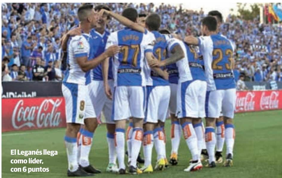
El Leganés llega como líder, con 6 puntos