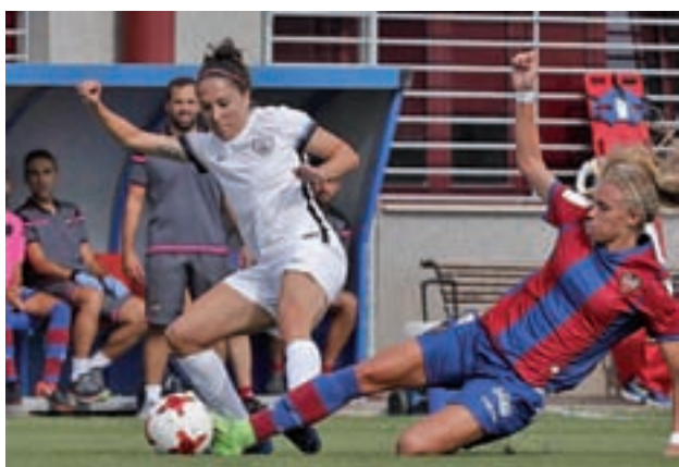
El Madrid CFF es noveno

Sea cual sea el balance de la jornada sabatina, el domingo 10 de septiembre será un día muy especial para Alberto Contador. Por última vez en su carrera profesional, el de Pinto se enfundará el maillot para cubrir los 117 kilómetros de los que consta la última etapa.