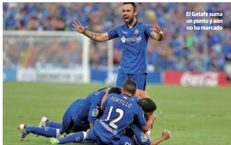
El Getafe suma un punto y aún no ha marcado