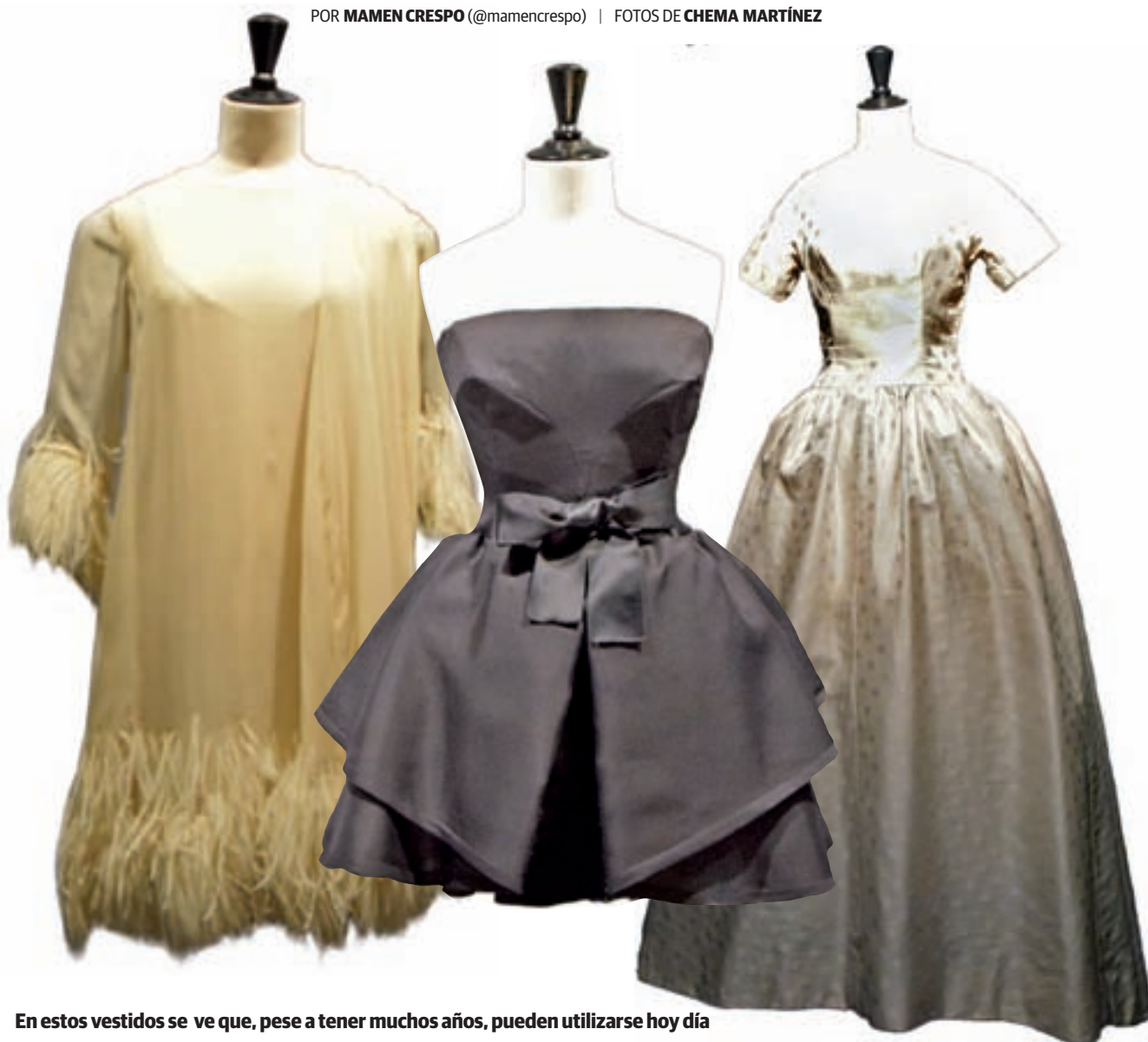
En estos vestidos se ve que, pese a tener muchos años, pueden utilizarse hoy día

POR MAMEN CRESPO (@mamencrespo)