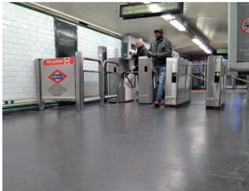
El vestíbulo de Alonso Martínez tendrá un nuevo acceso en Almagro

Todas estas medidas se enmarcan en el programa regional por el que se pretende implantar un modelo de gestión de estaciones con la figura del Supervisor Comercial, que conlleva, entre diferentes cuestiones, la presencia de más personal de Metro para