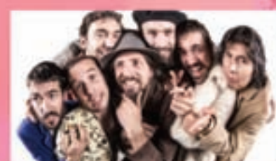
ALPARGATA Día 9. 22:00 h. en c/Rio Nela

Más información: Junta Municipal del distrito Moncloa-Aravaca @MoncloAravaca