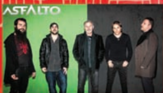
ASFALTO Día 9. 23:30 h. en c/Rio Nela