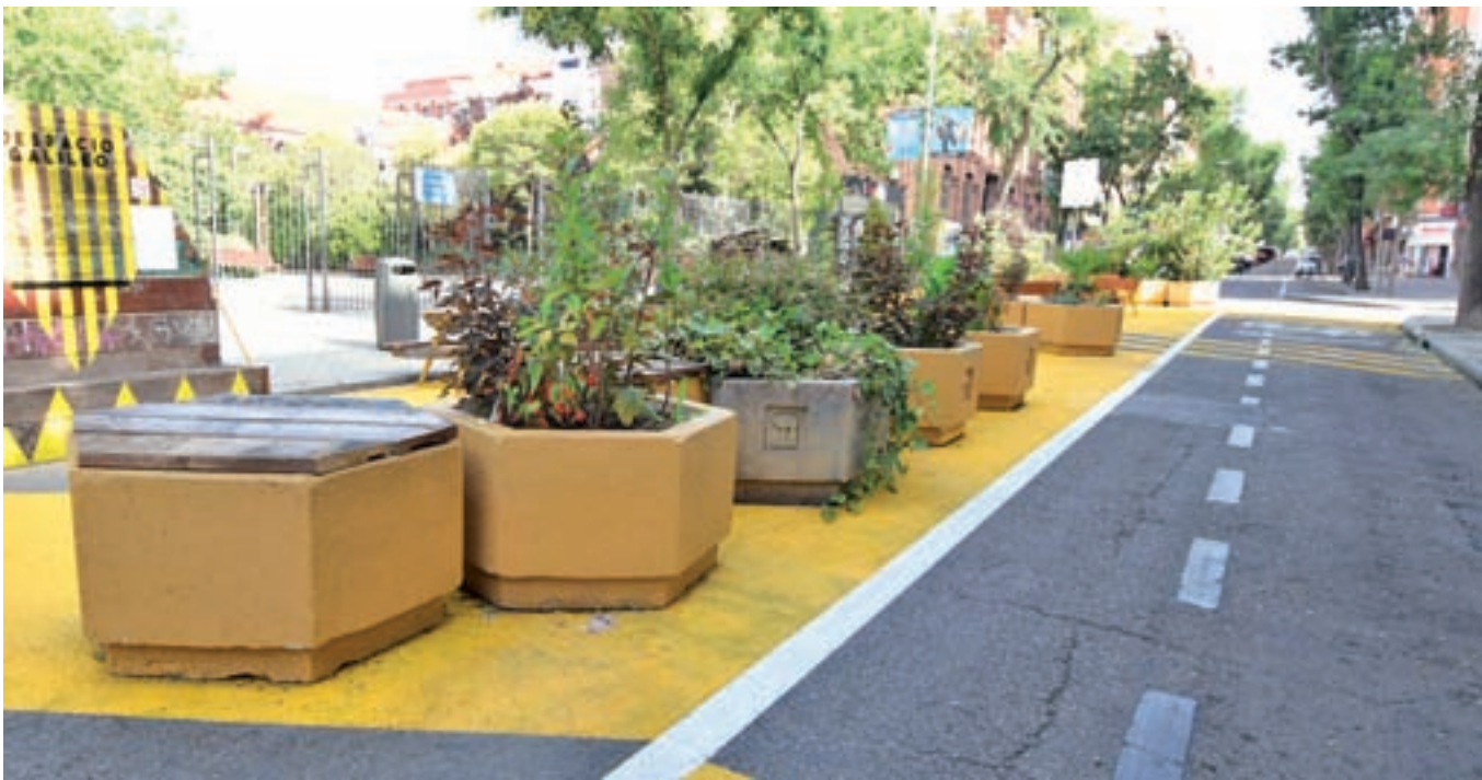
El Ayuntamiento ha revertido la peatonalización de la calle CHEMA MARTÍNEZ / GENTE