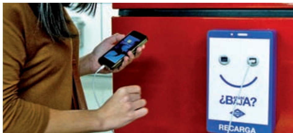
Uno de los nuevos cargadores de la red de Metro

rie 8.000 de la Línea 6 (24 puertos USB en cada tren). Precisamente la presencia de estos puntos de carga de dispositivos electrónicos en los vagones es otro de los objetivos de la compañía pública que se irán desarrollando en los próximos meses.