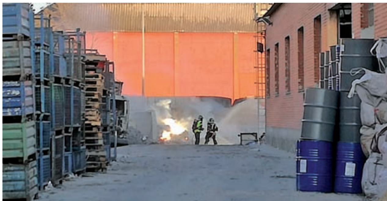
Bomberos apagando las llamas en la nave calcinada

Por otro lado, Robles ha destacado que es la Comunidad la que tiene las competencias educativas.