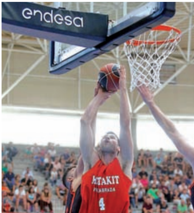
El Montakit, en un partido MONTAKIT FUENLABRADA

La pasada semana disputó sus encuentros del Circuito Movistar en Morlzarzal. El cuadro naranja cayó en los dos encuentros que disputó; 78-85 ante el Valencia Basket y 87-95 ante el Morabanc Andorra.