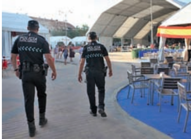
Se incrementará la seguridad en la ciudad GENTE

El pistoletazo de salida de las fiestas será el miércoles 13 con el tradicional desfile de peñas que arrancará a las 18 horas desde la calle Francia. A partir de las 20:30 el actor