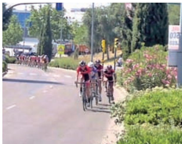
Pasada edición del Trofeo de Fiestas GENTE

Una prueba que se desarrollará este sábado 9 de sep-