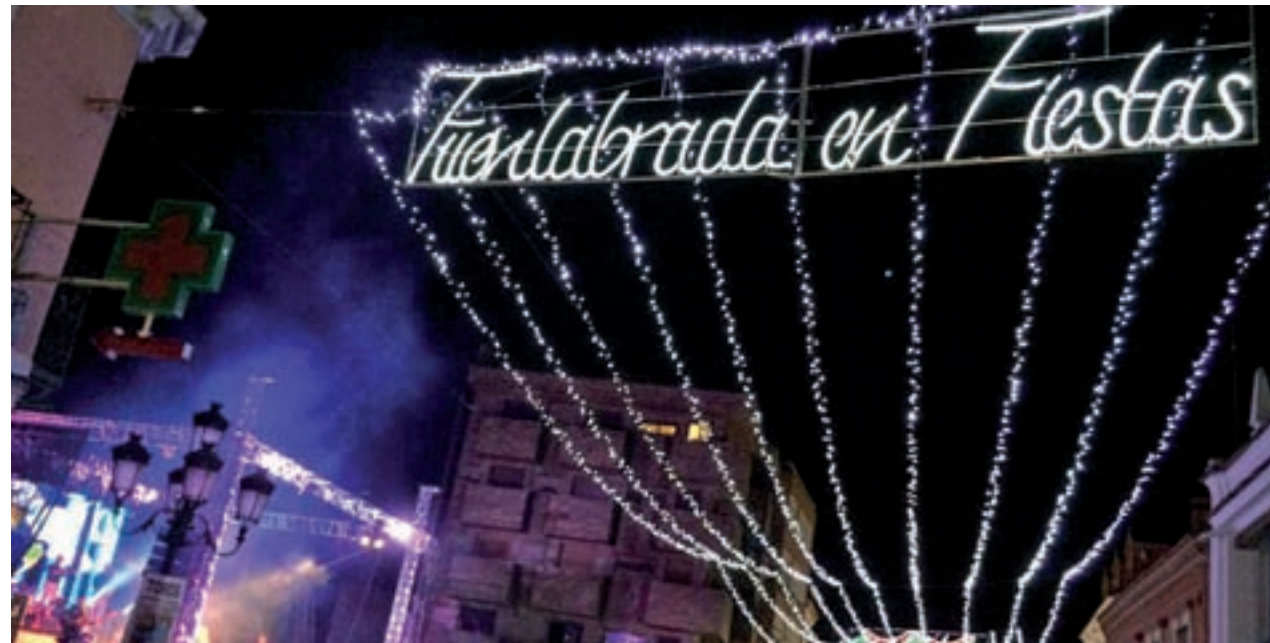
El próximo lunes 11 arrancan las fiestas patronales