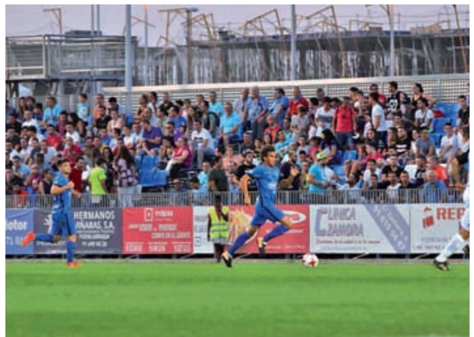
El Fuenla, durante el cruce de la Copa del Rey CF. FUENLABRADA

Por otro lado, los azulones han conseguido hacer historia en la ciudad al lograr alcanzar la tercera fase de la Copa del Rey tras vencer por 2-0 al Mérida el pasado miércoles en el Fernando Torres. Se trataba de la primera vez que el feudo fuenlabreño acogía un partido de esta competición.