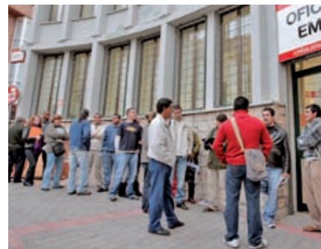
Oficina de empleo en Madrid

Comisiones Obreras, por su parte, realizó su propia valoración de los datos e insistió en que es "fundamental que desde la Comunidad de Madrid se apueste por políticas en materia económica para promover el desarrollo de nuevos sectores, de alto valor añadido y capacidad de generación de empleo". El sindicato señaló que hay un "parón" en la recuperación.