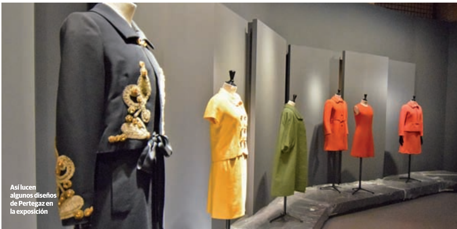
Así lucen algunos diseños de Pertegaz en la exposición