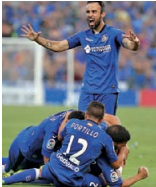
El Leganés llega como líder al derbi, mientras el Getafe sólo ha sumado un punto

comparables. Han pasado muchas campañas, catorce concretamente, desde que pepineros y azulones disputaran el último derbi oficial. Fue en el marco de la jornada 38 de Segunda División en el curso 2003-2004, el mismo que acabó teniendo desenlaces opuestos para estos clubes: mientras el Getafe lograba un ascenso histórico a la