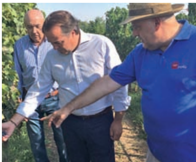
Vendimia en la Comunidad de Madrid

Por este motivo, Canal de Isabel II ha querido recordar que son los "pequeños gestos" los que logran reducir el consumo en los hogares, como cerrar el grifo.