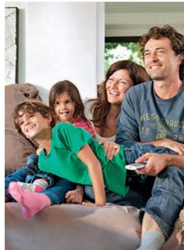
Sentirse a gusto en casa es importante para los madrileños

Respecto a las estancias de la vivienda preferidas por los entrevistados, el salón o comedor ocupa la primera posición del ranking (con un