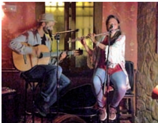
Té Canela tocará en Canillejas este viernes a las 22:30 h.

En el primero de los casos, los festejos serán en ho-