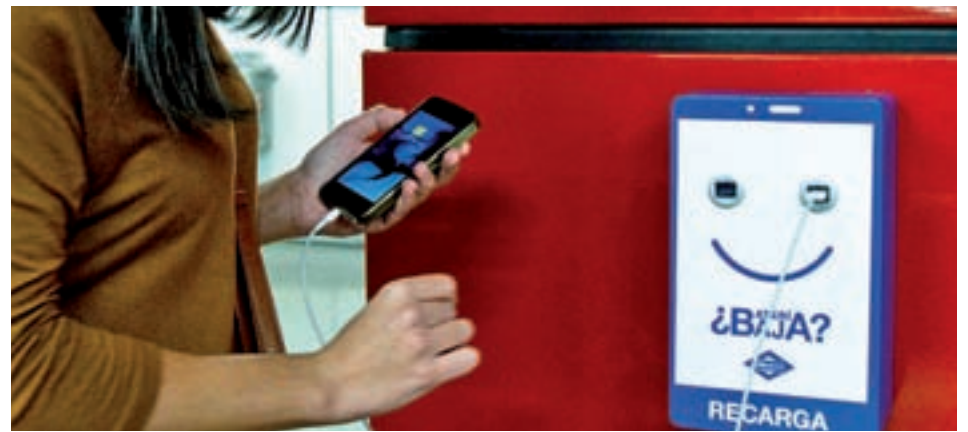
Uno de los nuevos cargadores de la red de Metro

rie 8.000 de la Línea 6 (24 puertos USB en cada tren). Precisamente la presencia de estos puntos de carga de dispositivos electrónicos en los vagones es otro de los objetivos de la compañía pública que se irán desarrollando en los próximos meses.