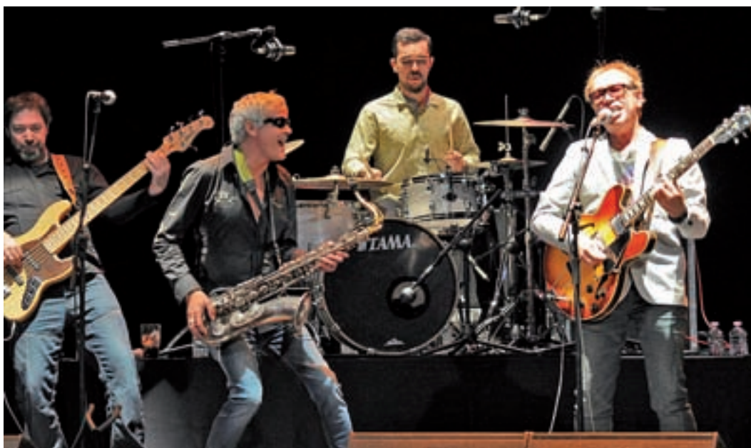
Nacha Pop actuará en el auditorio de Villa de Vallecas el sábado 16 de septiembre, a las 22:30 horas