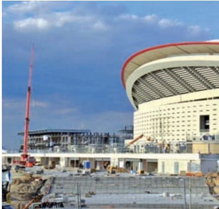
Los trabajos en el entorno del estadio rojiblanco

Esta circunstancia preocupa de forma considerable a los residentes de esta zona que ya padecen atascos en hora punta en el entorno de la avenida y de la glorieta de Arcentales. La Coordinadora de Asociaciones Vecinales de San Blas-Canillejas advierte del