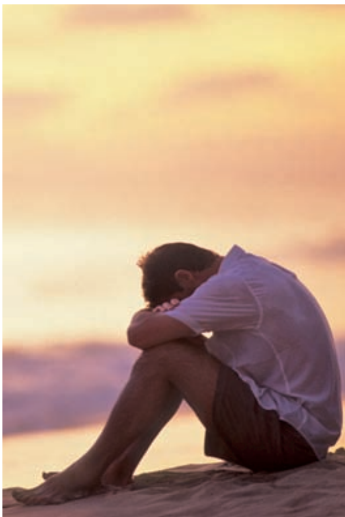
El suicidio afecta especialmente a los jóvenes varones

Por ello, en el congreso se apuntó que el sistema de salud pública debe asumir el desafío de aprender a detectar el riesgo suicida o los trastornos afectivos a tiempo, tra-