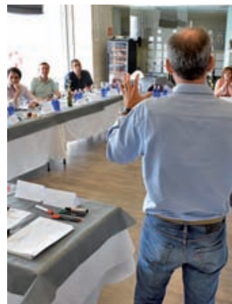
Varios momentos de una de las jornadas del 'Invictus Day'