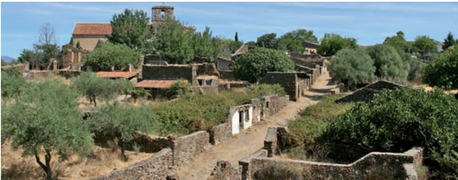
Granadilla, en Cáceres, es uno de los pueblos abandonados del país