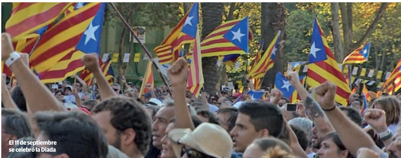
El 11 de septiembre se celebró la Diada