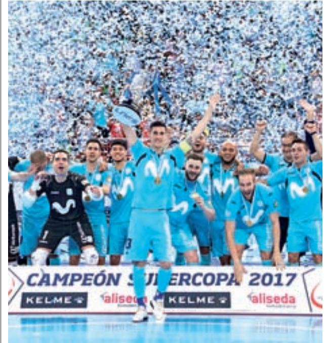
El Movistar Inter conquistó la Supercopa ante ElPozo

En esta primera fecha, el campeón de Liga recibirá en la noche del viernes (21:15 horas) al Peñíscola RehabMedic, mientras que el Barça y ElPozo se estrenarán a domicilio, visitando al Aspil Vidal Ribera Navarra y al O Parrullo Ferrol, respectivamente.