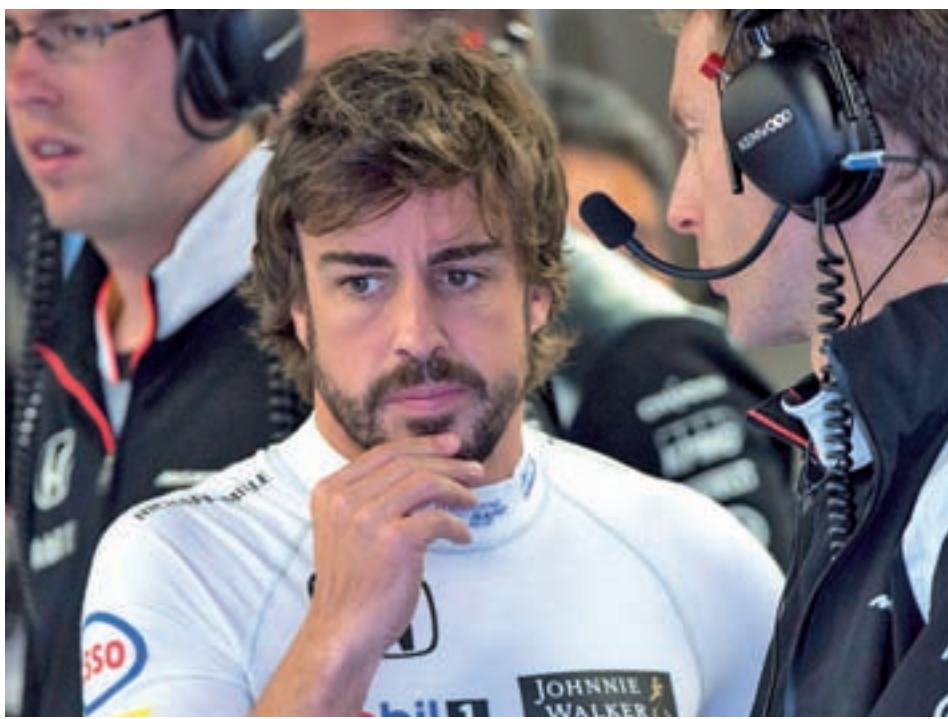
El futuro del bicampeón del mundo sigue estando en el aire