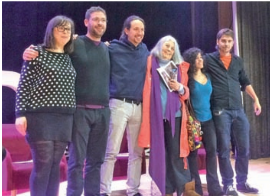
Fachin e Iglesias (segundo y tercero por la izquierda) en un acto de campaña

No obstante, la muestra más clara de estas diferencias se pudo apreciar el 11 de septiembre, en la celebración de la Diada, cuando el líder de Podem, Albano Dante Fachin, acudió a una ofrenda floral en favor de la independencia, mientras que a la misma hora el cabeza de partido a nivel nacional, Pablo Iglesias, participaba en un acto con la