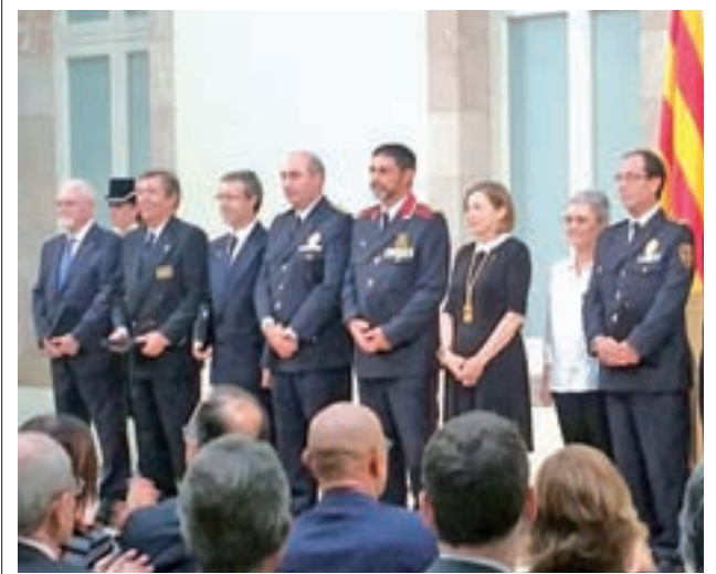
Acto de entrega

En el extremo contrario, Iglesias llamó a la unidad entre Podemos y sus confluencias, aunque advirtiendo de que “ningún planteamiento individual” como el de Fachin puede estar “por encima” del partido, que es “un instrumento imprescindible” para las clases populares.