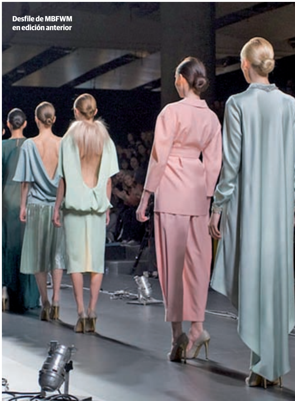
Desfile de MBFWM en edición anterior