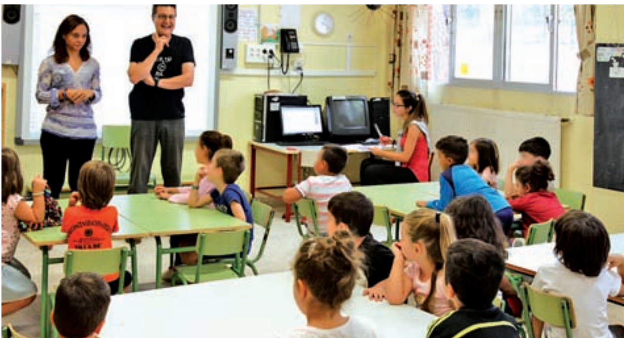
Alumnos recibiendo clases en un colegio de Getafe