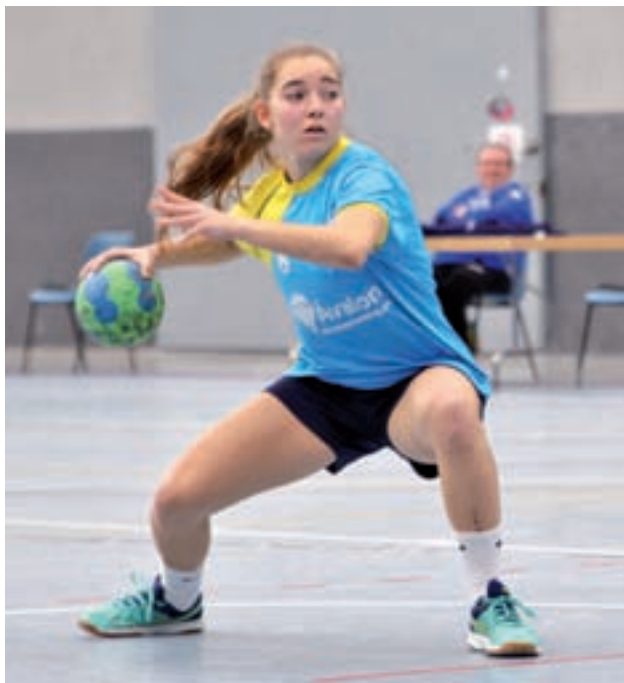
El Getasur, en un encuentro GENTE

Por su parte, el Roquetas suma una derrota y una victoria en sus últimos encuentros. Actualmente, ocupa la séptima plaza.