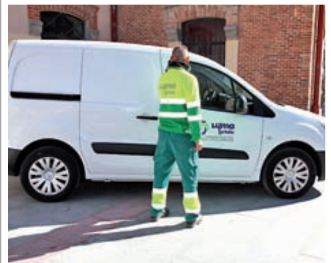
Trabajador del LYMA durante uno de sus servicios

El concejal de Urbanismo, Jorge Rodríguez, considera a este como uno de los más importantes desarrollos para el futuro de la ciudad, "por su enclave estratégico y por lo que supondrá para el crecimiento de empresas como Airbus en Getafe". Por ello quieren que se realice además un estudio para la ejecución de la urbanización por fases, según las necesidades.