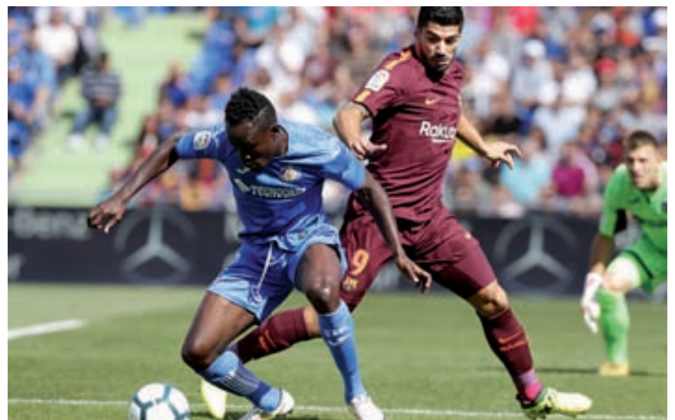
El Getafe en su cruce con el Barça la pasada semana