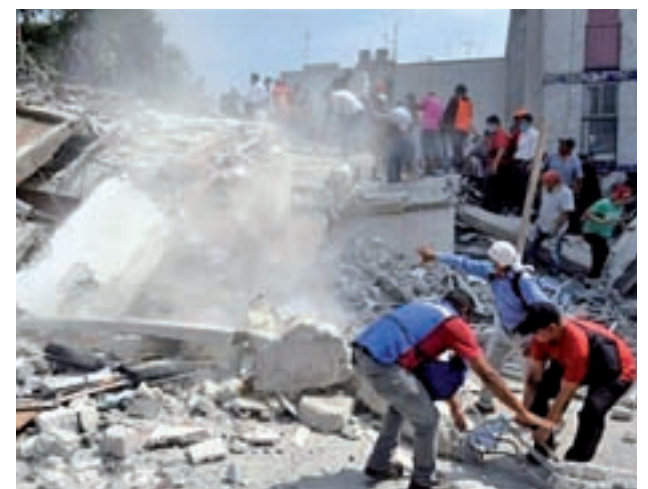
Una de las zonas afectadas por el terremoto

La Comunidad de Madrid ha puesto a disposición del Ministerio de Interior al equipo de Emergencia y Respuesta Inmediata de la Comunidad de Madrid (Ericam) para salir hacia México en cuanto se lo pidan. Esta unidad ya ha actuado en otras catástrofes similares en los últimos tiempos, como la ocurrida en Haití.