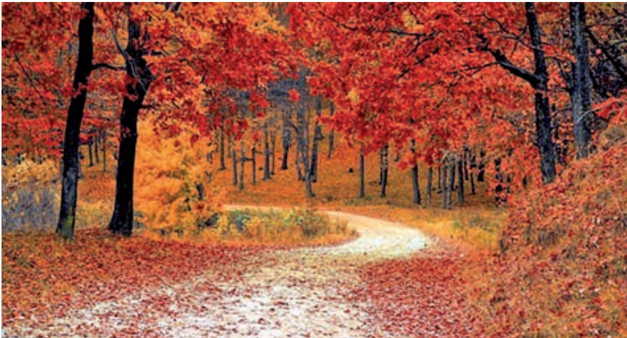
El otoño llega este fin de semana