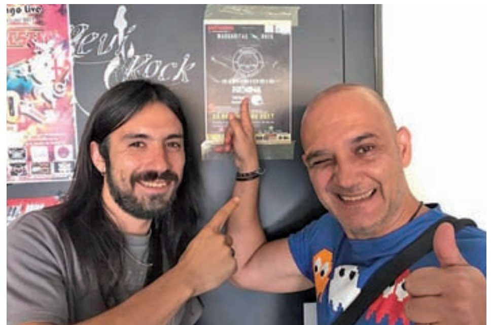
Parte de los miembros de Rexina, grupo que tocará en el festival de Las Margaritas REXINA

Muestras artísticas, gastronomía, mercadillo, talleres, fiesta de la espuma o actividades para niños, que se completan con la celebración del primer Festival Margaritas Rock