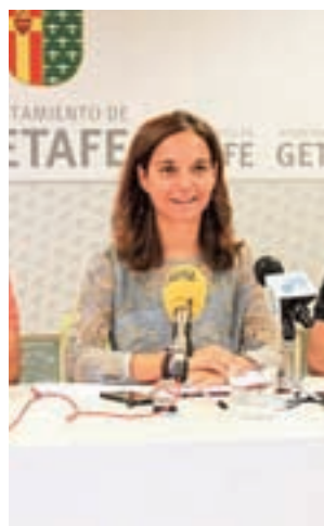
Rueda de prensa

diata las gestiones para realizar la redacción y ejecución simultánea de los proyectos de urbanización y parcelación de la II fase de la zona, según está establecido en el plan de sectorización. Además, se solicita que acometa