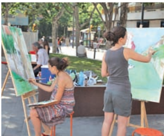
Participantes, en años anteriores