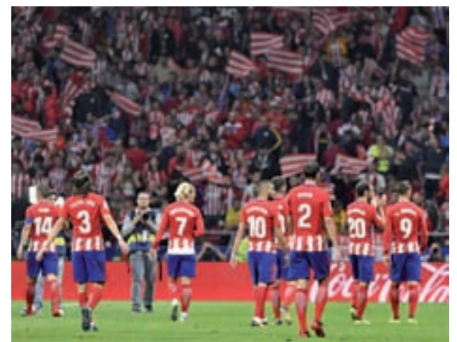
El Atlético se estrenó con victoria en su nueva casa

que el nuevo feudo rojiblanco será el escenario de la final de la Liga de Campeones para la próxima temporada, es decir, el 1 de junio de 2019. Así lo ha decidido la UEFA en un congreso extraordinario, por lo que el Wanda Metropolitano tomará el testigo del Santiago Bernabéu, estadio de la final continental en la temporada 2009-2010.