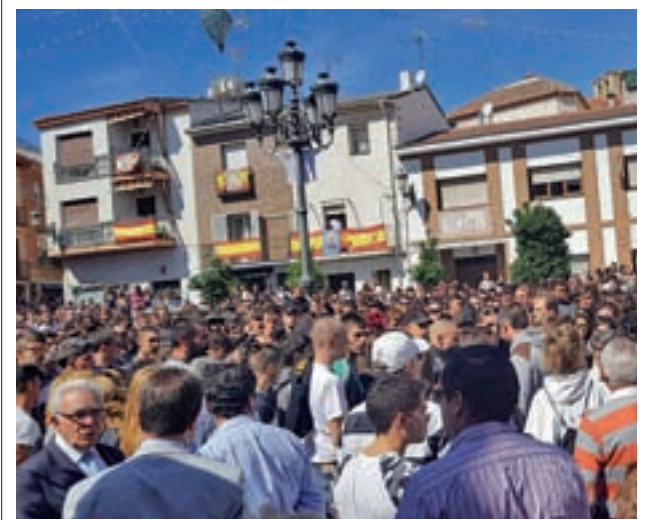
Concentración en San Agustín del Guadalix FORO SAN AGUSTÍN

puestado con 543,9 millones de euros, ha sido aprobado sin necesidad de ser debatido en el Pleno. Tras darse a conocer el escrito, el PP anunció que pedirá un Pleno extraordinario para debatir este programa, en el que defenderán un modelo para "incentivar alternativas de movilidad"; algo en lo que coincide C's, que reclama "incentivos y no prohibiciones". El PSOE está "satisfecho" con los cambios.