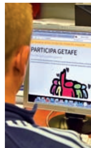
Página Participa Getafe

El actual Gobierno local celebró por primera vez el 14 de julio de 2016 el Pleno anual del debate sobre el estado del municipio, que está reflejado en el Reglamento de Participación Ciudadana para que sea de obligado cumplimiento.