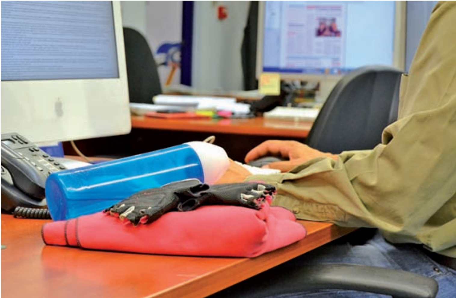
ALBA RODRÍGUEZ / GENTE