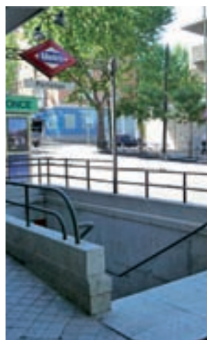
Estación de Portazgo

Las obras tendrán una duración de entre 7 y 30 meses, una vez que se resuelvan los