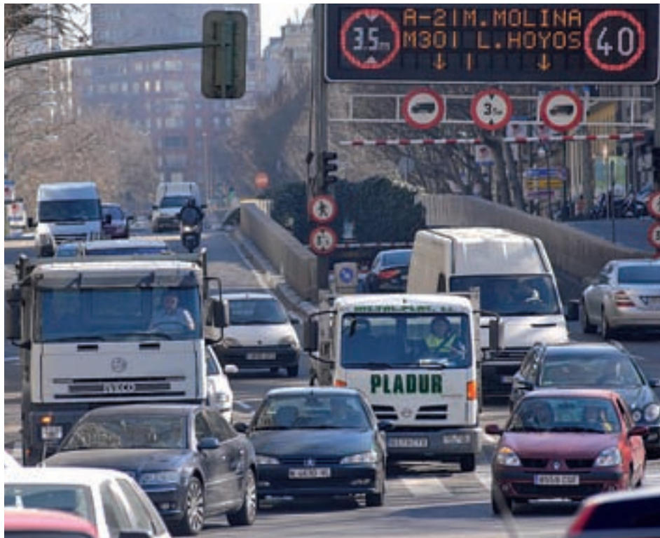
Se limitará el acceso al Centro

Estas son dos de las 30 medidas del Plan A de Calidad del Aire y Cambio Climático, que está enfocado a reducir la contaminación atmosférica. En este sentido, el Consistorio establece el año 2025 como fecha límite para vetar la circulación en toda la ciudad a los vehículos más contaminantes. Así, Madrid espera reducir sus emisiones en un 25% en 2020. Dos años antes, a partir de 2018, los nuevos taxis deberán ser de emisiones cero o, en su defecto,