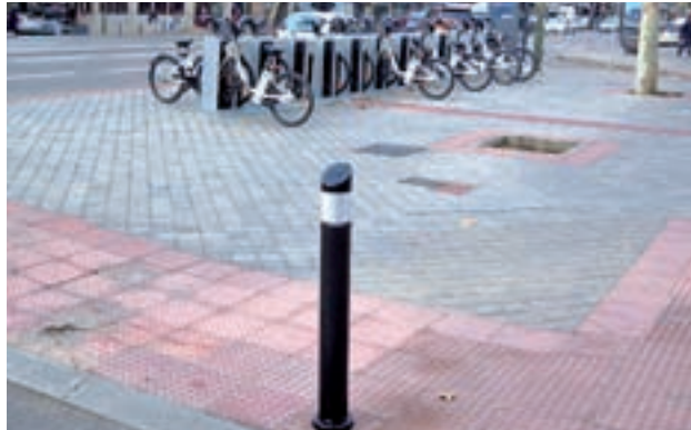
Fijos o retráctiles: Los informes municipales recomendarán que tipo de elemento sería adecuado para cada vía. Su resultado será trasladado al Ministerio del Interior para su consideración

Barbero subrayó que lo que hace el Ayuntamiento es "seguir las indicaciones y recomendaciones de los expertos y de las autoridades competentes, como Delegación de Gobierno, Policía Nacional y Ministerio del Interior". En este punto, insistió en que