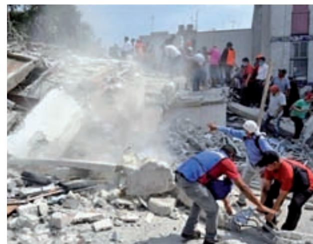
Una de las zonas afectadas por el terremoto

La Comunidad de Madrid ha puesto a disposición del Ministerio de Interior al equipo de Emergencia y Respuesta Inmediata de la Comunidad de Madrid (Ericam) para salir hacia México en cuanto se lo pidan. Esta unidad ya ha actuado en otras catástrofes similares en los últimos tiempos, como la ocurrida en Haití.