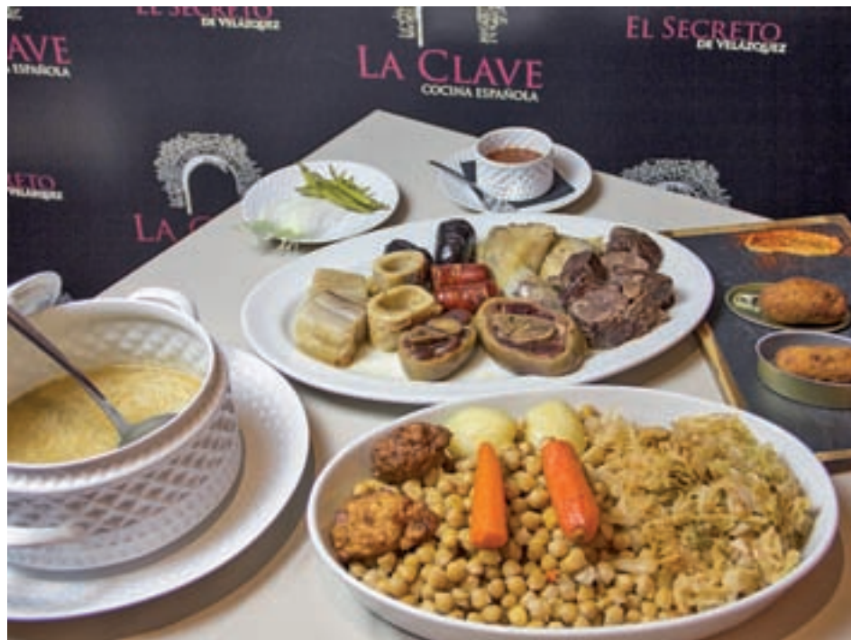
El tradicional cocido no podía faltar

tradicionales, algunas de ellas caídas en el olvido. Más allá de clásicos como el cocido madrileño (en cuatro vuelcos), los callos, las sopas de ajo y el pollo en pepitoria, se rescatan los soldaditos de Pavía, los pimientos rellenos de manitas de lechal, el 'empedrado de lechal' o el besugo a la madrileña. De postre se podrán degustar las rosquillas