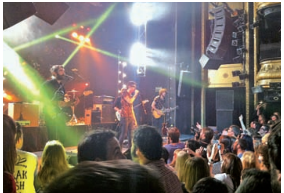
El grupo indie Miss Caffaina actuará el sábado 29 en el auditorio del Parque Berlín