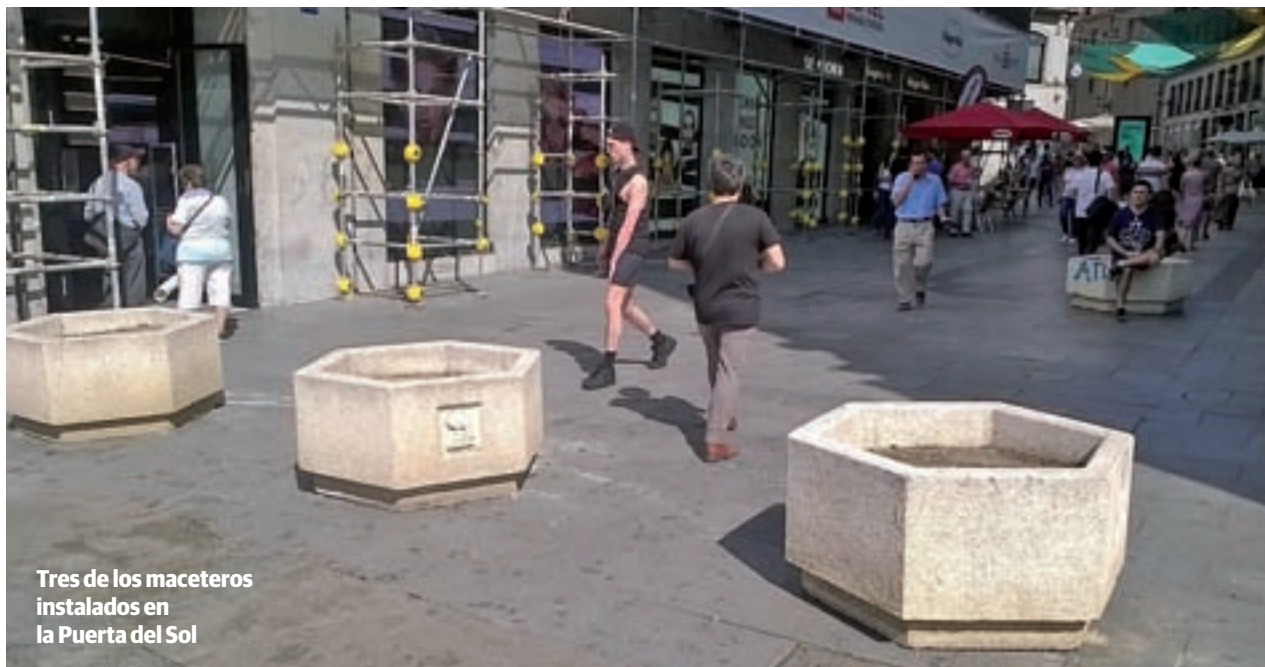
Tres de los maceteros instalados en la Puerta del Sol

son los expertos los que determinan las medidas a seguir. Ahí es donde ha enmarcado la decisión del Ministerio del Interior de mantener el nivel de riesgo en cuatro, no elevarlo a cinco. Por otro lado, el delegado no desveló muchos más detalles de ese binomio "complicado" seguridad-libertad pero sí insistió en que la colaboración con otros Cuerpos es "muy fluida y permanente".