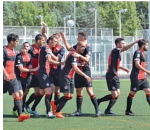
El Adarve es decimosexto en la tabla