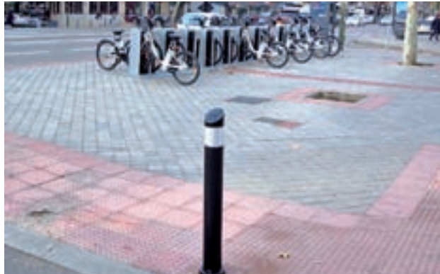
Fijos o retráctiles: Los informes municipales recomendarán que tipo de elemento sería adecuado para cada vía. Su resultado será trasladado al Ministerio del Interior para su consideración

Barbero subrayó que lo que hace el Ayuntamiento es "seguir las indicaciones y recomendaciones de los expertos y de las autoridades competentes, como Delegación de Gobierno, Policía Nacional y Ministerio del Interior". En este punto, insistió en que