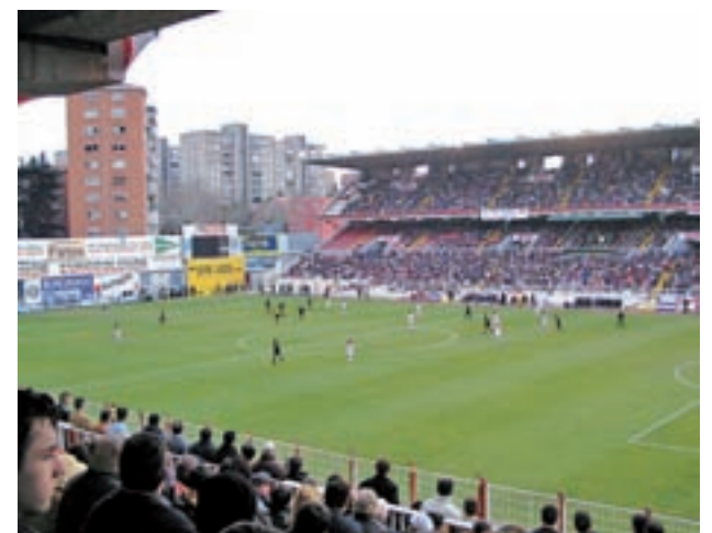
El feudo franjirrojo de la avenida de la Albufera

Por otro lado, añaden que cada cuatro meses solicitan a una empresa especializada en estructura de edificios un informe que garantice que no hay riesgo para la seguridad de las personas. Estos informes son posteriormente enviados al Ayuntamiento de Madrid. Las obras no supondrían el cierre del estadio.