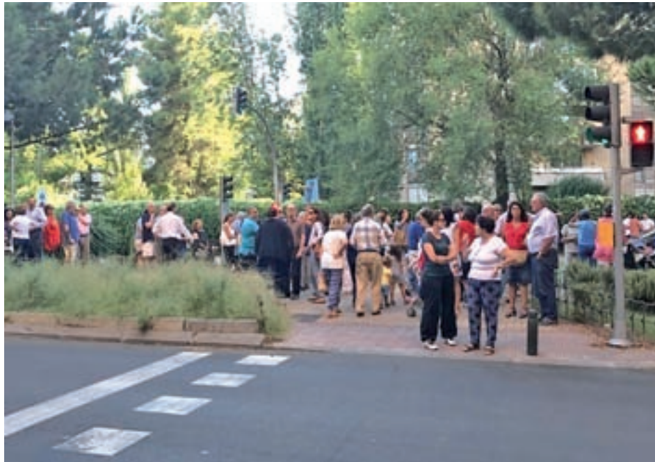
Un momento de la concentración del pasado 13 de septiembre

Su voz tuvo eco en el Pleno de Ciudad Lineal de la semana pasada, a través de una iniciativa del PP en virtud de cual la Junta instará al área correspondiente para solicitar la desaparición del mencionado carril y que fue aprobada con los votos en contra de Ahora Madrid y la abstención de Ciudadanos. Posteriormente hubo una concentración ciudadana y el PP llevará esta cuestión al Pleno de Cibeles del 27 de septiembre.