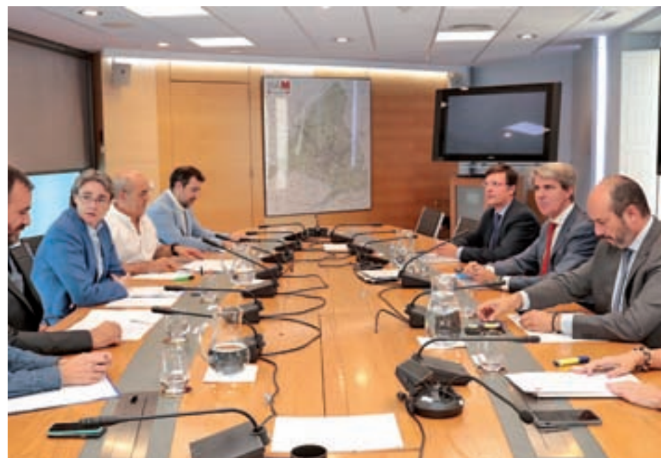
Un momento de un encuentro entre las administraciones madrileñas

"Va a ser el modelo, el piloto de convenios que vayamos firmando la Comunidad y los ayuntamientos. Por eso es importante que nos sentemos y que lo hagamos bien porque servirá de referencia para el resto de realojos", argumentó el portavoz del Go-