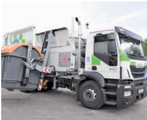
Uno de los nuevos camiones de recogida de basura

Un sondeo de la Asociación Vecinal PAU Ensanche de Vallecas, realizado el pasado mes de julio, evidenció que el 81,4% de los residentes de esta zona rechazaban abiertamente los planes municipales. Los ciudadanos consideran que la modificación traerá más suciedad a la vía pública y supondrá una pérdida de empleo.