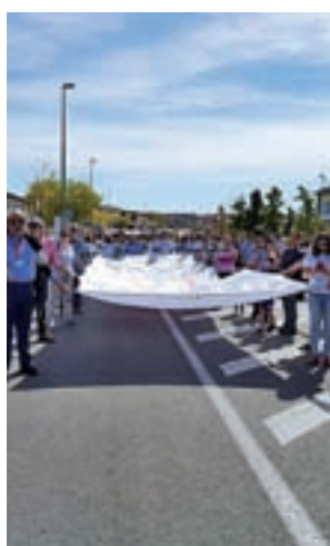
Un momento del acto

El último paso será el traslado a la nueva vivienda y derribo de la antigua.