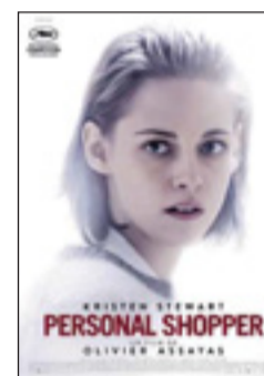
PERSONAL SHOPPER Dir. Olivier Assayas. Int. Kristen Stewart, Lars Eidinger. Drama / Fantástica.

SACRIFICIO DE LEYENDA. Dir. Ben Younger. Int. Miles Teller, Aaron Eckhart. Drama.