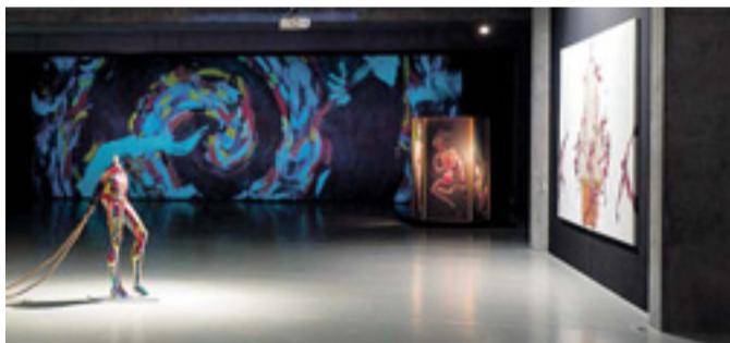
HASTA EL 24 DE SEPTIEMBRE. CAB, Centro de Arte contemporáneo de la Fundación Caja de Burgos, C/ Saldaña s/n.