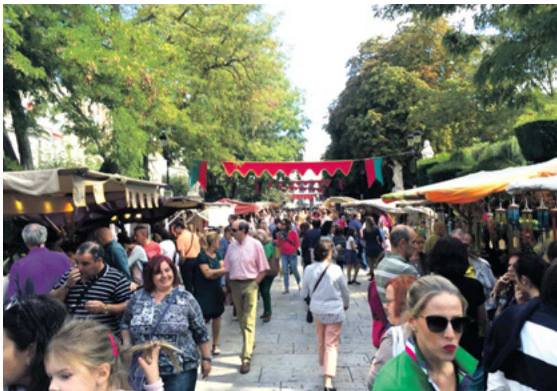
Como en ediciones anteriores, se instalará un mercado y un campamento medieval.

Por otro lado, el presidente de la otra entidad organizadora, la Asociación de Amigos del Caballo de Burgos,