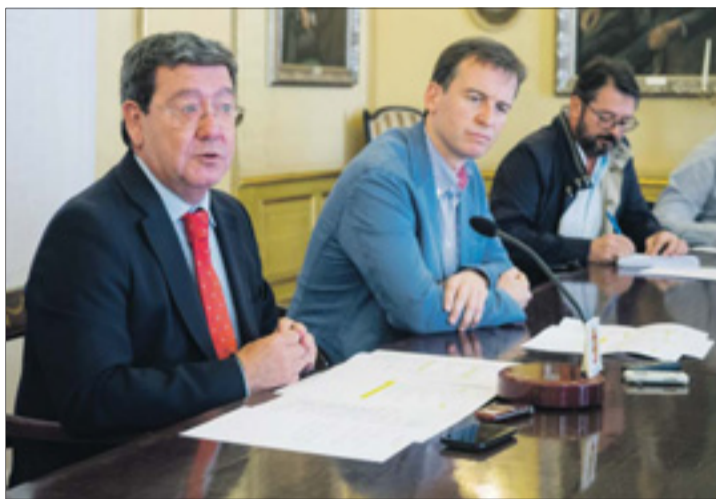
El presidente de la Diputación, César Rico, presentó la programación el jueves 21.

También se llevará a cabo un "reconocimiento público" a la mujer trabajadora que está al frente de negocios", tanto en la capital como en la provincia, y se reali-