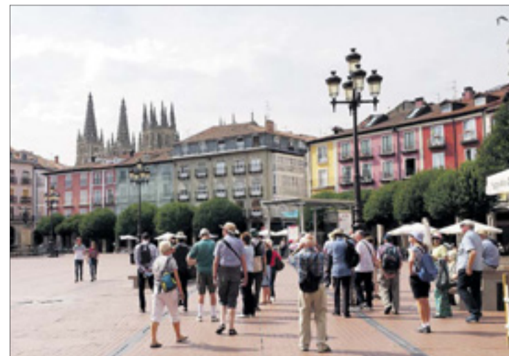
Un grupo de turistas mientras visita la Plaza Mayor de la ciudad.

A este respecto, quiso apuntar que en cuanto reciba la solicitud planteada por la fundación para "participar de forma directa" en la misma emitirá una respuesta "formal" afirmativa.