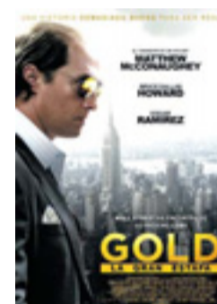
GOLD, LA GRAN ESTAFA Dir. Stephen Gaghan. Int. Matthew McConaughey, Edgar Ramirez. Drama.