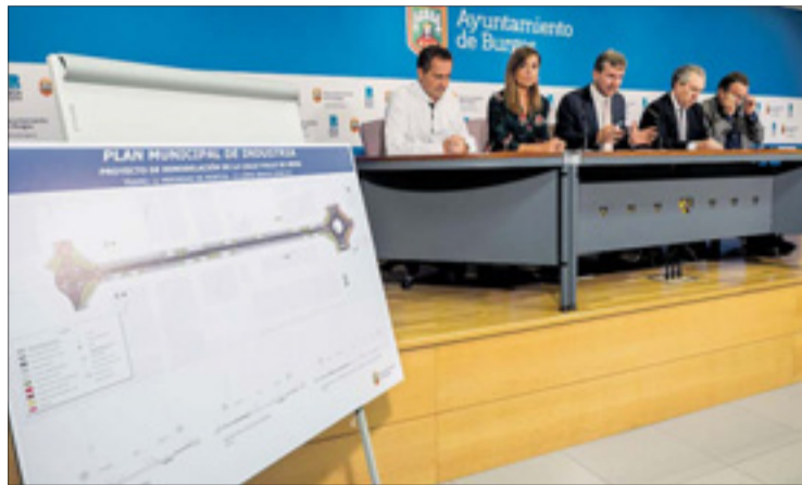
Presentación de la nueva fase de urbanización del polígono industrial de Villalonquéjar el día 20.

Con un presupuesto base de licitación de 1.393.745 euros y un plazo de ejecución de ocho meses, la previsión del Gobierno local es que este proyecto salga a concurso “la próxima semana”, de tal forma que las obras puedan estar adjudicadas “en noviembre” y comiencen en la segunda quincena de enero de 2018. “El objetivo de esta nueva urbanización en el polígono de Villalonquéjar -el segundo más grande de Castilla y León, con