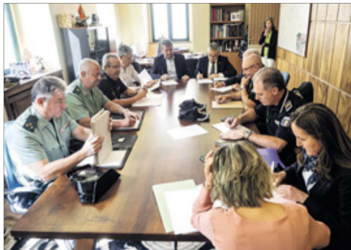
La reunión, que se celebró con carácter extraordinario, tuvo lugar el lunes 18.

De esta forma, señaló, se ha llegado al "acuerdo" de que la Policía Nacional refuerce la acción "al comienzo, final y desarrollo de los operativos" que la Policía Local lleva a cabo con el fin de minimizar la práctica del denominado botellón. Cabe recordar que la reunión extraordinaria de la Junta Local de Seguridad se celebró con motivo de la agresión que sufrió un vecino del Casco Histórico Alto, de 35 años, la noche del viernes