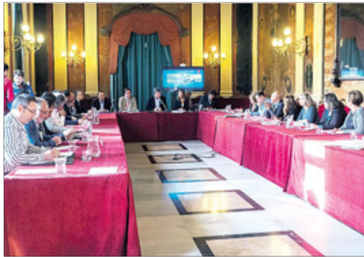
La reunión del Consejo Social de la ciudad tuvo lugar el lunes 18.

Una serie de propuestas que, en gran parte, señaló el regidor, se podrán llevar a cabo puesto que son "relativamente sencillas" y se trata de "actuaciones concretas y necesarias para la calidad de vida" de los vecinos. Actualmente, los servicios técnicos municipa-