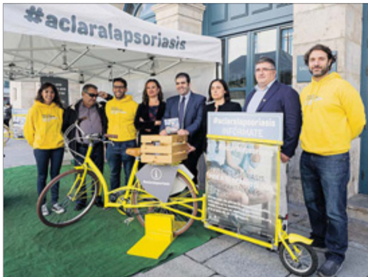
La campaña se lleva a cabo en horario de 10.00 h. a 20.00 h, hasta el sábado 23.

Otro aspecto sobre el que Santiago Alfonso quiso llamar la atención es que se trata de una enfer-