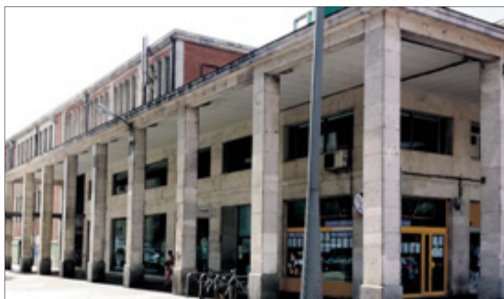
El Mercado Norte ha cumplido ya cincuenta años de actividad.

La intención del Ayuntamiento, según Blasco, es que el concurso de ideas "pueda convocarse este año" para poder licitar las obras, "siempre que dispongamos de presupuesto, en 2018".