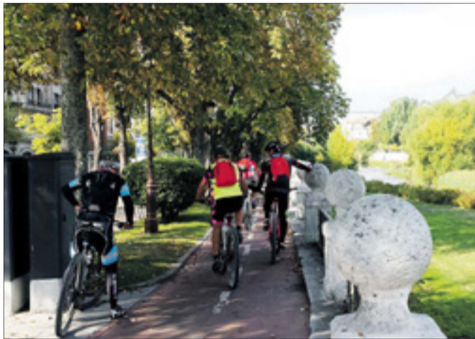
Lo más habitual en Burgos es la acera bici, como la del Paseo del Espoloncillo.

Para ello, la asociación propone el desarrollo de 96,1 km. de vías ciclistas -actualmente hay 54,2 en servicio-, lo cual no significa que haya que construir esa distancia, ya que en muchas ocasiones solo se requiere señalización. Es decir, la mayor parte, 30 km. (32%), correspondería a 'ciclocalles', que son de uso compartido de distintos vehículos, de un solo carril, con preferencia para bicicletas y con velocidad máxima de 30km/h. Proponen hacerlo, por ejemplo, en la C/ Santander. A este respecto, apuntó Fernández, el plan requiere de la "asunción" de nuevos conceptos, puesto que se deben diferenciar "13 vías ciclistas distintas". "Estamos acostumbrados a llamar a todo carril-bici", señaló.