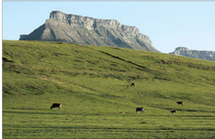
El paisaje geológico del Valle de Mena cuenta con hitos tan destacados como los Montes de La Peña, formación de gran interés geológico, paisajístico y ecológico.

La programación se desarrollará los días 23 y 24 de septiembre e incluye actividades como la observación e interpretación del paisaje geológico del Valle de Mena, con hitos tan destacados como el diapiro de Mena -Punto de Interés Geológico de la provincia de Burgos, que ocupa toda la cuenca alta menesa del río Cadagua-, o la gran cresta cretácica de los Montes de La Peña, con su gran tolmo de aspecto ruiforme, conocido entre los meneses como Pico del Fraile.