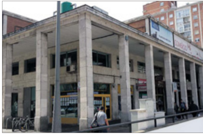
Se modificará tanto el edificio en sí como todo el entorno del Mercado Norte.

La intención del Ayuntamiento es que el concurso de ideas "pueda convocarse este año" para poder licitar las obras, "siempre que dispongamos de presupuesto, en 2018, indicó la concejala portavoz. "Es un proyecto que no es ni para cinco meses ni