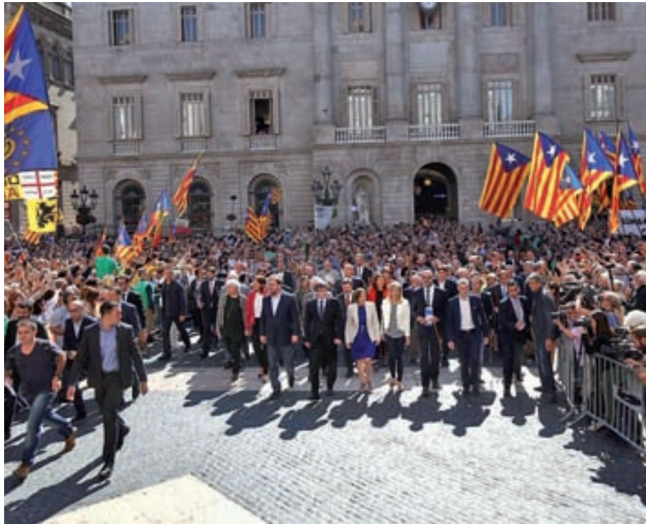
El Govern en un acto de apoyo a los alcaldes que respaldan el referéndum

Otra de las bazas que ha jugado la Administración central para frenar esta iniciativa liderada por Carles Puigdemont es controlar el uso de las tarjetas de crédito de los altos