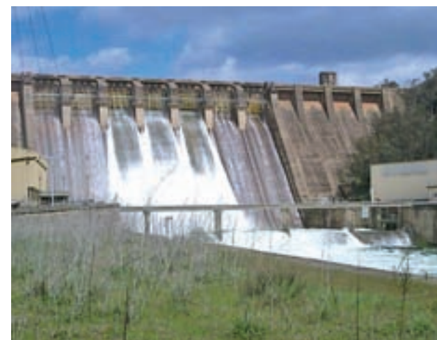
Los embalses del Guadiana están al 45,9%

Por ámbitos, la reserva se encuentra al 72,6% en el Cantábrico Oriental; al 70,4% en el Cantábrico Occidental; al 50% en Miño-Sil; al 56% en Galicia Costa; al 57,1% en las cuencas internas del País Vasco; al 33,4% en el Duero; al 41,6% en el Tago y al 45,9% en el Guadiana.