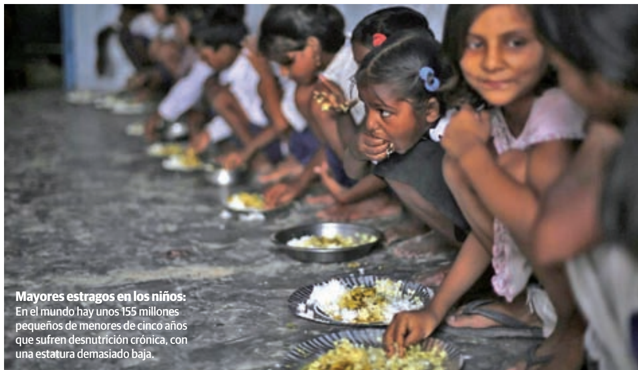
Mayores estragos en los niños: En el mundo hay unos 155 millones pequeños de menores de cinco años que sufren desnutrición crónica, con una estatura demasiado baja.

Así se desprende del informe que acaba de publicar la Organización de las Naciones Unidas para la Alimentación y la Agricultura (FAO), la primera evaluación global de la ONU sobre la seguridad alimentaria y nutrición que se publica tras la adopción de la Agenda 2030 para el Desarrollo Sostenible, que se marca como objetivo principal acabar con el hambre y todas las formas de malnutrición. Una de las prioridades esenciales de las políticas in-