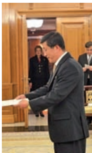
Embajador de Corea del Norte

cado que "deberá cesar en sus funciones y abandonar el país antes del 30 de septiembre". Con esta medida, el Gobierno nacional muestra su rechazo a las pruebas nucleares y de misiles puestas en marcha en las últimas sema-