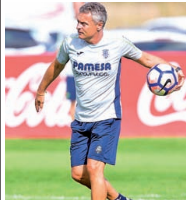
Fran Escribá ya no está al frente del Villarreal

Además, pocas horas después presentaba su dimisión Manolo Márquez en la Unión Deportiva Las Palmas. De este modo se supera la cifra de la temporada anterior. En aquella ocasión fueron el Valencia y el Granada que prescindieron de Ayestarán y Jémez.