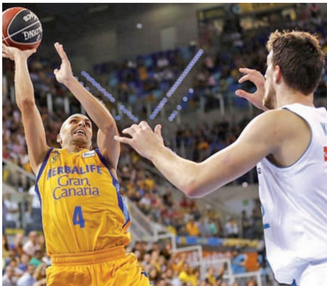
El Herbalife Gran Canaria mandó un serio aviso al Real Madrid el pasado viernes en la Supercopa