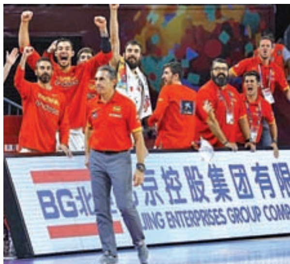
La actividad de la selección no se reducirá al verano

como la Euroliga. Precisamente este último organismo mantiene un pulso con la Federación Internacional (FIBA) en el que la falta de consenso puede acabar pasando factura a los equipos, ver-