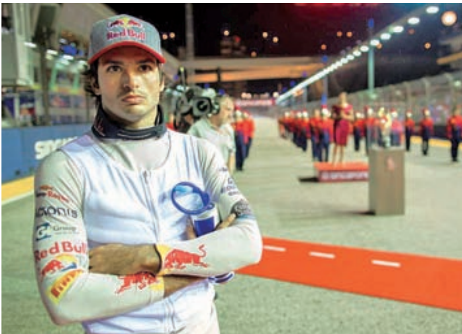
El piloto madrileño acabó el GP de Singapur en cuarta posición