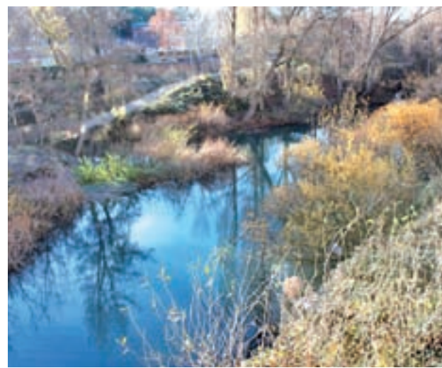
Reserva del Júcar

En total, de los 11.132 siniestros contabilizados en lo que va de 2017, 6.906 fueron conatos en los que ardió una hectárea de suelo o menos, mientras que otros 4.226 fueron incendios en los que se quemó una superficie mayor. De estos últimos, 21 fueron grandes incendios forestales (GIF) que afectaron a más de 500 hectáreas de superficie, habiendo cuatro sucesos de este tipo más que el año pasado y cinco más que la media del decenio.