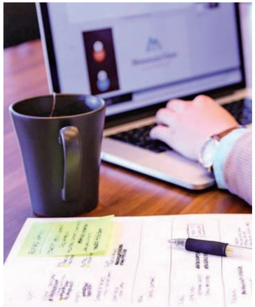
El café en el trabajo, aliado indispensable

Pero aquí no acaba la cosa. Existen numerosas razones para tomar café en el trabajo y es por esto que para muchos trabajadores, esta bebida es indispensable durante las ocho horas de su jornada laboral. Según el estudio, gracias a su alto contenido en cafeína, estimula la actividad cerebral y la concentración.