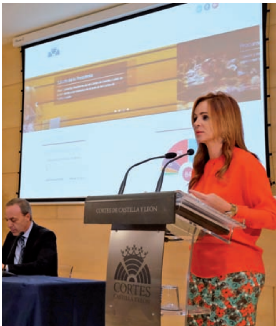
La presidenta de la Cámara, Silvia Clemente, en la presentación

Además, en la nueva web del Parlamento de Castilla y León adquieren también una mayor presencia los grupos políticos con representación, ya que se ofrecerá informa-