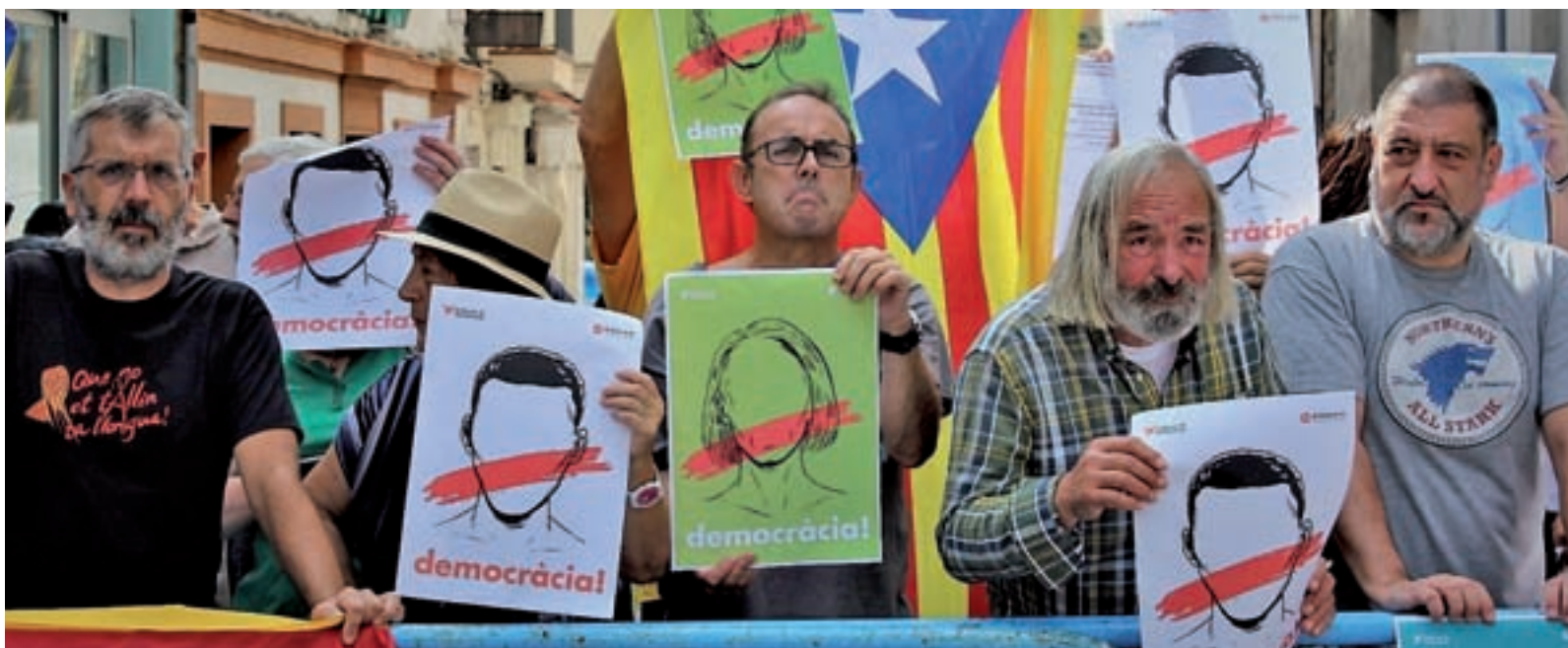
Protestas en la calle a favor del referéndum