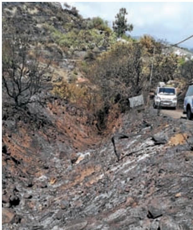
Incendio de la semana pasada en Huelva

Los datos del Gobierno central apuntan a que se han registrado 11.132 incendios forestales en los primeros nueve meses del año, muy por encima de los 9.813 que se venían produciendo de media desde 2007. Asimismo, los datos alertan de que algunos de los incendios más peligrosos se produjeron lejos del periodo más cálido del verano, entre el 4 y el 10 de septiembre. Es el caso del suceso registrado la semana pasada en La Granada de Riotinto (Huelva), donde se calcinaron más de 4.000 hectáreas.