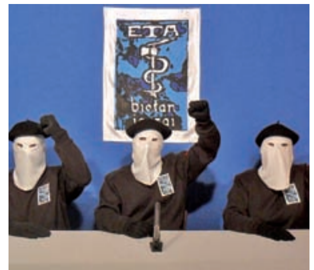
La banda pide que la ciudadanía sea protagonista

Los etarras han criticado, en una nota publicada en el diario 'Gara', que el Gobierno, que representa "las grietas del régimen del 78", ha mostrado "su verdadero rostro" al responder al referéndum con sus "auténticos fundamentos: imposición, dependencia y opresión". Así, les han acusado de usar la "fuerza armada" para impedir la voluntad popular.