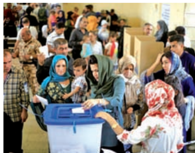
Votación en el Kurdistán iraquí

También en Turquía y Siria se oponen radicalmente a la independencia puesto que sería un referente para