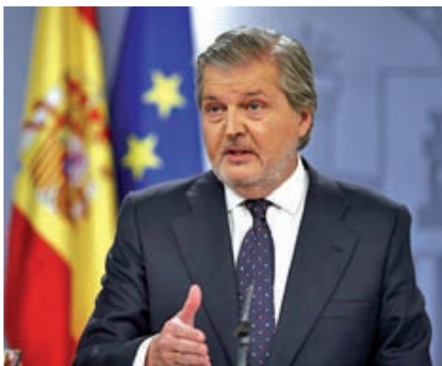
El portavoz del Gobierno