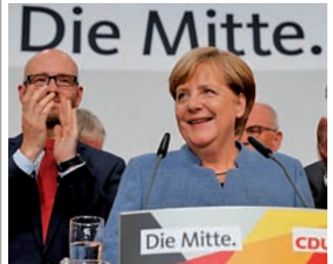
Angela Merkel, canciller alemana

La canciller alemana, Angela Merkel, que admitió el pasado lunes su "responsabilidad personal" por la polarización política, lo tendrá difícil para gobernar ya que el SPD ha adelantado que su formación pasará a la oposición y no reeditará la gran coalición con los conservadores. A Merkel solo le queda configurar una alianza con los liberales del FDP, que regresan al Bundestag después de pasar una legislatura ausentes del Parlamento, y con Los Verdes, en lo que se viene a llamar la 'coalición Jamaica' en clara alusión a los colores de las tres formaciones.