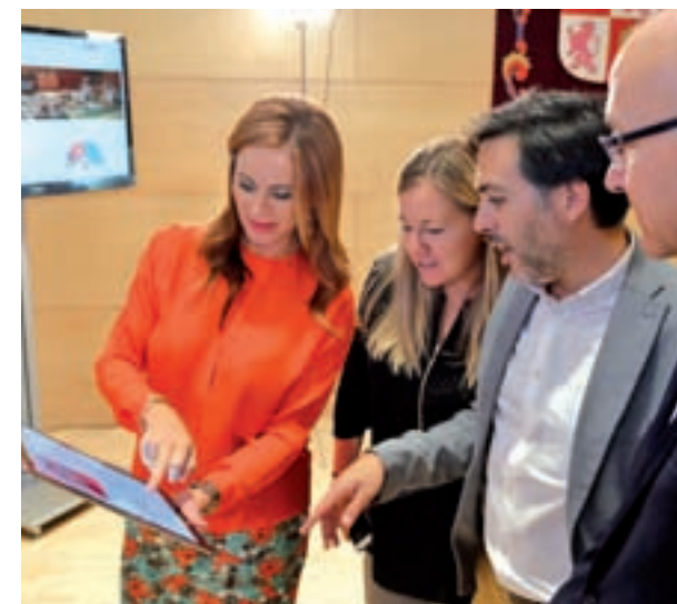
El Parlamento estrena web

Todas las sesiones de las Comisiones pueden seguirse a través de la web del Parlamento autonómico.