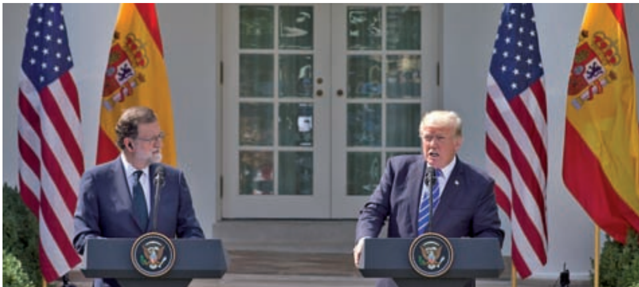
Mariano Rajoy y Donald Trump, durante su encuentro