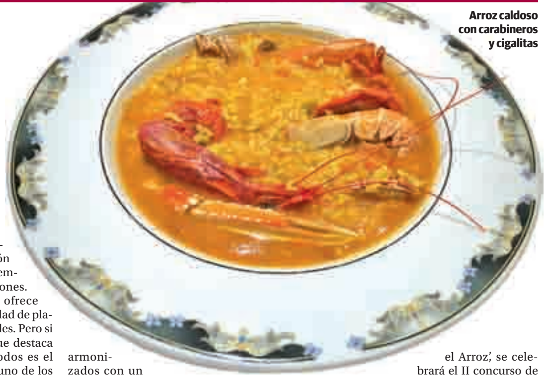
Arroz caldoso con carabineros y cigalitas

En esta III edición participan un total de 22 establecimientos de gran tradición y relevancia en la elaboración de arroces, con menús que constan de un entrante y un plato principal (paella o arroz)