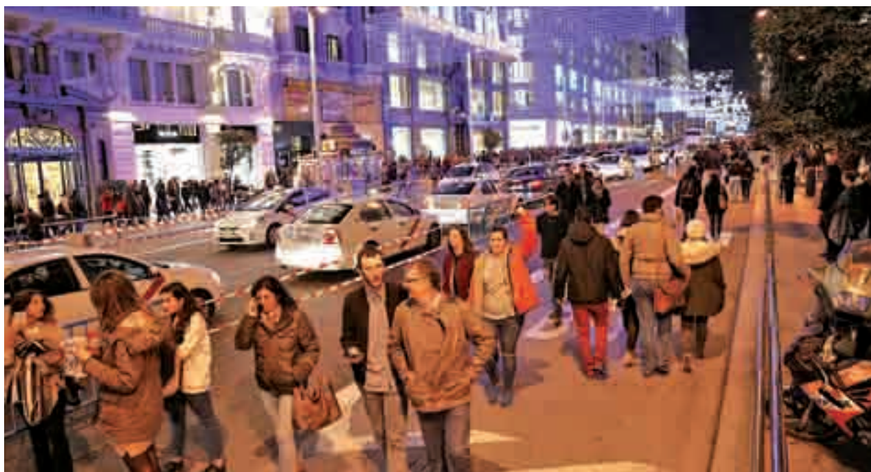
La calle ya sufrió cortes de tráfico la pasada Navidad

Con la ejecución de esta medida, EMT y el Ayuntamiento de Madrid "refuerzan su compromiso con el transporte público y con la promoción de la imprescindible movilidad ciclista".