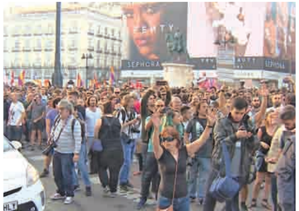
Concentración en defensa de la unidad de España en Cibeles (izquierda) y acto de apoyo al referéndum de Cataluña (derecha)