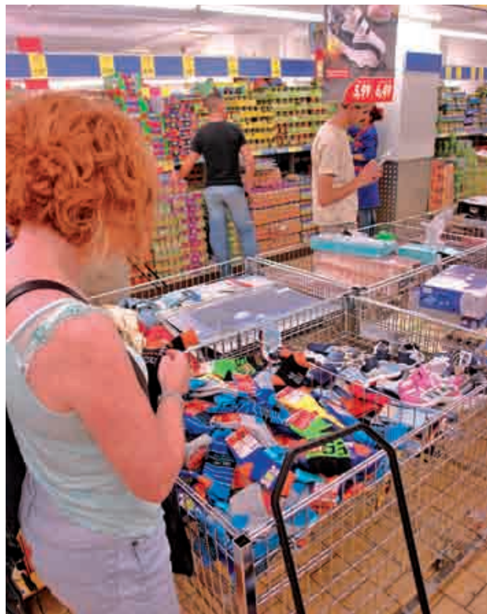
Hay grandes diferencias entre los supermercados españoles GENTE

En cuanto a las grandes cadenas que tienen presencia en todo el territorio nacional, la OCU concluye que la más barata es Alcampo, seguida muy de cerca por Mercadona, aunque esta última tiene una