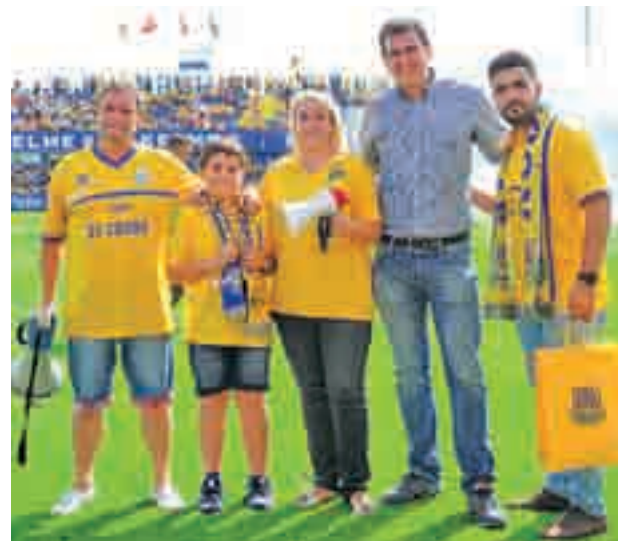
Un concurso del ADA PRENSA

El resultado no empañó las acciones sociales que se llevan a cabo desde la Agrupación Deportiva con el objetivo de recompensar a los aficionados por el apoyo dado al