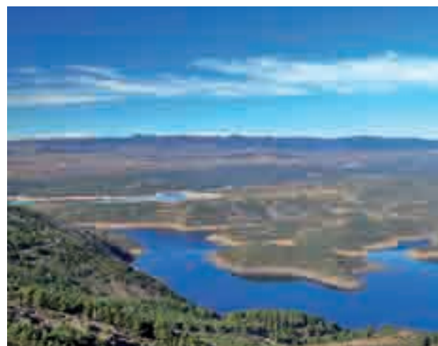
Embalse de El Atazar

de 576,1 hectómetros cúbicos, lo que representa el 61% de su capacidad máxima, según los datos de Canal de Isabel II. Este dato es 11 puntos inferior al de hace un año, cuando las reservas de agua embalsada eran de 684,4 hectómetros cúbicos. Los años hidrológicos empiezan el 1 de octubre.