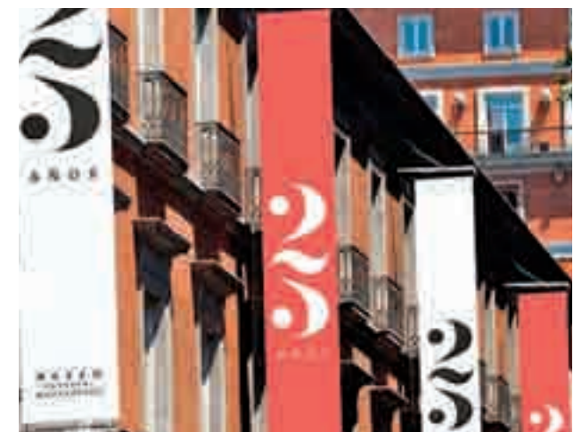
25 años del Museo Thyssen

Durante todo este mes de octubre, algunas de las obras maestras de la colección del museo iluminarán la ciudad de Madrid, mostrándose en pantallas de alta definición instaladas en las fachadas del exterior del museo. Asimismo, también se proyectarán doce vídeos en 3D realizados para este mismo proyecto y que ofrecerán al espectador un viaje por el interior del cuadro.