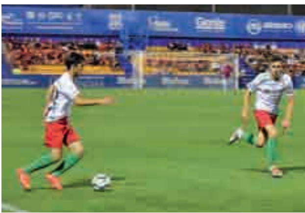
El Trival, en uno de sus encuentros