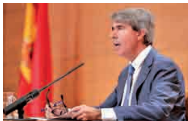
Garrido, durante su valoración del dato de paro

Garrido hizo hincapié en la tasa interanual, que refleja que hay 34.074 parados menos que hace un año, lo que,