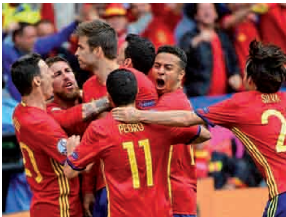
Piqué celebrando un gol en la pasada Eurocopa ante República Checa

al mundo del fútbol, primero con un extraño Barça-Las Palmas a puerta cerrada, después a través de la suspensión del Nàstic-Barcelona B, y, por último y no por ello menos relevante, con las declaraciones de Gerard Piqué. El central barcelonés volvió a demostrar que, para lo bueno y también lo malo, es un futbolista diferente. Su comparecencia ante los medios de comunicación, a petición propia, para 'mojarse' públicamente sobre los acontecimientos del 1 de octubre ha