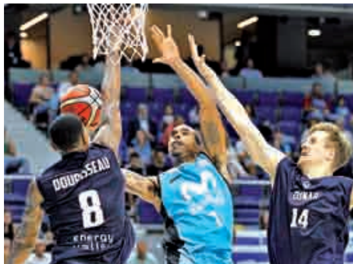
El Estudiantes eliminó al Gorningen

En la lista de prioridades de cualquier equipo español de baloncesto, la Liga Endesa siempre tiene un sitio de privilegio. Sin embargo, como a nadie le amarga un dulce, raro es el club que deja pasar la posibilidad de pasear su nombre por Europa. Porque si la ACB es el día a día, el premio a una regularidad, las competiciones continentales son otra cosa, diferente pero no menos importante: competir con otros grandes equipos e ilusionarse con