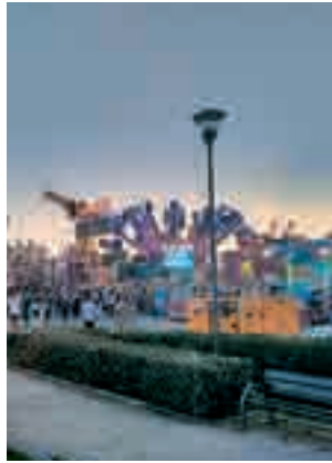
La feria este 2017 K.E./GENTE

El partido naranja hizo alusión a varias notificaciones emitidas el día 6 de septiembre por el Ayuntamiento donde "se denegaba el permiso de funcionamiento a cuatro instalaciones: un tobogán y un 'wype out' hinchables, un tiotivo y una piscina de bolas y barcas". Por su parte, fuen-