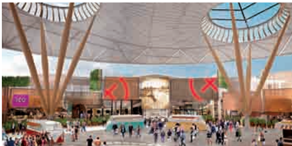
Imagen de cómo quedará el centro: Buena parte del centenar de locales que se ubicarán en el nuevo espacio estarán destinados a ofrecer artículos especializados de deportes como la escalada, el surf, el motor o BMX, además de cultura alternativa, tecnología, pop-up's y tendencias.

El que en su día fue conocido como el centro comercial y de ocio Opción, y que hoy no es más que una estructura llena de 'polvo y paja' languideciendo detrás de unas vallas, volverá a la vida diez años después de su cierre definitivo en 2009. El proyecto X-Madrid, que ha sido presentado esta misma semana y que contará con una inversión de 30 millones de euros para su