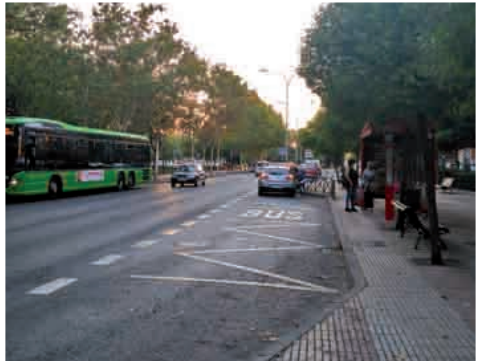
Parada de una de las líneas que se verán afectadas

Al cierre de esta edición, los trabajadores de Avanza Interurbano no lograban alcanzar un acuerdo con la empresa, manteniendo los paros que empezarían a partir del 10 de octubre