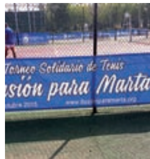
Pistas del Fermín Cacho

El Fuenlabrada A94 se medirá este sábado 7 de octubre al Oroquieta Espinillo en la tercera jornada de la Tercera División. Será en el polideportivo El Trigal a partir de las 17 horas.