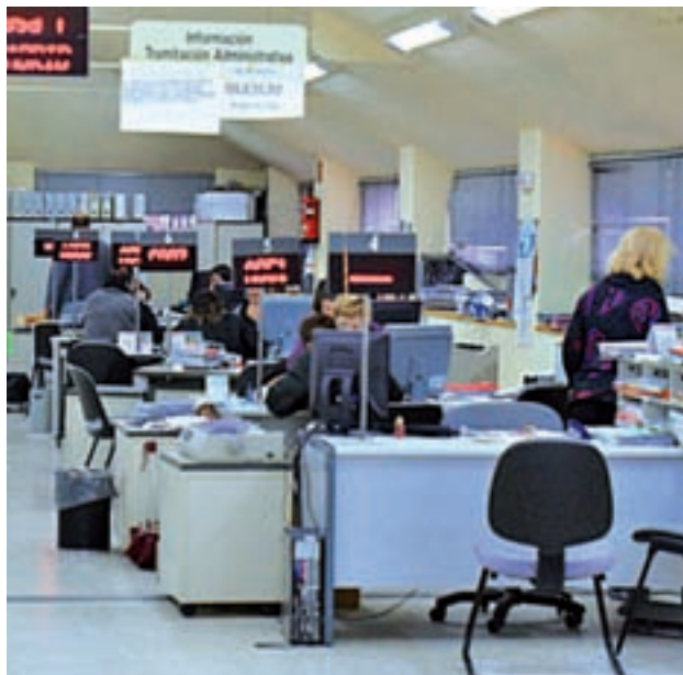
Oficina de Empleo GENTE

En el caso de Fuenlabrada, concretamente, añadió 322 desempleados más en el noveno mes del año. Se trata de un aumento del 2,23% en las listas. Estos datos colocan al municipio como el segundo del Sur en el que más crece el