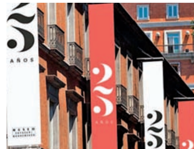
25 años del Museo Thyssen

Durante todo este mes de octubre, algunas de las obras maestras de la colección del museo iluminarán la ciudad de Madrid, mostrándose en pantallas de alta definición instaladas en las fachadas del exterior del museo. Asimismo, también se proyectarán doce vídeos en 3D realizados para este mismo proyecto y que ofrecerán al espectador un viaje por el interior del cuadro.