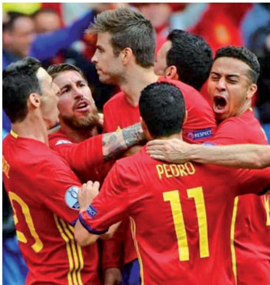
Piqué celebrando un gol en la pasada Eurocopa ante República Checa

Partidos con la ‘Roja’ A sus 30 años, Piqué está cerca de ser centenario. Ha marcado 5 goles.