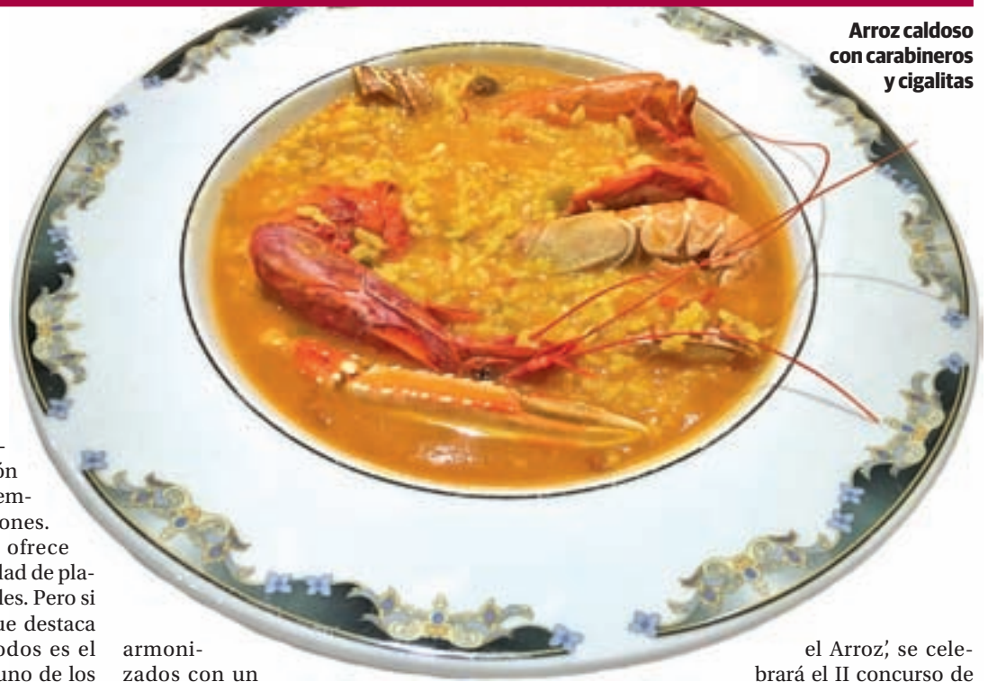
Arroz caldoso con carabineros y cigalitas

En esta III edición participan un total de 22 establecimientos de gran tradición y relevancia en la elaboración de arroces, con menús que constan de un entrante y un plato principal (paella o arroz)