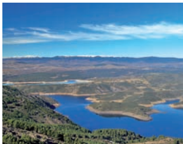
Embalse de El Atazar

de 576,1 hectómetros cúbicos, lo que representa el 61% de su capacidad máxima, según los datos de Canal de Isabel II. Este dato es 11 puntos inferior al de hace un año, cuando las reservas de agua embalsada eran de 684,4 hectómetros cúbicos. Los años hidrológicos empiezan el 1 de octubre.