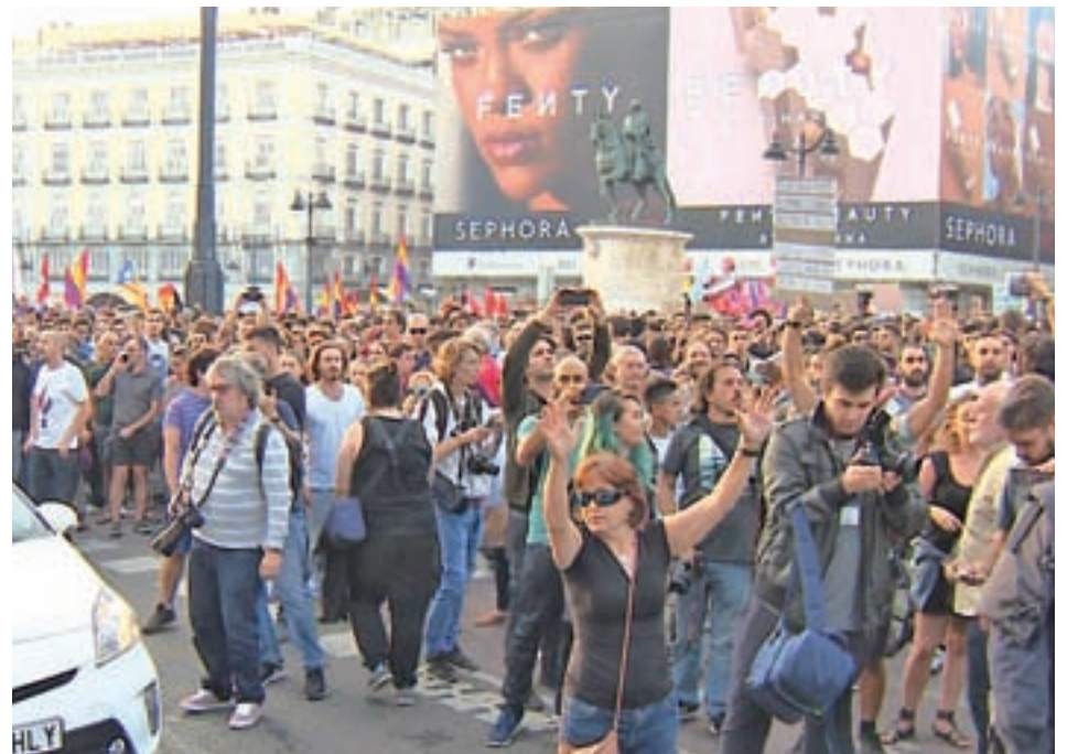
Concentración en defensa de la unidad de España en Cibeles (izquierda) y acto de apoyo al referéndum de Cataluña (derecha)