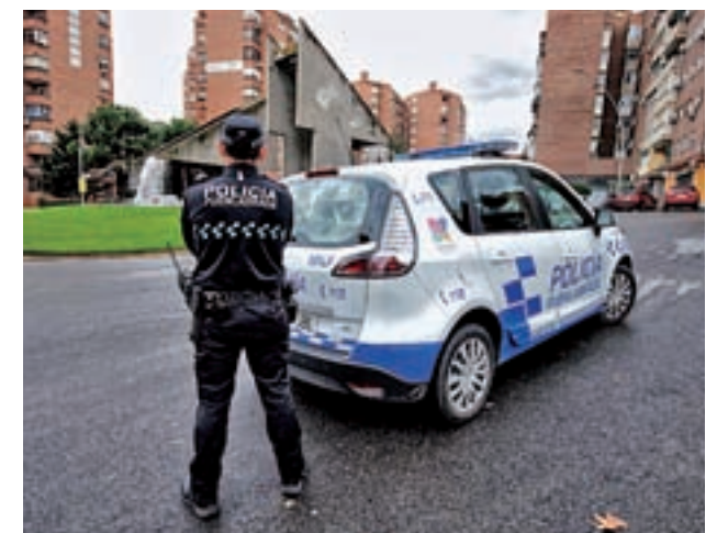
Policía Local de Fuenlabrada GENTE

Los Premios de Seguridad Vial para las Policías Locales son organizados por la FESVIA, una de las entidades de mayor prestigio nacional e internacional en la materia.