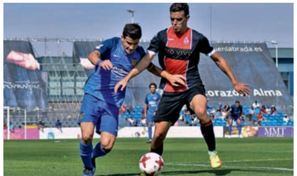
El CF Fuenlabrada, la pasada jornada

La Policía Nacional organiza este domingo 8 de octubre la IV Carrera Solidaria en honor a su patrón. La prueba arrancará desde el Centro Cívico La Serna a partir de las 10:30 horas.