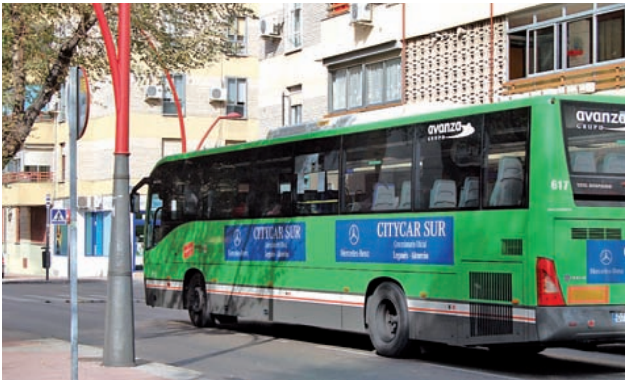
Uno de las líneas