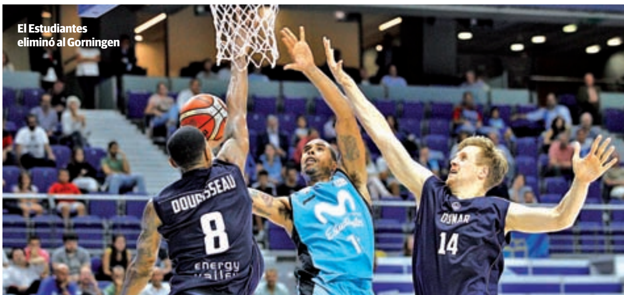
El Estudiantes eliminó al Gorningen