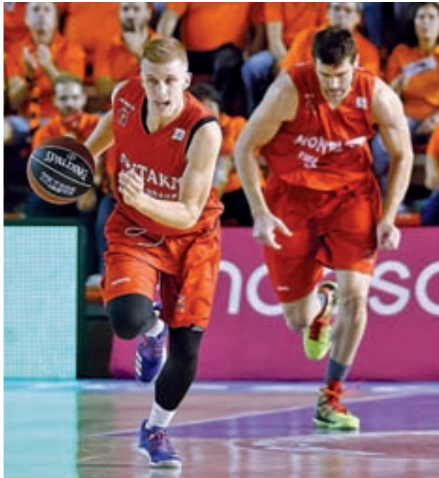
El Montakit Fuenlabrada, en un partido BALONCESTO FUENLABRADA