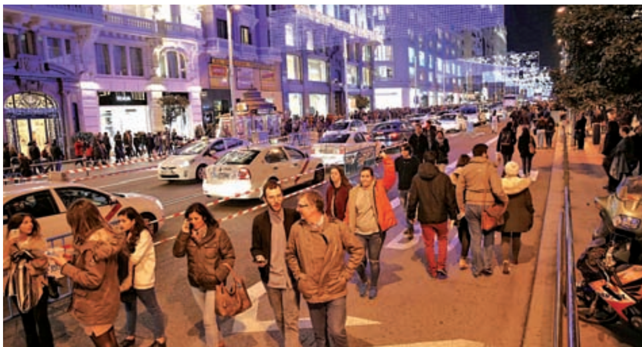
La calle ya sufrió cortes de tráfico la pasada Navidad

Con la ejecución de esta medida, EMT y el Ayuntamiento de Madrid "refuerzan su compromiso con el transporte público y con la promoción de la imprescindible movilidad ciclista".