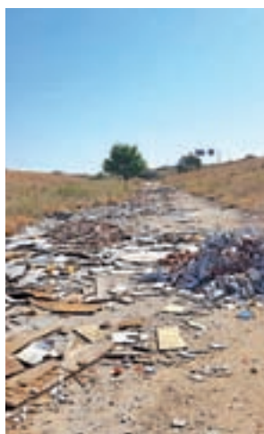
Basuras en caminos rurales