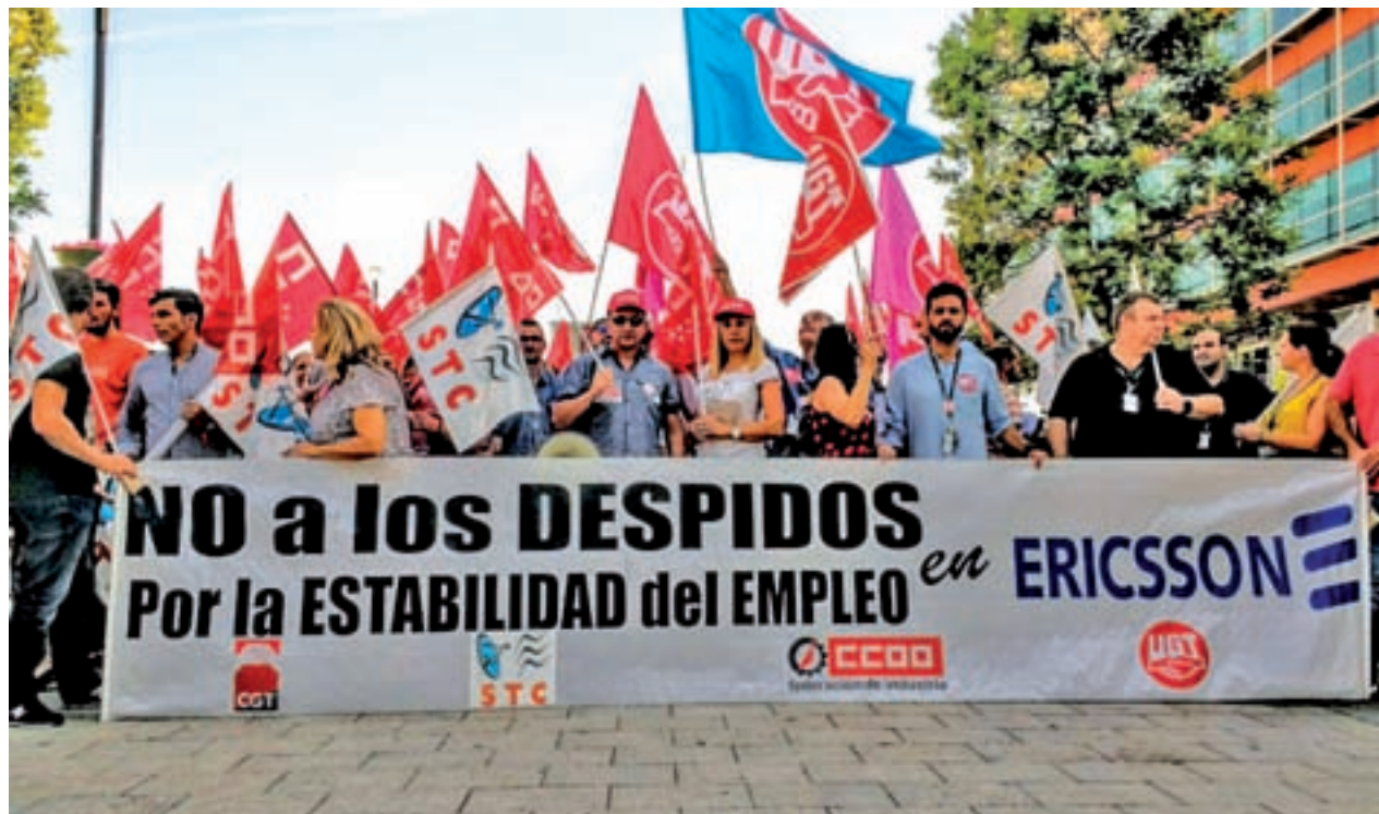
Trabajadores durante la manifestación de la pasada semana

Desde CCOO explicaron que “Fuenlabrada es una localidad muy castigada por el desempleo, cada vez son más las empresas que abandonan la localidad. Además, el perjuicio que supone este traslado para la plantilla será enorme tanto a nivel económico como personal, por lo que solicitamos a la dirección de la empresa se replantee esta situación y mantenga los puestos de trabajo”.