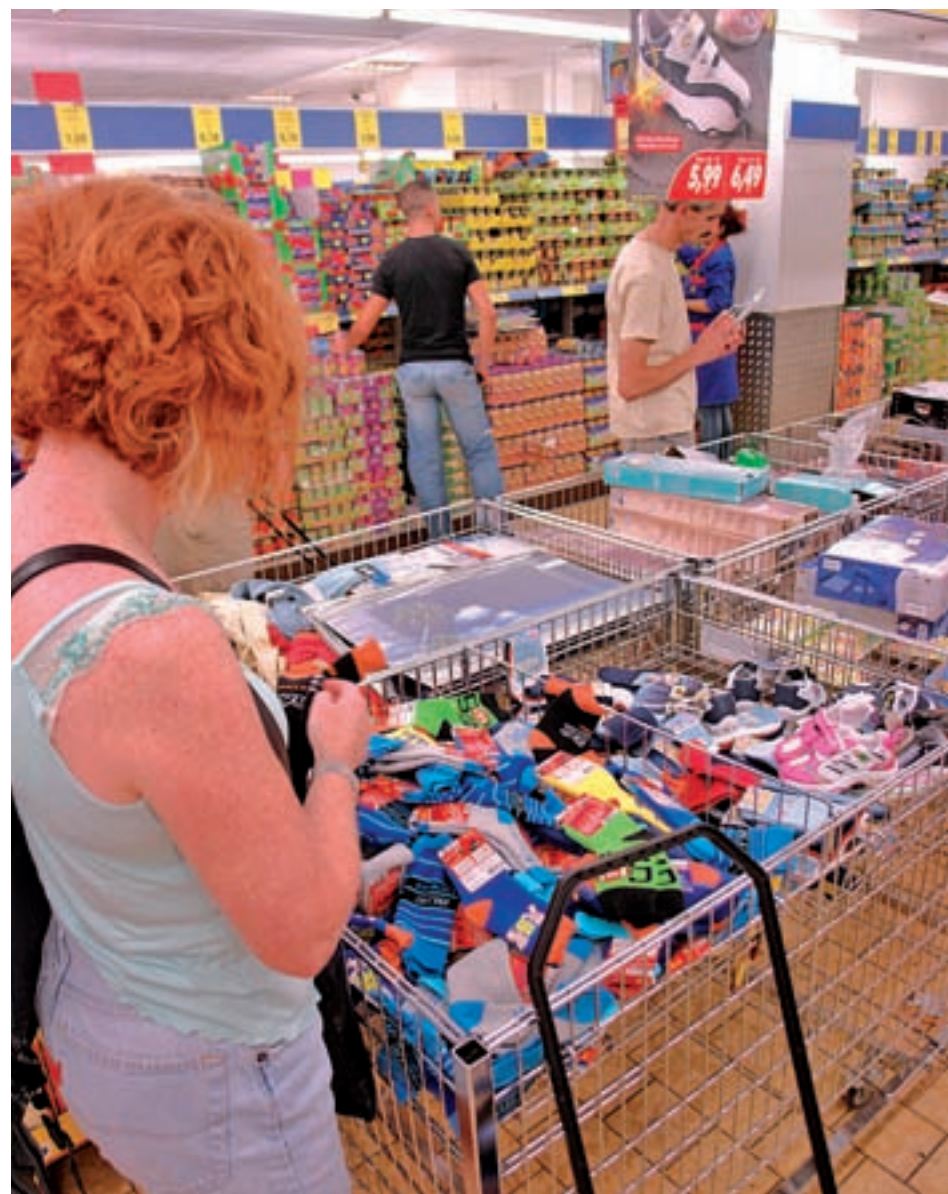
Hay grandes diferencias entre los supermercados españoles GENTE

En cuanto a las grandes cadenas que tienen presencia en todo el territorio nacional, la OCU concluye que la más barata es Alcampo, seguida muy de cerca por Mercadona, aunque esta última tiene una