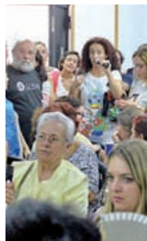
Un momento de la reunión

Por otro lado este viernes 6 de octubre los progenitores recogerán a sus hijos con un chaleco reflectante para denunciar las obras. Y si la Consejería no se reúne con ellos, se concentrarán el 18 de octubre en la puerta de la Consejería (calle de Alcalá 32).