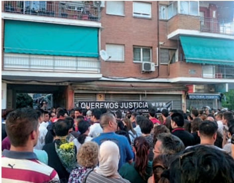
La concentración vecinal del pasado 5 de septiembre

“Creemos que, o se actúa en todas las condiciones del barrio, o no habrá seguridad. Por ello, manifestando nuestra solidaridad con la familia y nuestro rechazo de esa muerte, exigimos los cambios