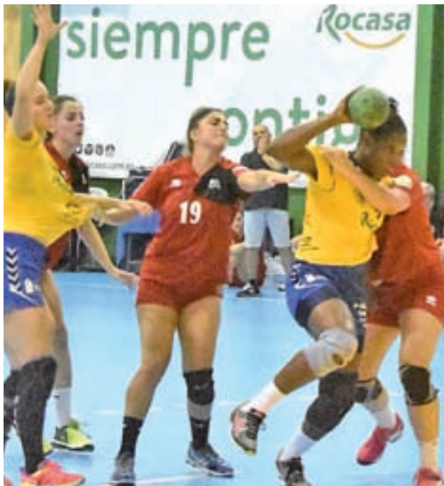
El Base jugará este sábado (18 horas) en el Félix Rubio