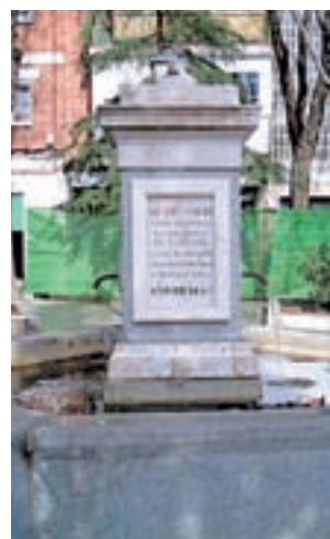
La plaza de Ágata

para una plaza situada en su barrio. Una vez se conozcan las preferencias vecinales se rehabilitarán las de Remonta (Tetuán), Vaguada (Fuencarral-El Pardo), Cívica del Lucero (Latina), Emperatriz (Carabanchel), Puerto de Can-