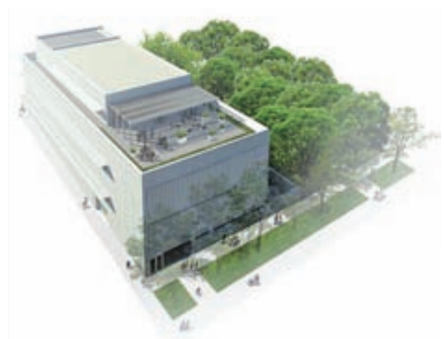
Una recreación de la futura dotación cultural

En la segunda planta se ubicará una sala de lectura y una gran terraza de 230 metros cuadrados, con áreas estanciales y cubierta verde.