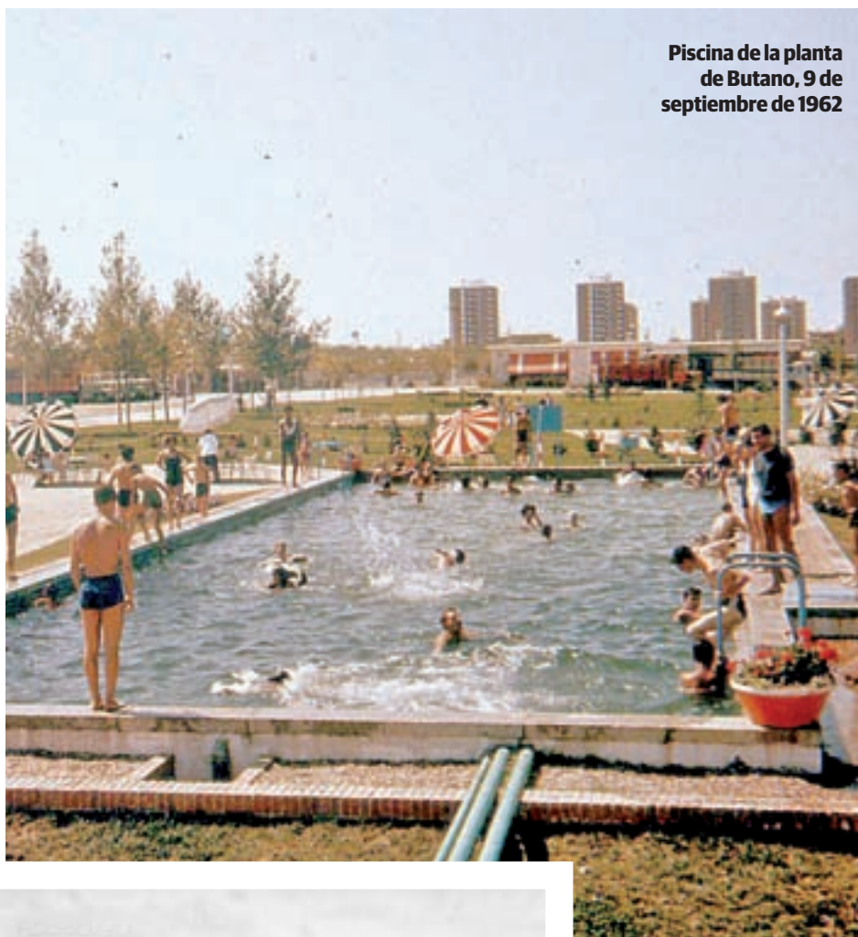
Piscina de la planta de Butano, 9 de septiembre de 1962

“Resulta interesante también cómo en la Guerra Civil según se consolidaban las trincheras en el frente se les ponía nombre a las calles”, añade