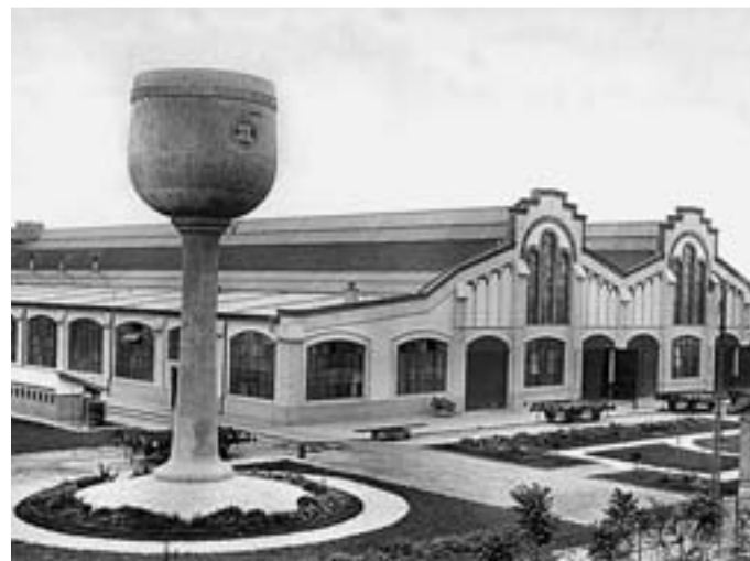
En imágenes: El depósito de agua y los talleres de ferrocarril en Villaverde Bajo en 1926. La primera edición del libro tiene una tirada de 1.000 ejemplares que se podrán adquirir en la librería situada en la calle de Gilena y en otros puntos como la asociación La Incolora.