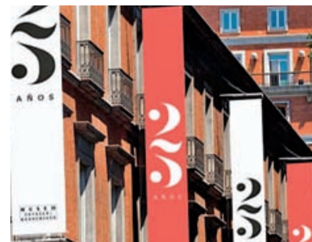
25 años del Museo Thyssen

Durante todo este mes de octubre, algunas de las obras maestras de la colección del museo iluminarán la ciudad de Madrid, mostrándose en pantallas de alta definición instaladas en las fachadas del exterior del museo. Asimismo, también se proyectarán doce vídeos en 3D realizados para este mismo proyecto y que ofrecerán al espectador un viaje por el interior del cuadro.