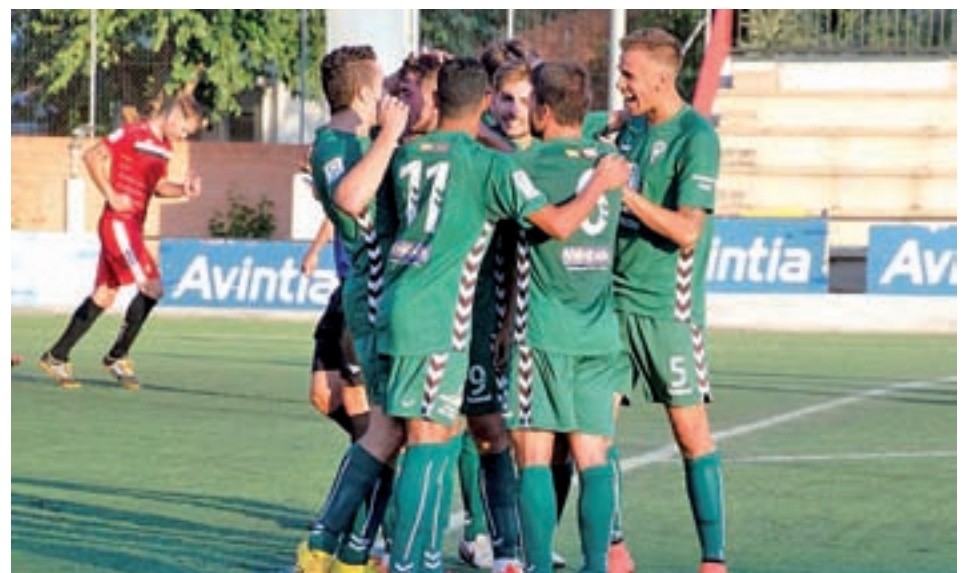
El Villaverde sigue en la zona baja de la clasificación