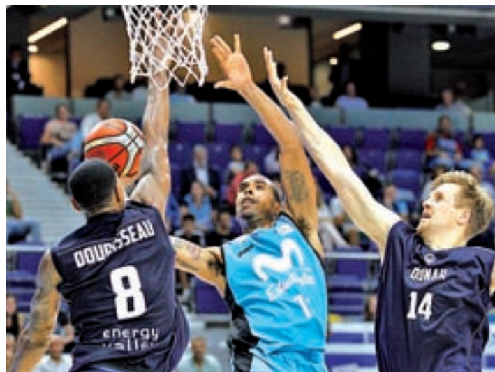
El Estudiantes eliminó al Gorninggen

En la lista de prioridades de cualquier equipo español de baloncesto, la Liga Endesa siempre tiene un sitio de privilegio. Sin embargo, como a nadie le amarga un dulce, raro es el club que deja pasar la posibilidad de pasear su nombre por Europa. Porque si la ACB es el día a día, el premio a una regularidad, las competiciones continentales son otra cosa, diferente pero no menos importante: competir con otros grandes equipos e ilusionarse con