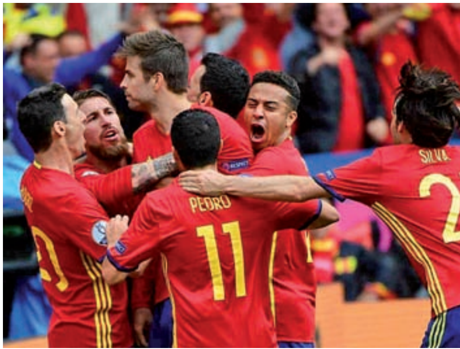
Piqué celebrando un gol en la pasada Eurocopa ante República Checa

al mundo del fútbol, primero con un extraño Barça-Las Palmas a puerta cerrada, después a través de la suspensión del Nàstic-Barcelona B, y, por último y no por ello menos relevante, con las declaraciones de Gerard Piqué. El central barcelonés volvió a demostrar que, para lo bueno y también lo malo, es un futbolista diferente. Su comparación ante los medios de comunicación, a petición propia, para ‘mojarse’ públicamente sobre los acontecimientos del 1 de octubre ha