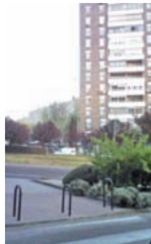
La plaza del Encuentro

para una plaza situada en su barrio. Una vez se conozcan las preferencias vecinales se rehabilitarán las de Remonta (Tetuán), Vaguada (Fuencarral-El Pardo), Cívica del Lucero (Latina), Emperatriz (Carabanchel), Puerto de Can-