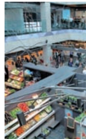
El mercado de San Antón

Además, en los equipamientos se han colocado planos en braille, pavimento con función de encaminamiento y tiras antideslizantes en bordes de peldaños, entre otras mejoras. También se han incluido pictogramas identificativos de locales y directorios informativos accesibles y se han diseñado unos espacios accesibles para personas con discapacidad visual, física, autismo, entre otras.