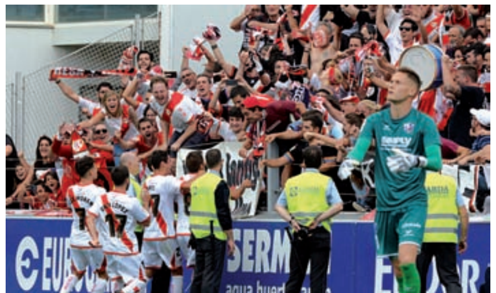
El gol de Trejo en El Alcoraz no sirvió para que el Rayo se llevase algún punto

Tras ese tropiezo, al cuadro morataleño le toca pasar página y centrarse en la visita de este domingo (11:30 horas) al Lugo Fuenlabrada.