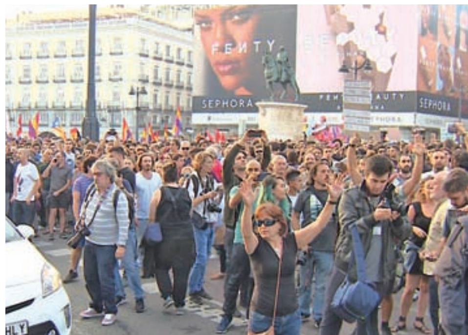
Concentración en defensa de la unidad de España en Cibeles (izquierda) y acto de apoyo al referéndum de Cataluña (derecha)