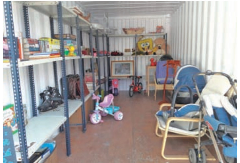
El contenedor que guarda los objetos de esta iniciativa municipal

Gracias a un proyecto que se desarrollará durante los próximos tres meses en el punto limpio municipal • Los enseres se pueden reservar por Internet y recoger en un plazo de tres días