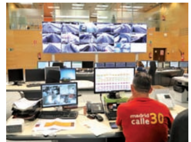
Centro de control de Calle 30

Además, estimó que el proyecto rondará finalmente 9.400 millones de euros, al sumar al presupuesto inicial de 1.700 millones de euros, que luego terminó costando 3.600, el coste de mantenimiento, financiero y de dividendos