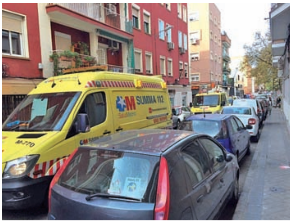
Efectivos del Summa se desplazaron a lugar pudiendo solo certificar el fallecimiento

Por actividad económica y en la comparación mensual, el número de personas desempleadas disminuyó un 0,4% en el sector agrario y un 0,8% en los servicios, producto del estacional descenso en educación, mientras que creció un 0,5% en la industria y un 0,1% en la construcción.