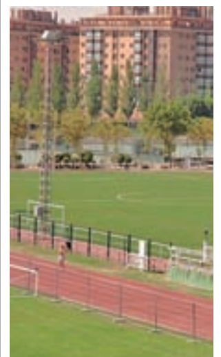
La dotación de Entrevías

Al lugar de los hechos se desplazaron especialistas de la Policía Científica a recoger pruebas.