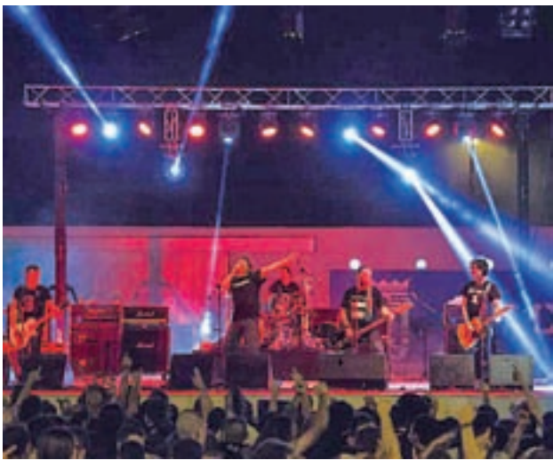
Un momento de la edición del pasado año