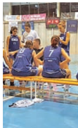
El Distrito jugará como local