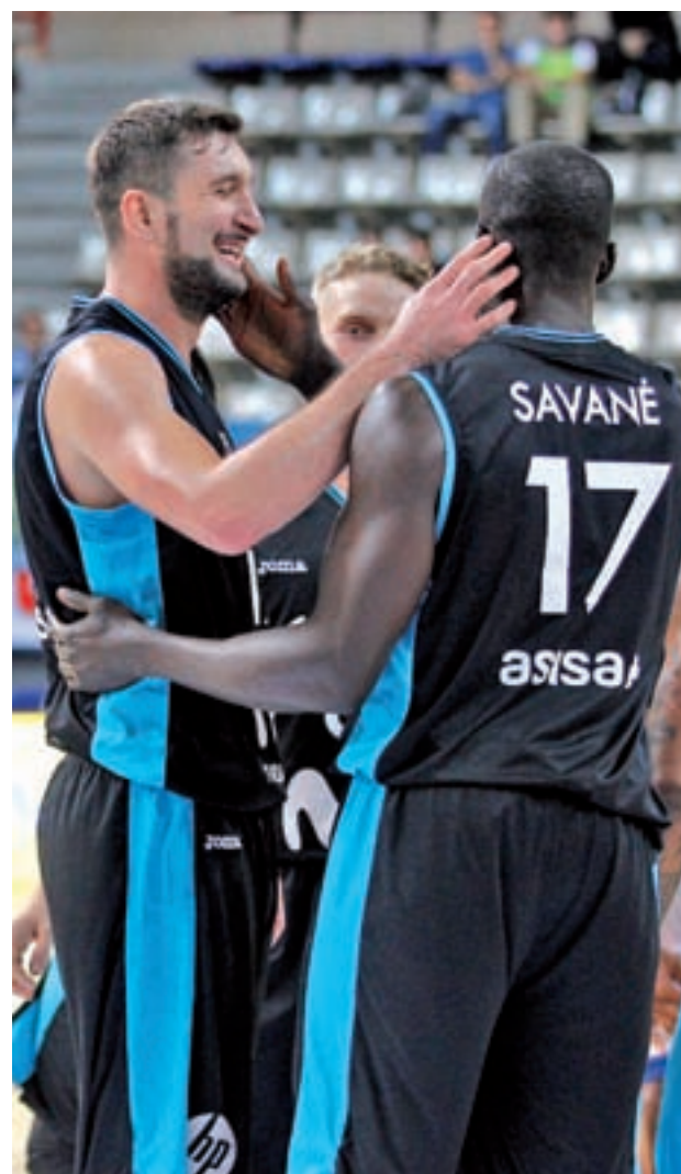
El Estudiantes sumó su segundo triunfo en Champions

Esta última situación se podría dar este domingo 22 de octubre, gracias a una doble sesión en el recinto de la calle Goya que promete hacer las delicias de los amantes del baloncesto. Para empezar, la matinal depara un clásico de la Liga Endesa, el duelo entre el Movistar Estudiantes y el Barcelona Lassa que, a tenor de lo visto en estas primeras cuatro jornadas, da cierto favoritismo al conjunto azulgrana. Porque es cierto que el equipo colegial se quitó un lastre el pasado fin de semana en la cancha del San Pablo Burgos, pero también que este Barça no se parece prácticamente en nada al de la pasada temporada. La llegada de Sito Alonso al banquillo culé es sólo la punta del iceberg en este nuevo pro-