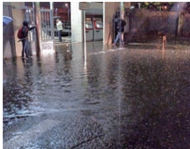
Estado en el que se encontraba el miércoles 18