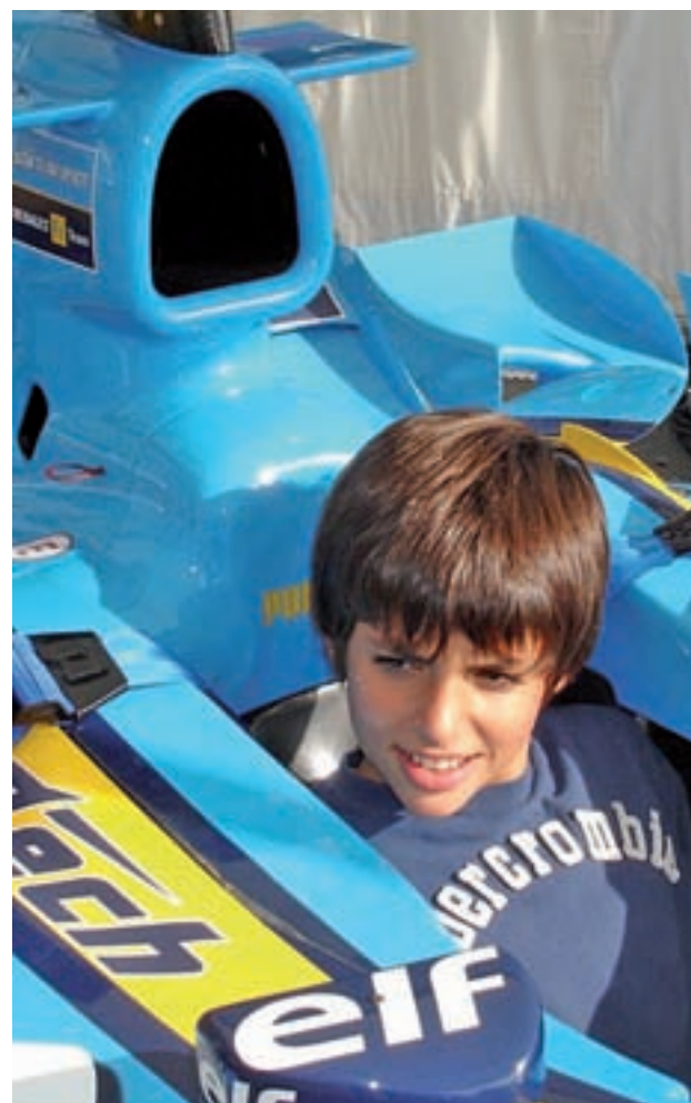
El piloto madrileño en el 2006

El otro nombre propio en el Mundial es el de Joan Mir. El mallorquín puede proclamarse campeón en Moto3, una circunstancia que se antoja bastante factible, toda vez que aventaja en nada menos que 55 puntos a su inmediato perseguidor, Romano Fenati. Sin embargo, Mir recibió un serio aviso en Japón, donde no pudo acabar la carrera en la que habría dejado el título visto para sentencia.