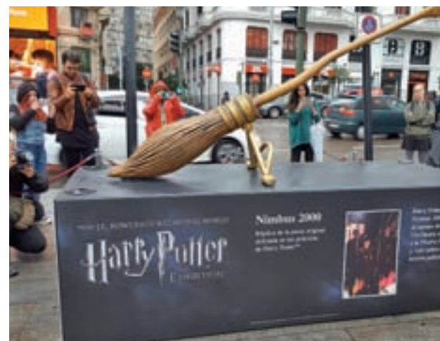
La Nimbus 2000 ha sido colocada en Callao

Madrid se convierte así en la primera ciudad del mundo en realizar este avance de una muestra que, desde su inauguración en Chicago, ha recaído en Boston, Toronto, Seattle, Nueva York, Sydney, Singapur, Tokyo, París, Shanghai, Bruselas y Holanda y ha contabilizado más de cuatro millones de visitantes.