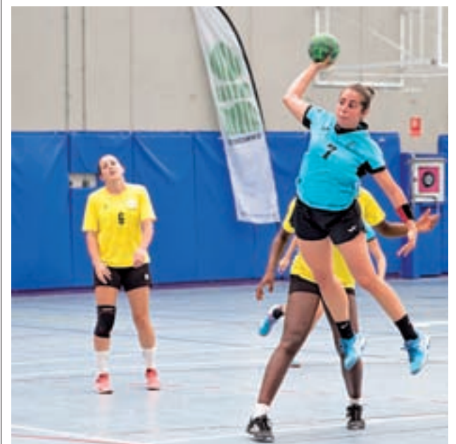
El Getasur, durante un partido

El Getafe B afronta este fin de semana un duro encuentro contra sus vecinos de la AD Alcorcón. El filial azulón visitará el estadio Santo Domingo este 22 de octubre a partir de las 11:30 horas.