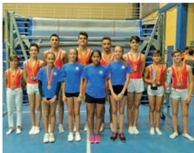
Deportistas del Club Gimnástico Getafe