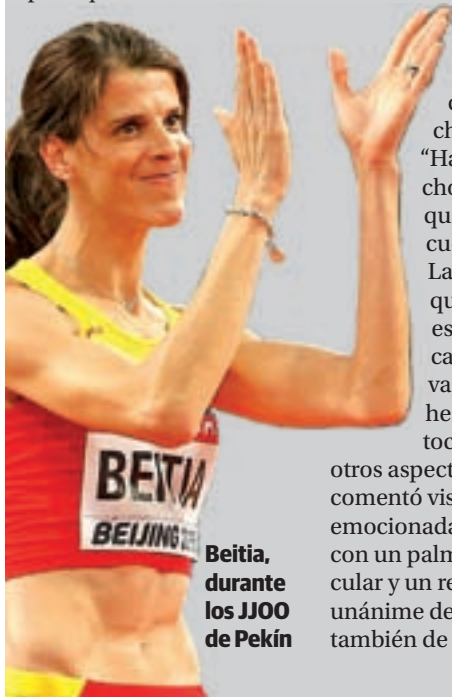
Beitia, durante los JJOO de Pekín

otros aspectos de la vida", comentó visiblemente emocionada una atleta con un palmarés espectacular y un reconocimiento unánime de amigos, pero también de los rivales.