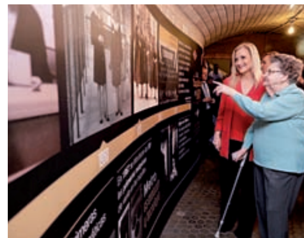
Cifuentes, en el homenaje a los taquilleros

Cifuentes destacó que las taquilleras "fueron unas pioneras, auténticas precursoras de una de las mayores revoluciones sociales del siglo XX, la incorporación de la mujer al mercado laboral" y les otorgó el mérito de "haber roto un techo de cristal" en esa época.