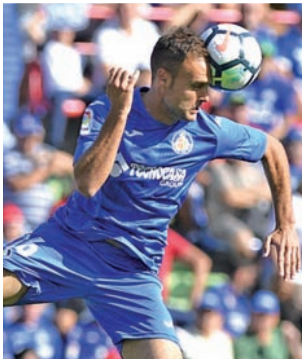
El Getafe, durante el duelo con el Real Madrid

Por su parte, el Levante ocupa la duodécima plaza y