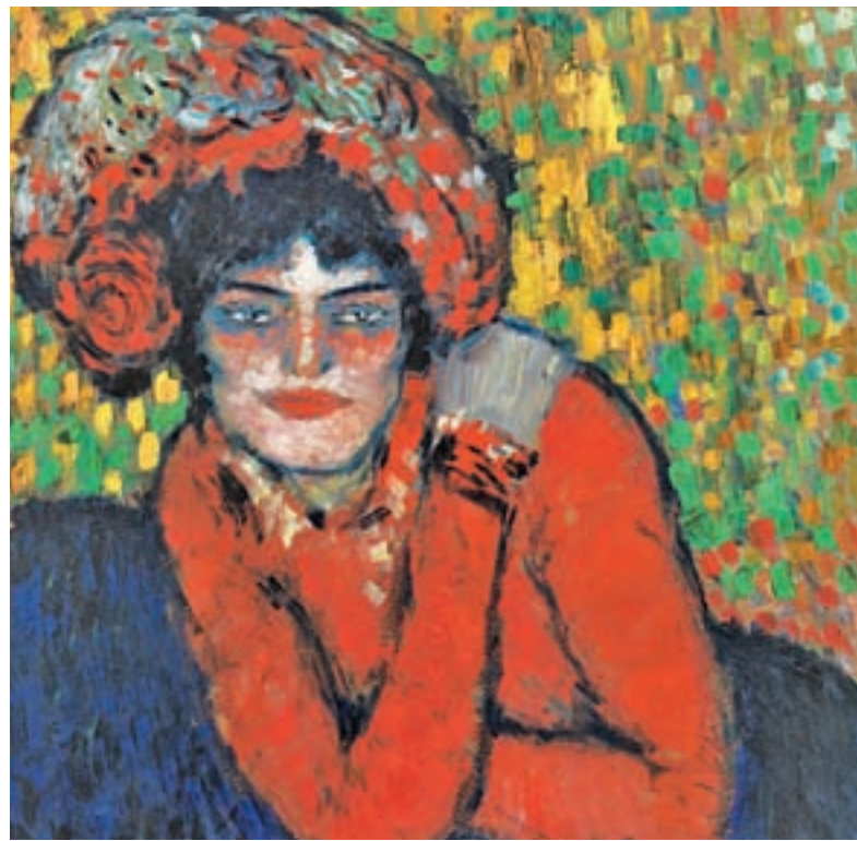
'En un reservado', de Toulouse Lautrec (izquierda), y 'La espera (Margot)', de Picasso (derecha)