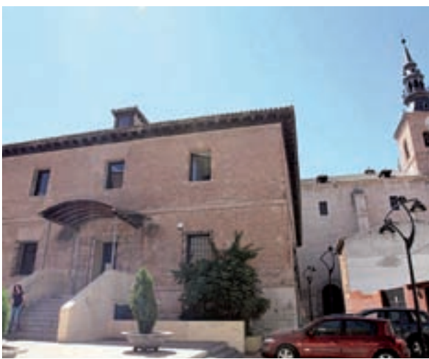
Biblioteca Ricardo de la Vega