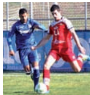
Getafe B, en un encuentro

La AD Alhóndiga se enfrentará este fin de semana al CFF Fuenlabrada, penúltimo clasificado de la Liga. Las getafenses visitarán La Aldehuela este domingo 22 de octubre a partir de las 17:30 horas.