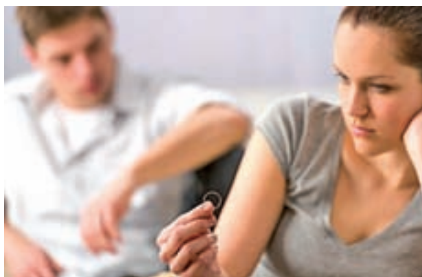
En Madrid hubo menos divorcios

El mayor descenso se produjo en las separaciones no consensuadas (-27,4%), mientras que las de mutuo acuerdo bajaron un 23%. Los divorcios sufrieron un bajón del