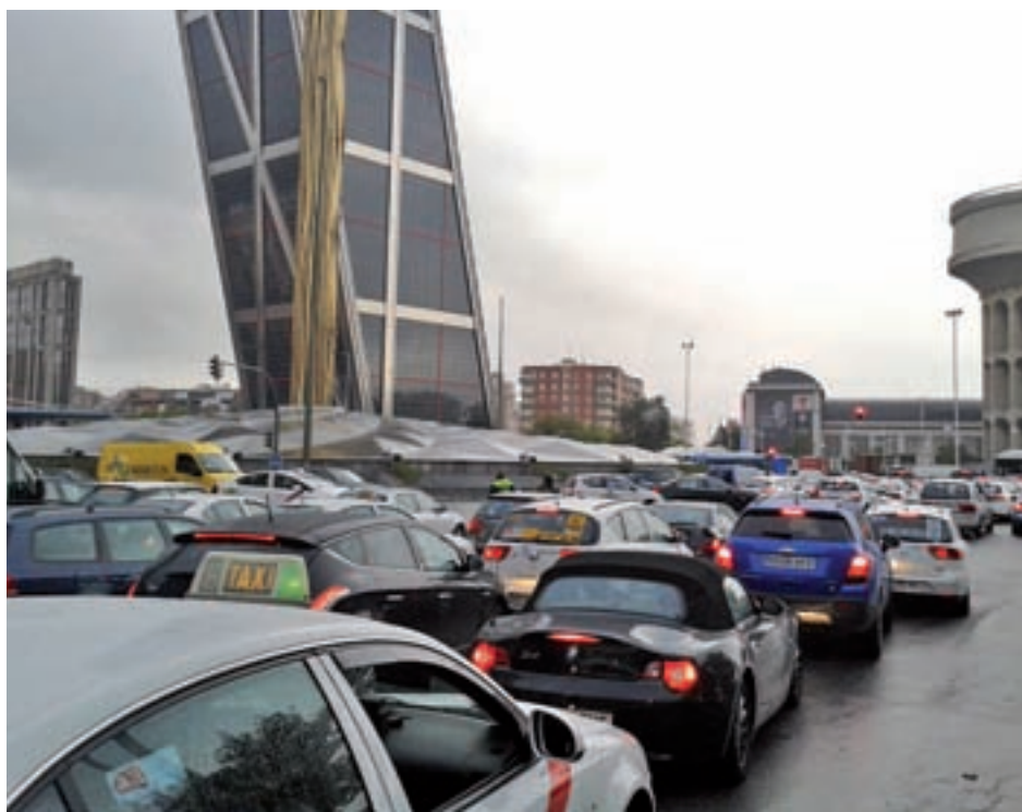
Retenciones en la zona de Plaza de Castilla

Los conductores afectados utilizaron sus perfiles en las