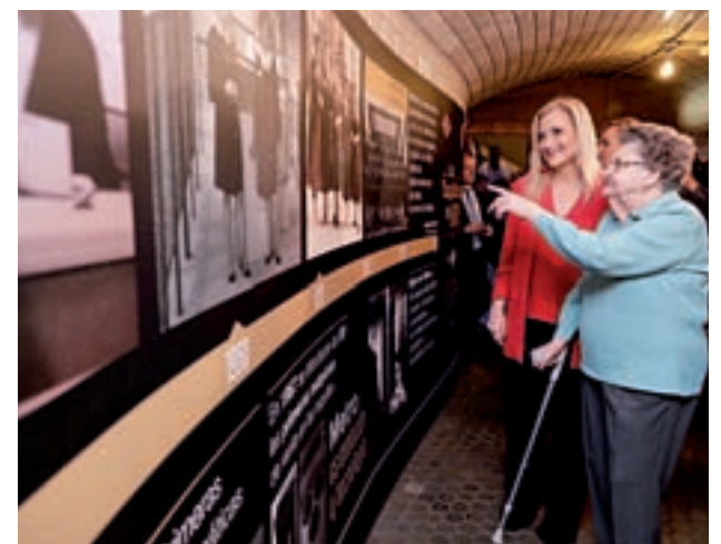
Cifuentes, en el homenaje a los taquilleros

Cifuentes destacó que las taquilleras "fueron unas pioneras, auténticas precursoras de una de las mayores revoluciones sociales del siglo XX, la incorporación de la mujer al mercado laboral" y les otorgó el mérito de "haber roto un techo de cristal" en esa época.