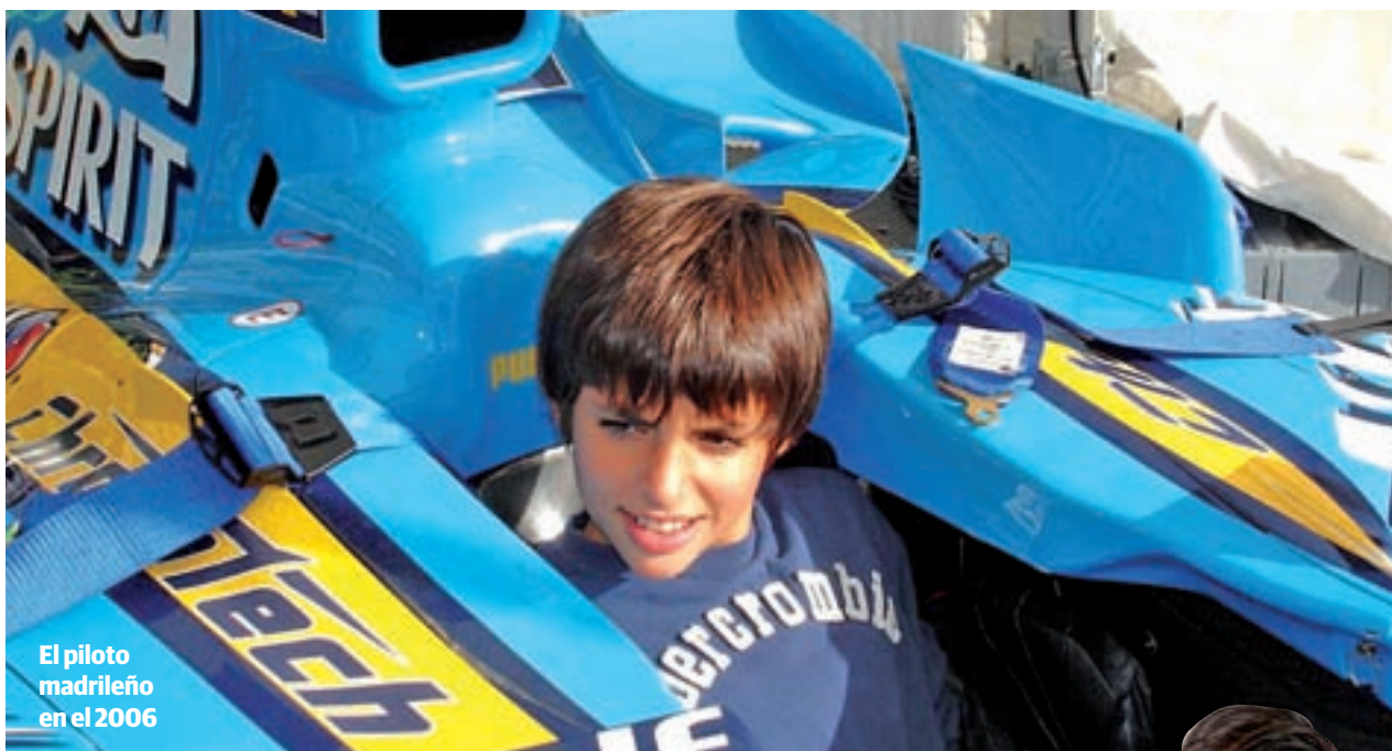
El piloto madrileño en el 2006