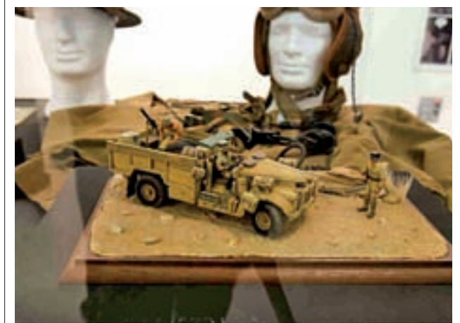
Alguno de los objetos de la muestra

A través de este sistema solo se retirarán aquel mobiliario en cantidad inferior a 3 metros cúbicos y un máximo de 6 elementos. Además, no se recogerán a empresas y sólo se admitirá una solicitud por semana.