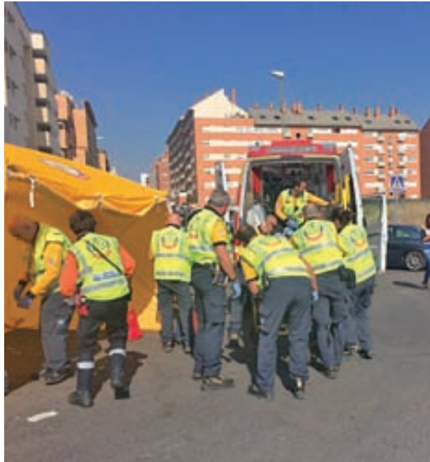
El último atropello tuvo lugar el 21 de septiembre

GENTE han intentado conocer los planes municipales al respecto a través de la Junta Municipal, sin conseguirlo al cierre de edición.