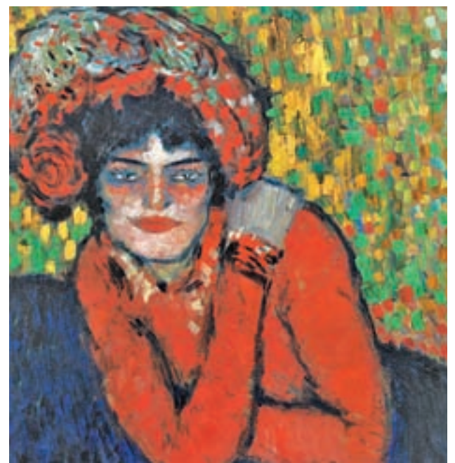
'En un reservado', de Toulouse Lautrec (izquierda), y 'La espera (Margot)', de Picasso (derecha)