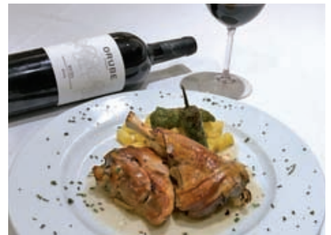
Jarrete con Orube Crianza » Ferreiro (C/ Comandante Zorita, 32)