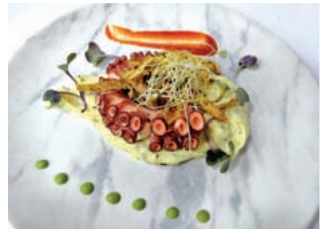
Pulpo braseado con parmentier de alga nori y mojo rojo » Nicomedia (C/ Espronceda, 33. Bajo izquierda)