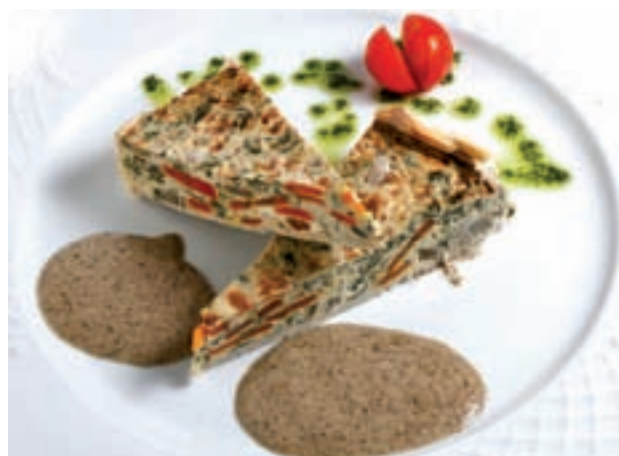
Pastel de verdura con salsa de champiñón » La Pavía (C/ Ríos Rosas, 38)