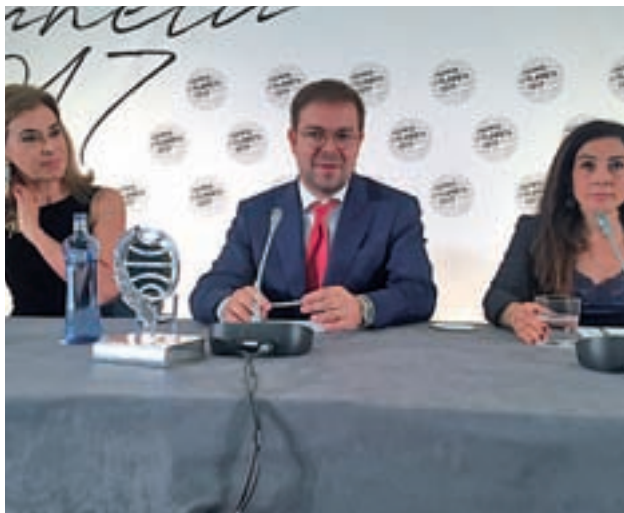
Los ganadores y Posadas en rueda de prensa tras el fallo

El jurado del Premio Planeta está presidido por la escritora Carmen Posadas.