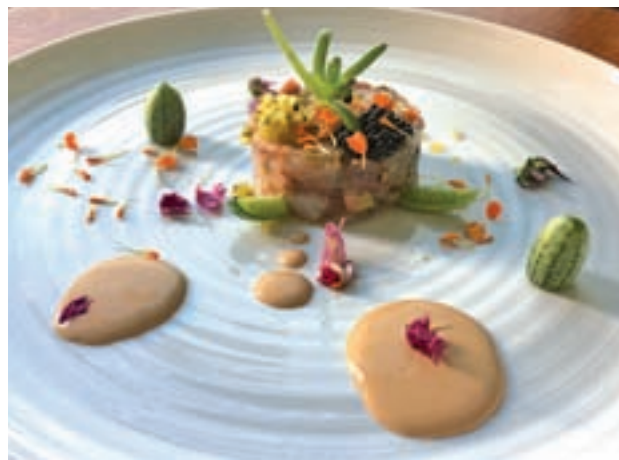
Diálogo entre Sanlúcar y Santoña » Donde Siempre (C/ Minerva, 81)

cance de todos los públicos hasta el próximo 29 de octubre, período durante el que se podrá degustar en cualquiera de los veinte establecimientos participantes un menú degustación por 35 euros, que resumirá la esencia