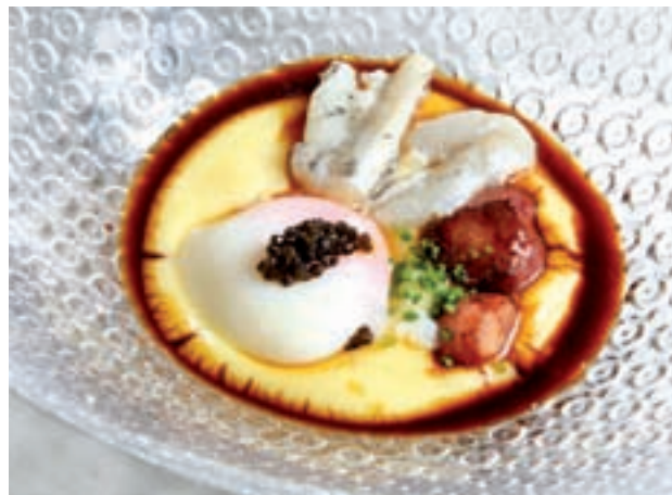
Huevo a baja temperatura con tuétano y kokotxa de bacalao » Casa Gades (C/ Conde de Xiquena, 4)