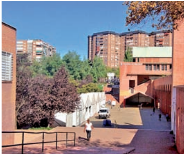
El recinto ferial instalado en el parque de La Vaguada

Al cierre de edición, la Unidad de Familia y Mujer (UFAM) de la Brigada de la Policía Judicial de Madrid investiga para tratar de detener a los presuntos autores de los abusos.