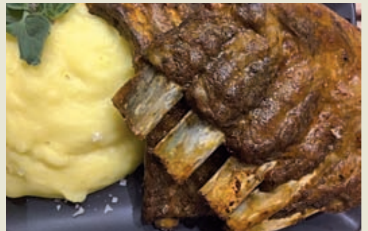
Costillas con pimentón de la Vera GENTE

La carta de costillas está disponible en Padre Damián, 42 y Serrano, 118.