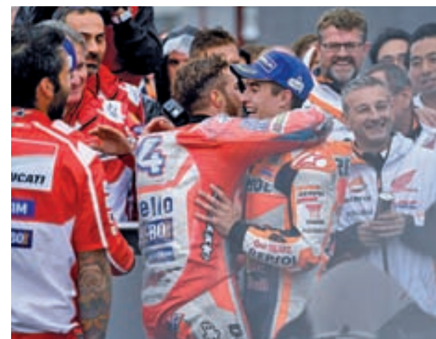
Márquez felicitó a Dovizioso por su triunfo en Japón

to3, una circunstancia que se antoja bastante factible, toda vez que aventaja en nada menos que 55 puntos a su inmediato perseguidor, el italiano Romano Fenati. Sin embargo, Mir ya recibió un serio aviso en Japón, donde no pudo acabar la carrera en la que, presumiblemente, habría dejado el título visto para sentencia.