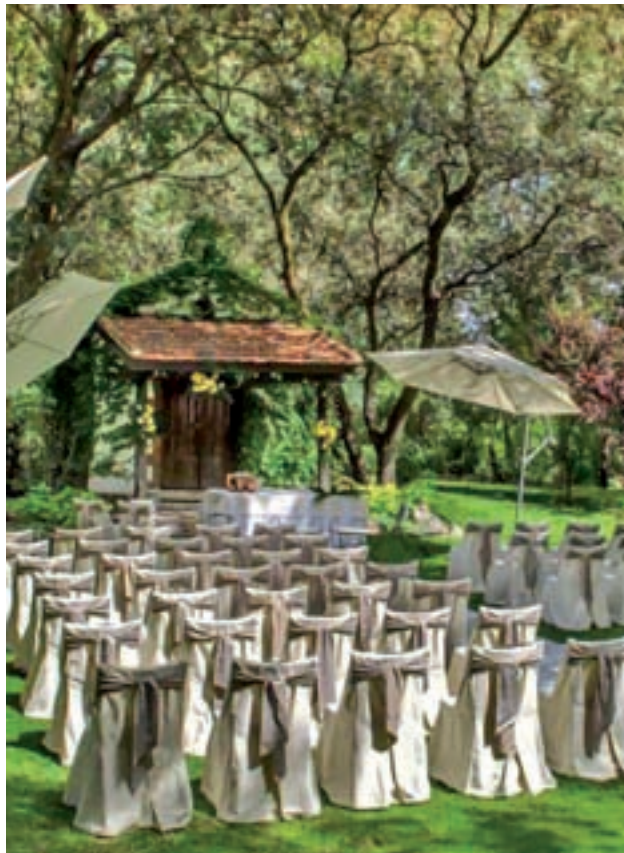
Evento en una finca rural de Madrid

De hecho, la modificación impulsada por los populares llega solo ocho días después de que PSOE y Podemos trataran de aprobar en la Cámara madrileña una petición que pretendía eliminar el ar-