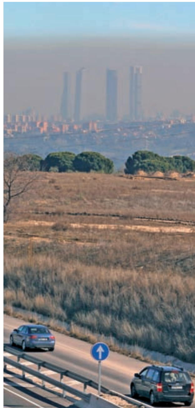
Contaminación en Madrid

A continuación estarían la opción de compartir el vehículo privado limitando al mis-