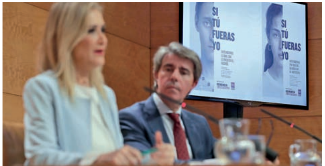
Cristina Cifuentes y Ángel Garrido, durante la presentación de la campaña