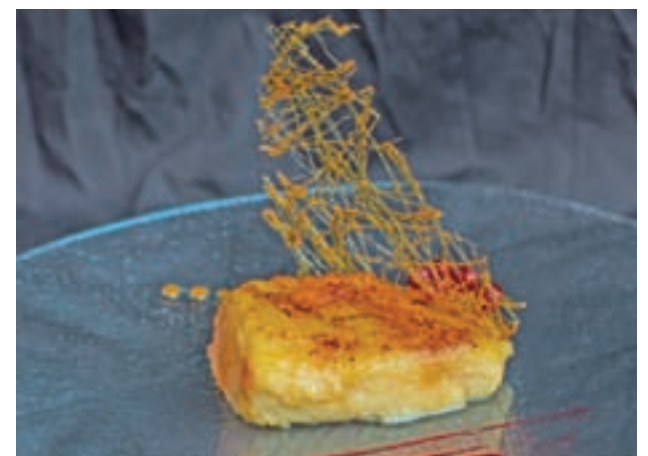
Torrija HH » Haches (C/ Ortega y Gasset, 79)