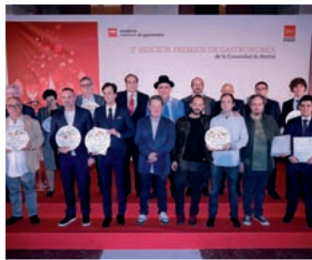
Foto de familia de los premiados

El impacto medioambiental y la "competencia desleal" eran los argumentos que defendieron los ponentes de la proposición rechazada.