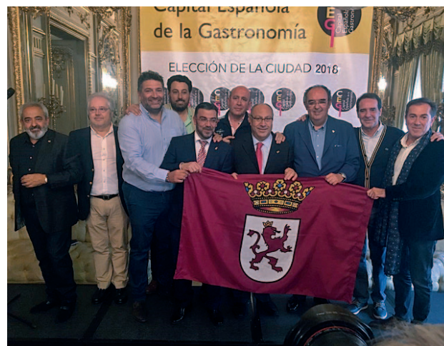
La delegación leonesa, que acudió al fallo GENTE

El estudio también pone de manifiesto que más de 2,9 millones de personas en España, el 6,4% de la población, vive en situación de pobreza severa, es decir, en hogares cuyo total de ingresos por unidad de consumo es inferior a 342€ al mes.