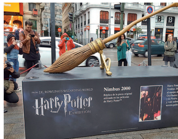
La Nimbus 2000 ha sido colocada en Callao

Madrid se convierte así en la primera ciudad del mundo en realizar este avance de una muestra que, desde su inauguración en Chicago, ha recalcado en Boston, Toronto, Seattle, Nueva York, Sydney, Singapur, Tokyo, París, Shanghai, Bruselas y Holanda y ha contabilizado más de cuatro millones de visitantes.