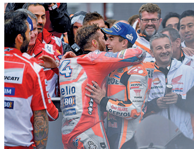
Márquez felicitó a Dovizioso por su triunfo en Japón

to3, una circunstancia que se antoja bastante factible, toda vez que aventaja en nada menos que 55 puntos a su inmediato perseguidor, el italiano Romano Fenati. Sin embargo, Mir ya recibió un serio aviso en Japón, donde no pudo acabar la carrera en la que, presumiblemente, habría dejado el título visto para sentencia.