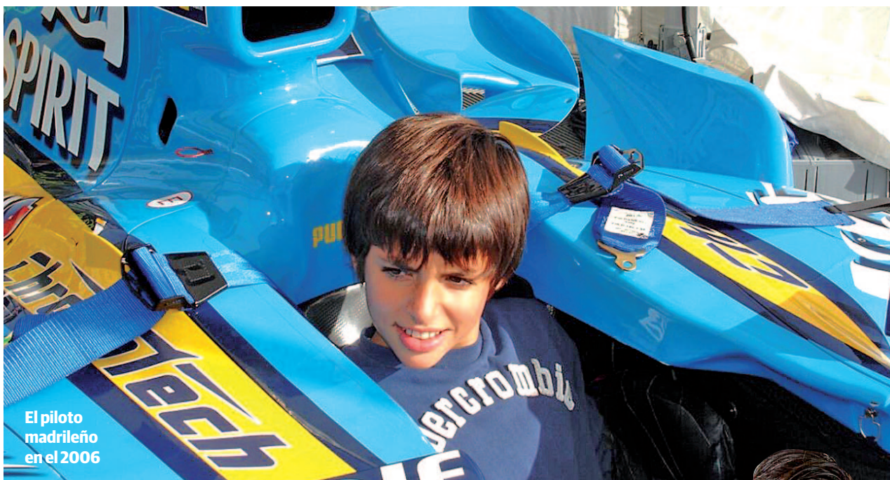
El piloto madrileño en el 2006