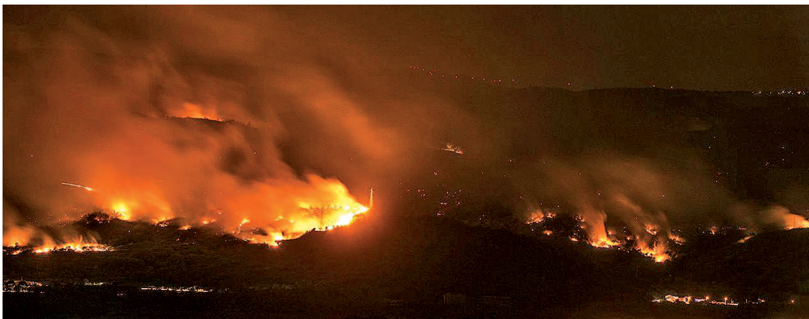
Los peores momentos se vivieron la noche del domingo al lunes