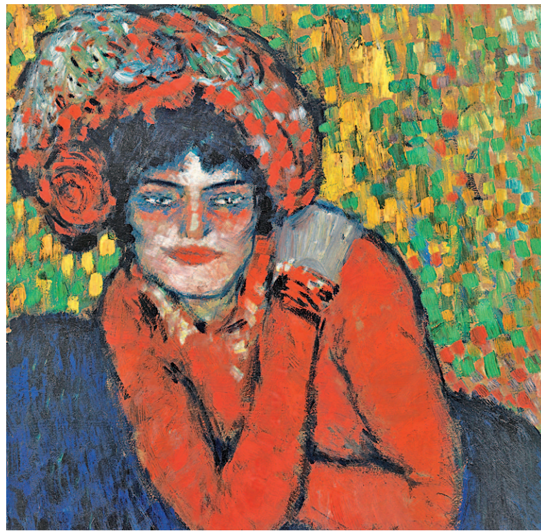
'En un reservado', de Toulouse Lautrec (izquierda), y 'La espera (Margot)', de Picasso (derecha)