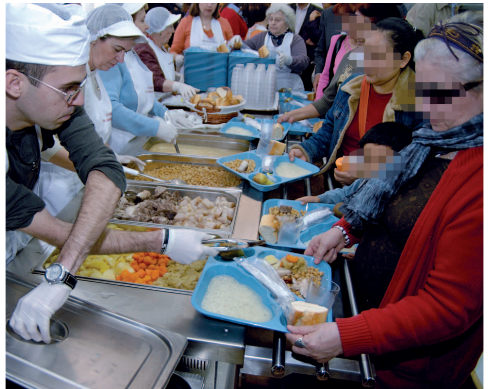
Un comedor social, el refugio para los españoles que sufren de pobreza GENTE

Por tanto, hay un total de 345.000 españoles menos en peligro de sufrir miseria, una evolución que la EAPN-ES ha calificado de “positiva”. En el conjunto de la Unión Europea, un 23% de la población (119 millones de individuos) vive de esta manera.