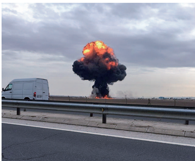
Imagen del accidente aéreo del pasado martes