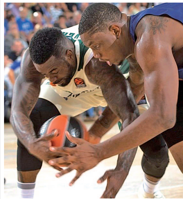
Seraphin, uno de los fichajes estrella del Barcelona

Cartagena, Formentera, Ponferradina y Lleida son los otros clubes de Segunda B, rivales de Sevilla, Athletic, Villarreal y Real Sociedad.