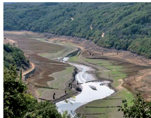
La ausencia de lluvias ha arruinado el cultivo del cereal

que ya antes del verano, en mayo, la Confederación Hidrográfica del Guadalquivir tuvo que tirar por primera vez de unos pozos de emergencia (construidos en los años noventa) para asistir los riegos en la Vega de Granada. Tras la ausencia continuada de lluvias, ahora en Granada han anunciado que podrían empezar a tirar de estos pozos también para dar de beber a la población ante las restricciones de agua.