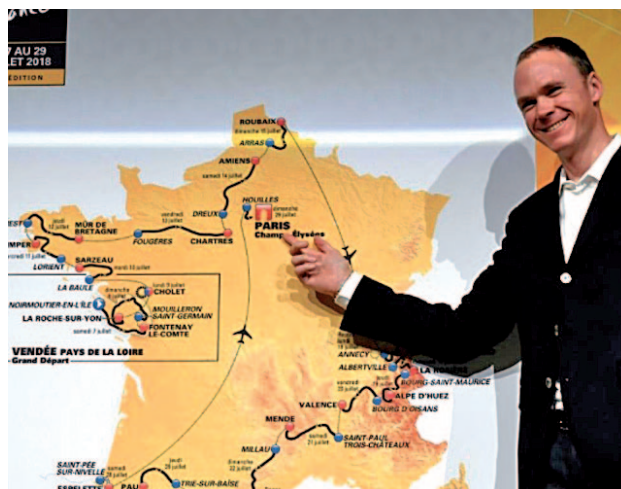
Momento de la presentación

La 'Grande Boucle' arrancará un poco más tarde de lo habitual, el 7 de julio, y probablemente se decidirá en una crono complicada de 31 kilómetros por el País Vasco francés el día 28.