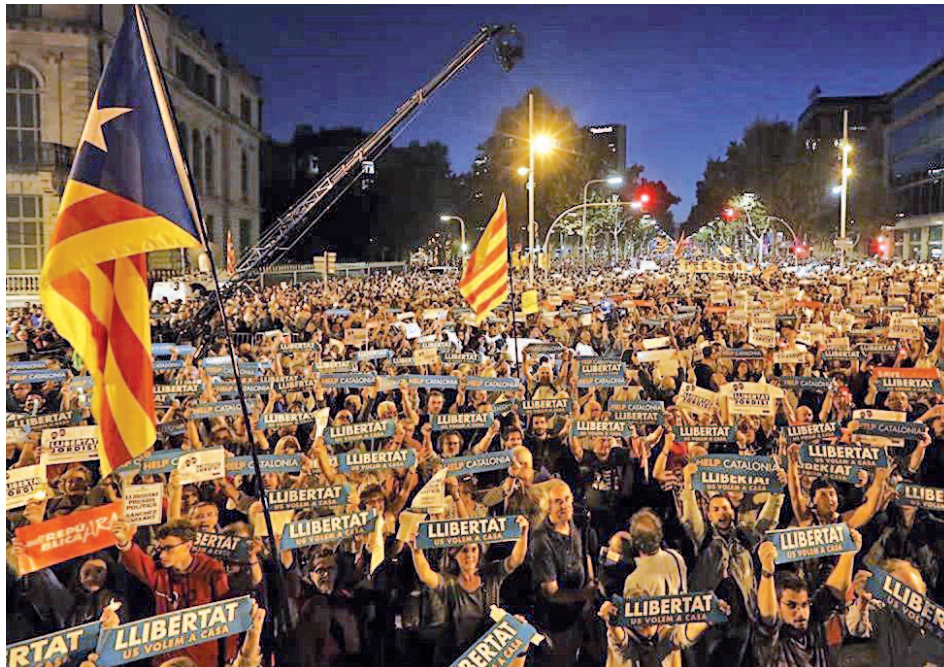
Manifestación en Barcelona pidiendo la libertad de los líderes de ANC y Òmnium

Sin embargo, estos activistas han entrado en prisión por un delito de sedición y no por su afiliación política. En concreto, la jueza de la Audiencia Nacional les inves-