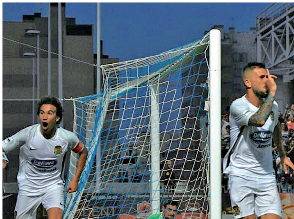
El Fuenlabrada sueña con emular al Alcorcón

EL ELCHE- ATLÉTICO PODRÍA SER UN PARTIDO ESPECIAL PARA SAÚL ÑIGUEZ