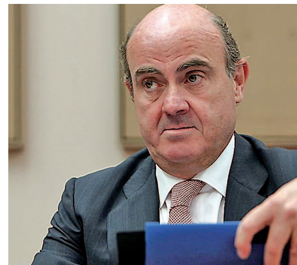
Luis de Guindos, ministro de Economía

Todos estos factores ya han repercutido en la actividad turística en Cataluña, que ha sufrido una caída del 15% en los últimos quince días, así como un descenso del 20% de las reservas, según advirtió la Alianza para la Excelencia Turística, Exceltur.