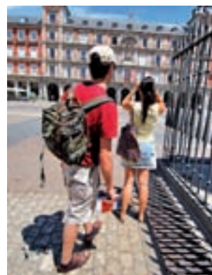
Turistas en Madrid

cional de Estadística (INE) ha dado a conocer esta semana, que también aseguran que el número de viajeros de la región aumentó en un 2,1%, llegando a la cifra récord de 1.079.542. El número de personas que visitó la Comunidad en los tres primeros trimestres del año se incremen-