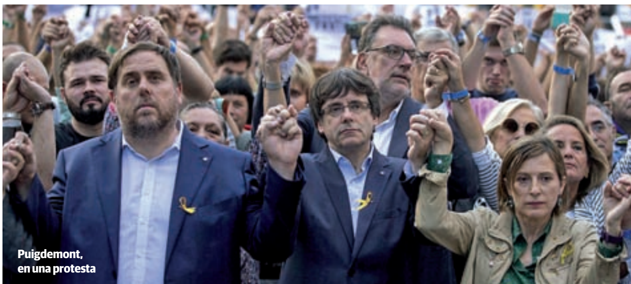
Puigdemont, en una protesta