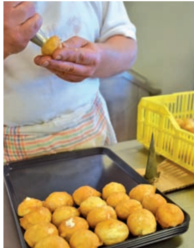
Proceso artesano: Agua, mantequilla, manteca de cerdo, harina, huevos, leche y sal. No tiene más secreto. Y todo ello, mezclado y removido a mano. Después de tantos años, los buñuelos siguen siendo los más preferidos por los consumidores.

Para comprobar cómo trabajan los obradores de las pastelerías madrileñas ante la demanda de estos productos que se espera para los próximos días, donde sin duda