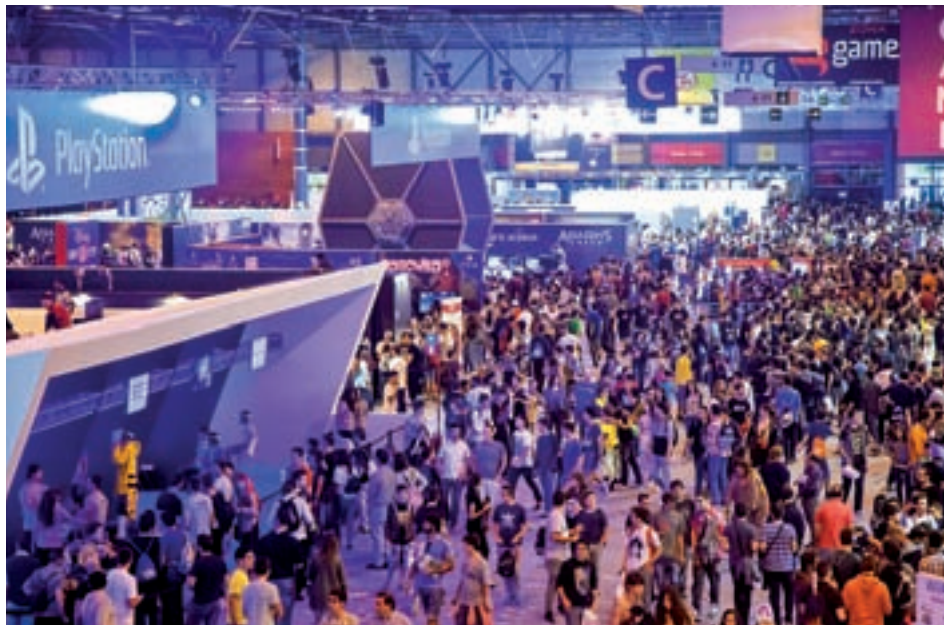
El salón Madrid Gaming Experience atrae a miles de apasionados

El salón de 8.000 metros cuadrados abrirá sus puertas del 27 al 29 de octubre y Mi-