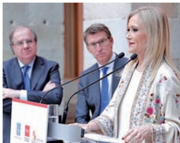
Herrera y Feijóo escuchan a Cifuentes

En particular, destacan "el interés común de la conexión del corredor Norte-Noroeste