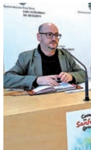
Presentación de la campaña

Coincidirá además con la acción 'Creemos en San Fernando', la Campaña de Navidad que, entre otras acciones, sorteará 3.000€ entre las personas que compren en los comercios adheridos a la campaña.