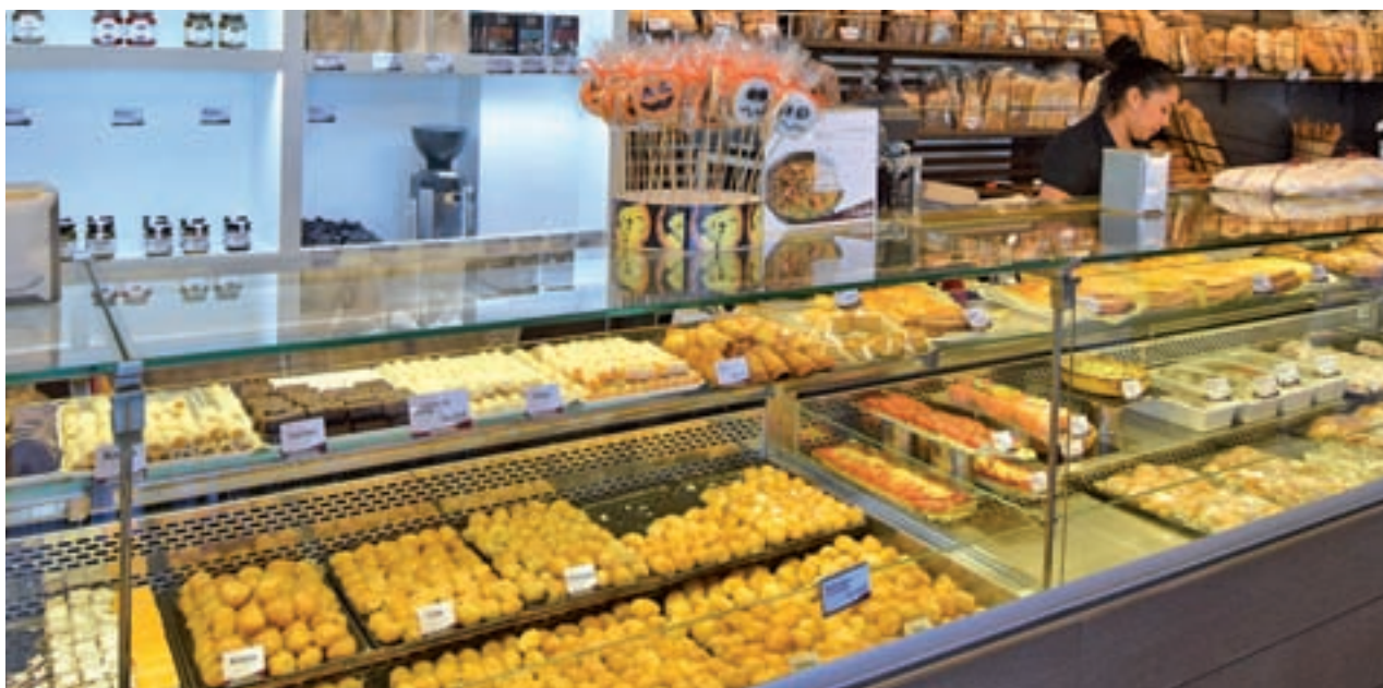
Batata, chocolate, café, nata o crema son los sabores que más se venden