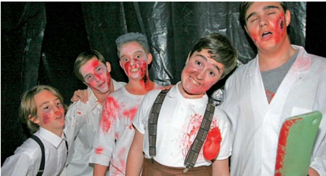
Pasajes de miedo se organizarán en diferentes municipios