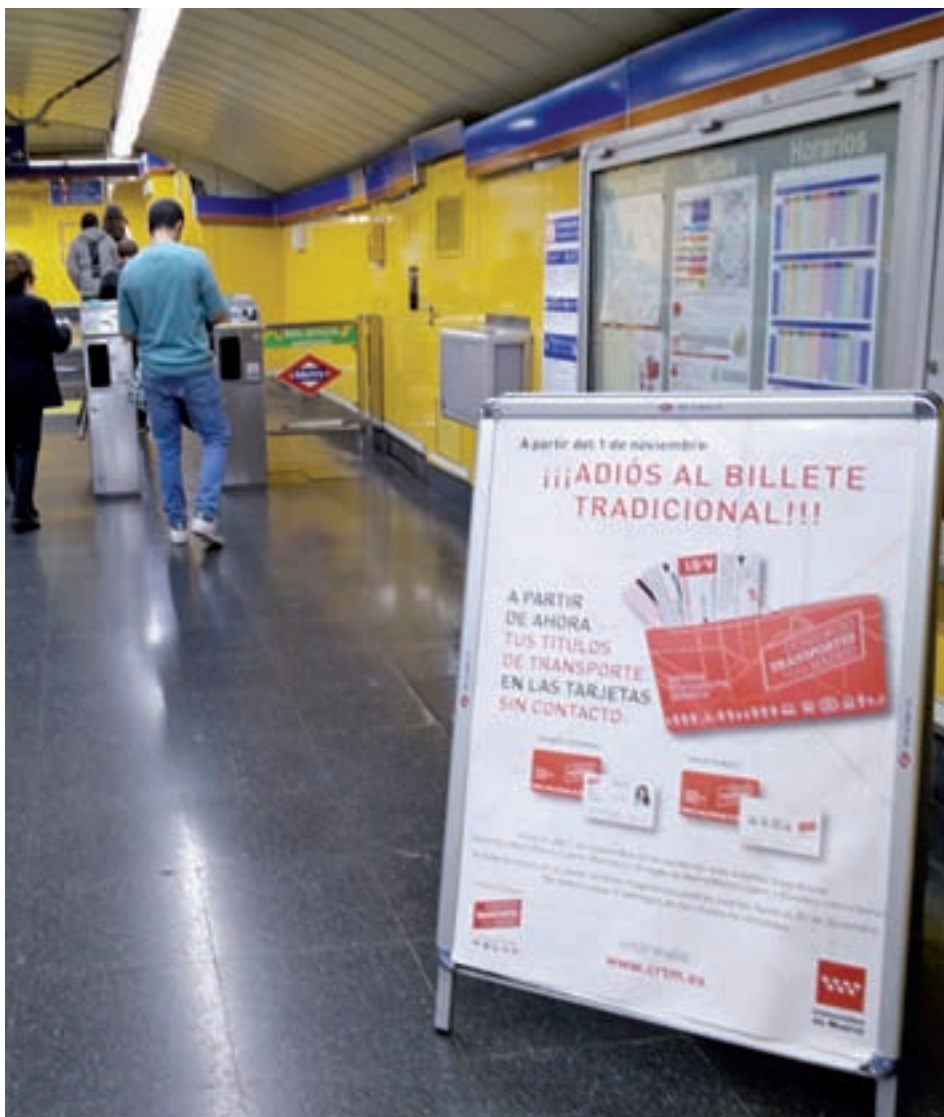
Cartel informativo en una estación de Metro

Los títulos magnéticos se podrán seguir usando hasta el 31 de diciembre ● A partir de entonces no se podrán canjear los viajes sobrantes ● Carteles en las estaciones y paneles luminosos alertan sobre el adiós de este soporte