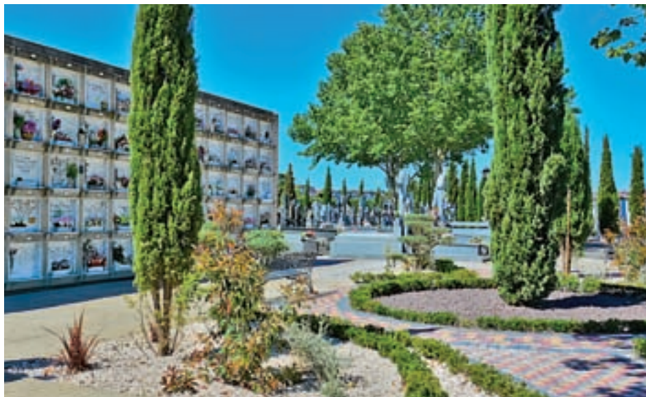
Cementerio de Torrejón de Ardoz

El próximo miércoles 1 de noviembre, los cementerios del Corredor del Henares, como los del resto de municipios de la región, serán punto de encuentro para aquellos vecinos que se acerquen a recordar a sus seres más queridos en esta fecha tan señalada. Y cuando lo hagan se encontrarán con mejoras, ya que son varios los municipios en los que se han llevado a cabo en los últimos meses o semanas diferentes actuaciones de