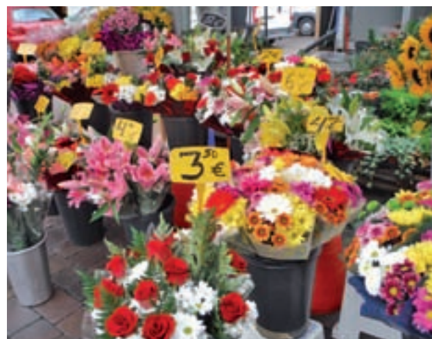
Los clientes optan por flores naturales

facturación total anual para muchas floristerías", explican desde la Asociación Española de Floristas (AEFI), que concretan que, en esta ocasión, esperan ventas similares a las que se registran cada año, 110 millones de euros.