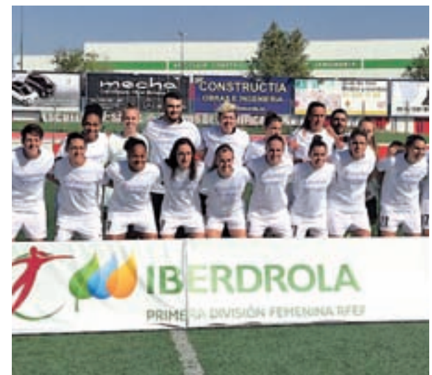
El equipo blanco sigue en la zona alta