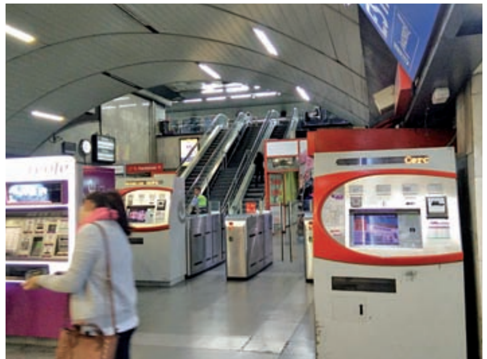
Escaleras mecánicas paradas en Méndez Álvaro

"En Atocha hay 10 personas en la parte de abajo y arriba