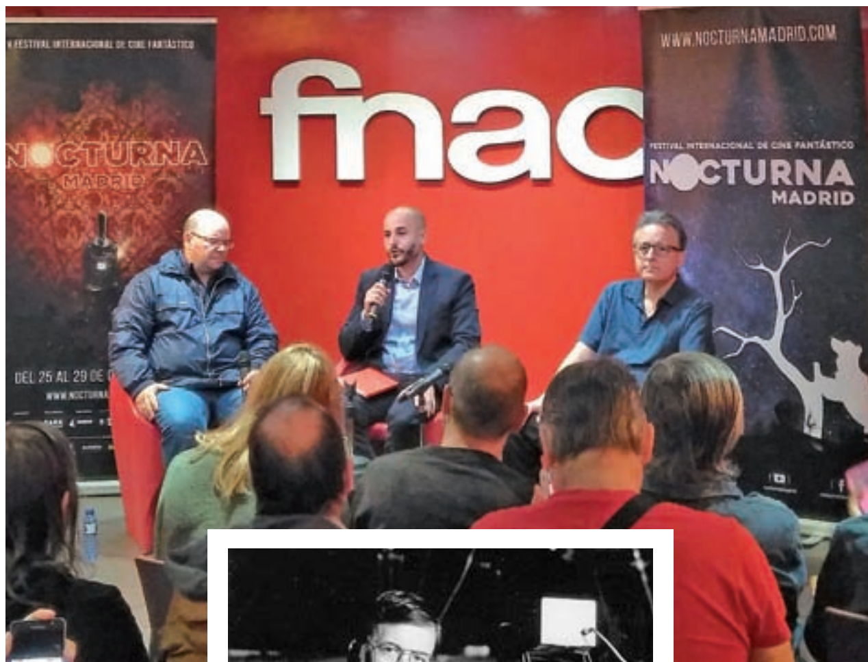
La presentación se llevó a cabo el pasado día 17 en la sede de Fnac Callao

Las sedes de esta quinta edición del festival son Cinesa Proyecciones (Fuencarral, 136) y Cine-teca Madrid (Plaza de Legazpi, 8), espacios que durante este fin de semana darán cabida a 21 títulos, entre cortos y largometrajes. El coste de las entradas es de 6 euros por película, aunque hay un abono de 50 euros con el que se permite el acceso al visionado de 10 obras. Se pueden adquirir en taquilla y en Cinesa.es.