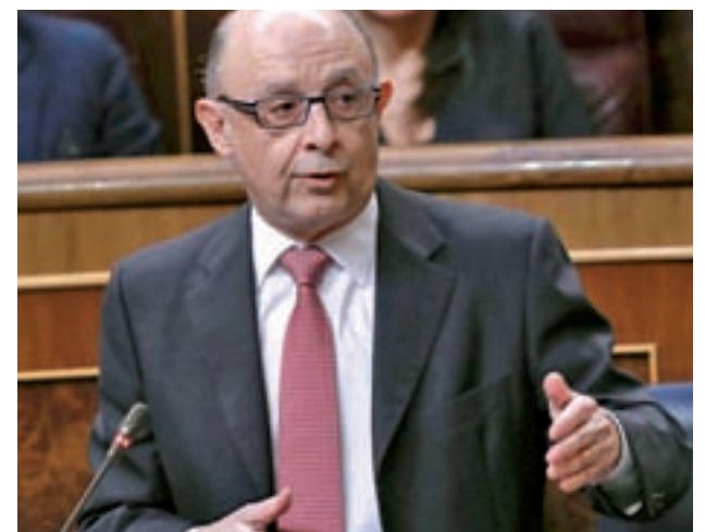
El ministro Cristóbal Montoro

Montoro lamentó esta postura de los socialistas y reiteró su invitación a negociar el proyecto.