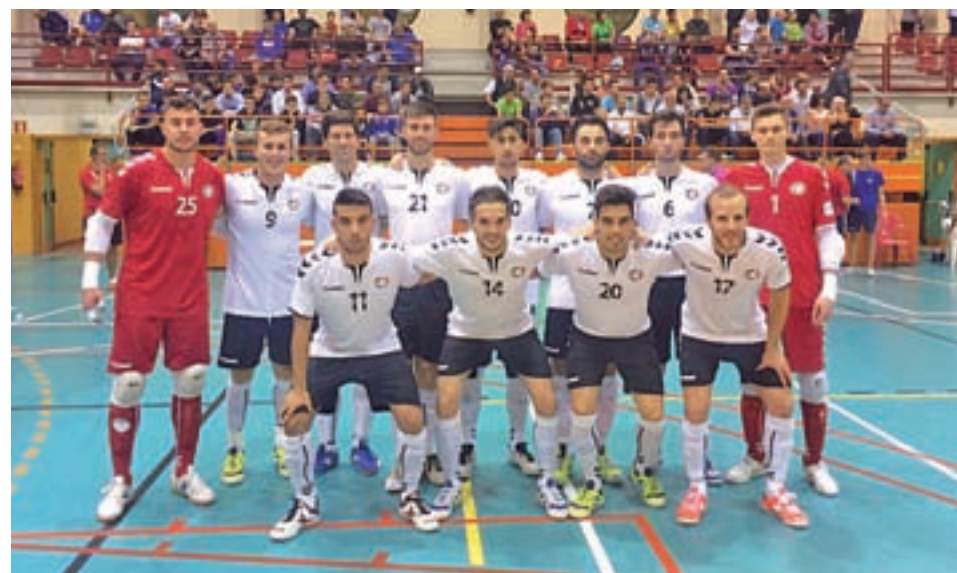
El Rivas dio la campanada eliminando al Catgas Energía, finalista en 2015