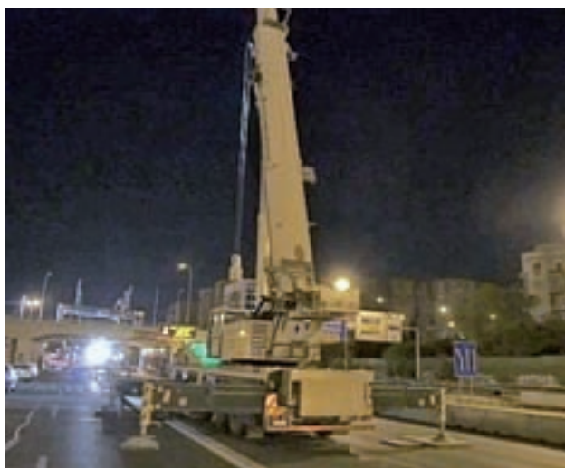
Obras en el puente de la avenida del Mediterráneo